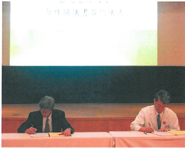
嘉藥與阮綜合醫院結盟，攜手育才。