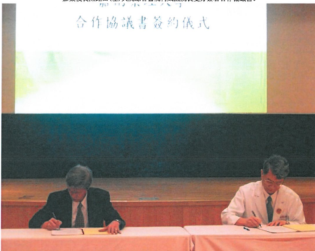
嘉藥與阮綜合醫院結盟，攜手育才。