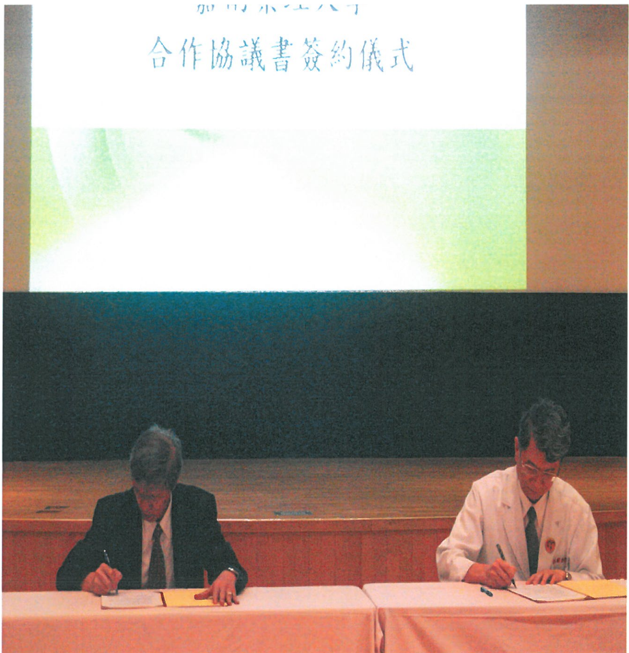
嘉藥與阮綜合醫院結盟，攜手育才。