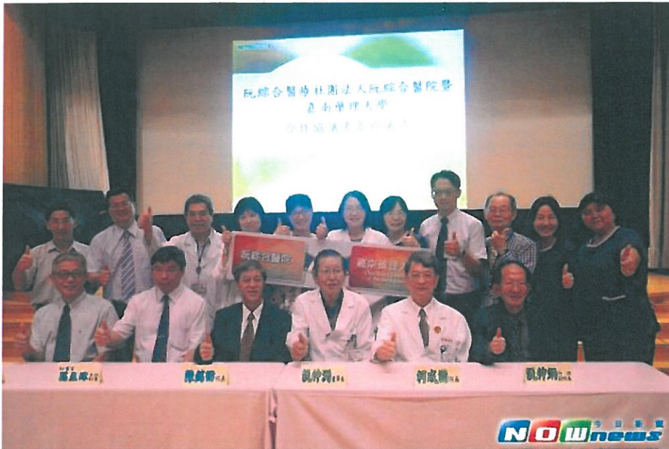
▲嘉南藥理大學今日上午與高雄阮綜合醫院