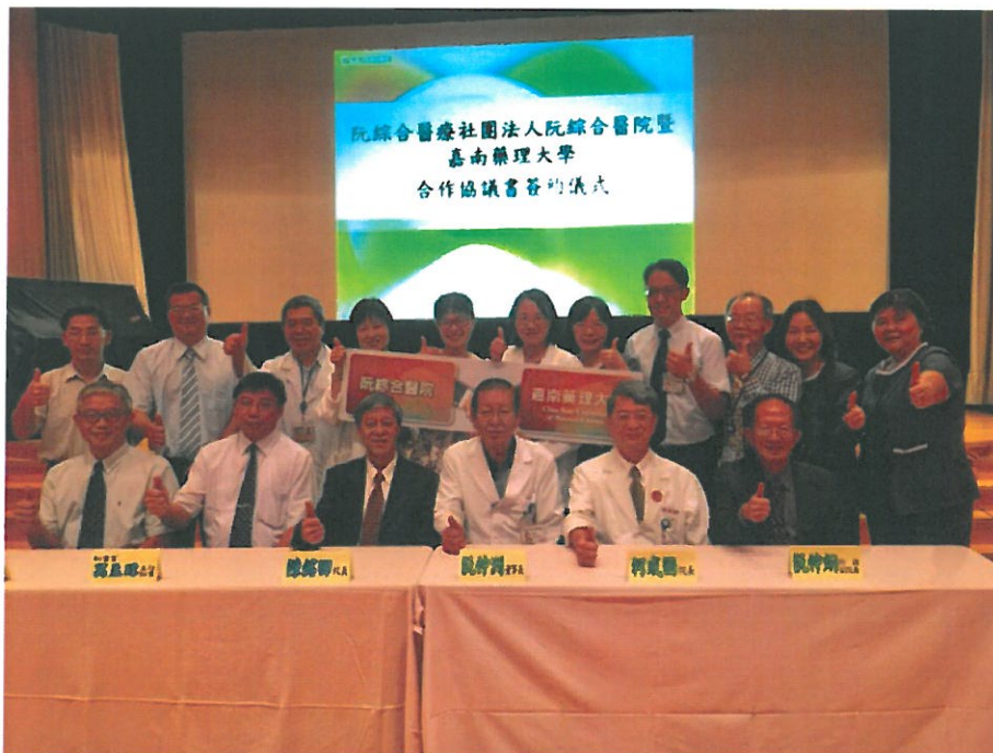
嘉南藥理大學與高雄阮綜合醫院簽訂合作協議書。