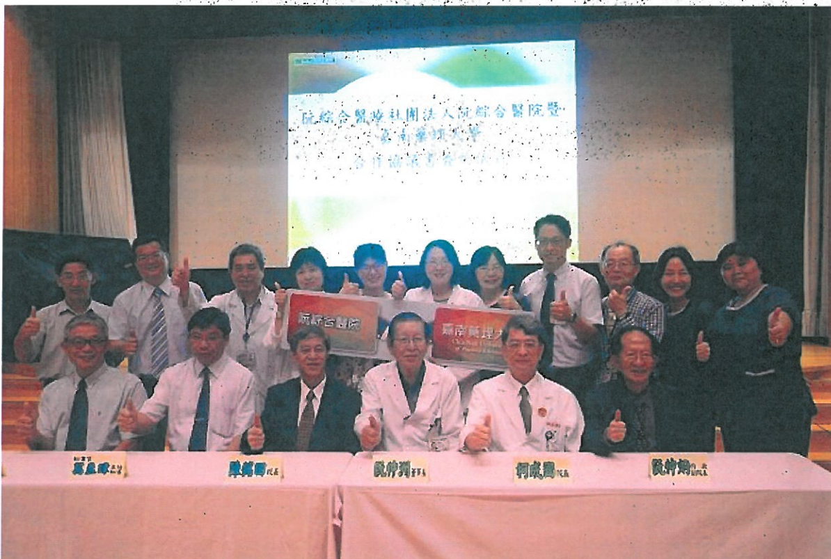
嘉南藥理大學與高雄阮綜合醫院簽訂合作協議書後合影。

【記者陳懷恩台南報導】嘉南藥理大學以培育藥師搖籃著稱，繼日前與多家醫療院所及連鎖藥局結盟後，6月26日上午再與高雄阮綜合醫院簽訂合作協議書，雙方就未來推動教學研究和實習就業達成共識，期盼有效共享資源，攜手培育人才，共創雙贏。