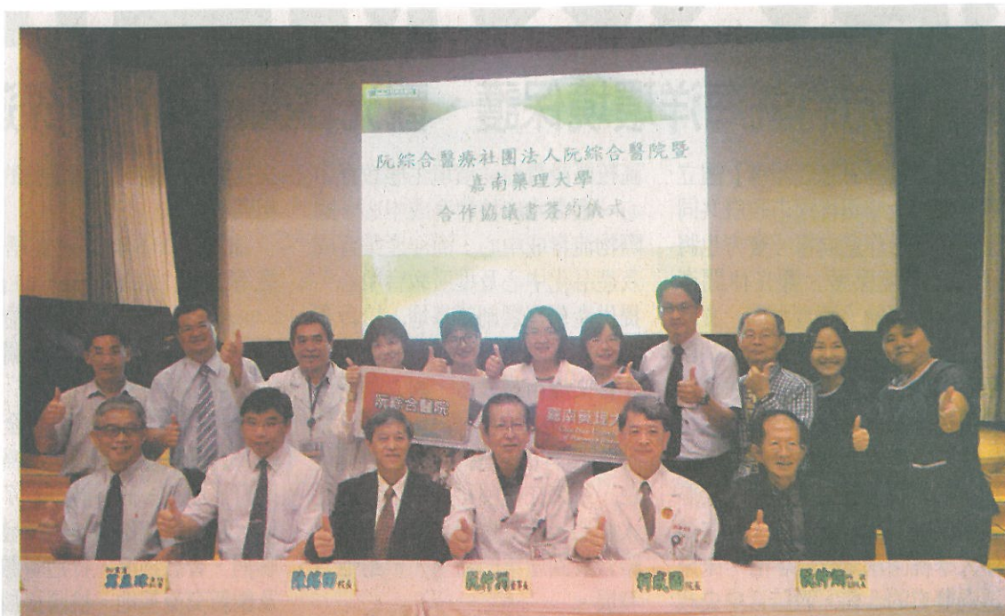
嘉南藥理大學與與高雄阮綜合醫院簽訂合作協議書後合影。