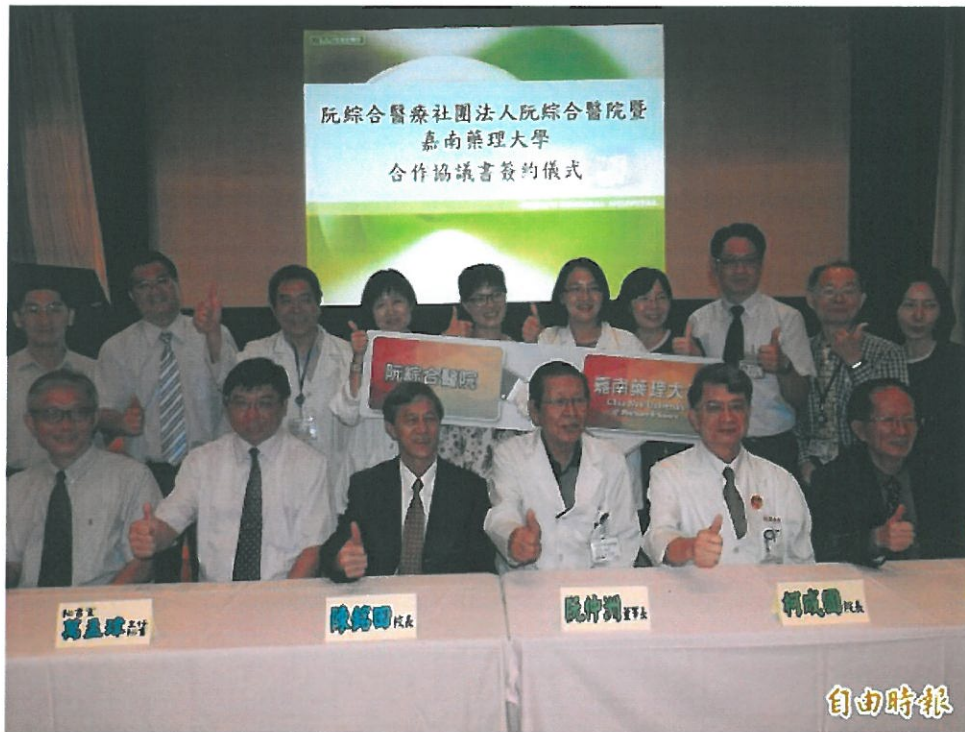
高雄阮綜合醫院今與嘉南藥理大學簽訂合作協議書。(記者方志賢攝)