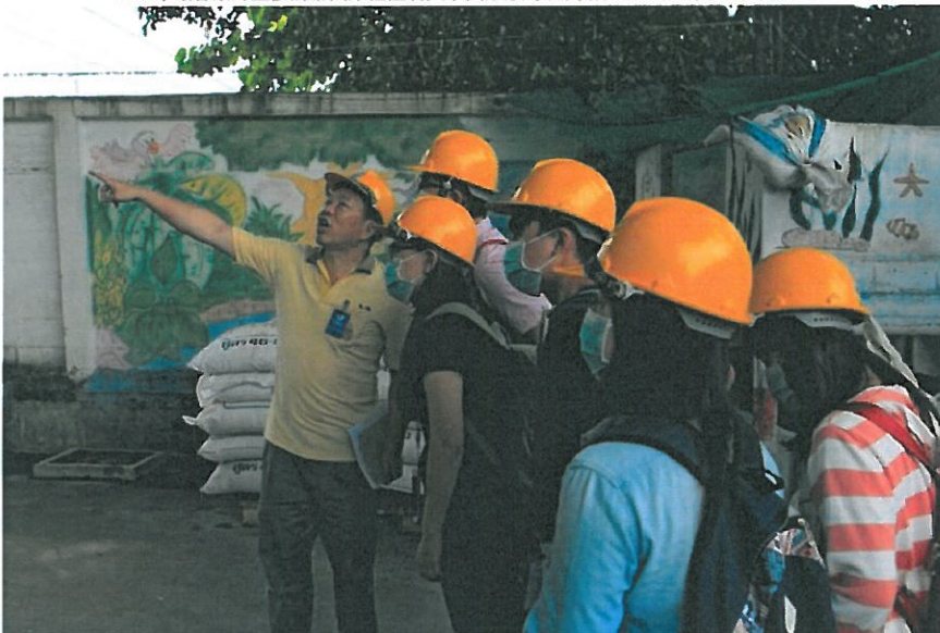
2016年環管系實習生至湄南紙廠學習企業環境管理系統。

為開拓大學生國際視野，並提升專業與外語能力，教育部推動「學海築夢」海外實習計畫，今年首次將新南向元素導入，鼓勵並補助各校選送學生至東南亞實習。台南的嘉南藥理大學環境資源管理系，在東南亞深耕多年，與東協各國著名廠商及大學關係密切，且早已實施海外實習制，成效頗佳，因此獲得此次新南向學海築夢計畫全國首批受補助單位，將於8月選派學生至泰國企業實習。