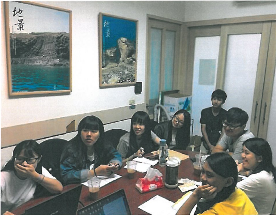
教部推新南向學海築夢 嘉藥環管系生赴泰企業實習

(中央社訊息服務20170728 10:20:48)為開拓大學生國際視野，並提升專業與外語能力，教育部推動「學海築夢」海外實習計畫，今年首次將新南向元素導入，鼓勵並補助各校選送學生至東南亞實習。台南的嘉南藥理大學環境資源管理系，在東南亞深耕多年，與東協各國著名廠商及大學關係密切，且早已實施海外實習制，成效頗佳，因此獲得此次新南向學海築夢計畫全國首批受補助單位，將於8月選派學生至泰國企業實習。