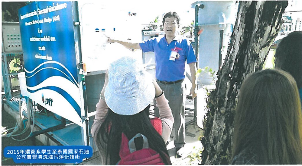
2015年環管系學生至泰國國家石油公司實習清洗油污淨化技術