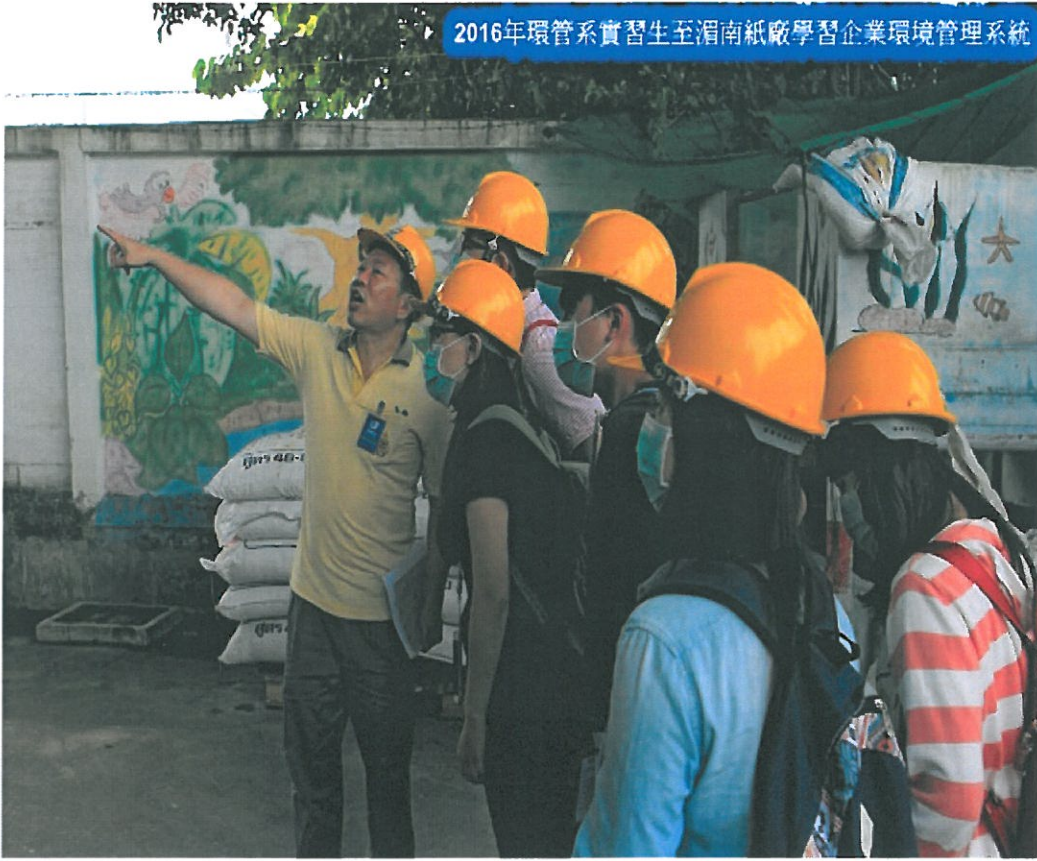
2016年環管系實習生至湄南紙廠學習企業環境管理系統