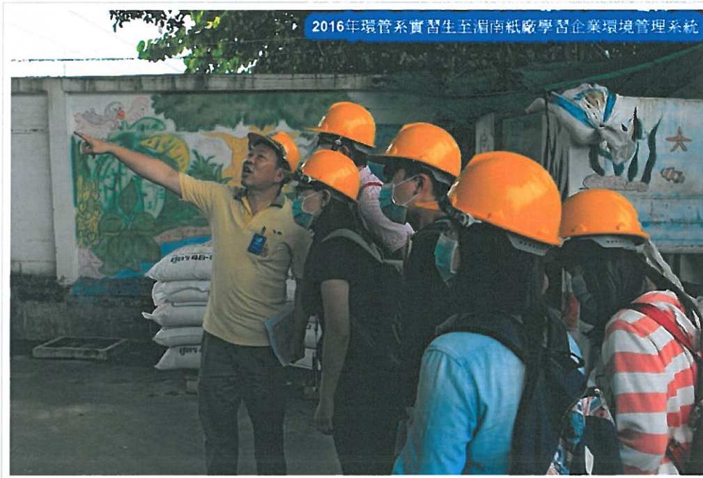
2016年環管系實習生至湖南紙廠學習企業環境管理系統