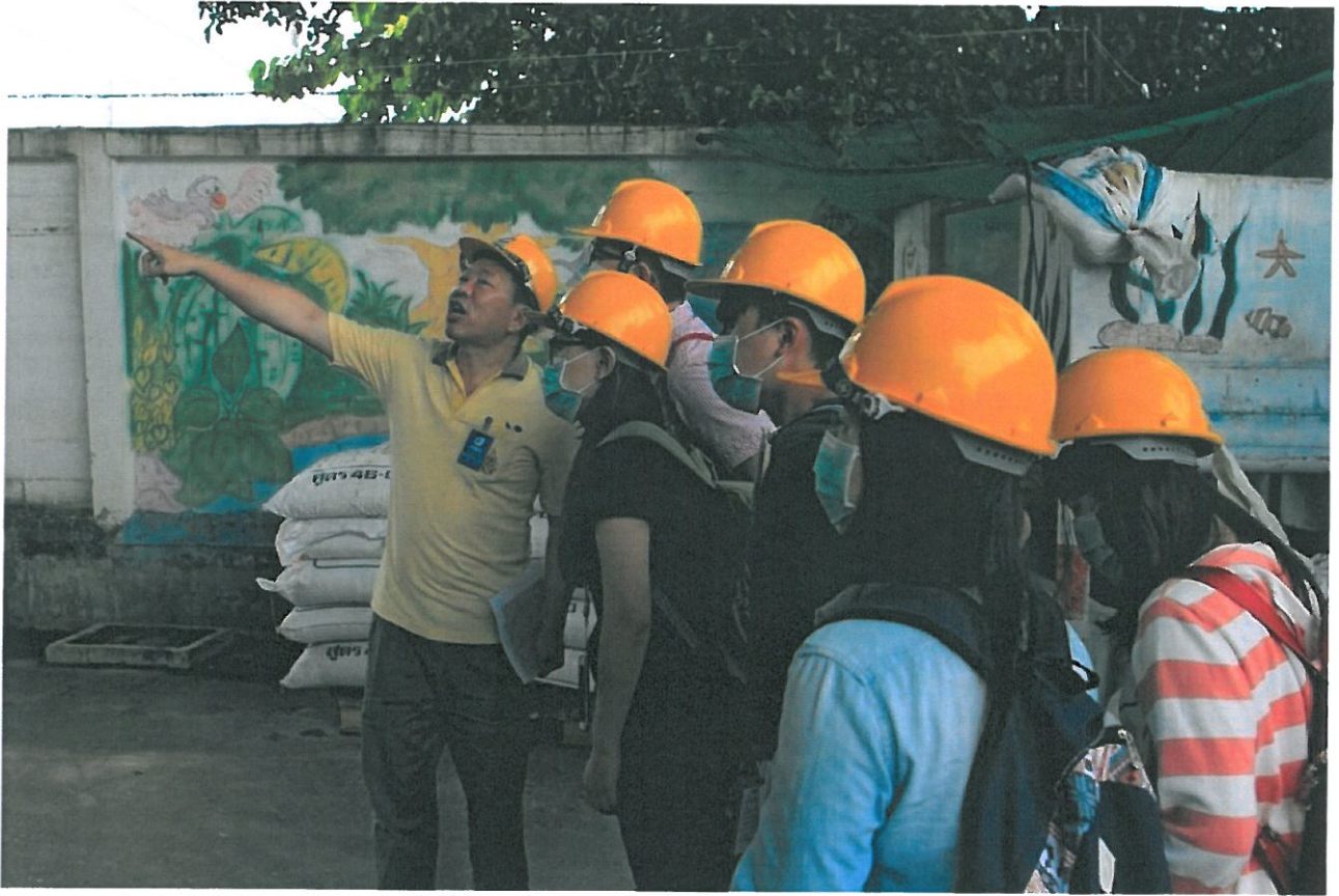
台南嘉南藥理大學環境資源管理系8月將選派學生，在當地不銹鋼廚具界龍頭的Seagull公司，展開為期一個月的實習，協助該公司改善工廠環保問題。

Seagull公司、湄南紙廠與泰國絲紡織公司實習，在實踐綠色產業服務及交流，深獲肯定，學生增廣知能更是助益甚大。