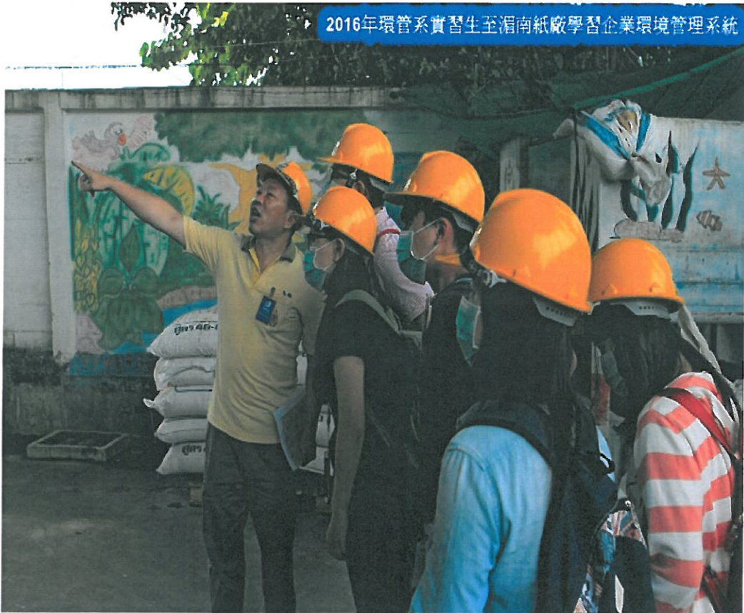
2016年環管系實習生至湄南紙廠學習企業環境管理系統