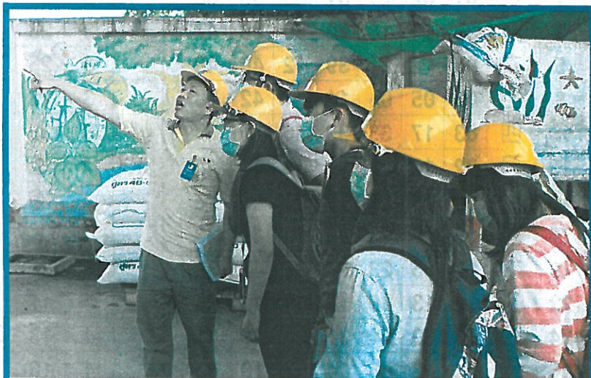
↑ 教部推新南向學海築夢，嘉藥環管系生赴泰實習！

陳意銘主任指出，以泰國為例，知名的朱拉隆功大學、蒙庫國王科技大學、泰國農業大學等國立大學皆為嘉藥的姊妹校；而在企業實習方面，二〇一五年安排五位學生參訪 Seagull 公司及泰國國家石油公司。