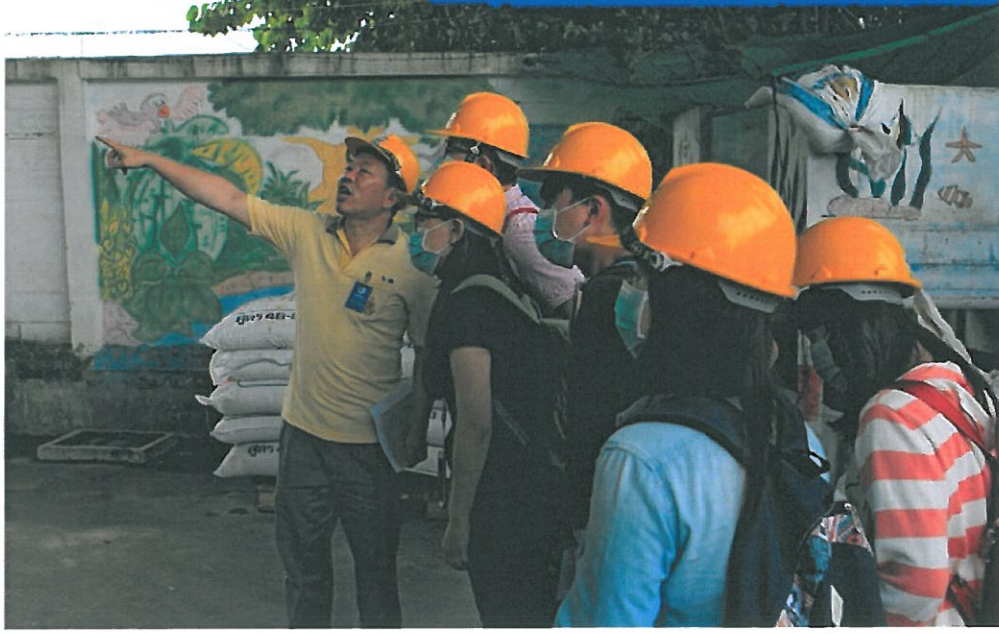
2016年環管系實習生至湄南紙廠學習企業環境管理系統