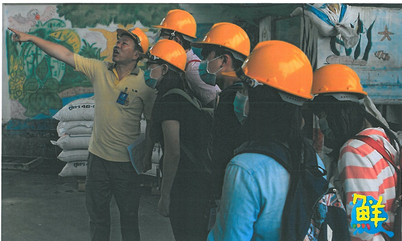
泰國朱拉隆功大學、蒙庫國王科技大學、泰國農業大學等國立大學與嘉南藥大結盟姊妹校，2015年安排5名學生參訪Seagull及泰國國家石油兩企業，深入曼谷華倫坡社區整治運河水質與底泥採樣檢測分析，2016年6名學生獲選赴泰Seagull、湄南紙廠、泰國絲紡織實習，體現綠色產業服務交流，擴展國際視野。圖 / 嘉南藥大提供、文 / 高培德