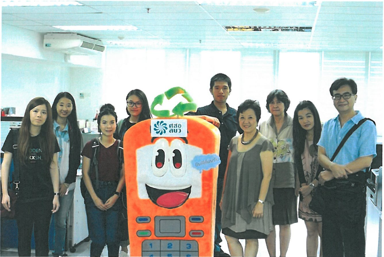
台南嘉南藥理大學環境資源管理系8月將選派學生，在當地不銹鋼廚具界龍頭的Seagull公司，展開為期一個月的實習，協助該公司改善工廠環保問題。