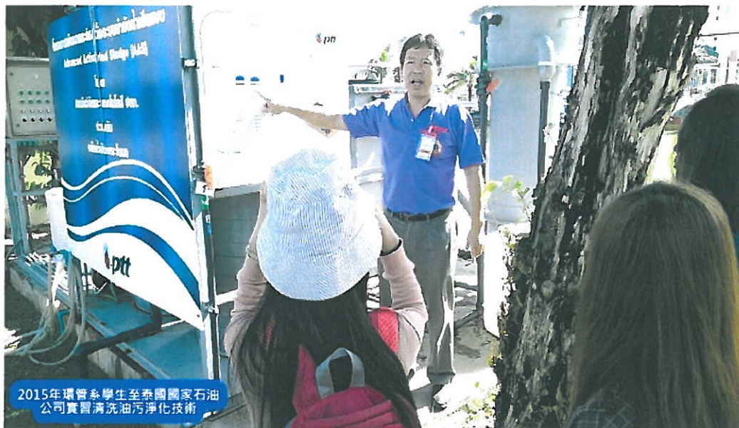
2015年環管系學生至泰國國家石油公司實習清洗油污淨化技術