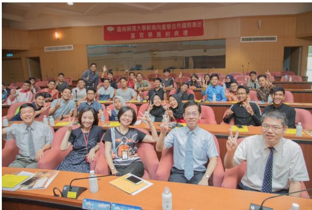
嘉藥師長熱情歡迎印尼新生入學。