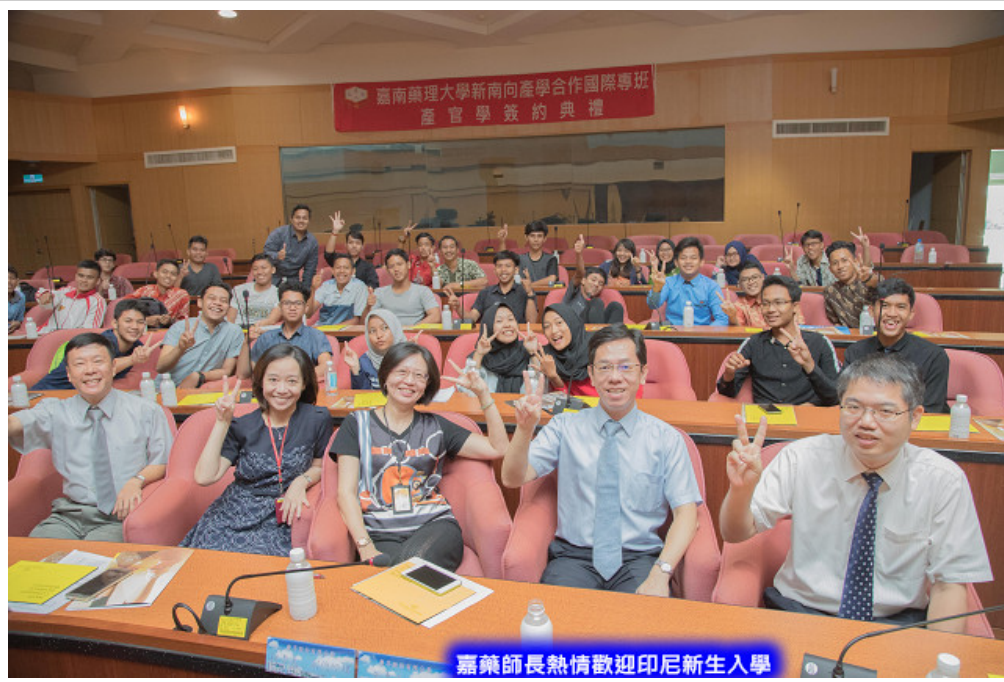
嘉藥師長熱情歡迎印尼新生入學