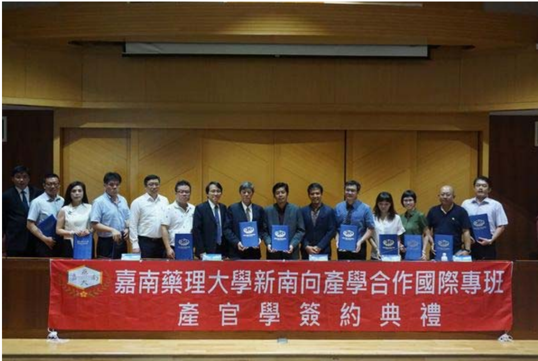
嘉藥獲教育部核定開設資訊管理國際專班，昨舉行「新南向產學合作國際專班產官學簽約典禮」。

【記者陳懷恩台南報導】嘉南藥理大學配合新南向教育政策，新學年度獲教育部核定開設資訊管理國際專班，6日上午由嘉藥、印尼官方及台灣合作廠商三方代表共同簽署合作備忘錄，印尼籍新生也聯袂出席，歡喜迎接未來四年在台的留學生活。