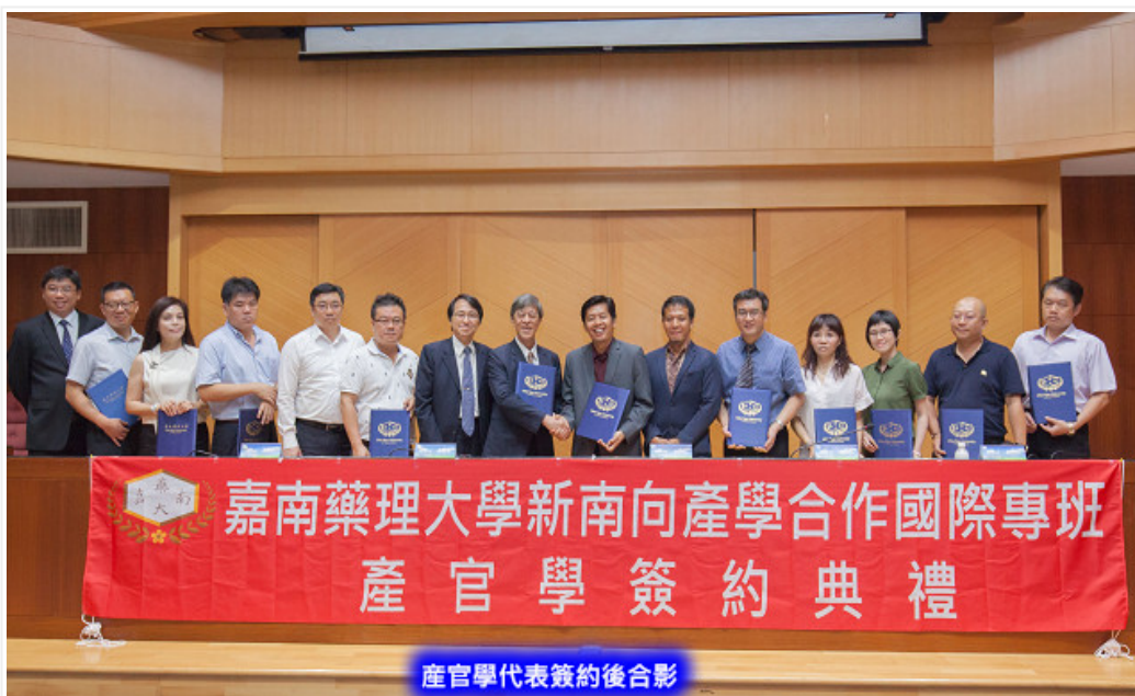
產官學代表簽約後合影

【記者于郁金/臺南報導】這學校新學年將很有「印尼風」！臺南的嘉南藥理大學配合新南向教育政策，本學年度獲教育部核定開設資訊管理國際專班，總計招收120名印尼應屆高中畢業生來台就讀學士學位；9月6日上午，在該校國際會議廳舉行「新南向產學合作國際專班產官學簽約典禮」，由嘉藥、印尼官方及臺灣合作廠商三方代表共同簽署合作備忘錄，印尼籍新生也聯袂出席，歡喜迎接未來四年在台的留學生活。