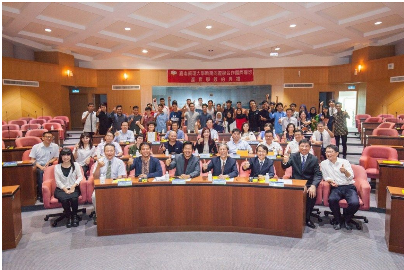
與會人員與印尼留學生開心合影。