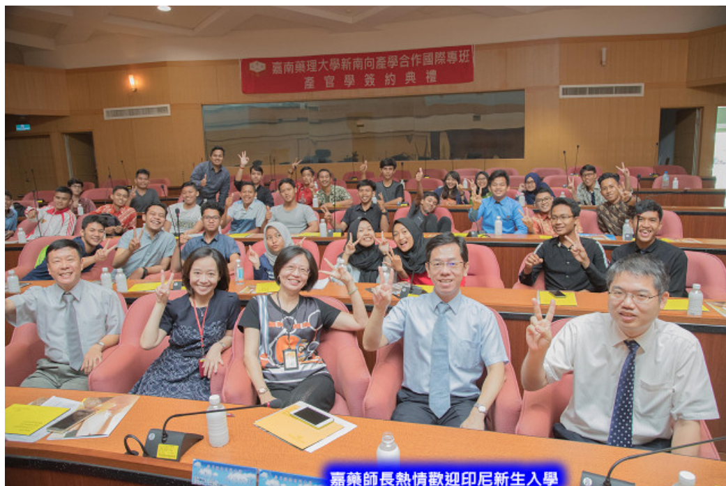
嘉藥師長熱情歡迎印尼新生入學