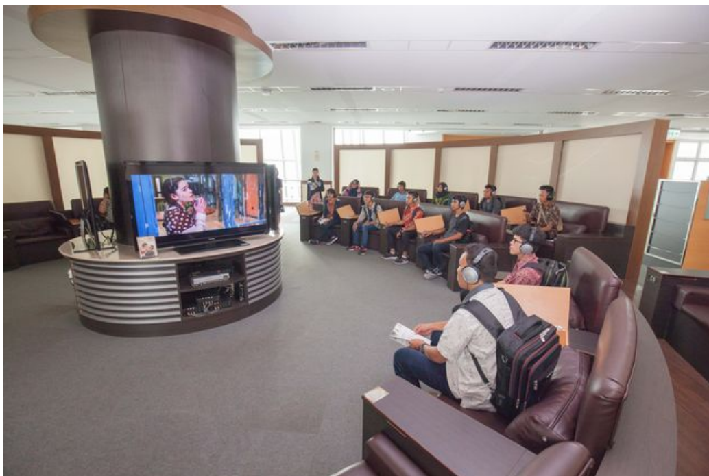
印尼新生參觀嘉藥圖書館視聽中心。

這學校新學年將很有「印尼風」！台南的嘉南藥理大學配合新南向教育政策，本學年度獲教育部核定開設資訊管理國際專班，總計招收120名印尼應屆高中畢業生來台就讀學士學位。9月6日上午，在該校國際會議廳舉行「新南向產學合作國際專班產官學簽約典禮」，由嘉藥、印尼官方及台灣合作廠商三方代表共同簽署合作備忘錄，印尼籍新生也聯袂出席，歡喜迎接未來四年在台的留學生活。