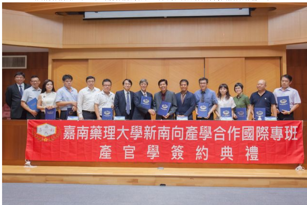
產官學代表簽約後合影。