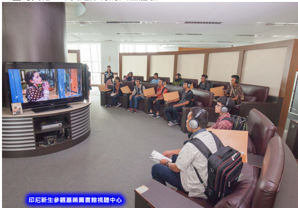
印尼新生參觀嘉藥圖書館視聽中心

即將在台就學的印尼新生，顯得非常興奮充滿期待，甫抵台的其中一位印尼生說，很高興能來臺灣留學，這裡的人親切友善，而且在嘉藥不僅可學到專業知識技能，也可以學習中文並認識臺灣文化，確實是難得的人生體驗。