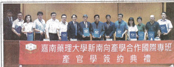
嘉藥獲教育部核定開設資訊管理國際專班，昨舉行「新南向產學合作國際專班產官學簽約典禮」。