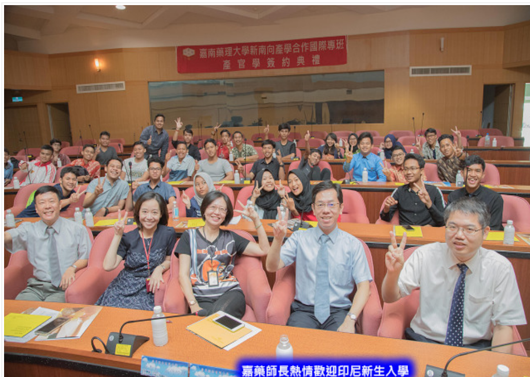
嘉藥師長熱情歡迎印尼新生入學