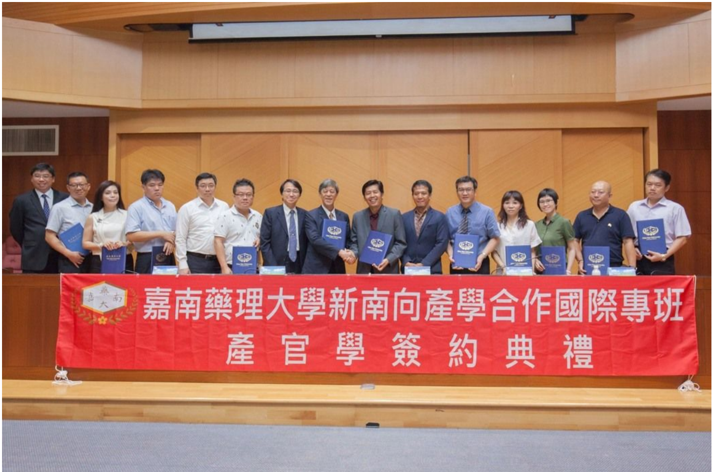
產官學代表簽約後合影。