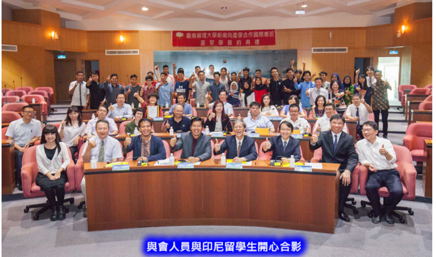
與會人員與印尼留學生開心合影