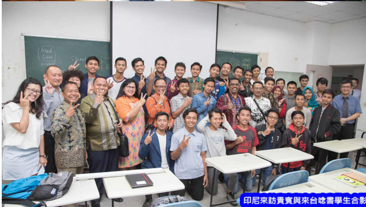
印尼來訪貴賓與來台唸書學生合影