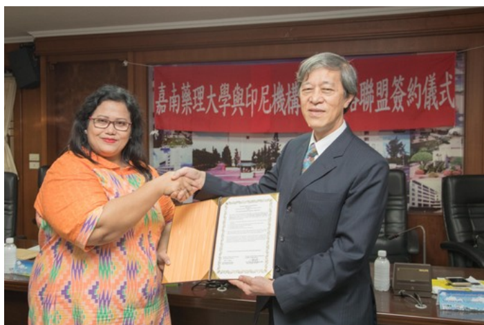
嘉藥與印尼教育訪問團與嘉藥簽訂合作備忘錄(左為雅加達市 Mutiara Indonesia Education Foundation 董事長，棉蘭市 Mutiara Indonesia School 校長)