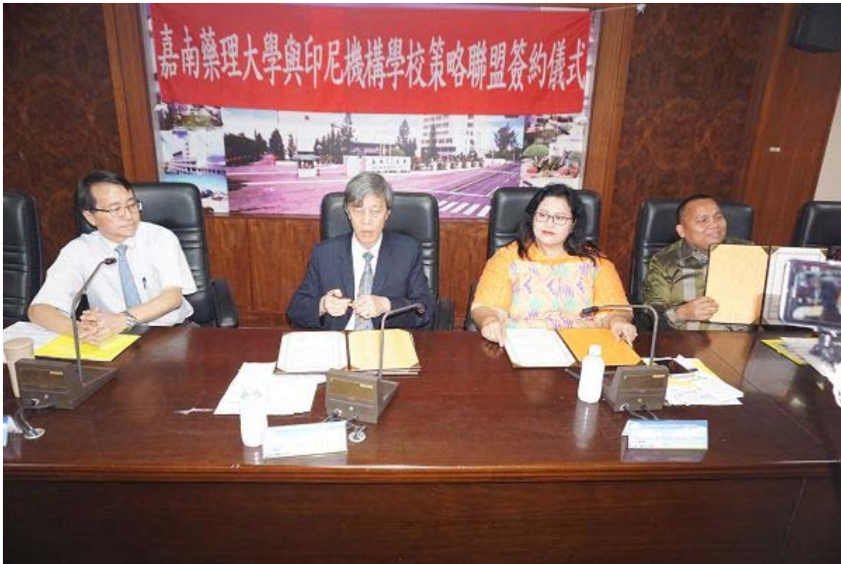
嘉南藥理大學與印尼教育代表團簽訂教育合作備忘錄。

【記者陳懷恩台南報導】嘉南藥理大學資訊管理系產學合作國際專班106學年度秋季班，已招收印尼115名印尼大一新生，教育成效佳，18日上午11時印尼4省聯合教育代表團也慕名前來，雙方簽訂合作備忘錄，為明年應用外語系、資訊管理系產學國際專班鋪路。