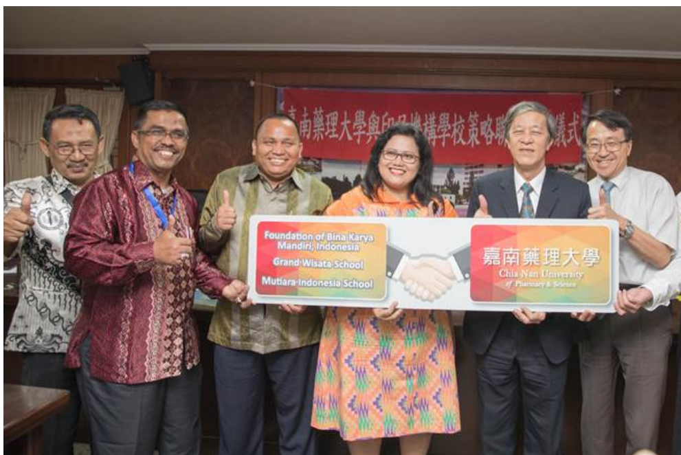
配合政府新南向，嘉藥與印尼教育團合作。

為使訪賓對嘉南藥理大學校園有更深層的認識，校方也安排了學校的重點導覽，包含資訊管理系、圖書館、文化藝術館，展現嘉藥科技與人文、藝術並重豐厚涵養。