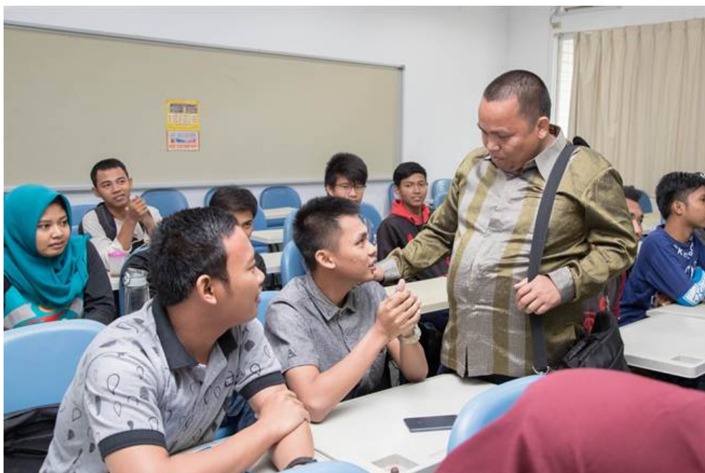
印尼西爪哇省井里汶市Grand Wisata School校長關心國際專班學生來台上課情況。