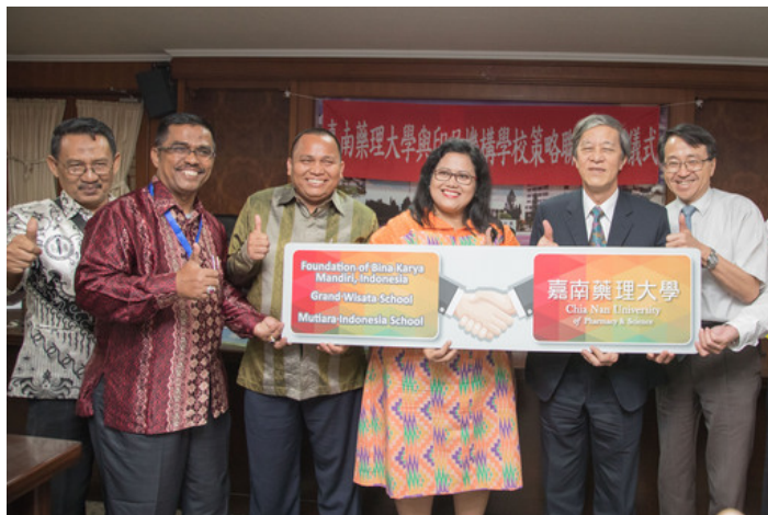
配合政府新南向，嘉藥與印尼教育團合作