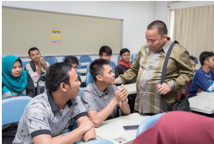
印尼西爪哇省井里汶市Grand Wisata School 校長 關心國際專班學生來台上課情況