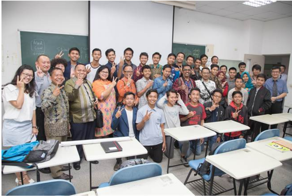
印尼來訪貴賓與來台唸書學生合影。

嘉南藥理大學積極配合新南向政策，資訊管理系產學合作國際專班106學年度秋季班已招收印尼一百多名名印尼大一新生，教育成效甚獲肯定，印尼雅加達市、棉蘭市、萬隆市、西爪哇省聯合教育代表團也慕名前來，雙方於昨日簽訂合作備忘錄，為明年應用外語系、資訊管理系產學國際專班鋪路。