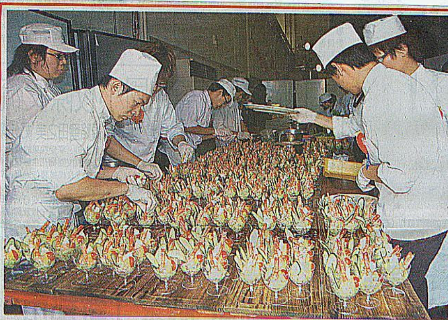
畢業班同學親手調理菜餚上菜。