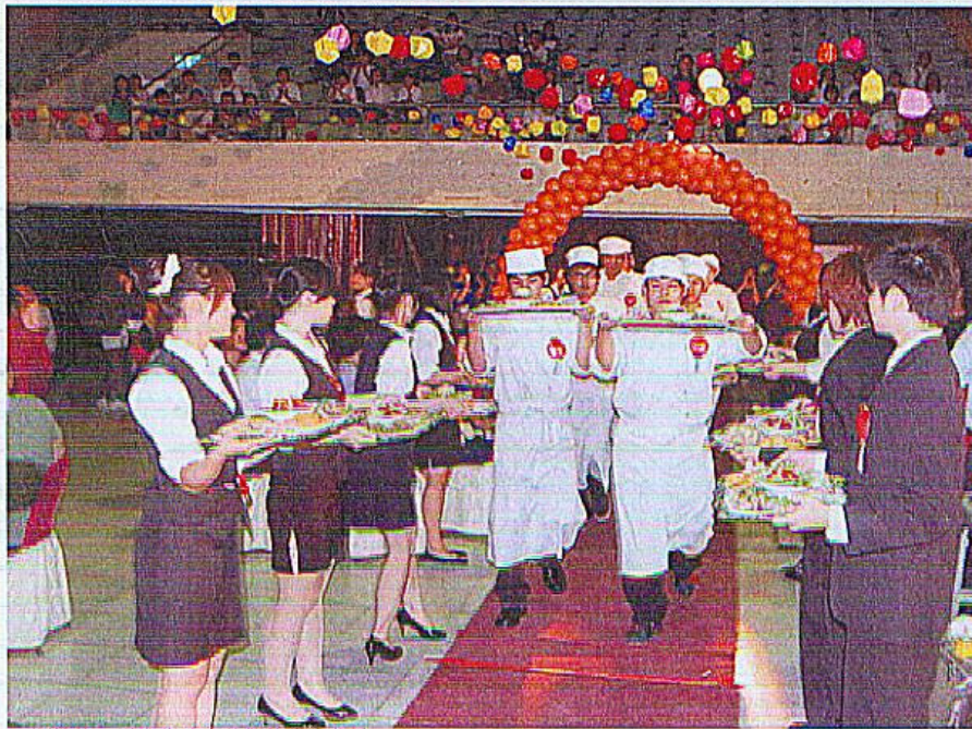
▲開筵後，畢業生演出壯觀的「出菜秀」。