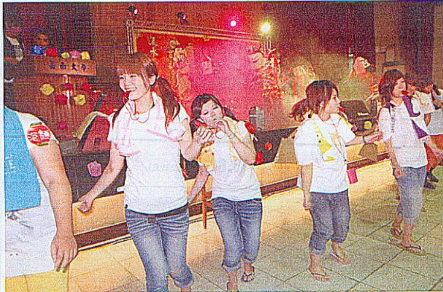
▲台上熱舞，台下的學生踴躍也瘋狂！