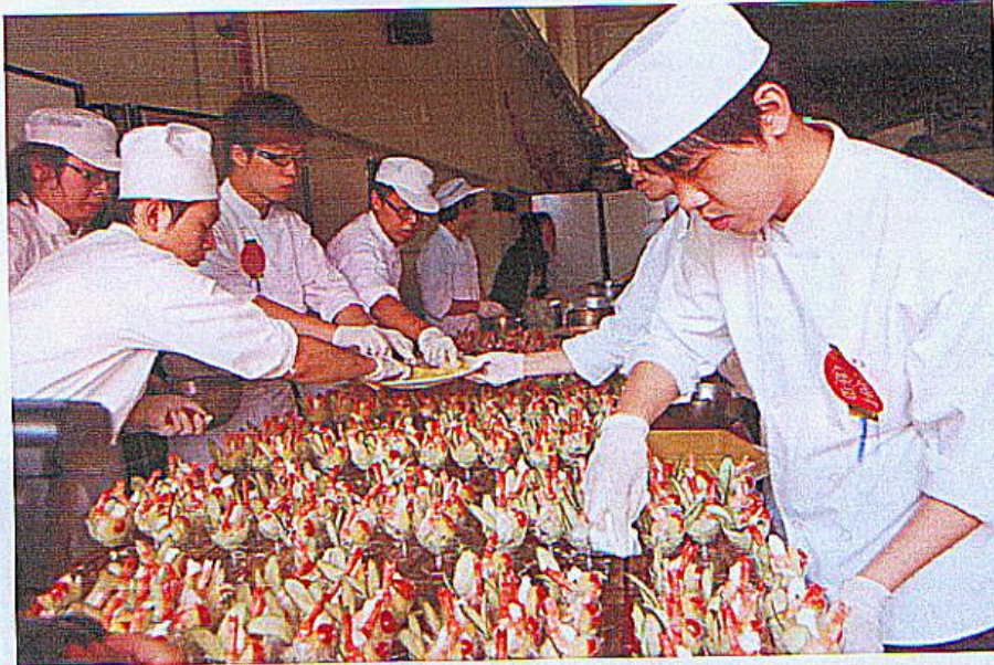
▲同學親自料理佳節饗客。