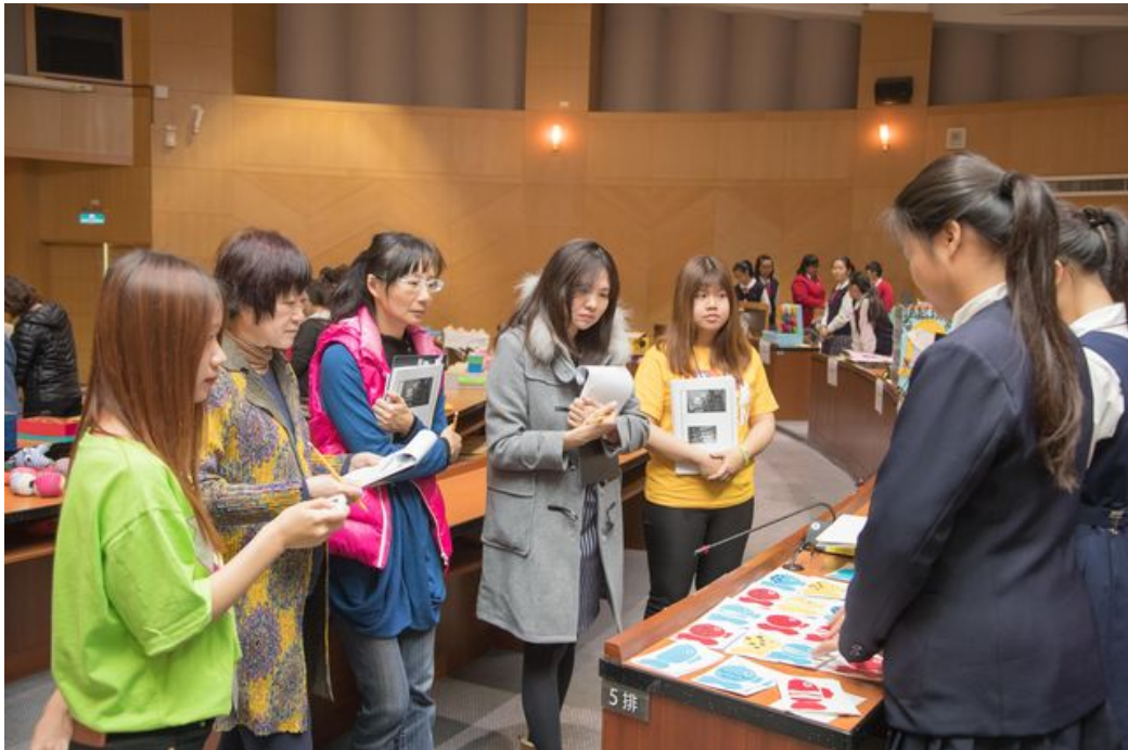
評審們至各組評分，同學使出全力介紹作品。

嘉南藥理大學嬰幼兒保育系舉辦「2017全國兒童教玩具競賽暨應用研習活動」，共有來自全國高中職、大專生的115件進入複賽，12月22日(五)現場展示評選，同學們拿出精緻手作教玩具，或展示，或操作，組組說唱俱佳，競爭相當激烈。