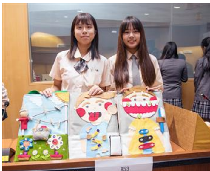
高中職組第一名由三民家商生活自理樣樣行獲得