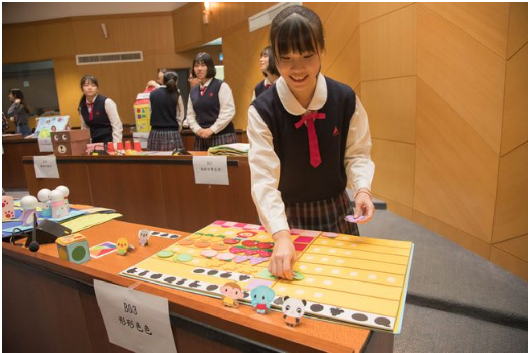
參加學員比賽前的準備。