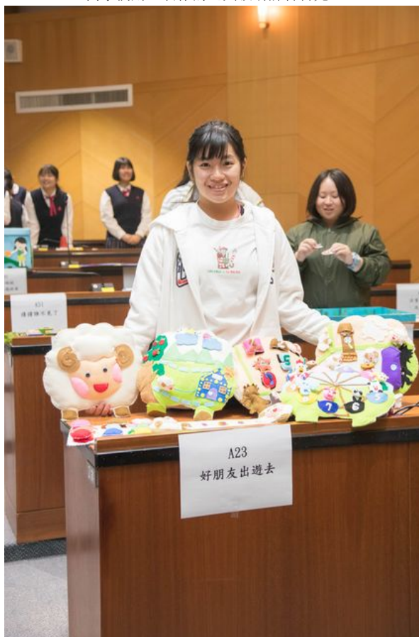
利用教具讓小朋友在遊戲中學習認識顏色形狀。