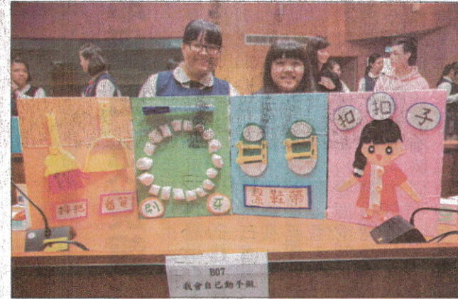
↑ 參加全國兒童教玩具競賽的選手展現所長並介紹各自作品。

記者林偉民／仁德報導 嘉南藥理大學嬰幼兒保育系昨天舉辦「全國兒童教玩具競賽暨應用研習活動」，共有來自全國高中職、大專生的一百十五件作品進入複賽，昨天進行現場展示評選，選手們紛紛展現精緻手作教、玩具，或展示或操作，各組選手說唱俱佳，爭取評審青睞，競爭相當激烈。 幼保系指出，系上每年都舉辦全國兒童教玩具競賽暨應用研習活動，目的在激勵高中職和大專學生，運用平日所學，以設計製作具備「原創性」、「實用性」及「教育性」的兒童教玩具，透過競賽的觀摩交流與主題研習，提升學生實務專題能力，目前已是全國知名的教玩具競賽。