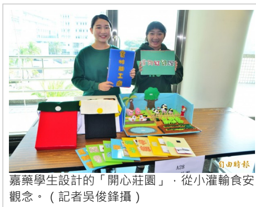
嘉藥學生設計的「開心莊園」，從小灌輸食安觀念。

嘉藥主辦的全國兒童教玩具競賽暨應用研習活動，今年邁入第9屆，來自各縣市的高中職、大專生等參加，初選通過的115件作品今天齊聚，各組選手全力展演，爭取佳績。