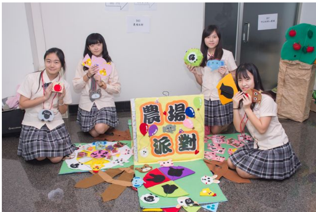
同學們用心製作的遊具吸引評審目光。

http://www.cdnews.com.tw 2017-12-22 19:04:58