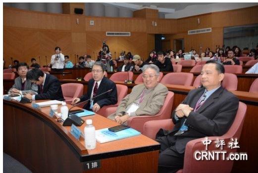
南台灣多位學者參與論壇研討。

中評社台南12月25日電（記者 趙家麟）“兩岸社會文化認同變遷論壇學術研討會”25日在嘉南藥理大學登場，全天有12篇論文發表，主題含蓋兩岸政治、文化社會、教育與人才、能源發展等議題，也是南台灣兩岸關係發展研究學者專家的一次大匯集。