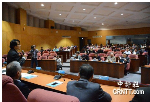
兩岸社會文化認同變遷論壇學術研討會現場。