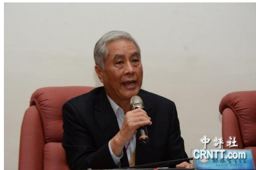
陸軍退役少將鄭旗生。