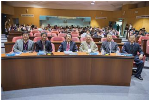
嘉藥舉辦「兩岸社會文化認同變遷論壇」吸引眾多學者參加