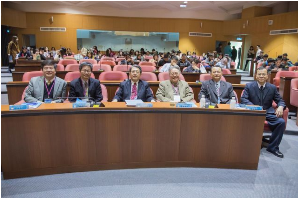
嘉藥舉辦「兩岸社會文化認同變遷論壇」吸引眾多學者參加。

http://www.cdnews.com.tw 2017-12-25 22:07:18