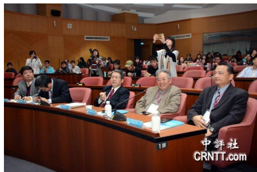
兩岸社會文化認同變遷論壇學術研討會在嘉南藥理大學舉辦現場。

中評社台南12月25日電（記者 趙家麟）成功大學政治經濟學研究所教授丁仁方25日表示，2018年會是兩岸關係大動盪的一年，其中，選舉年有新版公投法，將是最大的變數。