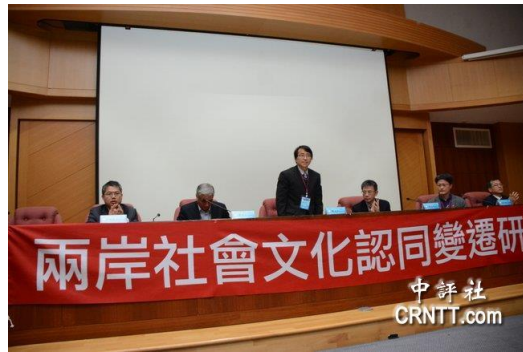
兩岸社會文化認同變遷論壇學術研討會25日在嘉南藥理大學登場。