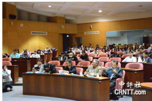
兩岸社會文化認同變遷論壇學術研討會現場。