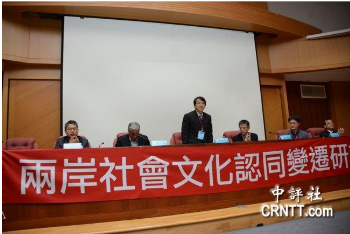
兩岸社會文化認同變遷論壇學術研討會25日在嘉南藥理大學登場。

http://www.CRNTT.com 2017-12-25 12:58:47