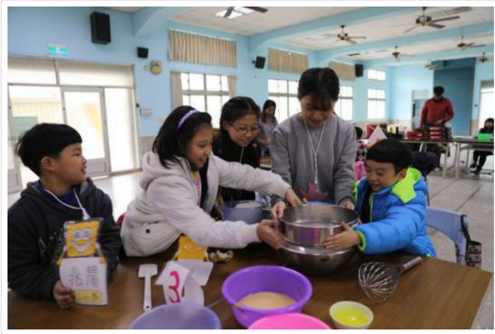
孩童開心手作養樂多雞蛋糕。