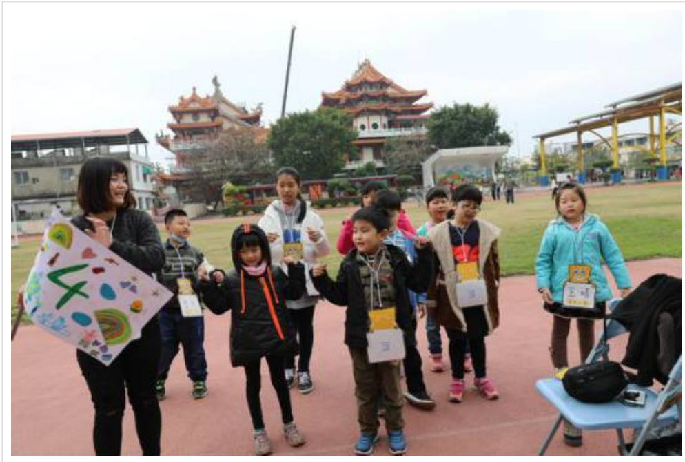
小隊輔的帶領下練習隊呼。