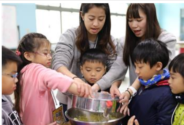
孩童開心與大姊姊們一同手做鳳梨酥