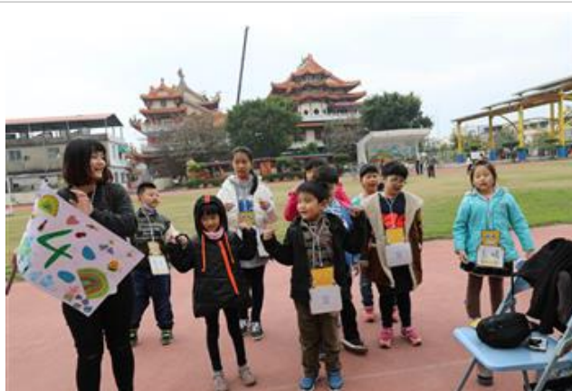
小隊輔的帶領下練習隊呼