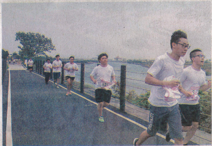
兩百多位嘉南藥大學生參加「跑愈久，捐愈多」路跑。

首次規畫全程12公里路跑，而參加學生每完成1公里，學生會即捐出5元給花蓮震災專戶。