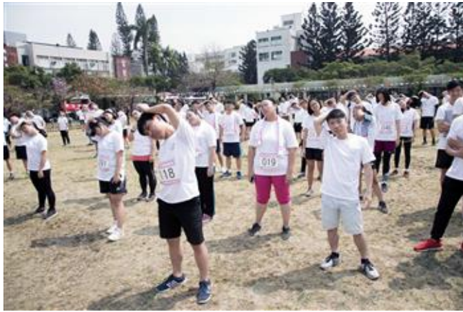
參加路跑學生在校做暖身操