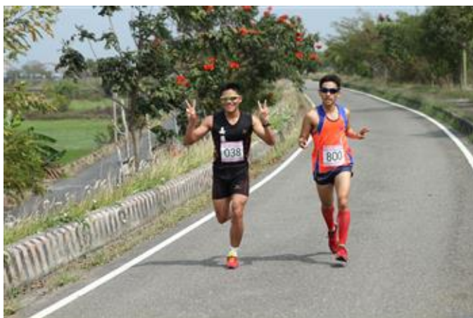
嘉藥辦理健康路跑做愛心