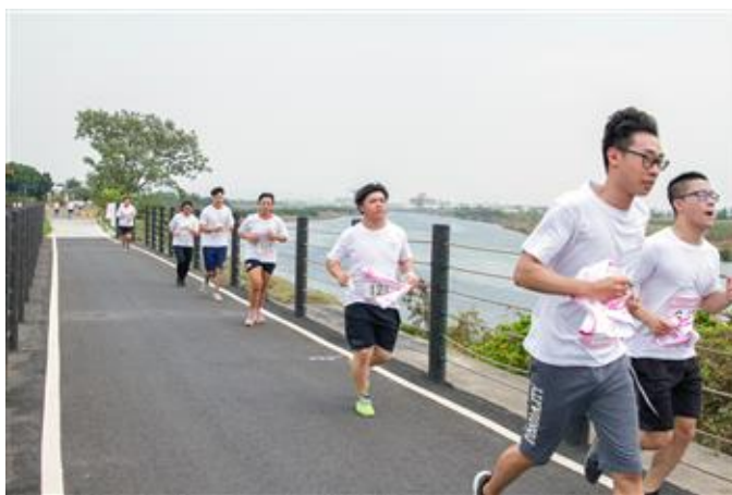
學生路跑路線行經二仁溪河畔