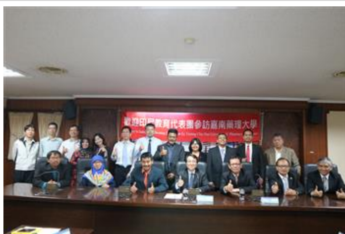
印尼教育團前往嘉藥參觀，對嘉藥辦學成效讚譽有加