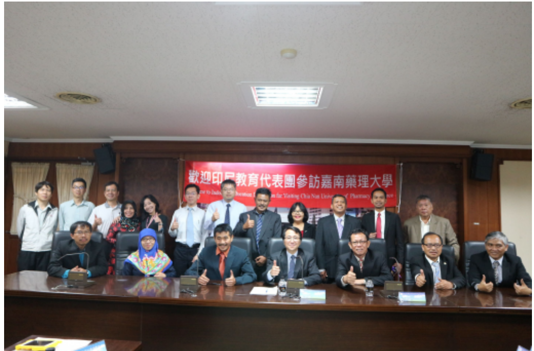
印尼教育團前往嘉藥參觀，對嘉藥辦學成效讚譽有加。

嘉南藥理大學努力推廣南向政策，吸引印尼中爪哇地區的教育官員一行十一人專程造訪嘉藥，了解印尼專班學生的學習狀況，對嘉藥資訊管理系教學、資訊多媒體應用系的虛擬實境教學設備讚譽有加，並表示返國後將積極推薦印尼學生到嘉藥留學。