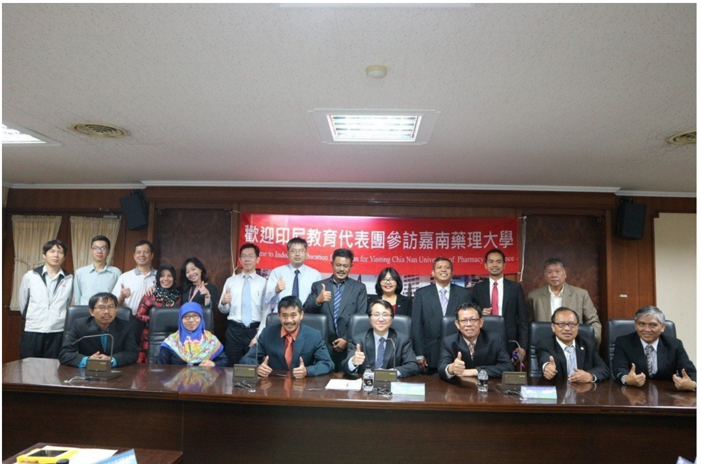
印尼教育團前往嘉藥參觀，對嘉藥辦學成效讚譽有加。