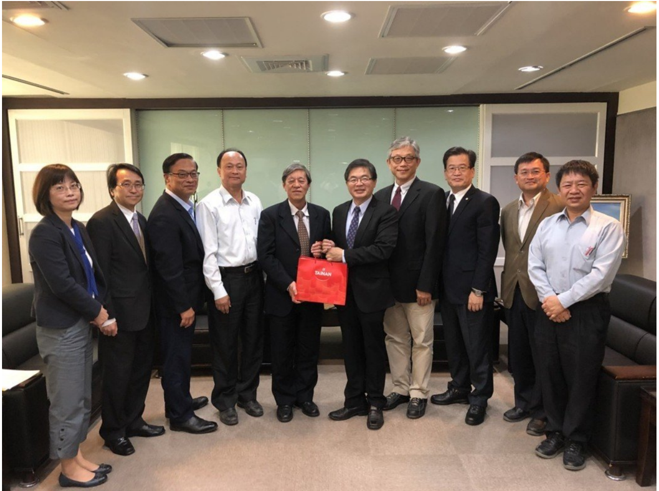
與會貴賓合影留念。