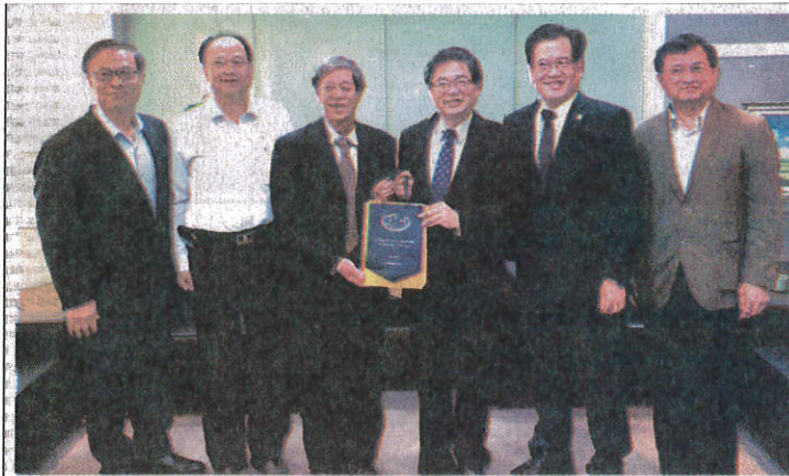
嘉藥校長陳銘田率領學校食藥人才至台南市政府拜會商討合作事宜(由左至右為警察局長黃宗仁、王錦德議員、嘉藥校長陳銘田、代理市長李孟諺、副秘書長李賢衛、衛生局長陳怡)。