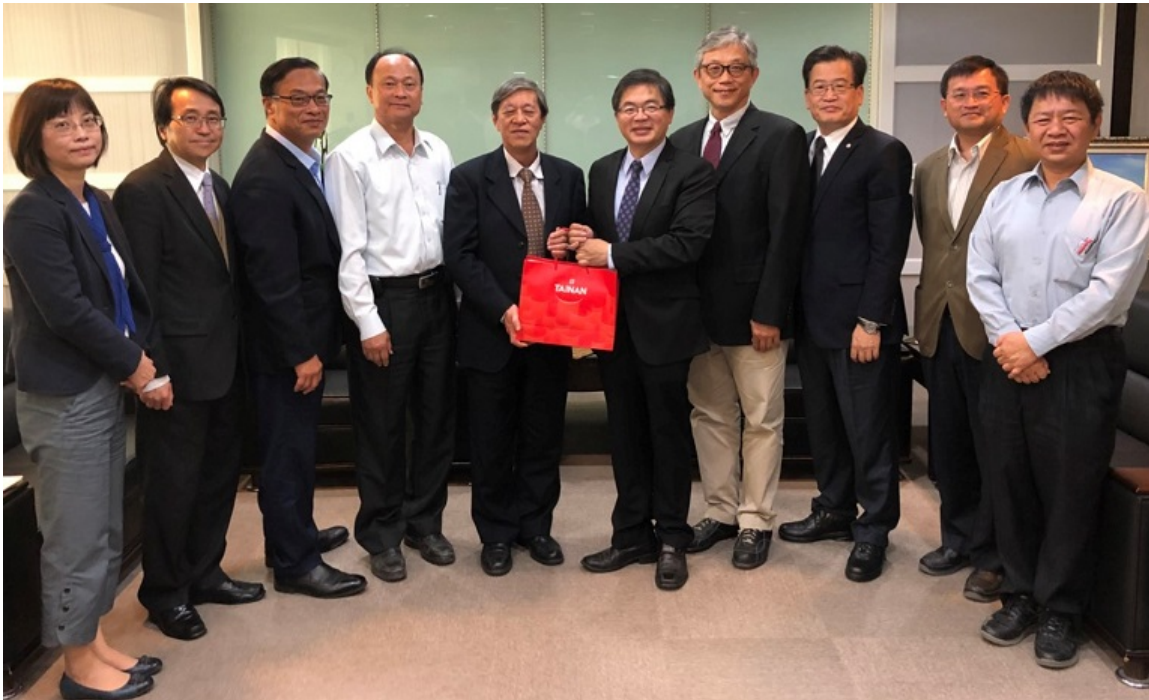
▲嘉藥校長陳銘田前往臺南市政府拜會李孟諺代理市長商討合作事宜。