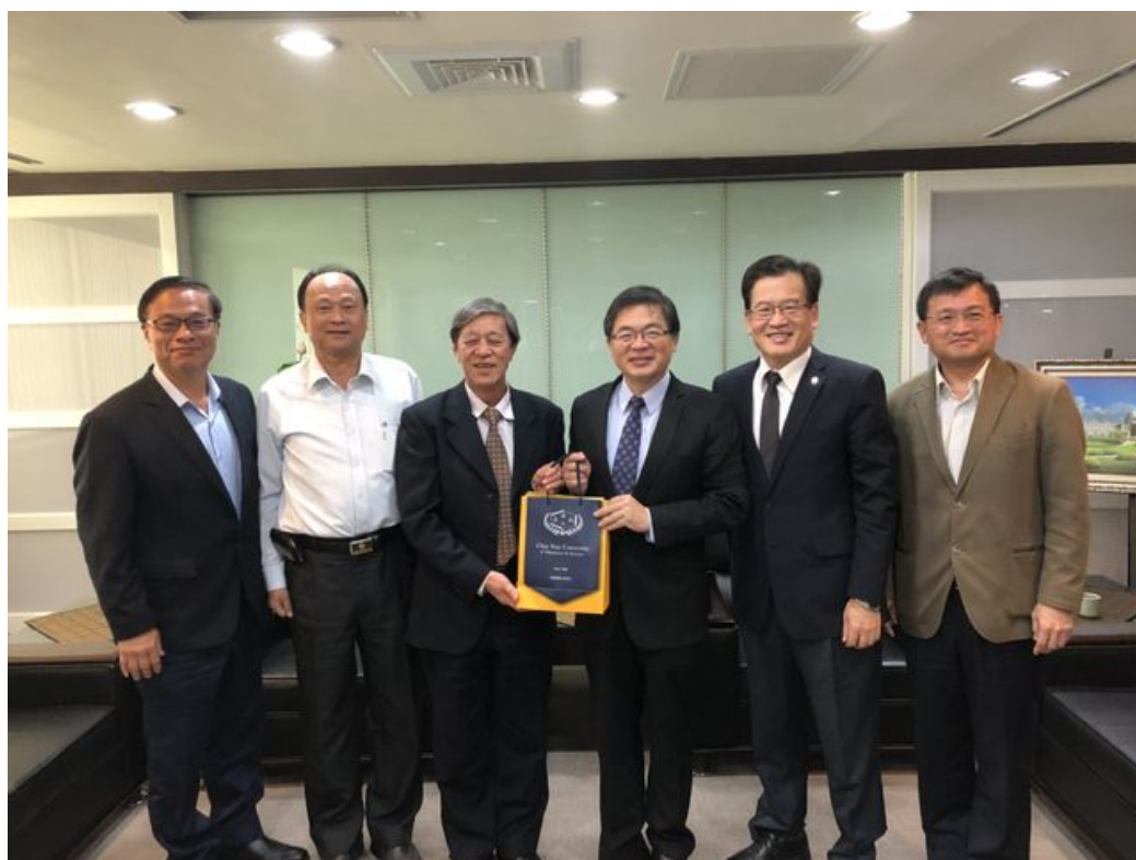
嘉藥校長陳銘田率領學校食藥人才基地主管至台南市政府拜會市長李孟諺商討合作事宜，(由左至右為警察局長黃宗仁、王錦德議員、嘉藥校長陳銘田、代理市長李孟諺、副秘書長李賢衛、衛生局長陳怡)。

http://www.cdnews.com.tw 2018-03-12 18:16:22