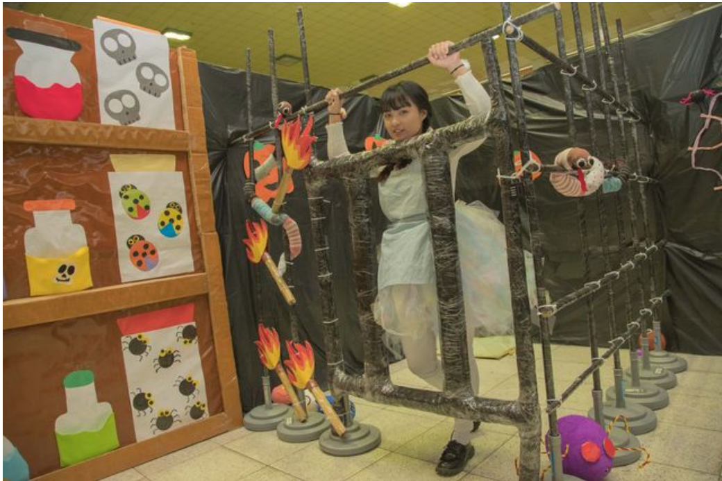
嘉藥幼保系規劃綠野仙蹤之桃跑計劃，歡迎大家一同來拯救桃樂絲。

http://www.cdnews.com.tw 2018-04-10 18:35:05