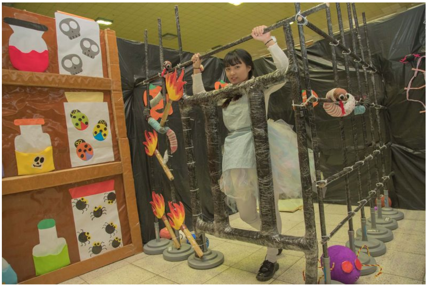
嘉藥幼保系學生畢業製作「綠野仙蹤之桃跑計劃」。

【記者陳懷恩台南報導】嘉南藥理大學嬰幼兒保育系4月10日起一連3天，在校內舉辦「綠野仙蹤之桃跑計劃」，透過密室逃脫遊戲的活動設計，融入感官訓練，讓小朋友在遊戲中邊玩邊學習。