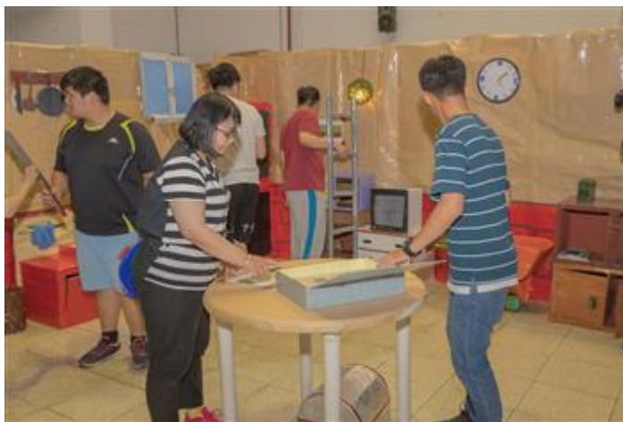
參與闖關的大學生絞盡腦汁尋求破關解答