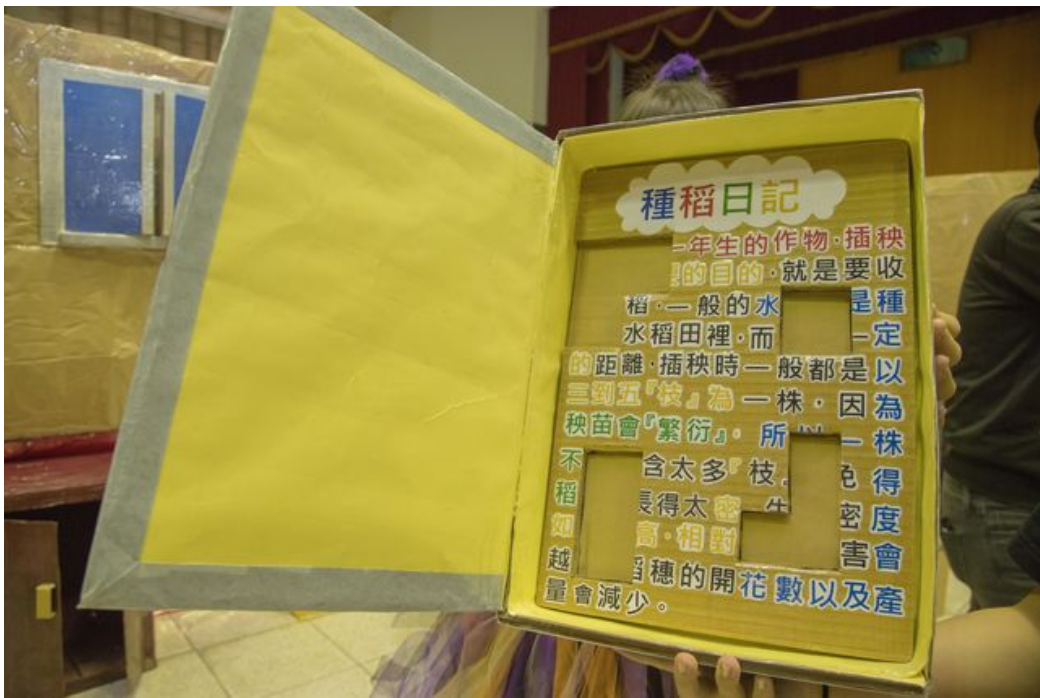
充滿挑戰性的謎底等你來解答喔。

嘉南藥理大學嬰幼兒保育系4月10日起一連3天，在校內舉辦「綠野仙蹤之桃跑計劃」，透過密室逃脫遊戲的活動設計，融入感官訓練，讓小朋友在遊戲中邊玩邊學習。附設幼稚園小朋友一到現場便個個躍躍欲試，而150位成人名額，一開放更被秒殺！小朋友，大學生都著迷！