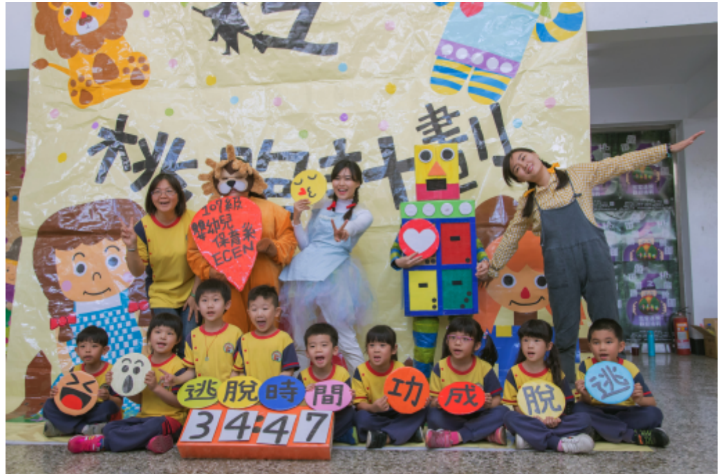
幼兒園小朋友開心在時間內完成闖關遊戲。

嘉南藥理大學嬰幼兒保育系四乙學生的畢業製作是設計出「綠野仙蹤之桃跑計劃」，透過密室逃脫遊戲的活動設計，融入感官訓練，讓小朋友在遊戲中邊玩邊學習，昨天在校園推出時連大學生都覺得很好玩。