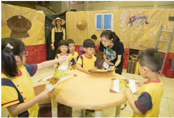
小朋友在大姊姊引導下努力解題