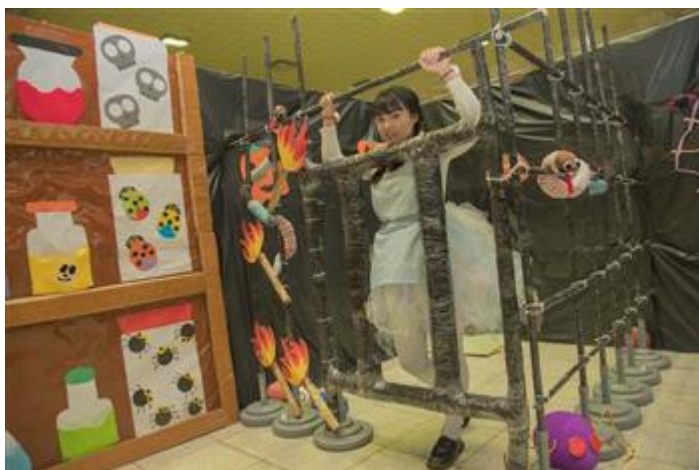
嘉藥幼保系規劃綠野仙蹤之桃跑計劃，歡迎大家一同來拯救桃樂絲