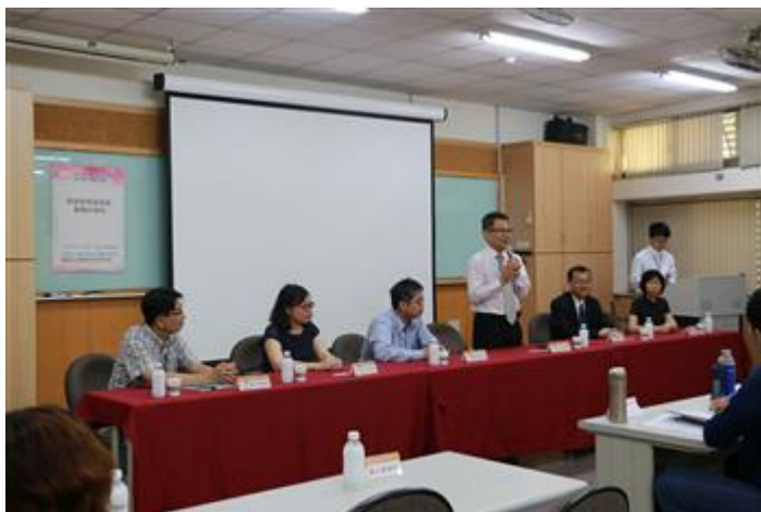
嘉藥社工系舉辦培訓居家照服督導員，請到勞工局王鑫基局長開場致詞