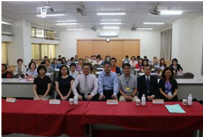
嘉藥社工系承辦臺南市政府勞工局職訓就服中心居家服務督導員辦理基礎訓練課程，舉辦開幕典禮