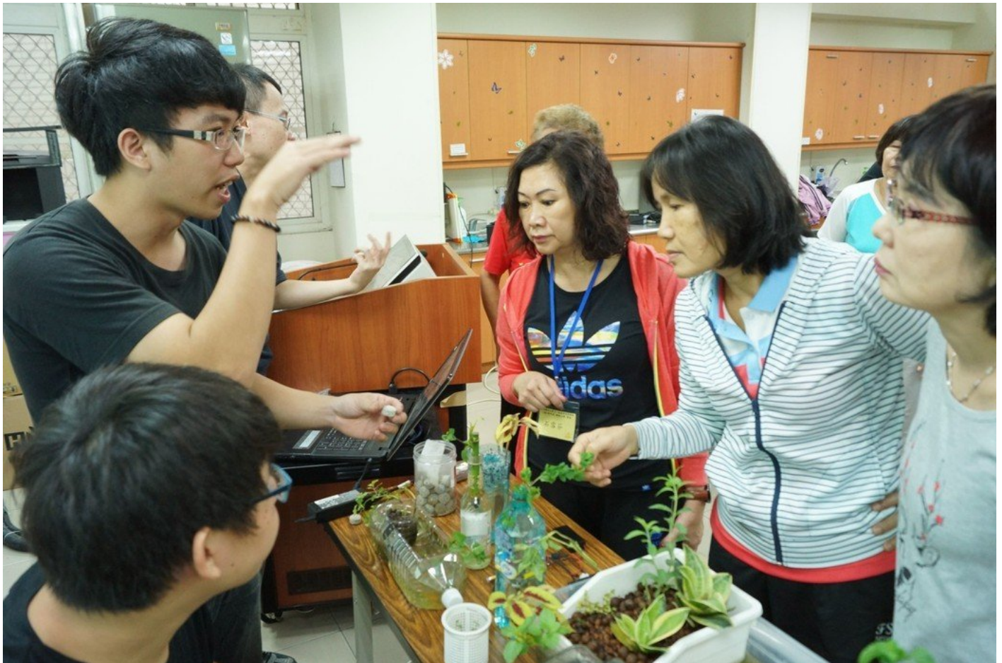
嘉藥老服系同學教導樂齡大學長輩如何製作魚菜共生系統。