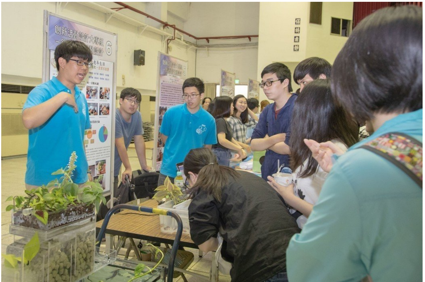
嘉藥「緣農魚水」團隊榮獲「銀髮學習活動」組優勝。