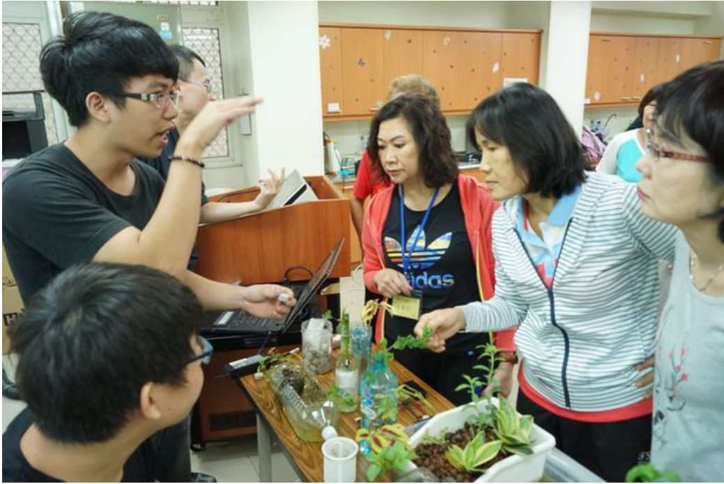
嘉藥老服系同學教導樂齡大學長輩如何製作魚菜共生系統。