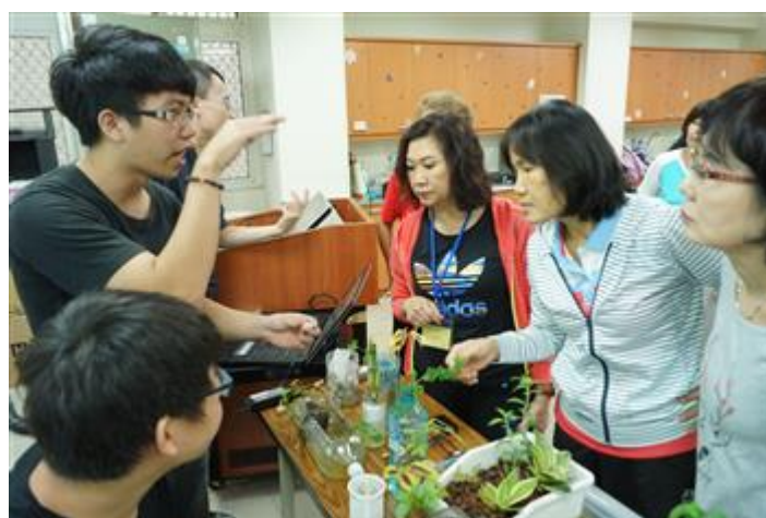
嘉藥老服系同學教導樂齡大學長輩如何製作魚菜共生系統