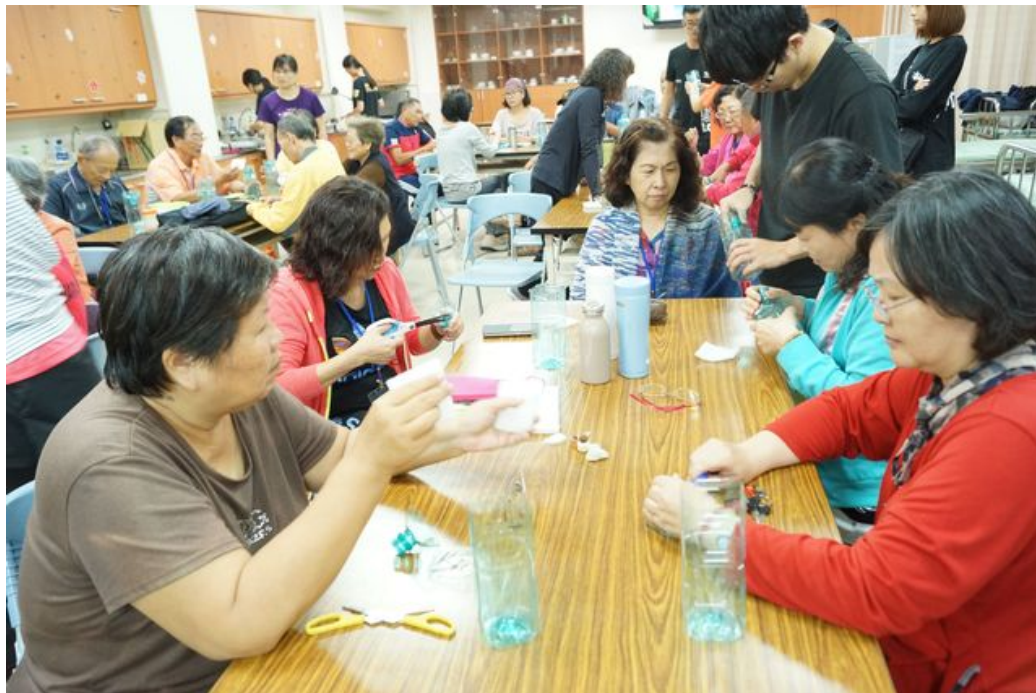
長輩們親自製作魚菜共生系統。