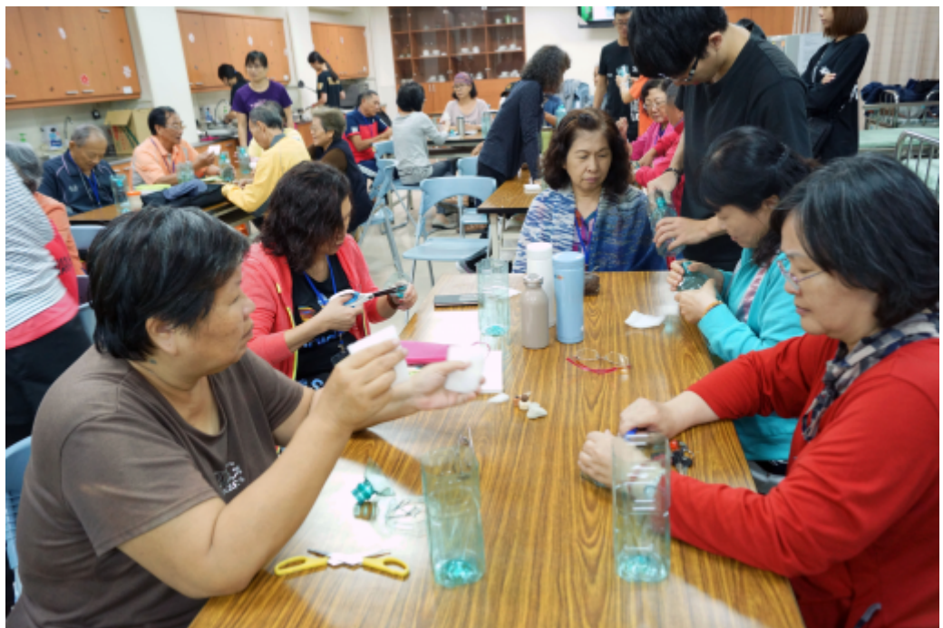
長輩們親自製作魚菜共生系統。

嘉南藥理大學老人服務事業管理系昨日舉辦全國老人活動創新設計競賽暨實務專題畢業成果展，來自全國七所高中職及大學團隊共廿一件作品進入複賽，其中嘉藥「緣農魚水」團隊的「養魚