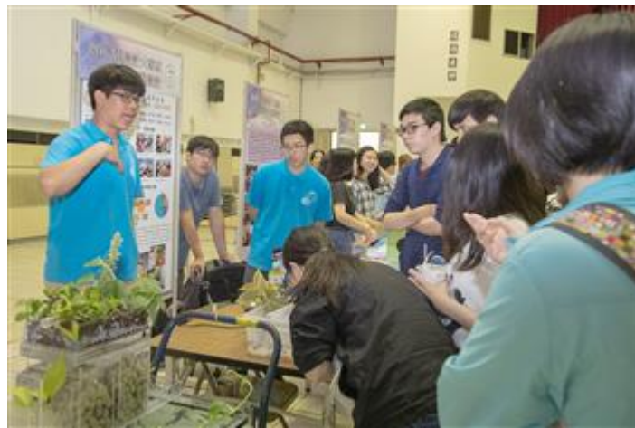
嘉藥「緣農魚水」團隊榮獲「銀髮學習活動」組優勝