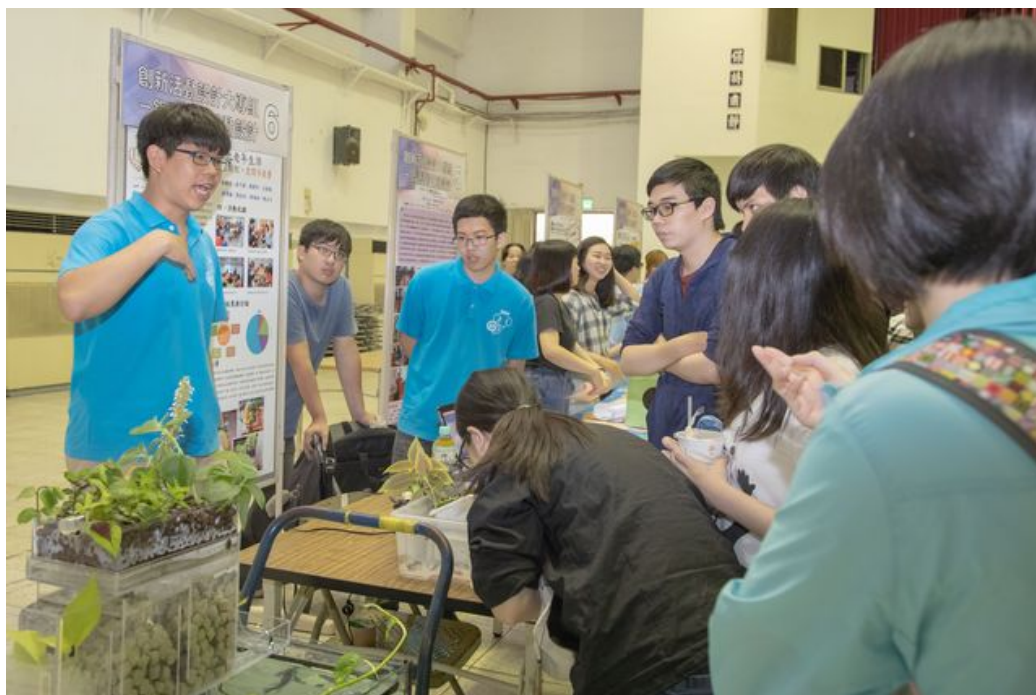
嘉藥「綠農魚水」團隊榮獲「銀髮學習活動」組優勝。

http://www.cdnews.com.tw 2018-05-02 16:37:50