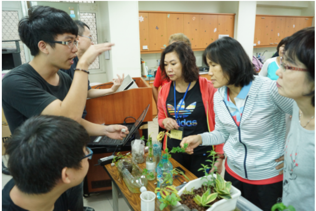
嘉藥老服系學生教導樂齡大學長輩如何製作魚菜共生系統。（記者林偉民翻攝）