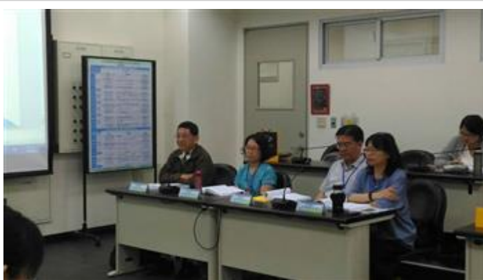
嘉藥儒學所辦理研討會吸引眾多學者參加