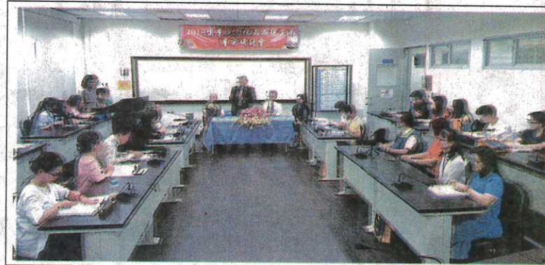
儒學與文化兩岸研究生學術研討會在嘉南藥理大學舉行。

研討會區分6場次，共20篇論文發表，來自大陸、香港7篇，台灣研究生13篇，內容涵蓋儒家內聖修養、經學思想研究、經典用語考據、社會文化探索、歷史人物析論、關懷女性議題。