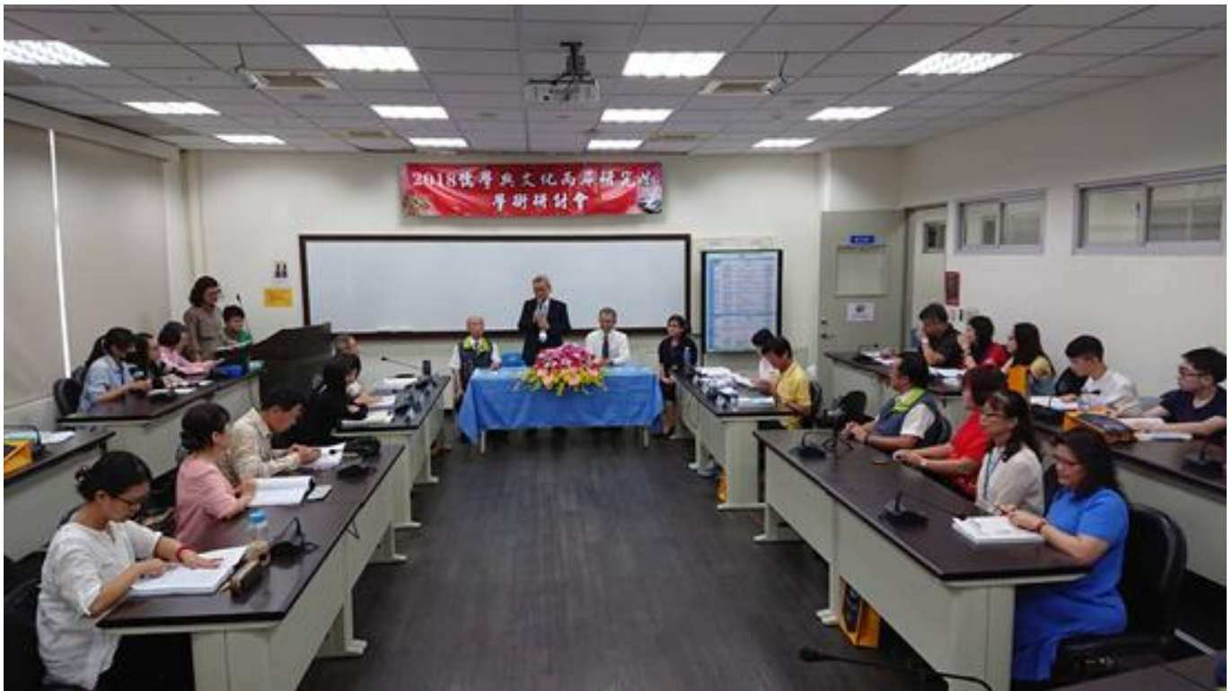
嘉藥儒學所辦兩岸儒與文化研討會 新探古人智者形象及比較女性角色轉換歷程

(中央社訊息服務20180530 09:18:40)嘉南藥理大學一年一度的「儒學與文化兩岸研究生學術研討會」，在5月26~27日舉辦，吸引來自中國大陸、香港、臺灣，共計20篇論文參與發表，主題涵括修養、思想、經典用語考究、社會文化、歷史人物、婦女成長等，是兩岸儒學研究年輕新生代的盛會。