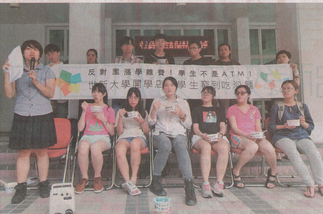
世新大學學生昨天在校吃泡麵抗議，呼籲教部應駁回調漲學雜費。