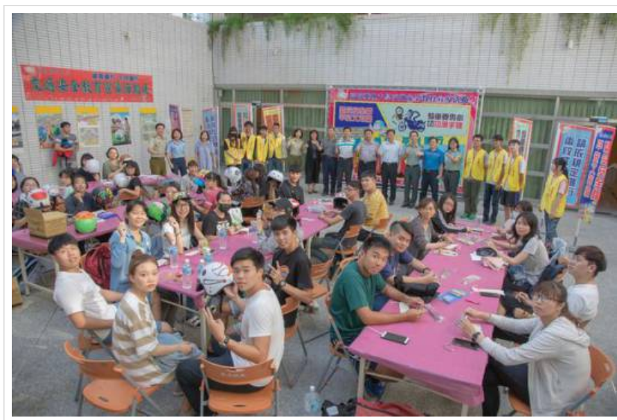
彩繪安全帽及環保吸管袋活動吸引眾學生報名參加。