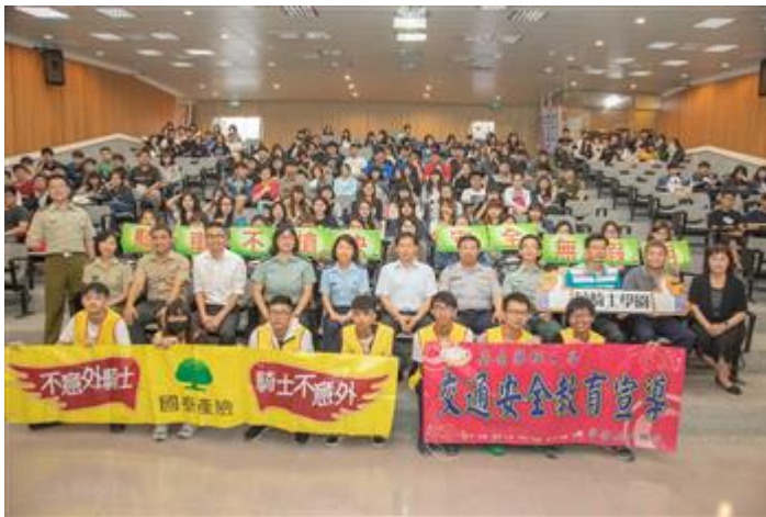
嘉藥舉辦「減速慢行·平安隨行」交通安全宣導，提醒學生注意行車安全