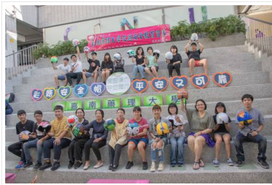
彩繪安全帽，平安又可靠活動，同學們個個創意十足。