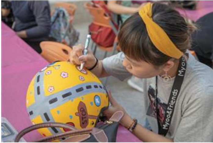
「彩繪安全帽·平安又可靠」的安全帽彩繪活動，讓學生自由發揮創意