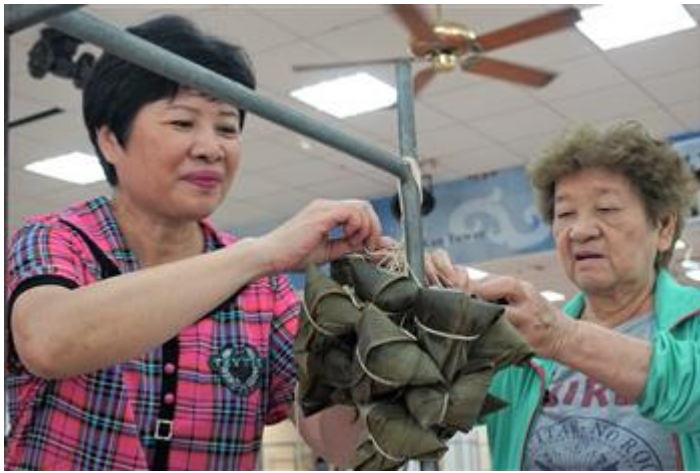
透過健康粽DIY，強調用材用料安全放心，養生健康無負擔