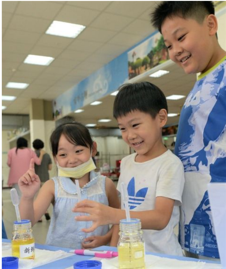
教導民眾利用油脂酸價速測試劑、過氧化氫(雙氧水)、皂黃速測試劑檢測食用油品質的酸敗。

http://www.cdnews.com.tw 2018-06-19 19:54:38