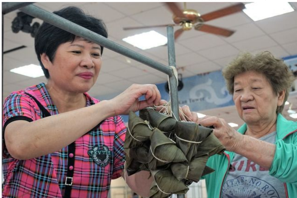
透過健康粽DIY，強調用材用料安全放心，養生健康無負擔。