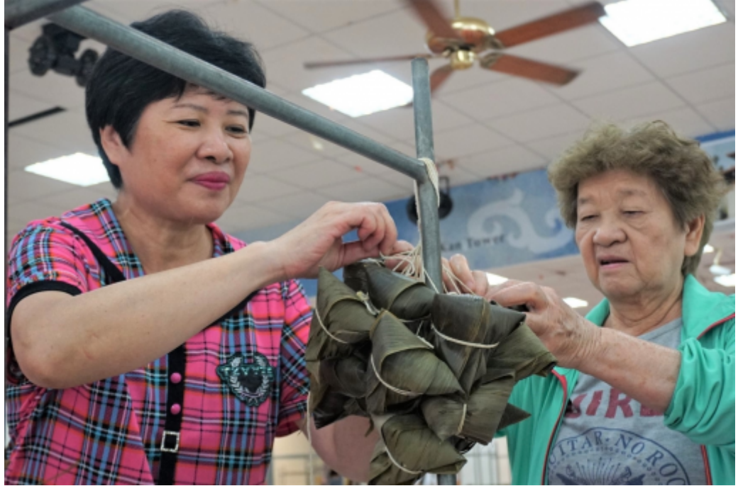
嘉藥食品系師生日前到社區教民眾製作健康粽。

嘉南藥理大學食品科技系日前到東區崇文里活動中心舉辦「樂活包粽，健康包中」活動，設計闖關遊戲教導社區民眾製作健康粽，並利用簡易試劑，讓民眾迅速了解食物的食用油品質和是否使用非法添加物，宣導食品安全。