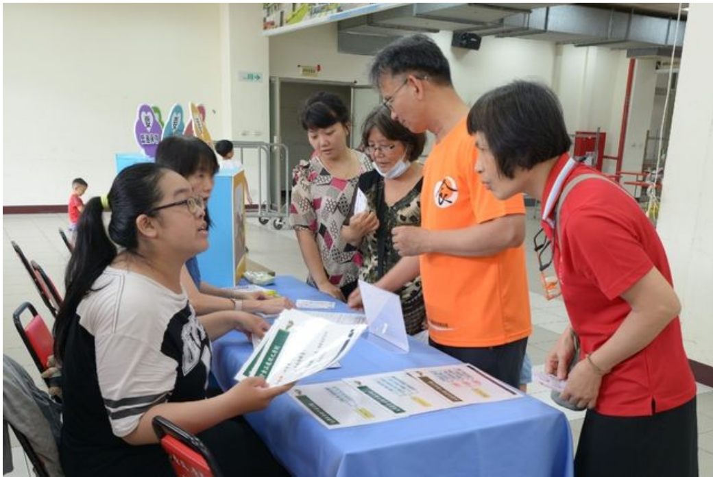
以預防食品中毒「五要-要生熟食分開、要徹底加熱、要洗手、要低溫保存、要新鮮」，教。