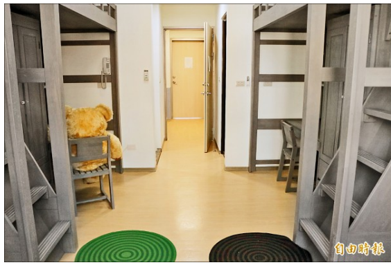
嘉南藥理大學學生宿舍空間規劃，讓學生感到貼心，每學期近五千個宿舍床位幾乎滿床。

台首大實習旅館共有廿一間房間，房型與一般飯店相似，以雙人房、四人房為主，平日房價分別為一千四百元及兩千四百元，假日增收六百元；另外，也有類似青年旅社的房型，每床收費五百元，環境乾淨整齊，不輸外面的星級飯店。