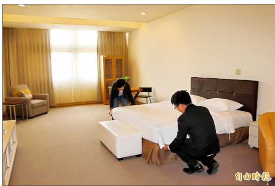
台灣首府大學將空出的學生宿舍，改造成實習旅館，讓飯店管理系學生能多一個實習的場域。

〔記者萬于甄、劉婉君／台南報導〕少子化造成大學入學人數年年減少，台南部份大學也出現「宿舍床位比學生多」的情況，真理大學台南校區今年已無大學生入學，八百多個床位的宿舍可能要規劃為高齡長壽村；而台灣首府大學則已將多餘的床位闢出部份開設學生實習旅館，且已經開放營運。