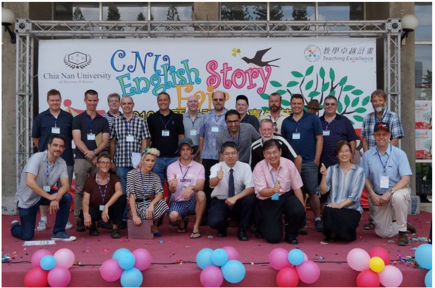
嘉南藥理大學首度開設「學士後海外華語教學學位學程」。

【記者陳懷恩台南報導】因應美國政府對華語教師需求激增，嘉南藥理大學首度開設「學士後海外華語教學學位學程」，針對學士以上畢業施以2年專業實務課程及實習，便可投入海外華語教學職場。