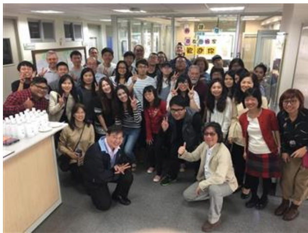
嘉南藥理大學應用外語系師生在生活中快樂學習