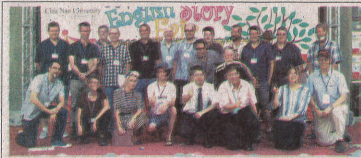
嘉南藥理大學首度開設「學士後海外華語教學學位學程」。

【記者陳懷恩台南報導】因應美國政府對華語教師需求激增，嘉南藥理大學首度開設「學士後海外華語教學學位學程」，針對學士以上畢業施以2年專業實務課程及實習，便