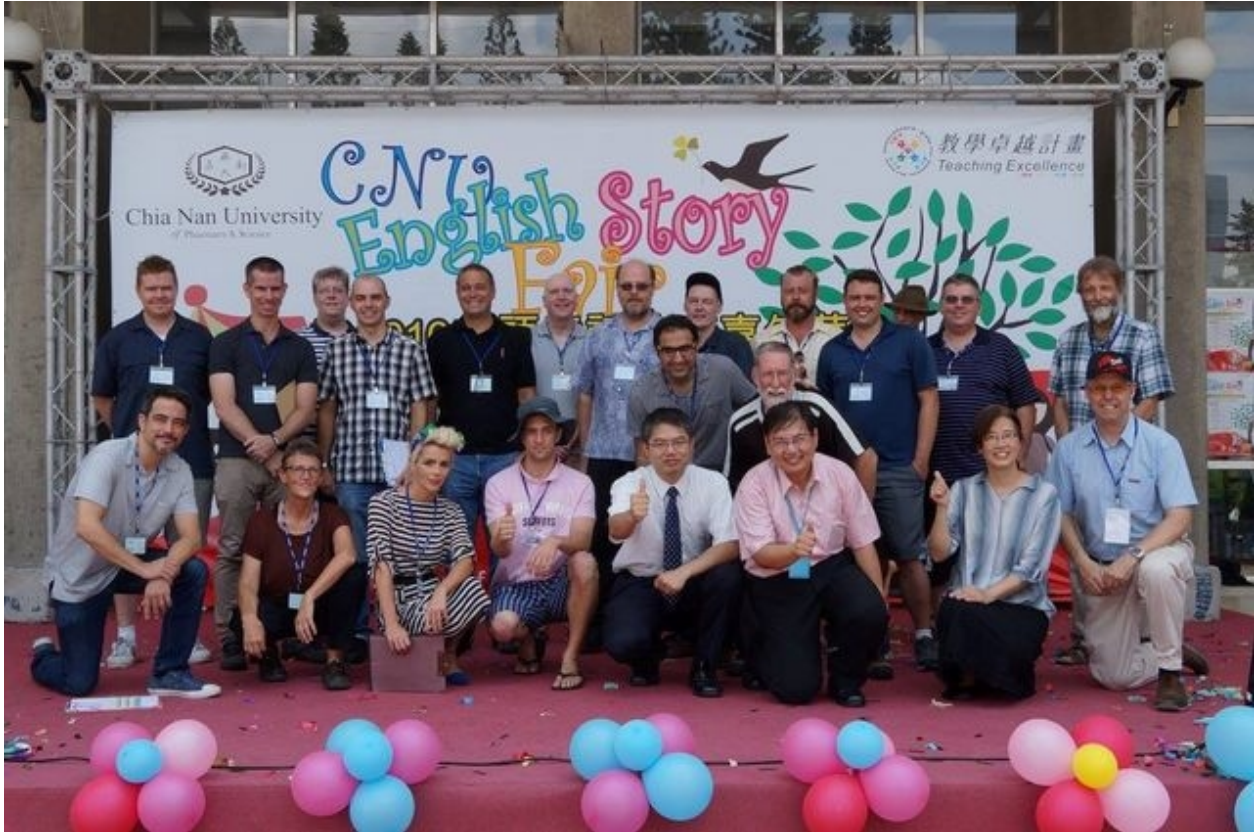
嘉南藥理大學應用外語系2016 English Story Fair 英語童話故事嘉年華活動。

【101新聞網記者王宇榛/台南報導】華語文近來在全球語言學習市場大為風行，美國政府甚至將華語定為現今與未來的關鍵語言，對華語教師需求激增。嘉南藥理大學107學年度首度開設「學士後海外華語教學學位學程」，針對學士以上畢業者，施以2年專業實務課程及實習，取得第2張學士學位證書，便可投入海外華語教學職場。