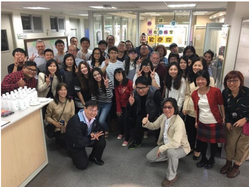
嘉南藥理大學應用外語系師生在生活中快樂學習。

華語文近來在全球語言學習市場大為風行，美國政府甚至將華語定為現今與未來的關鍵語言，對華語教師需求激增。嘉南藥理大學107學年度首度開設「學士後海外華語教學學位學程」，針對學士以上畢業者，施以2年專業實務課程及實習，取得第2張學士學位證書，便可投入海外華語教學職場。