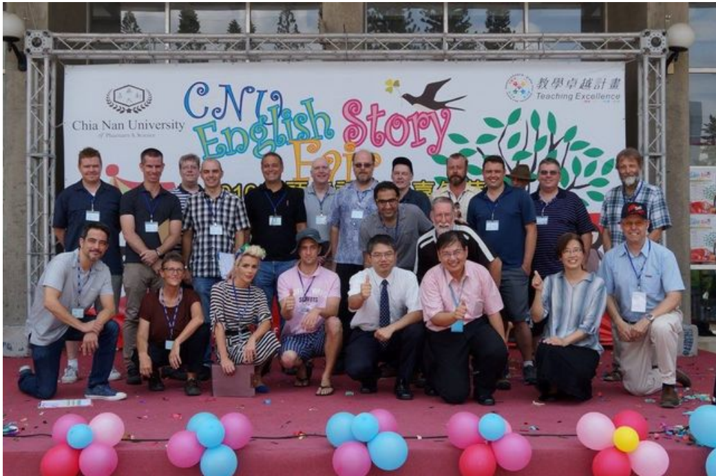
嘉南藥理大學應用外語系2016 English Story Fair 英語童話故事嘉年華活動。

http://www.cntimes.info 2018-07-30 12:37:28