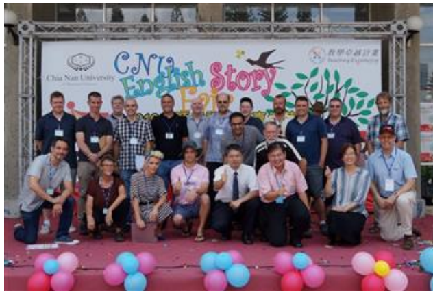
嘉南藥理大學應用外語系2016 English Story Fair 英語童話故事嘉年華活動狀況