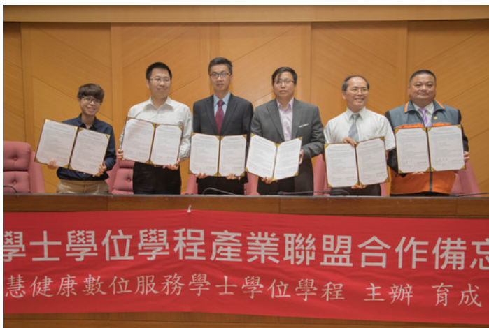
嘉藥與優質廠商成立產學聯盟，共同培育健康數位服務專業人才