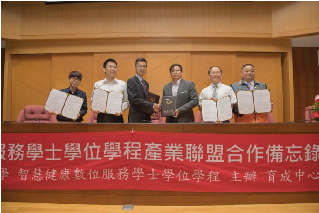
嘉南藥大與業界產學聯盟培育跨域人才。

嘉南藥理大學新設全國首創的「智慧健康數位服務學士學位學程」，將於107學年度招生，4月20日上午與橫跨資訊、醫藥、照護、生技、健康管理的17家優質機構、廠商，簽訂跨域合作備忘錄、成立產學聯盟，共同培育健康數位服務專業人才。