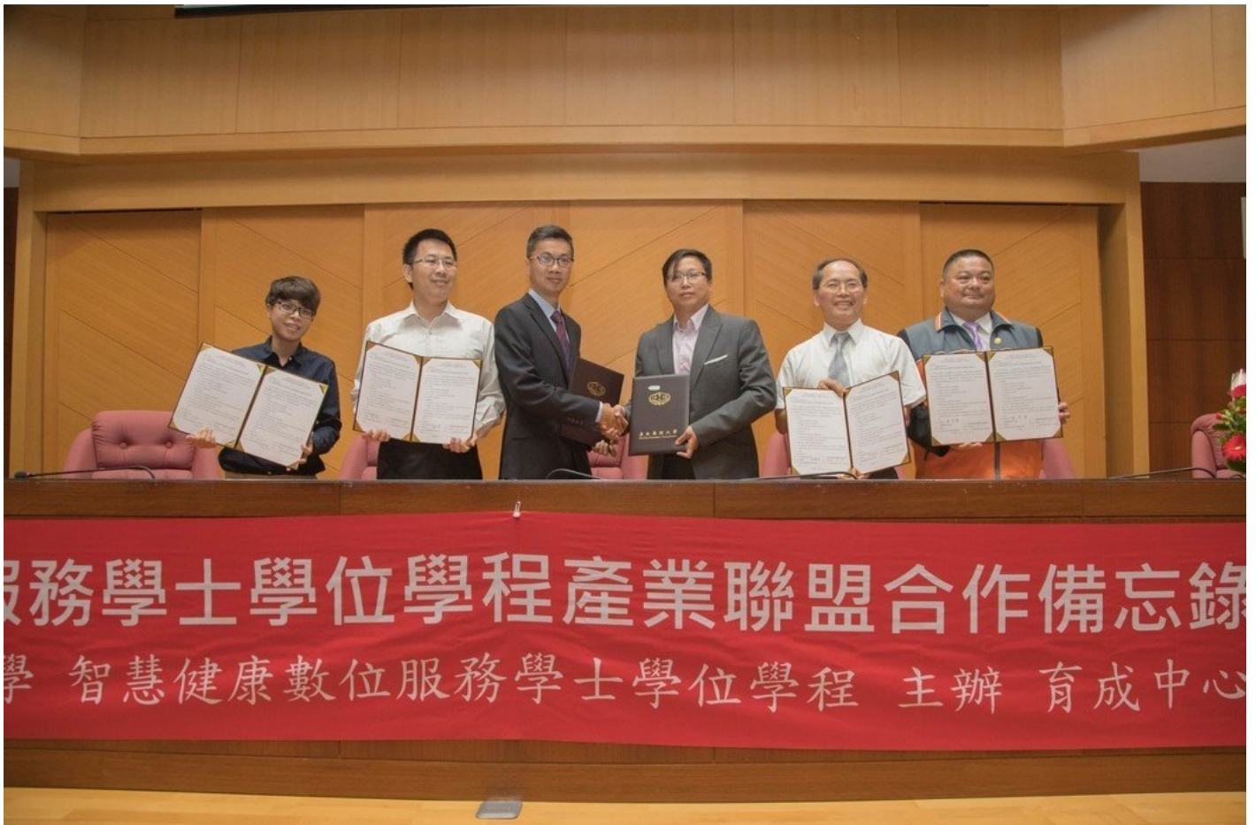
嘉南藥大與業界產學聯盟培育跨域人才。

與會簽約廠商代表包括：台灣健康資訊管理學會監事、國立高雄師範大學事業經營系教授許惠媚、台灣長期照護管理學會常務理事、台中市慈恩慈善協會執行長許淑芬、台灣長期照護管理學會監事、高雄市明山慈安居老人養護中心執行長成茵茵、肯度健康事業有限公司執行長顏秀芳、眾在福祉租賃有限公司總經理林文瀚、衛福部嘉南療養院資訊室主任吳郁馨、衛福部嘉南療養院管理中心主任梁順清、永順興股份有限公司負責人、台南市中小企業榮譽指導員協進會會長翁育睿、盈全企業社負責人、台南市青年創業協會會長林盈全、嘉振企業有限公司負責人陳玉振、康原國際有限公司負責人、嘉藥台南校友會會長鍾炳耀、康禾生技企業社負責人謝孟珊、美晴護理之家負責人蔣美華、新譯漢方有限公司負責人曾詠瑋、華苓科技股份有限公司負責人梁賓先、博識高科技有限公司負責人陳金漢、易利華科技有限公司負責人林鑛華、創新時代國際行銷有限公司負責人吳秉澤、真茂科技有限公司總經理林燕山。