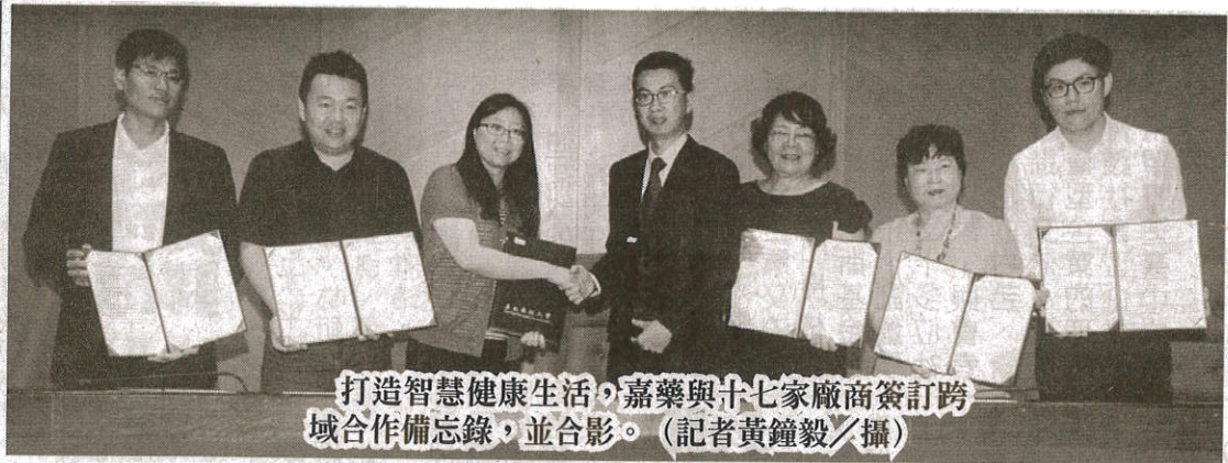
打造智慧健康生活，嘉藥與十七家廠商簽訂跨域合作備忘錄，並合影。