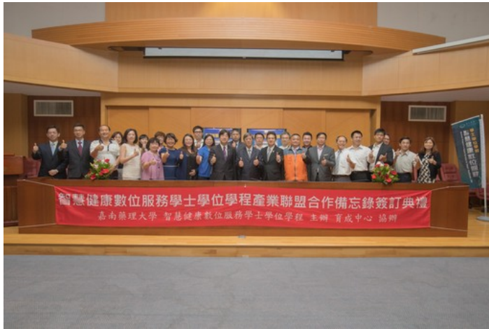
打造智慧健康生活，嘉藥與17家廠商簽訂跨域合作備忘錄