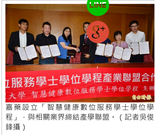
嘉藥設立「智慧健康數位服務學士學位學程」，與相關業界締結產學聯盟。

〔記者吳俊鋒／台南報導〕由於少子化的問題嚴重，台灣8年後恐進入「超高齡社會」，因應未來人口結構的趨勢，嘉藥管理大學設立了全國首創的「智慧健康數位服務學士學位學程」，招生在即，校方今天特地與資訊、醫藥、照護、生技、健康管理等17家機構廠商簽約合作，締結產學聯盟，希望透過跨領域的訓練，培育更多全方位的人才。