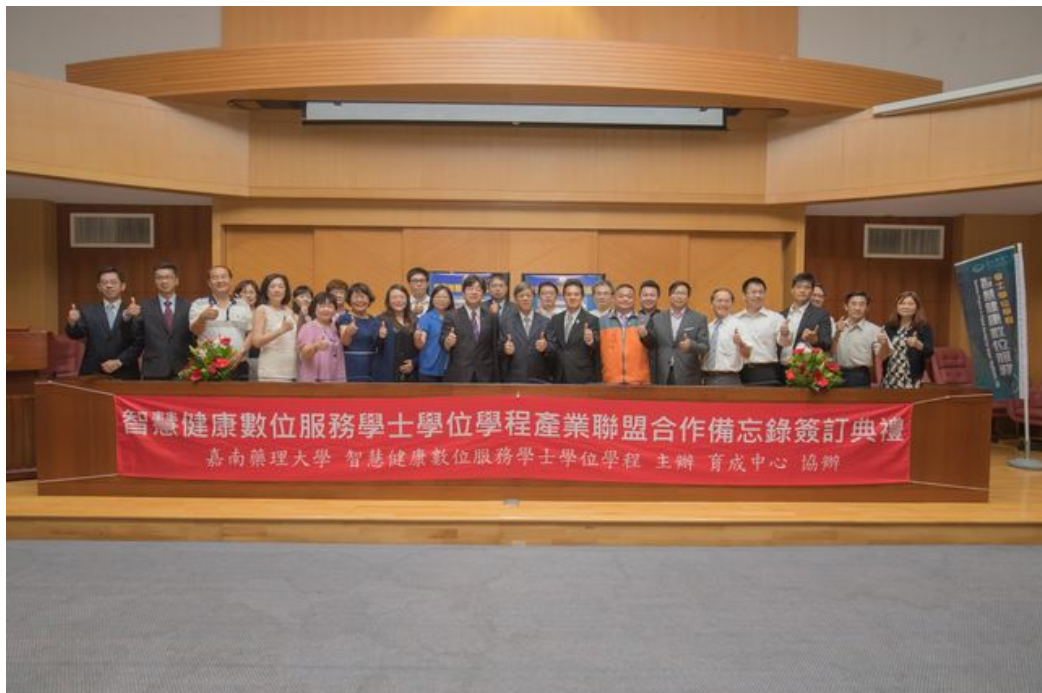
打造智慧健康生活，嘉藥與17家廠商簽訂跨域合作備忘錄。

http://www.cdnews.com.tw 2018-04-20 18:05:58