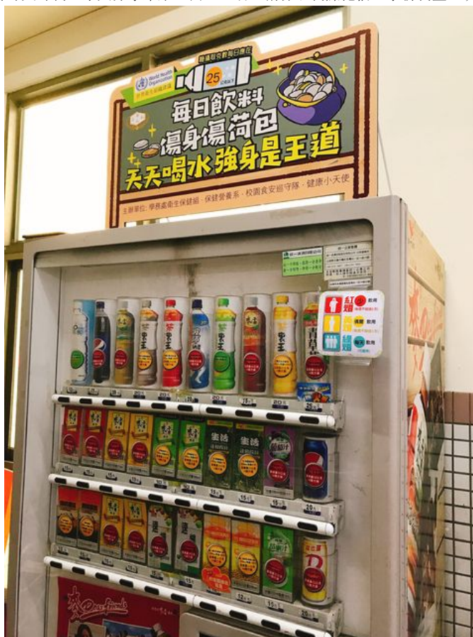
嘉樂校園自動販賣機貼有紅黃綠標示，可立即辨識飲料含糖量。