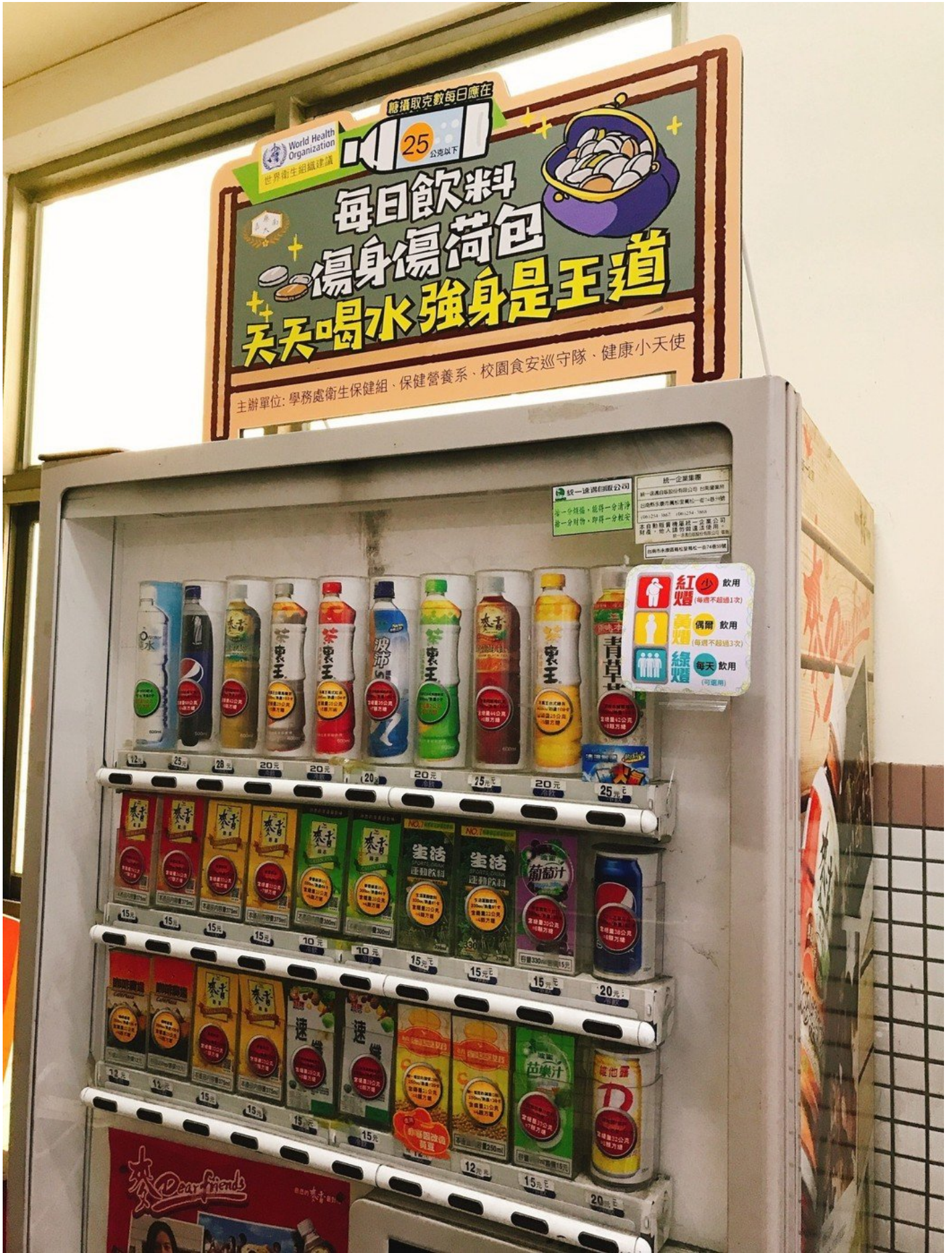
市售含糖飲料所含的成分多半為添加糖、含糖發酵乳等，最近在校內的飲料販賣機標上紅黃綠貼紙，能讓師生能夠判別各飲料的糖份多寡，隨時注意攝取量。