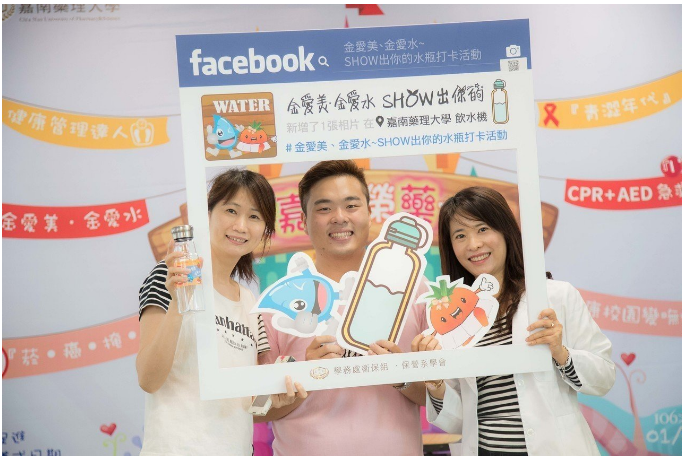
市售含糖飲料所含的成分多半為添加糖、含糖發酵乳等，最近在校內的飲料販賣機標上紅黃綠貼紙，能讓師生能夠判別各飲料的糖份多寡，隨時注意攝取量。