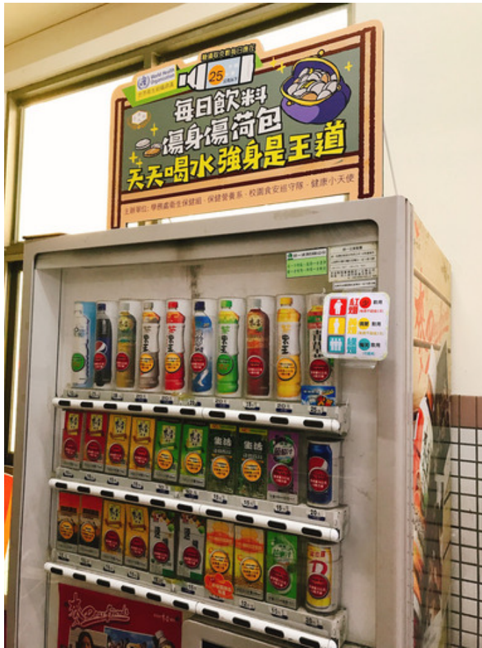
嘉藥校園自動販賣機貼有紅黃綠標示，可立即辨識飲料含糖量