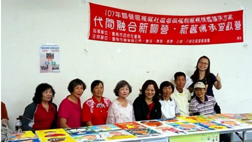
嘉藥師生至柳營推動社區培力。