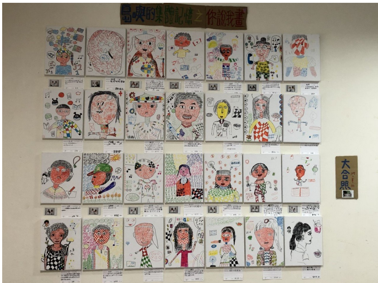
嘉南藥理大學社工系與柳營區公所合作推動社區培力計畫，邀請國小學童和學區境內的社區長者共同學習。

參與社區培力合作的學校除了柳營國小外，也有重溪國小、果毅國小、幼兒園等學童，計畫進行方式是依學校所在社區，讓小朋友參與培力活動，內容多元豐富，動靜態皆有，甚至也安排小朋友教阿公阿嬤玩指尖陀螺，其中不乏近百歲長輩，才學習幾次就能夠靈活操作，相當感人。