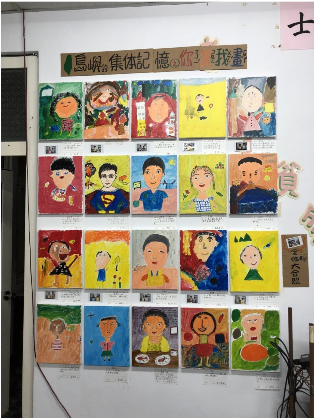
嘉南藥理大學社工系與柳營區公所合作推動社區培力計畫，邀請國小學童和學區境內的社區長者共同學習。