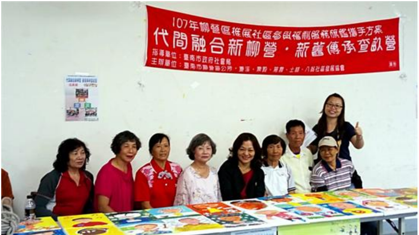
講古彩繪世代情 嘉藥師生至柳營推動社區培力

(中央社訊息服務20181002 09:12:57)嘉南藥理大學社工系與柳營區公所合作推動社區培力計畫，邀請國小學童和學區境內的社區長者共同學習，讓愛在偏鄉角落傳播。即使沒有血緣關係，近百歲老人也把小朋友當成寶貝孫子看待，共同完成「你說我畫」作品。