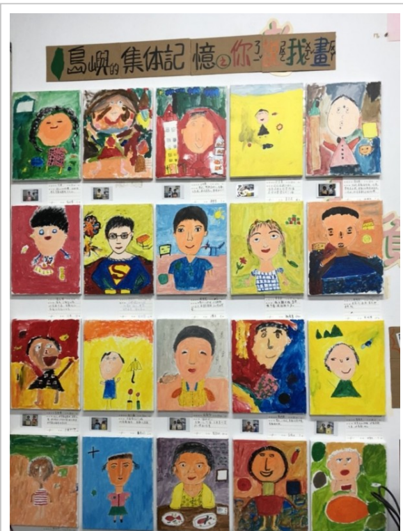
嘉南藥理大學師生至柳營區社區培力，學童聽阿公阿嬤講古，彩繪互動傳承地方文化。

自由時報版權所有不得轉載 © 2018 The Liberty Times. All Rights Reserved.