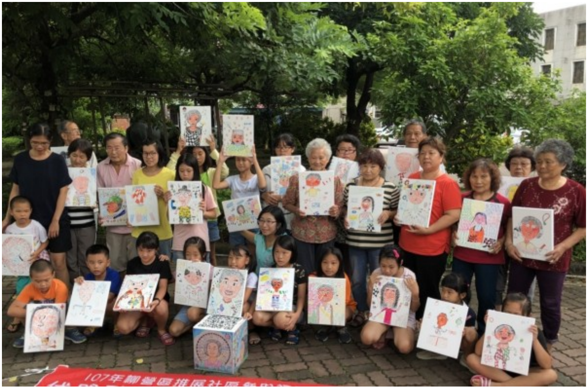
嘉南藥理大學師生至柳營區社區培力，學童聽阿公阿嬤講古，彩繪互動傳承地方文化。