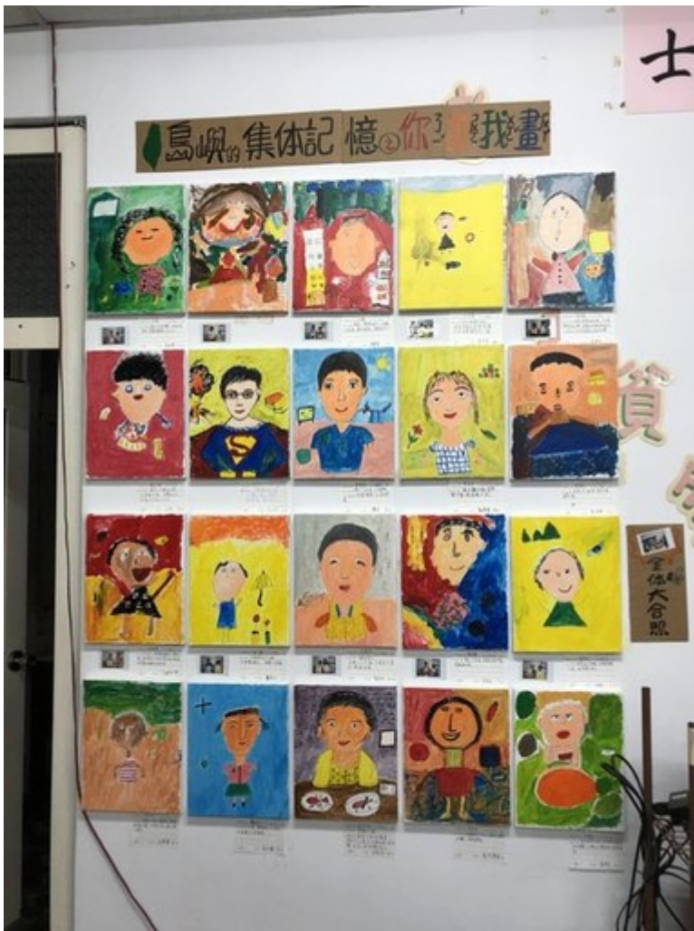
「你說我畫」作品流露出溫馨的世代情感。