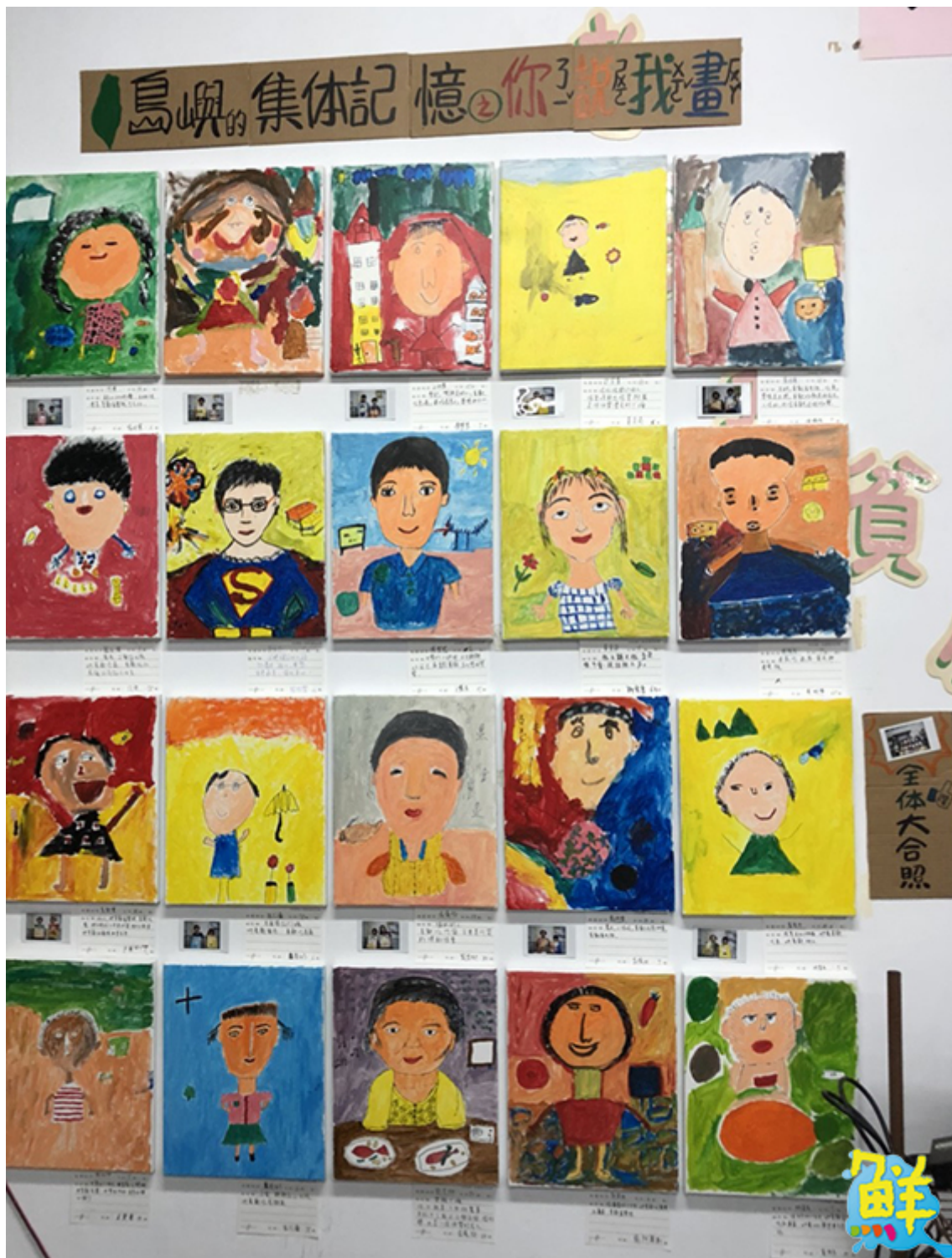
▲「你說我畫」作品流露出溫馨的世代情感