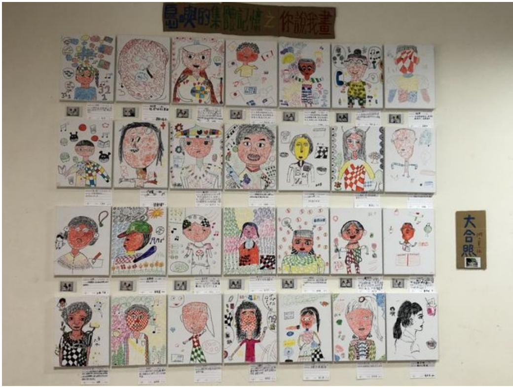
小朋友的「你說我畫」創作品。

嘉南藥理大學社工系與柳營區公所合作推動社區培力計畫，邀請國小學童和學區境內的社區長者共同學習，讓愛在偏鄉角落傳播。即使沒有血緣關係，近百歲老人也把小朋友當成寶貝孫子看待，共同完成「你說我畫」作品。