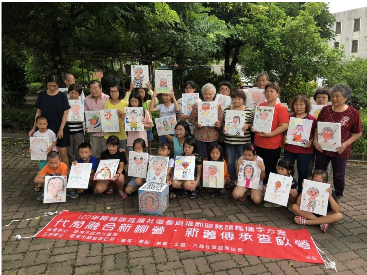
嘉南藥理大學社工系與柳營區公所合作推動社區培力計畫，邀請國小學童和學區境內的社區長者共同學習。