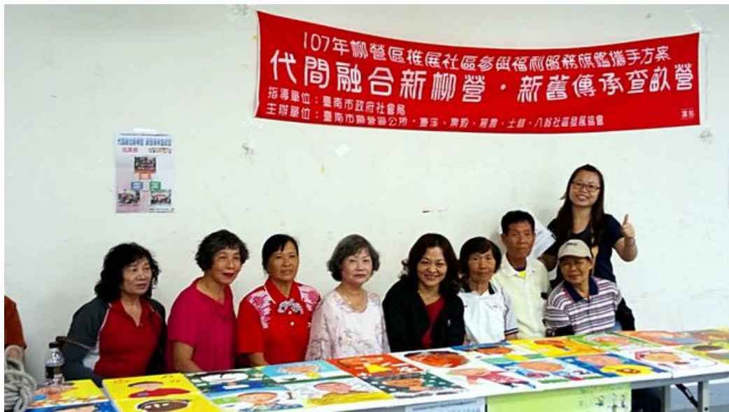
嘉藥師生至柳營推動社區培力。

http://www.cntimes.info 2018-10-01 18:19:24