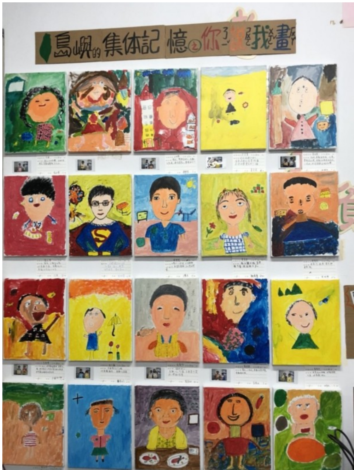
嘉南藥理大學師生至柳營區社區培力，學童聽阿公阿嬤講古，彩繪互動傳承地方文化。