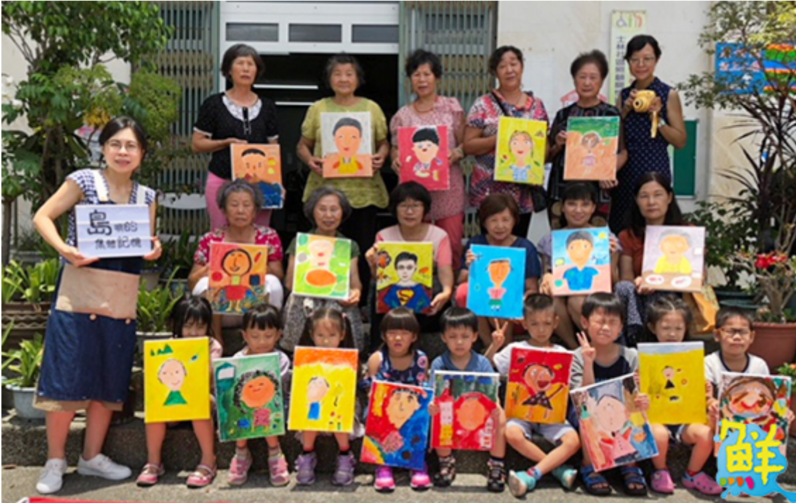
▲柳營社區培力活動展示小朋友的成果作品

嘉南藥理大學社工系與柳營區公所合作推動社區培力計畫，邀請國小學童和學區境內的社區長者共同學習，讓愛在偏鄉角落傳播。即使沒有血緣關係，近百歲老人也把小朋友當成寶貝孫子看待，共同完成「你說我畫」作品。