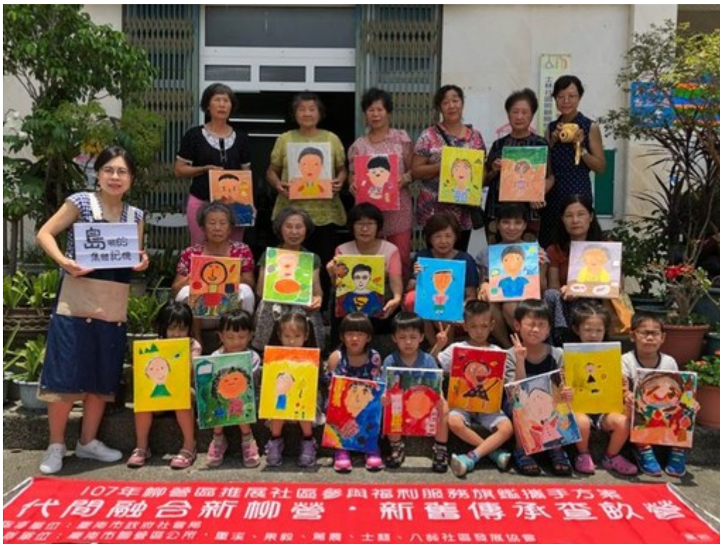
柳營社區培力活動展示小朋友的成果作品。