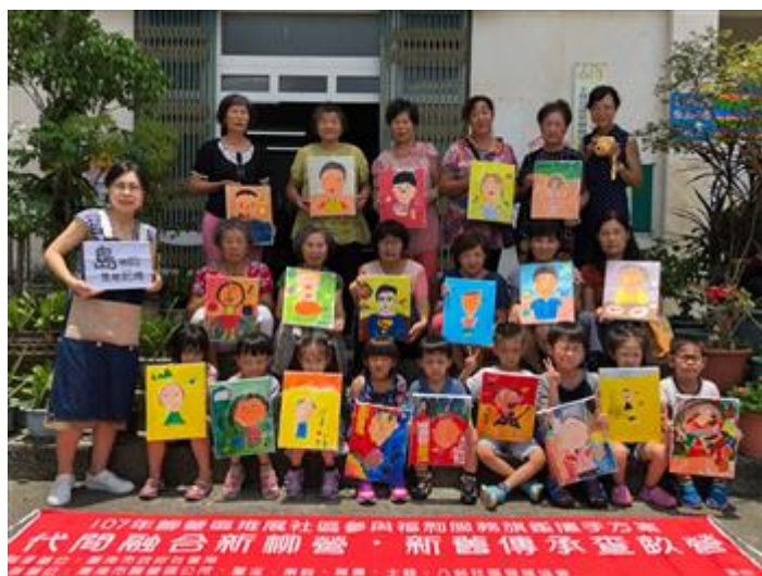
柳營社區培力活動展示小朋友的成果作品