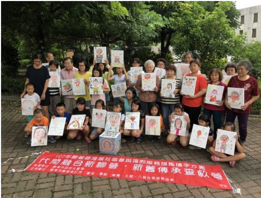
學童與社區長者秀出「你說我畫」作品。