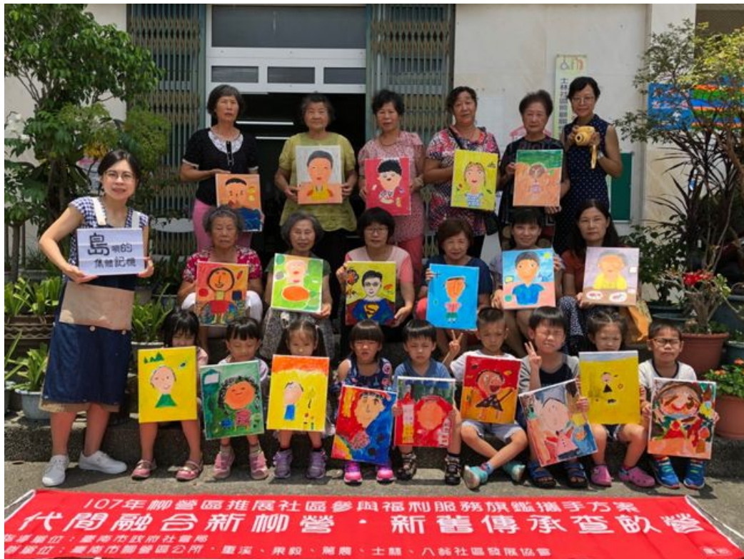
柳營社區培力活動展示小朋友的成果作品。