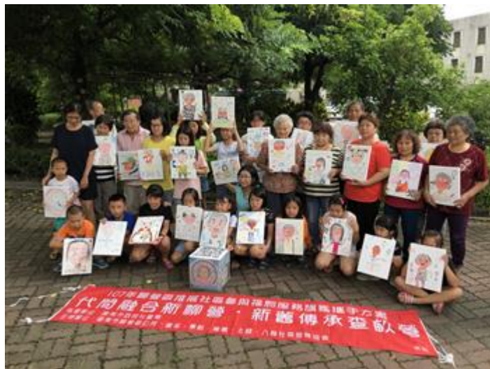
學童與社區長者秀出「你說我畫」作品