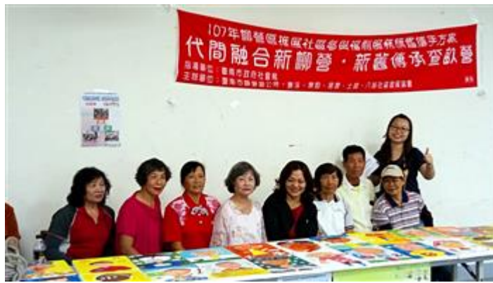
嘉藥師生至柳營推動社區培力