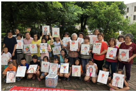
嘉南藥理大學師生至柳營區社區培力，學童聽阿公阿嬤講古，彩繪互動傳承地方文化。

嘉南藥理大學社工系與柳營區公所合作推動社區培力計畫，邀請國小學童和學區內長者共同學習，包括柳營國小、重溪國小、果毅國小與幼兒園學童，依學校所在社區，規劃多元豐富、動靜態皆有的活動，例如老人家說自己的故事，小朋友邊聽故事邊畫畫。