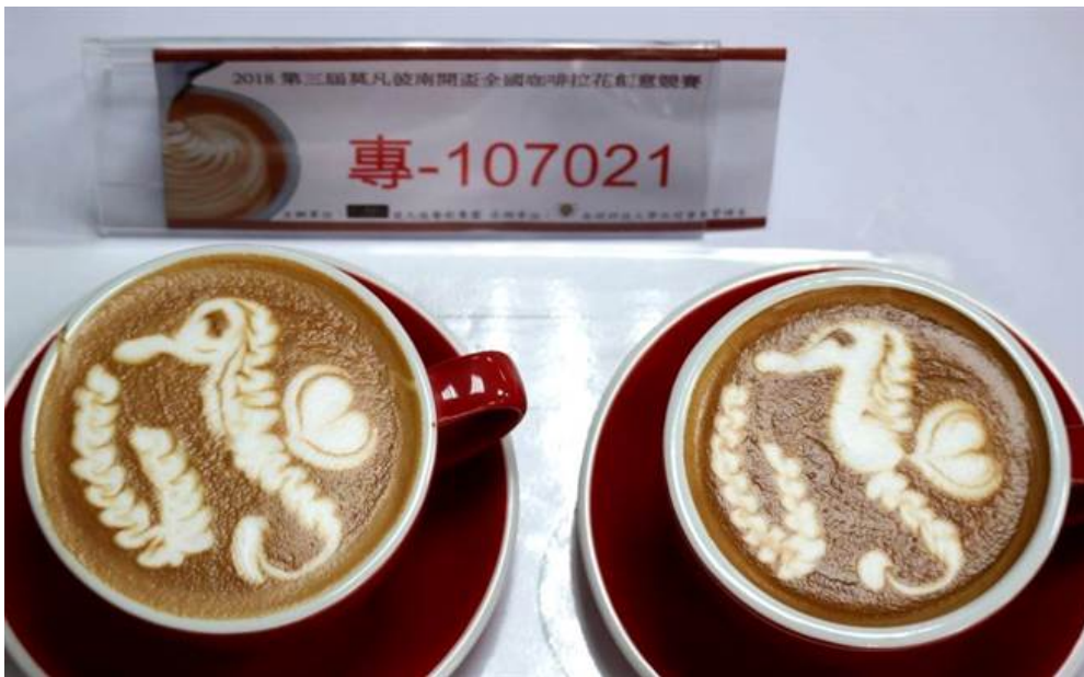
▲2018年第3屆莫凡彼南開盃全國咖啡拉花競賽大專組冠軍的作品。