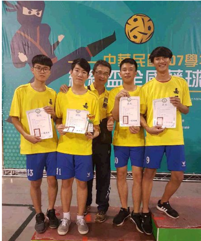
總統盃全國藤球錦標賽嘉南藥理大學藤球隊，在2人組和3人組分別摘下冠、亞軍。

【記者杜龍一／南市報導】107學年度總統盃全國藤球錦標賽於屏東縣立體育館連賽3天，10月21日完成所有賽程，嘉南藥理大學藤球隊，展現高超的腳下功夫與拼鬥精神；首次參賽就在2人組和3人組分別摘下冠、亞軍，22日凱選返校，受到師生熱烈歡迎及祝賀，亮眼表現，全校引以為傲。