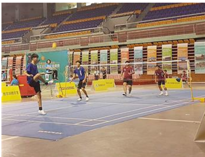
嘉藥藤球隊(藍衣)鬥志高昂，勇奪二人賽冠軍