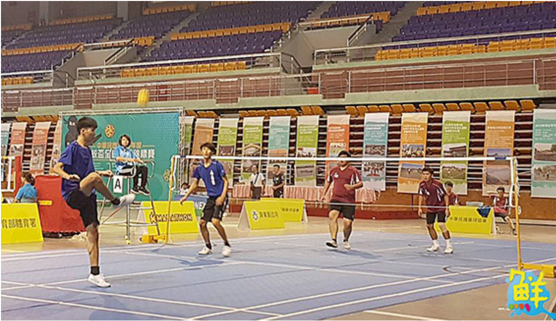
▲嘉藥藤球隊(藍衣)鬥志高昂，勇奪二人賽冠軍

舉辦總統盃錦標賽，就是要積極推廣藤球運動，提升競技水準並選拔優秀選手，未來進軍國際體壇。