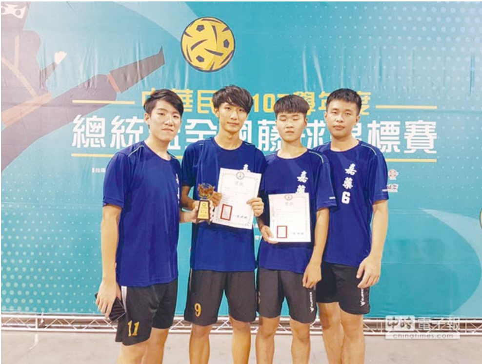
嘉藥藤球隊。