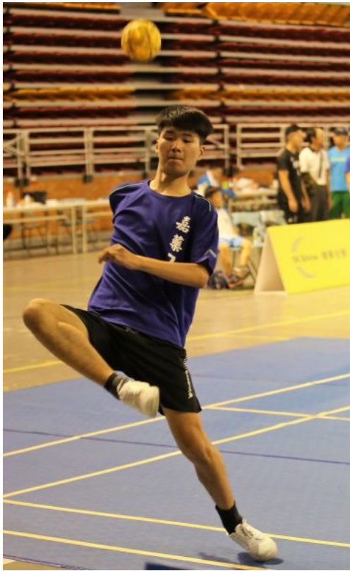
嘉藥A羅上祐防守功夫到位

實力堅強的嘉藥持續在大專男三人賽往前挺進，預賽除遭遇大仁B以21：19、14：21、15：13三局勝出外，另兩役皆以直落二取勝台師大A、台師大C，進入四強戰後，再次以21：6、21：16打敗台師大A，一舉取得21日冠軍戰鬥票，對手將是睽違5年再闖決賽的台北海大（前身台北海洋學院）。