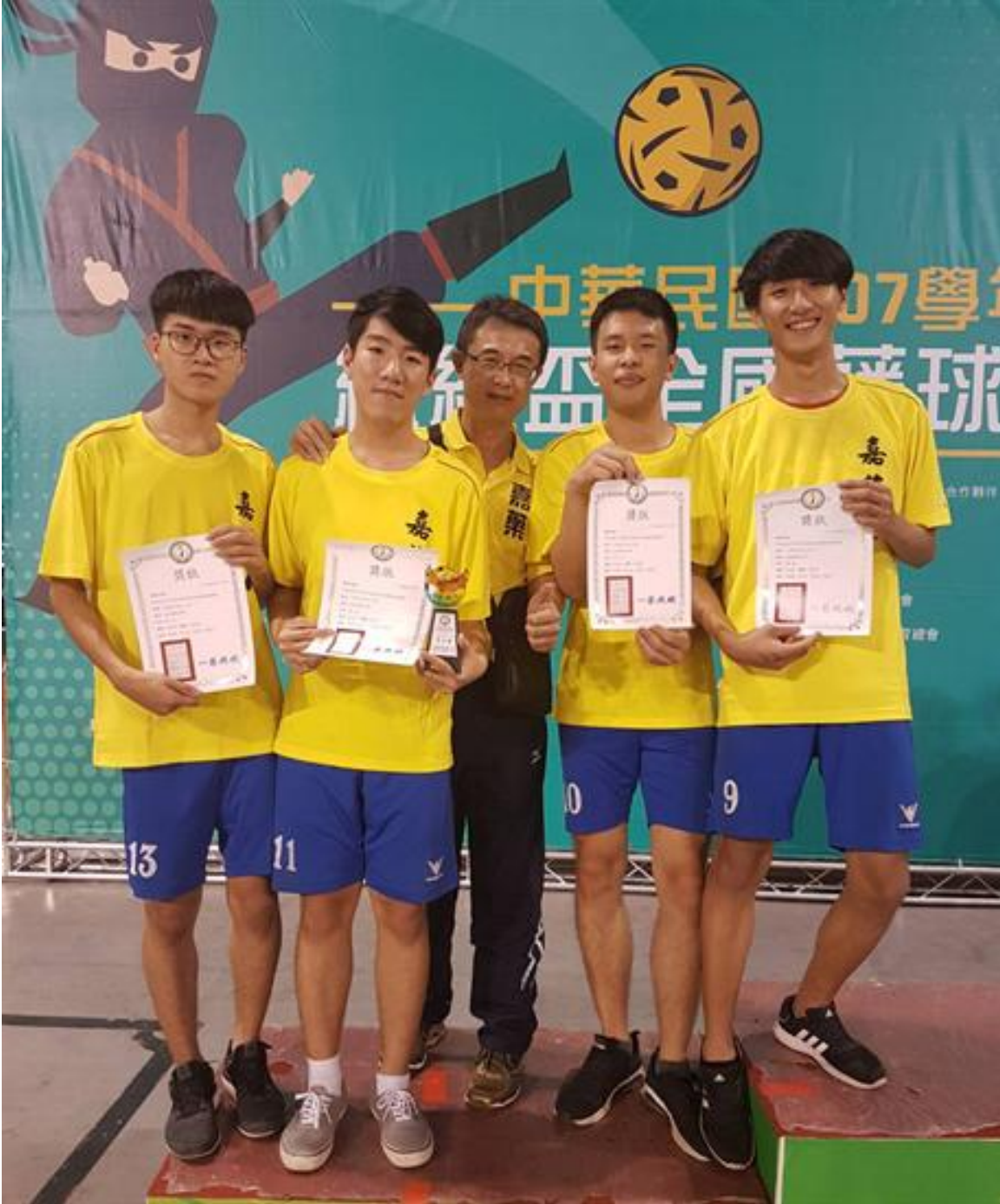
總統盃藤球錦標賽 嘉藥穿金戴銀

(中央社訊息服務20181023 09:54:26)107學年度總統盃全國藤球錦標賽，日前於屏東縣立體育館連賽3天。21日完成所有賽程，來自台南的嘉南藥理大學藤球隊，展現高超的腳下功夫與拼鬥精神；首次參賽就在二人組和三人組分別摘下冠、亞軍，今天凱旋返校，受到師生熱烈歡迎及祝賀，亮眼表現，全校引以為傲。