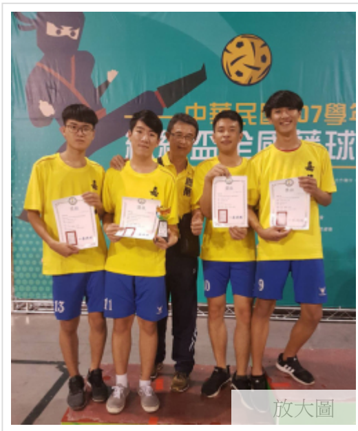
總統盃藤球錦標賽 嘉藥穿金戴銀

(中央社訊息服務20181023 09:54:26)107學年度總統盃全國藤球錦標賽，日前於屏東縣立體育館連賽3天。21日完成所有賽程，來自台南的嘉南藥理大學藤球隊，展現高超的腳下功夫與拼鬥精神；首次參賽就在二人組和三人組分別摘下冠、亞軍，今天凱旋返校，受到師生熱烈歡迎及祝賀，亮眼表現，全校引以為傲。