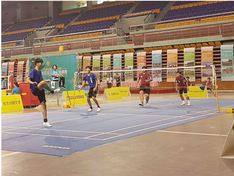
嘉南藥理大學藤球隊（藍衣）勇奪總統盃二人組冠軍。

嘉南藥理大學藤球隊在日前舉行的一〇七學年度總統盃全國藤球錦標賽，分別獲得二人組冠軍和三人組亞軍，第一次參賽就得獎，表現亮眼。