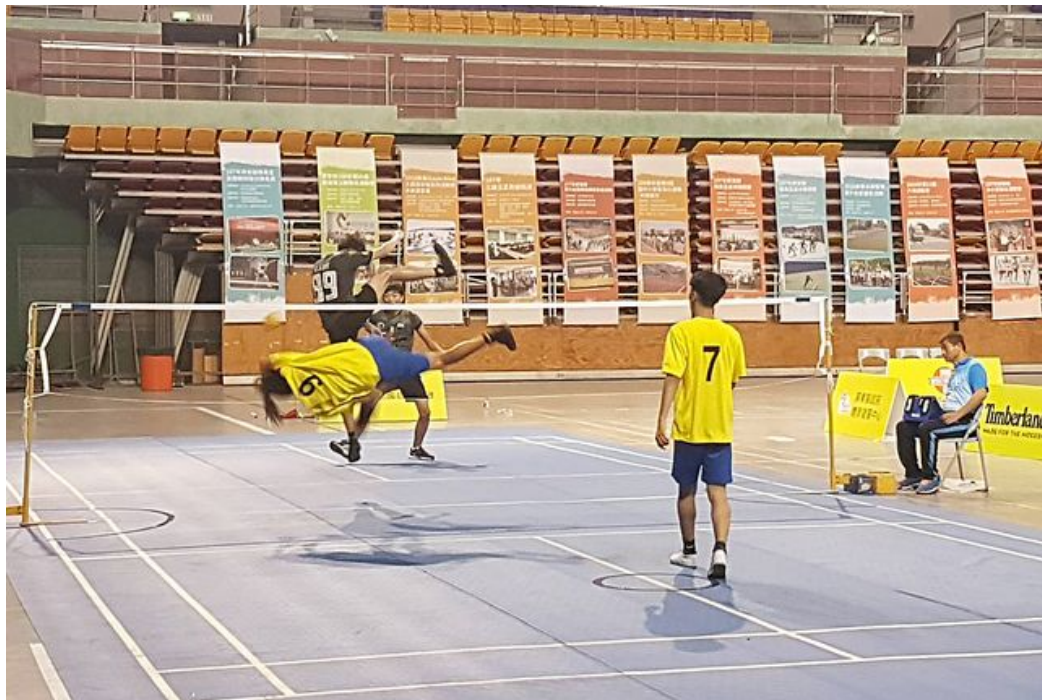
嘉藥藤球隊(黃衣)卯足「腳」力殺球。