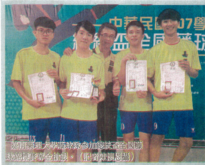
嘉南藥理大學藤球隊參加總統盃全國藤球錦標賽奪金搶銀。