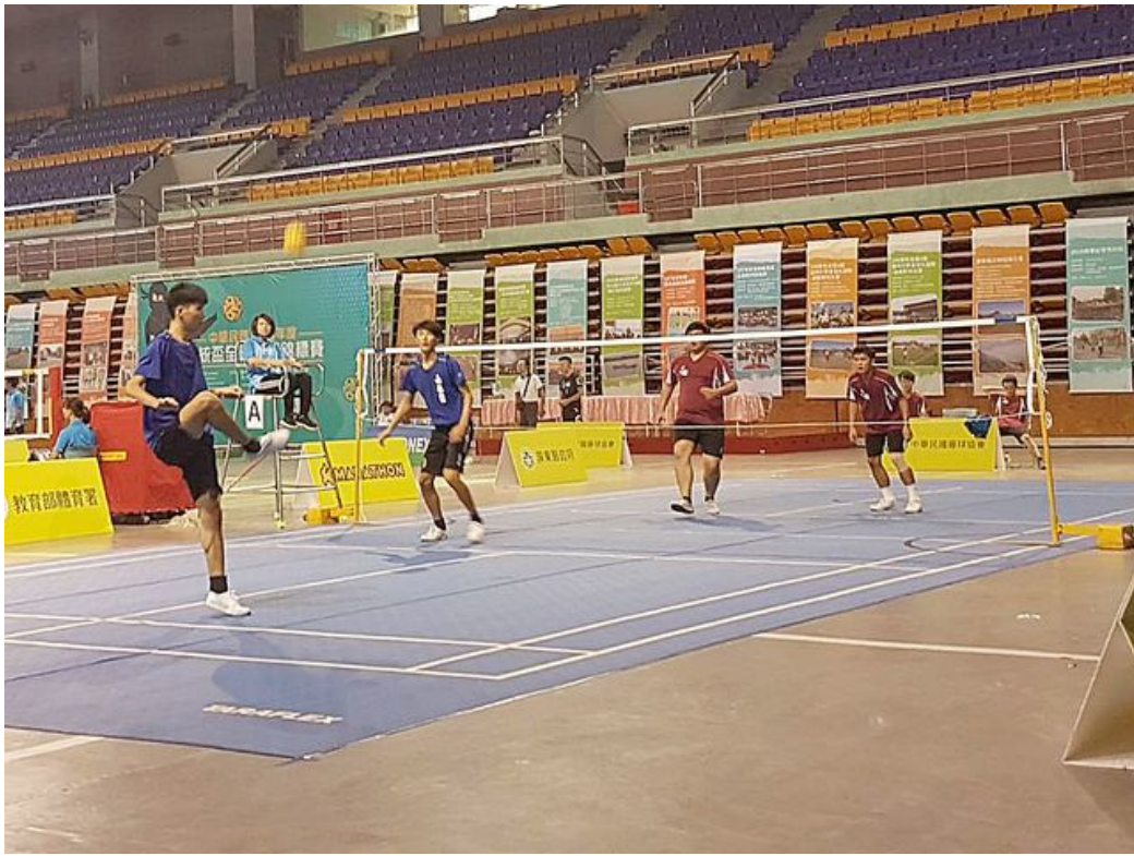
嘉藥藤球隊(藍衣)鬥志高昂，勇奪二人賽冠軍。