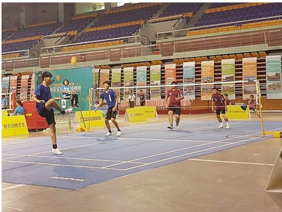
嘉藥藤球隊(藍衣)鬥志高昂，勇奪二人賽冠軍。