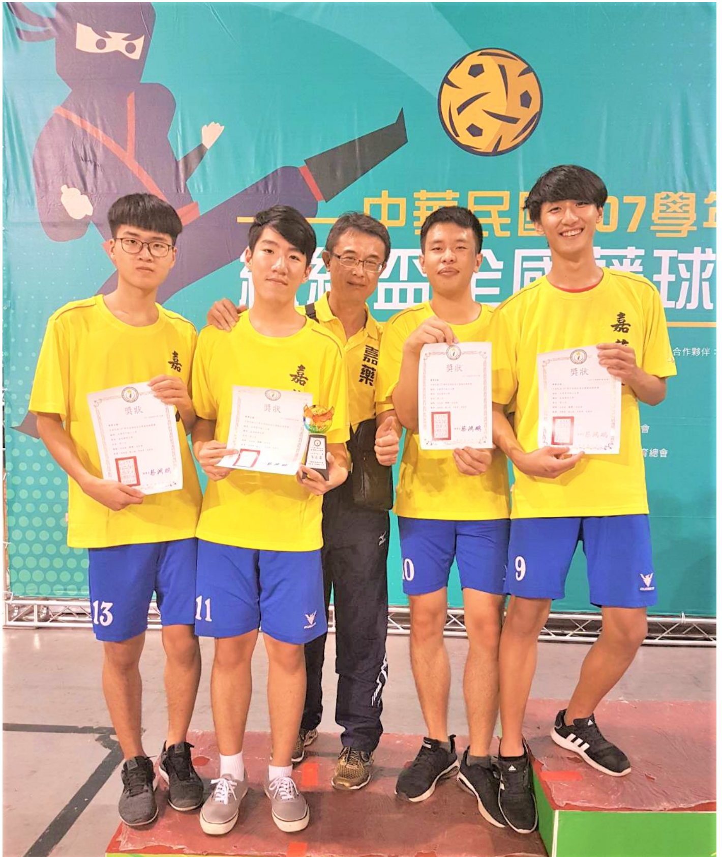
嘉南藥理大學藤球隊參加總統盃全國藤球錦標賽奪金搶銀。