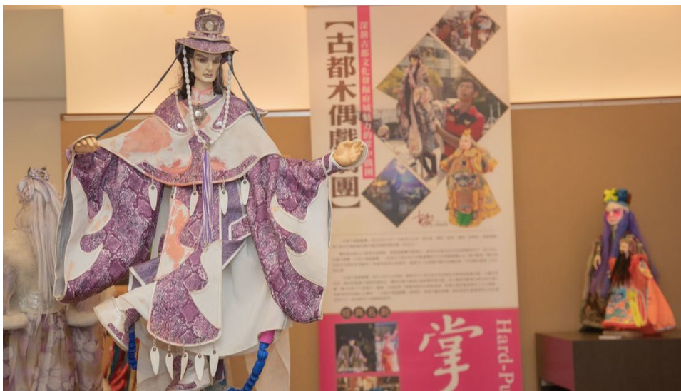
精彩活動新聞剪影