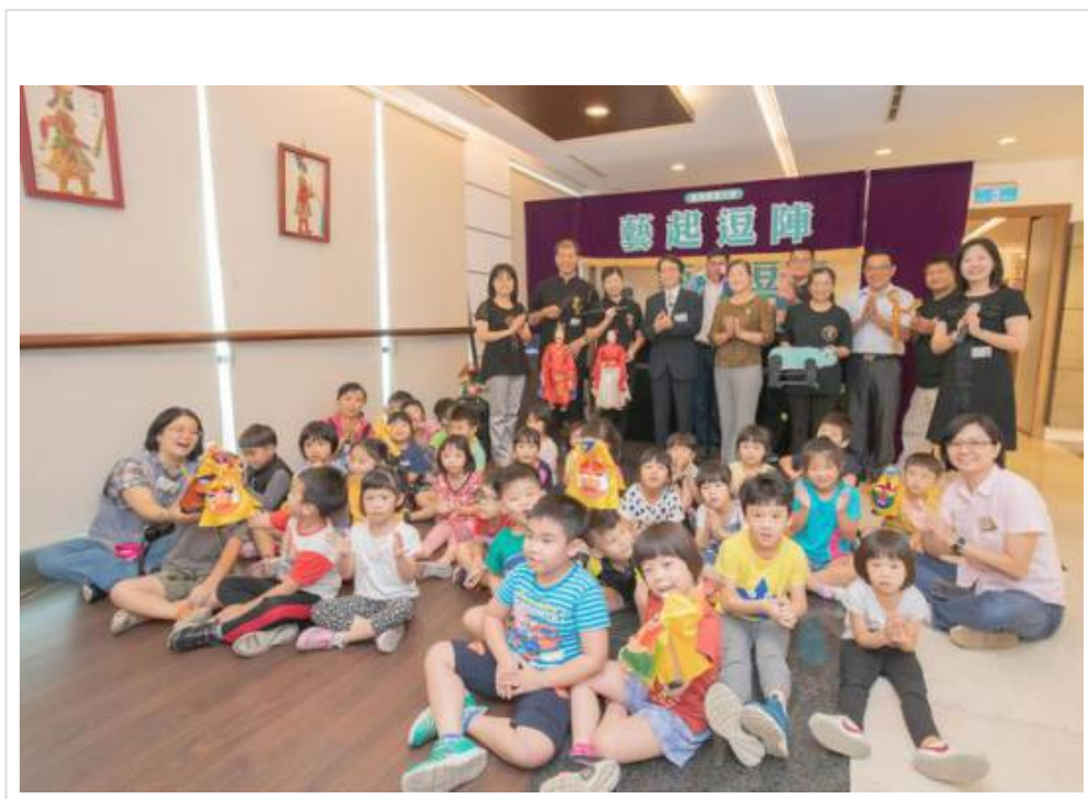
圖6：小朋友開心舞弄布袋戲偶。