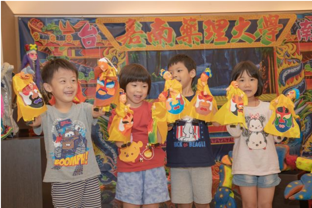
小朋友開心舞弄布袋戲偶。

喜歡偶戲的民眾有福了，台灣三大知名偶戲團體同時尬台飆演，他們百年傳承下來的偶戲文物，細覽其歷史脈絡、品味文化底蘊、體會傳藝精髓，這些千載難逢的機會，都在嘉南藥理大學可以親身感受。嘉藥文化藝術館10月18日起舉辦「藝起逗陣-偶戲百年風華特展」，邀請台灣三大傳統偶戲團體：錦飛鳳傀儡戲劇團、永興樂皮影劇團及古都木偶戲劇團共同參與展出。