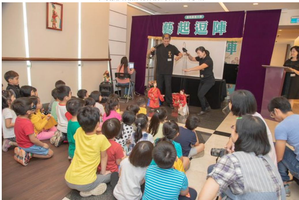
嘉藥幼兒園小朋友圍坐在戲台下開心看戲。