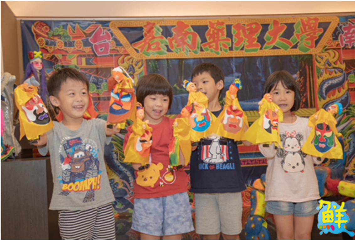
▲小朋友們開心的舞弄布袋戲偶。

嘉藥校長陳鴻助表示，傀儡戲、皮影戲及掌中戲為台灣三大傳統偶戲，南台灣尤其是發展重鎮，近年來本土文化備受重視，台灣傳統戲曲也在創新與傳承上不斷努力蛻變；今天有幸看到三大偶戲團齊聚展演，將百年偶戲歷史以全方位視野完整呈現，確實機會難逢。