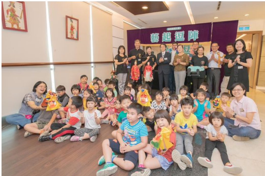
嘉藥文化藝術館今起舉辦「藝起逗陣-偶戲百年風華特展」。