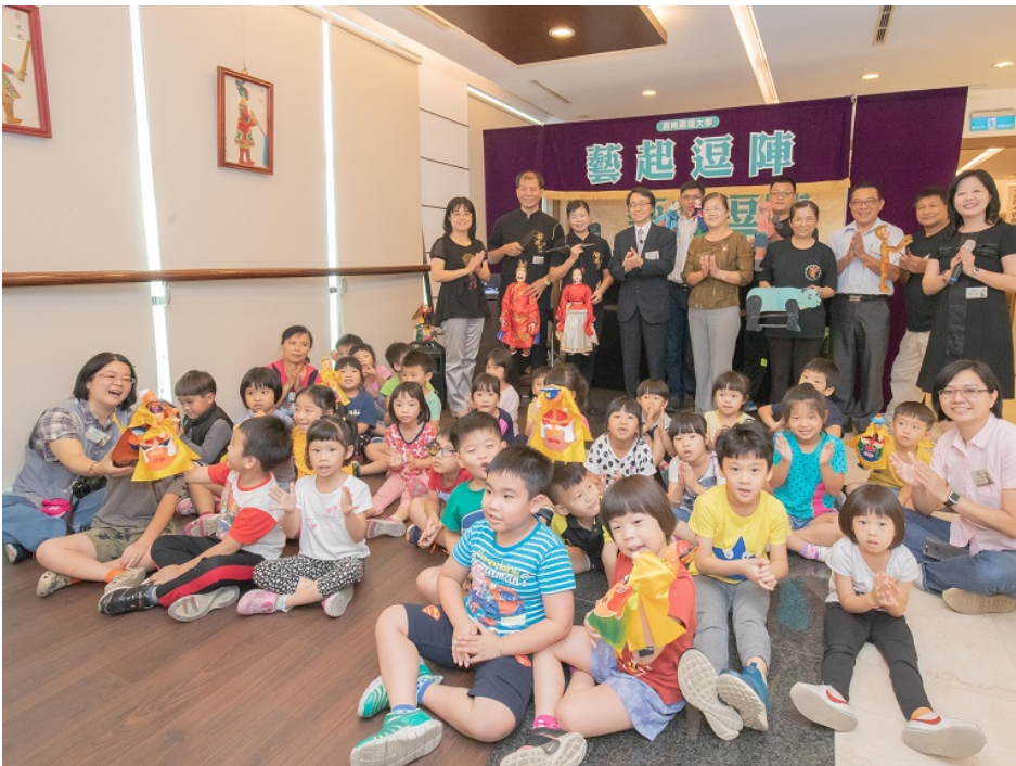
▲參加「藝起逗陣-偶戲百年風華特展」與會者合影。

今天舉行開幕茶會，三團同台亮相獻藝，搭配聲光視覺震撼與體驗互動，現場金光閃閃、瑞氣千條、熱鬧滾滾，帶領大家彷彿走入傳統偶戲的時光隧道，再度回味昔日戲台下的純真笑顏，也見證傳統與現代精緻手作工藝的奧妙。