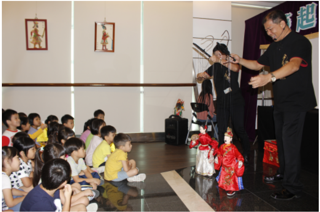
嘉南藥理大學文化藝術館舉辦「藝起逗陣—偶戲百年風華特展」，安排錦飛鳳傀儡戲劇團到場表演。

嘉南藥理大學文化藝術館十八日起舉辦「藝起逗陣—偶戲百年風華特展」，邀請台灣三大傳統偶戲團體錦飛鳳傀儡戲劇團、永興樂皮影劇團及古都木偶戲劇團共同參與展出。展示他們百年傳承下來的偶戲文物，讓參觀者細覽其歷史脈絡、品味文化底蘊、體會傳藝精髓。