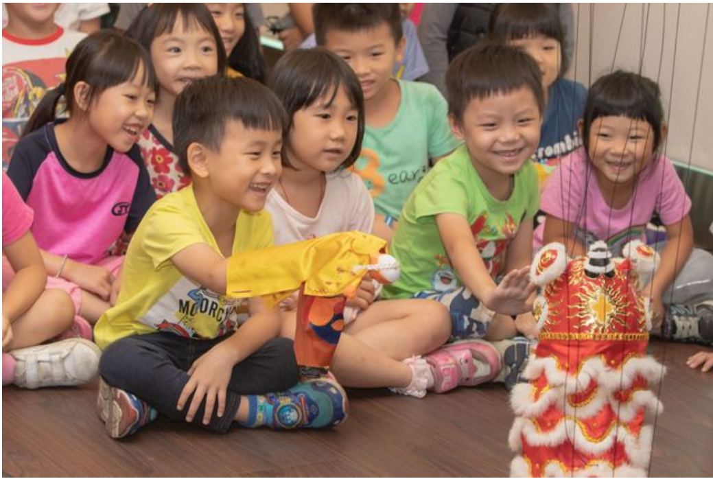
小朋友開心與魁儡戲偶互動。