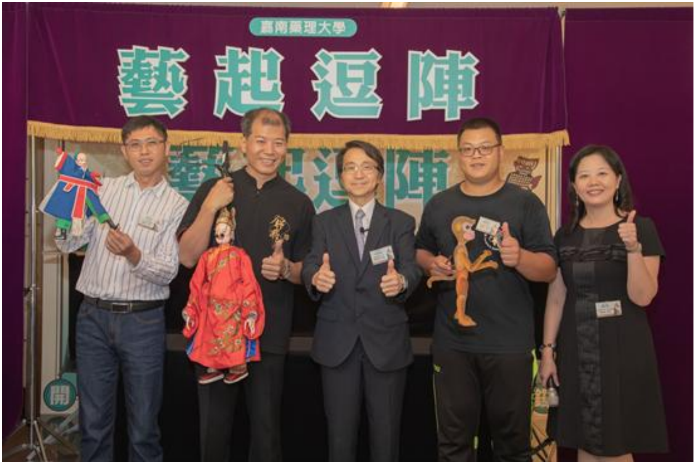
嘉藥邀你來看戲 三大偶團同台尬演 大開眼界

(中央社訊息服務20181019 09:11:01)你看過台灣三大知名偶戲團體同時尬台飆演嗎？他們百年傳承下來的偶戲文物，細覽其歷史脈絡、品味文化底蘊、體會傳藝精髓，這些千載難逢的機會，都在嘉南藥理大學可以親身感受。該校文化藝術館10月18日起舉辦「藝起逗陣-偶戲百年風華特展」，邀請台灣三大傳統偶戲團體：錦飛鳳傀儡戲劇團、永興樂皮影劇團及古都木偶戲劇團共同參與展出。