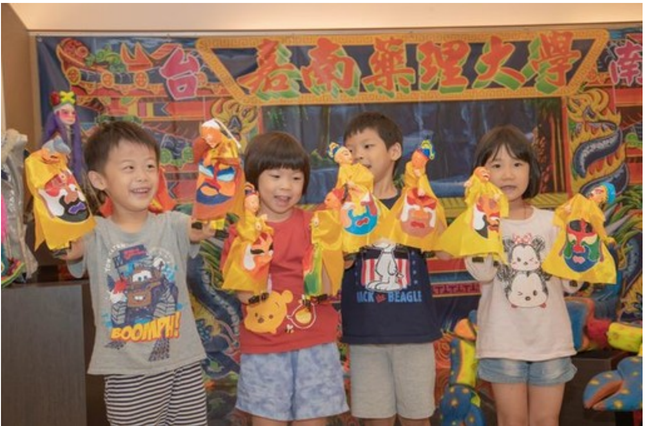
小朋友開心舞弄布袋戲偶。喜歡偶戲的民眾有福了，台灣三大知名偶戲團體同時尬台飆演，他們百年傳承下來的偶戲文物，細覽其歷史脈絡、品味文化底蘊、體會傳