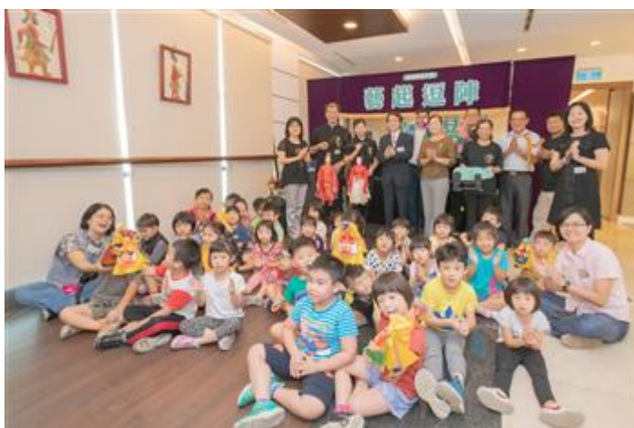
參加「藝起逗陣-偶戲百年風華特展」與會者合影

「錦飛鳳傀儡戲劇團」1920年創立，發跡於高雄市阿蓮區，四代相傳已近百年，在傳承基礎上各自有所發展與創新，是台灣唯一的職業傀儡戲劇團，亦為官方登錄之無形文化資產。擅長宗教儀式及文化展演，經常活躍於國內外舞台，並致力於傳統傀儡戲的傳承、推廣、保存與發揚，堪稱台灣最具代表性的傀儡劇團。今年9月，甫受邀至德國易北·埃爾斯特縣「第20屆國際偶戲節」，擔綱演出開幕首場節目，精湛技藝，獲得滿堂喝采；10月，高雄衛武營國家藝術文化中心正式啟用，錦飛鳳也受邀在謝土暨開台儀式演出，為台灣文化界盛事增添佳話。