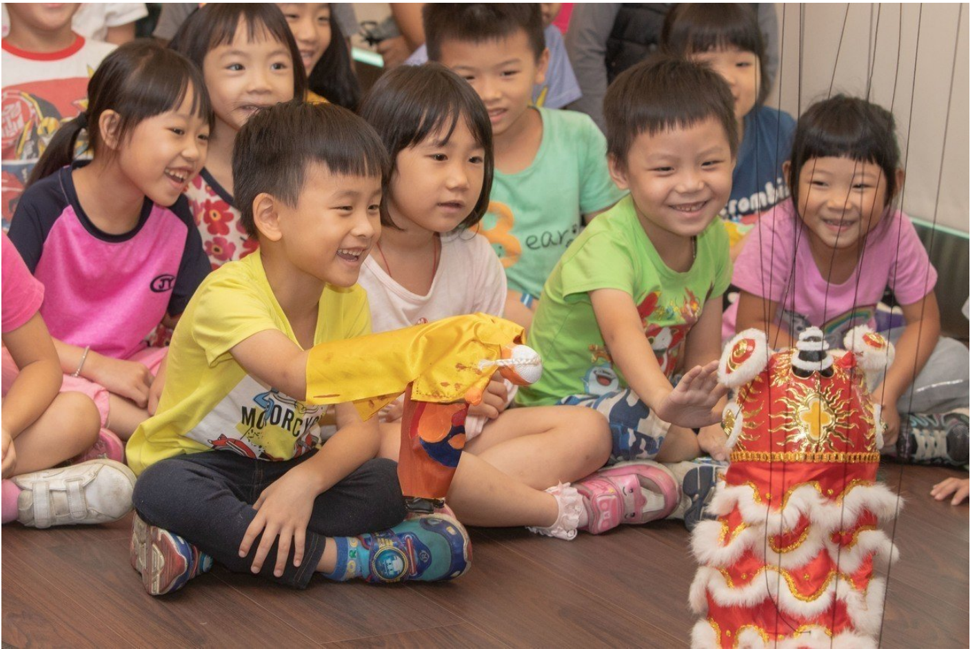
嘉南藥理大學10月18日起舉辦「藝起逗陣-偶戲百年風華特展」，邀請台灣三大傳統偶戲團體，「錦飛鳳傀儡戲劇團」、「永興樂皮影劇團」與「古都木偶戲劇團」共同參展。