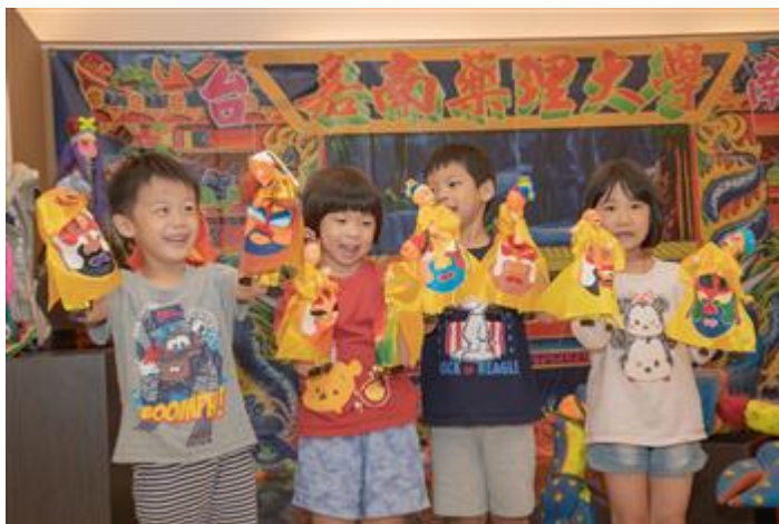
小朋友開心舞弄布袋戲偶

(中央社訊息服務20181019 09:11:01) 你看過台灣三大知名偶戲團體同時尬台飆演嗎？他們百年傳承下來的偶戲文物，細覽其歷史脈絡、品味文化底蘊、體會傳藝精髓，這些千載難逢的機會，都在嘉南藥理大學可以親身感受。該校文化藝術館10月18日起舉辦「藝起逗陣-偶戲百年風華特展」，邀請台灣三大傳統偶戲團體：錦飛鳳傀儡戲劇團、永興樂皮影劇團及古都木偶戲劇團共同參與展出。