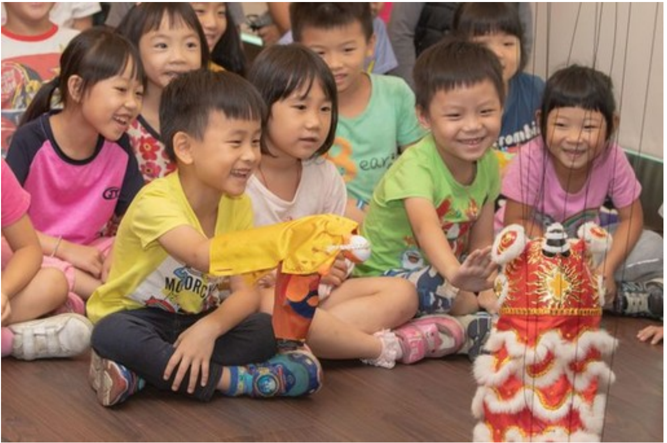
小朋友開心與魁儡戲偶互動。