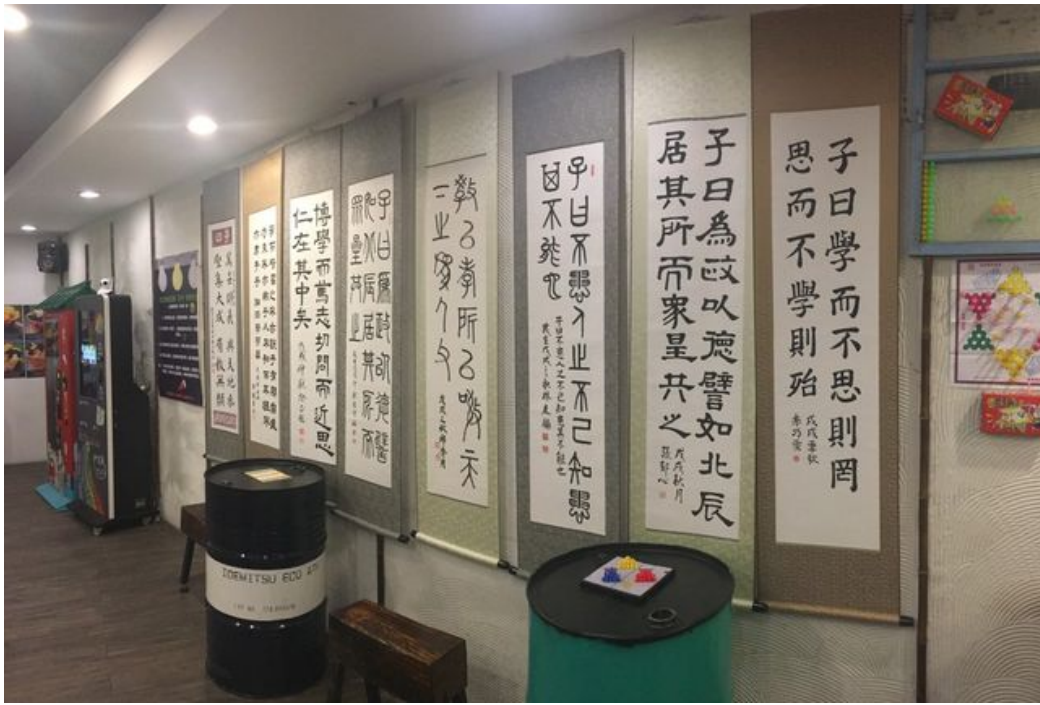
踏查活動同時也舉辦書法競賽，書法作品於拖拉庫IG truck 265展覽至11月24日。

以「全台首學」台南孔廟為軸心，輻輳環圍的古蹟與文學美術館等，建構了獨特的文化網絡。嘉南藥理大學日前主辦兩梯次「孔廟文化園區踏查活動」，引領社區民眾結伴同遊，共賞在自然與人文並存、傳統與現代交融下，府城孔廟文化園區魅力無窮的絕代風華。