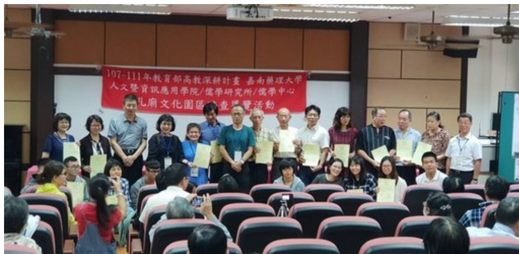
書法比賽得獎者合影。