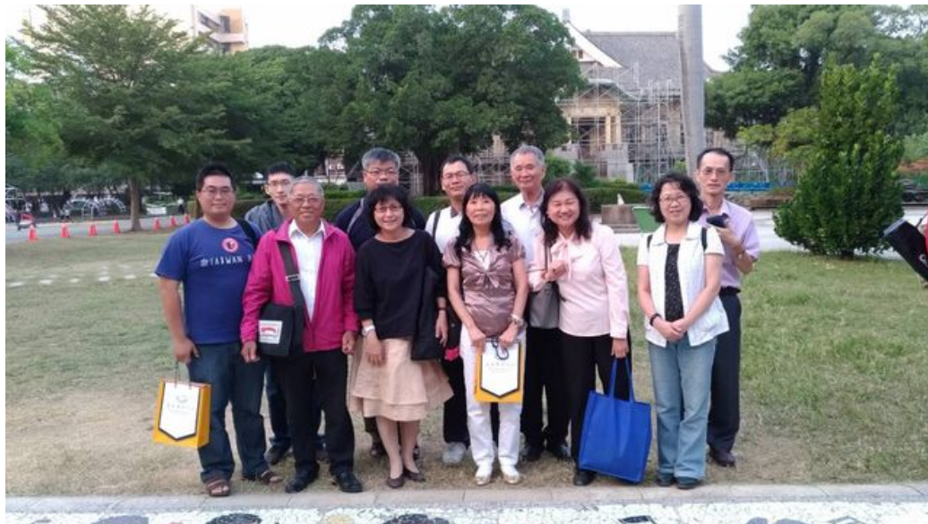
嘉藥主辦孔廟園區踏查活動讓民眾更深刻體會多元豐富的古都文化。