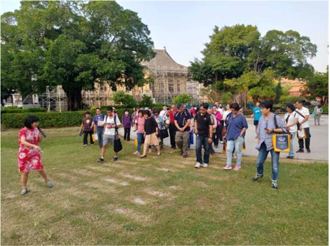
逗陣共賞府城風華 嘉藥主辦孔廟園區踏查活動

(中央社訊息服務20181112 09:48:24)以「全台首學」台南孔廟為軸心，輻輳環圍的古蹟與文學美術館等，建構了獨特的文化網絡。嘉南藥理大學日前主辦兩梯次「孔廟文化園區踏查活動」，引領社區民眾結伴同遊，共賞在自然與人文並存、傳統與現代交融下，府城孔廟文化園區魅力無窮的絕代風華。