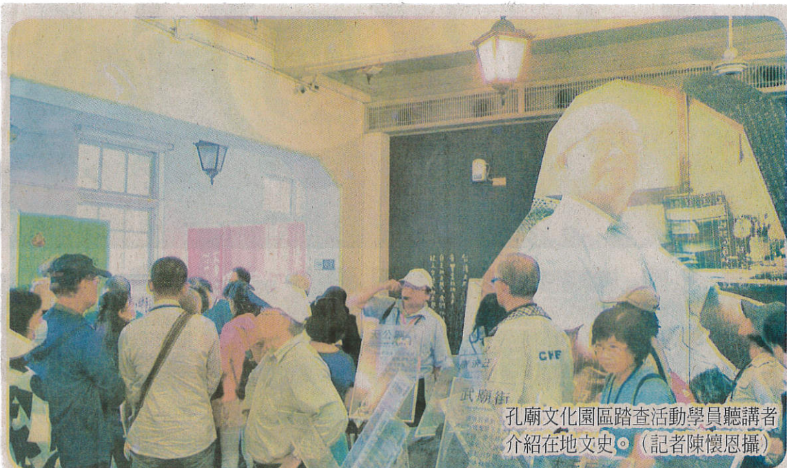
孔廟文化園區踏查活動學員聽講者介紹在地文史。