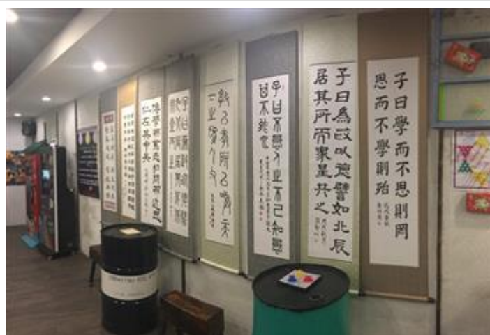
踏查活動同時也舉辦書法競賽，書法作品於拖拉庫IG truck