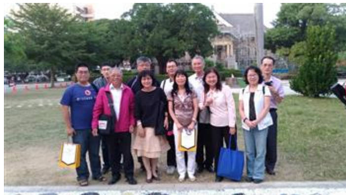
嘉藥主辦孔廟園區踏查活動讓民眾更深刻體會多元豐富的古都文化