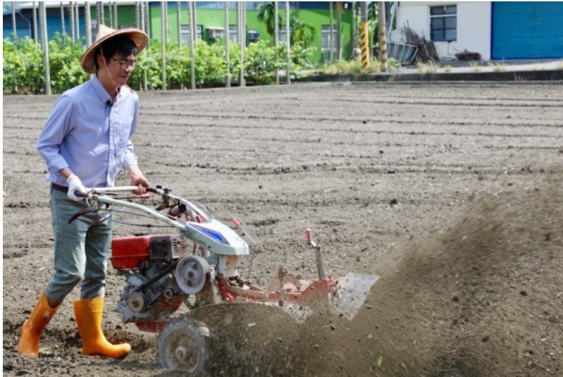
20多位學術界領袖發起連署，呼籲高雄人票投陳其邁（見圖），守護高雄、繼續豐富高雄。