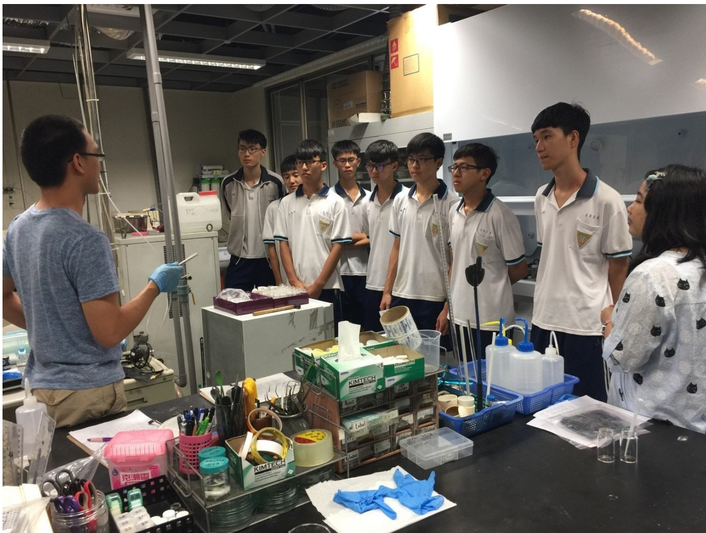
新化高中高三學生參觀成大實驗室。