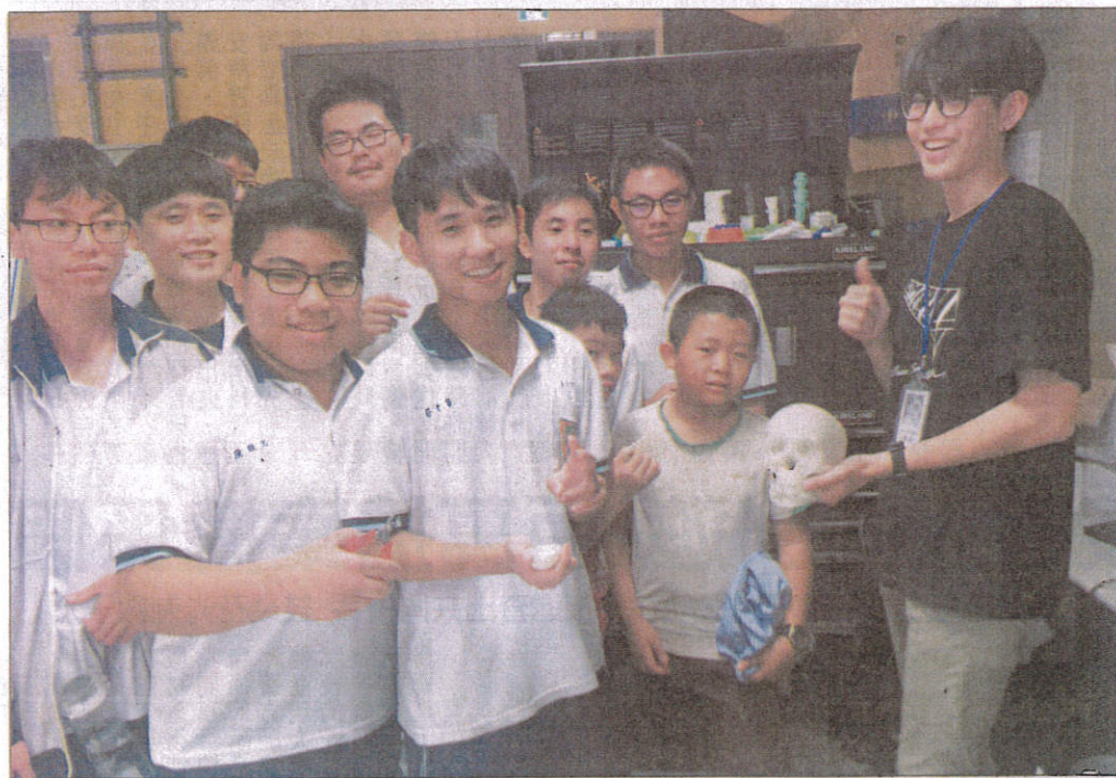
↑新化高中學生參訪成大材料系的3D列印實驗室。