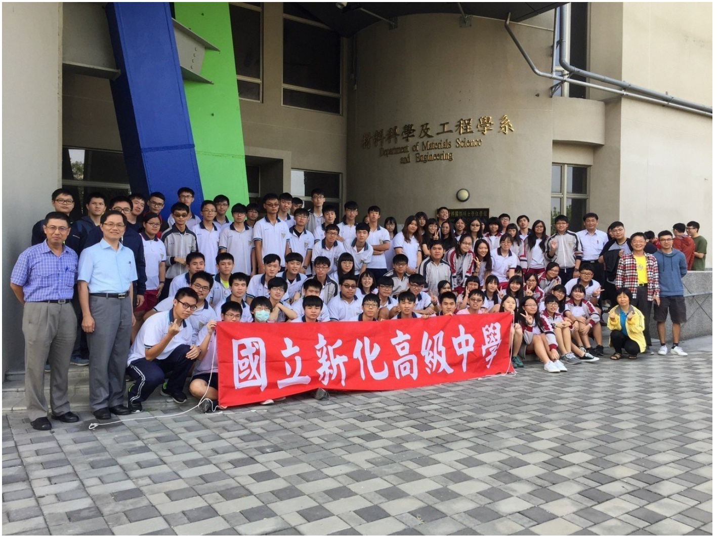
新化高中安排今年高三應屆畢業生到各大學校系參觀。