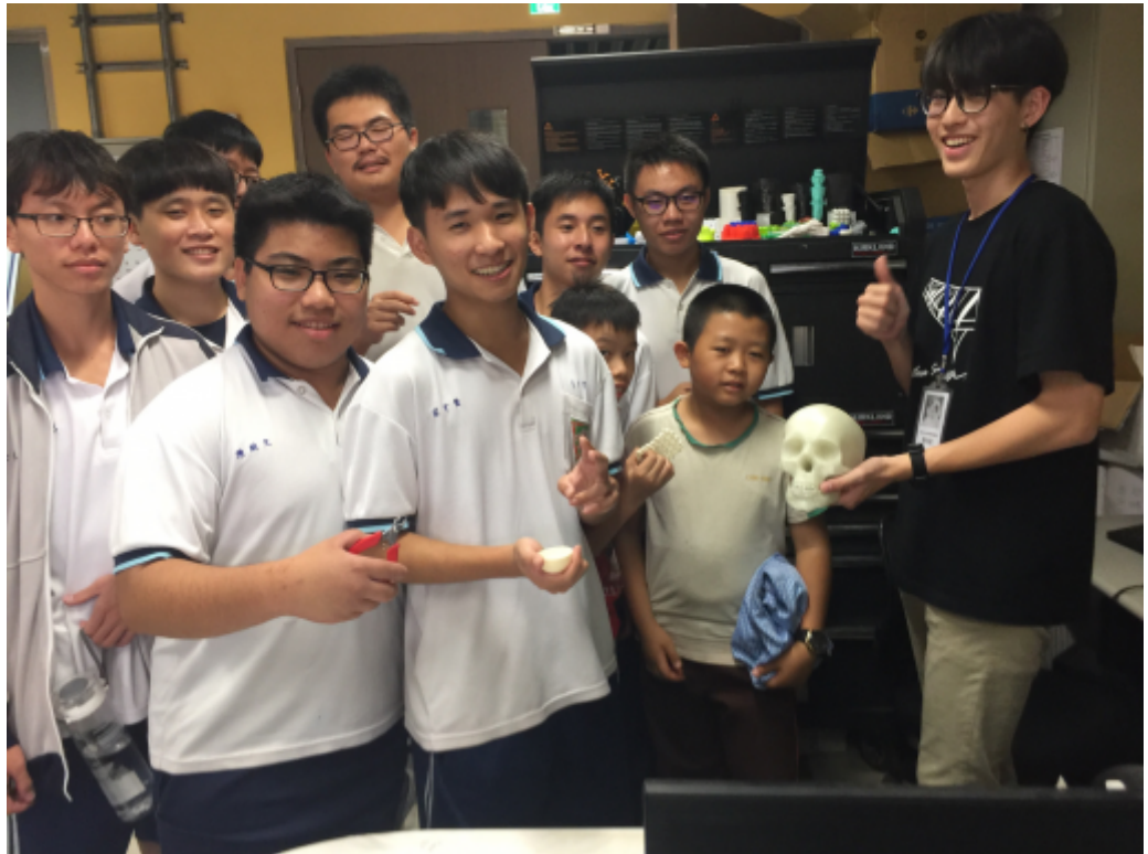
新化高中學生參訪成大材料系的3D列印實驗室。

新化高中二十一日安排高三學生參訪台南附近的大學院校，做為未來升學選填志願的參考。由學生從八所公私立大學中挑選想參訪的一所學校，但待遇有別，參訪成大要自付車資，部分私校則會補助車資，讓學生提前感受不同級別學校的不同待遇。