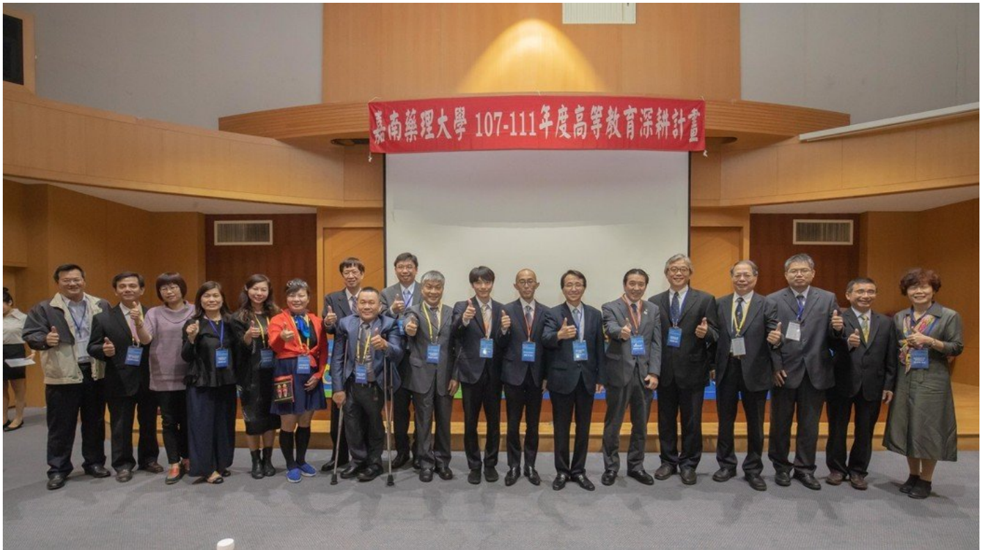
全國各地藥師公會理事長特地參與共襄盛舉。