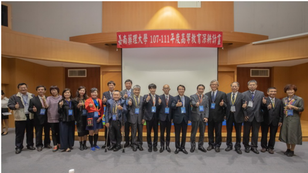
全國各地藥師公會理事長特地參與共襄盛舉