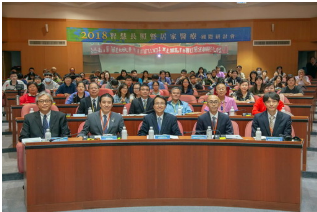
嘉藥舉辦智慧長照居家醫療研討會，吸引眾多台日學者參加