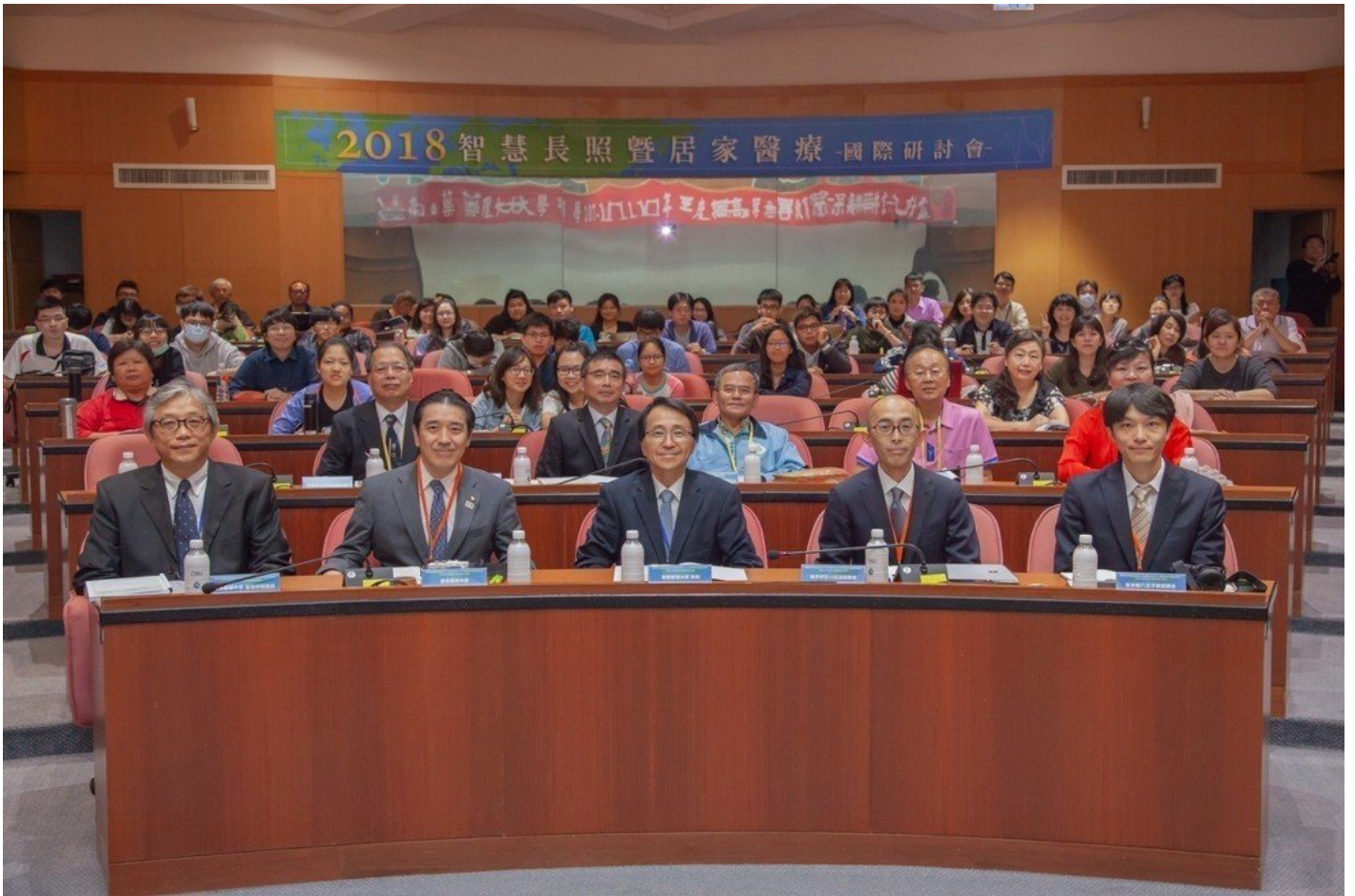
嘉藥舉辦智慧長照居家醫療研討會，吸引眾多台日學者參加。