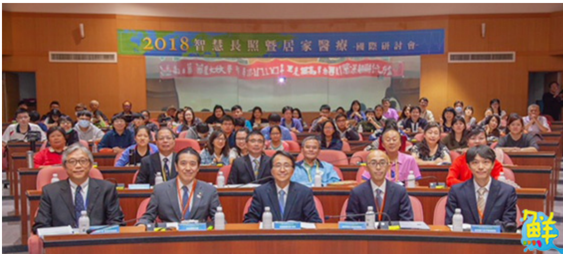
▲嘉藥舉辦智慧長照居家醫療研討會，吸引眾多台日學者參加。

與會者除兩校學者師生外，也包括台灣與日本醫藥產業界人士，雙方針對智慧長照及居家醫藥服務等議題，透過相互切磋探討，激盪出產學交流的智慧火花。