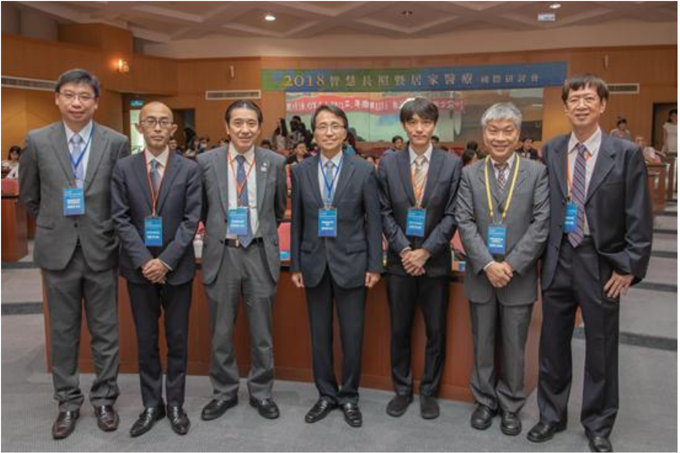
台日共商智慧長照醫藥服務 嘉藥舉辦國際研討會

(中央社訊息服務20181130 10:10:36)面對全球高齡化社會來臨，各國無不積極規劃相關政策，以防範及解決人口老化所衍生的社會問題；尤其因應年長者的照護需求，建立長照服務體系，並整合居家照護網絡，皆是刻不容緩的課題。為此，在台灣素以「藥學」聞名的嘉南藥理大學和日本的東京藥科大學，11月29日於嘉藥國際會議中心，共同舉辦「智慧長照暨居家醫療國際研討會」。與會者除兩校學者師生外，也包括台灣與日本醫藥產業界人士，雙方針對智慧長照及居家醫藥服務等議題，透過相互切磋探討，激盪出產學交流的智慧火花。