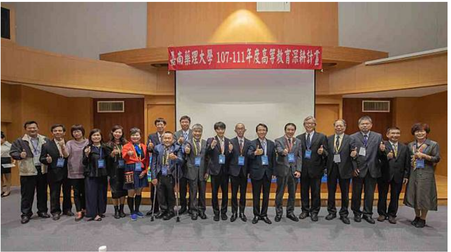
圖／全國各地藥師公會理事長特地參與共襄盛舉。

東京藥科大學常務理事松本有右，講述日本藥學教育與藥局調劑業務的變遷，對於處在超高齡社會的日本，剖析地區藥局和藥師在照護體系中應扮演的角色與功能；他特別舉日本八王子醫藥中心為例，說明藥局調劑系統及日本未來的藥局形象，對於台日學術界聯合產業界，如何攜手推動高齡社會藥事服務，頗具啟發性。