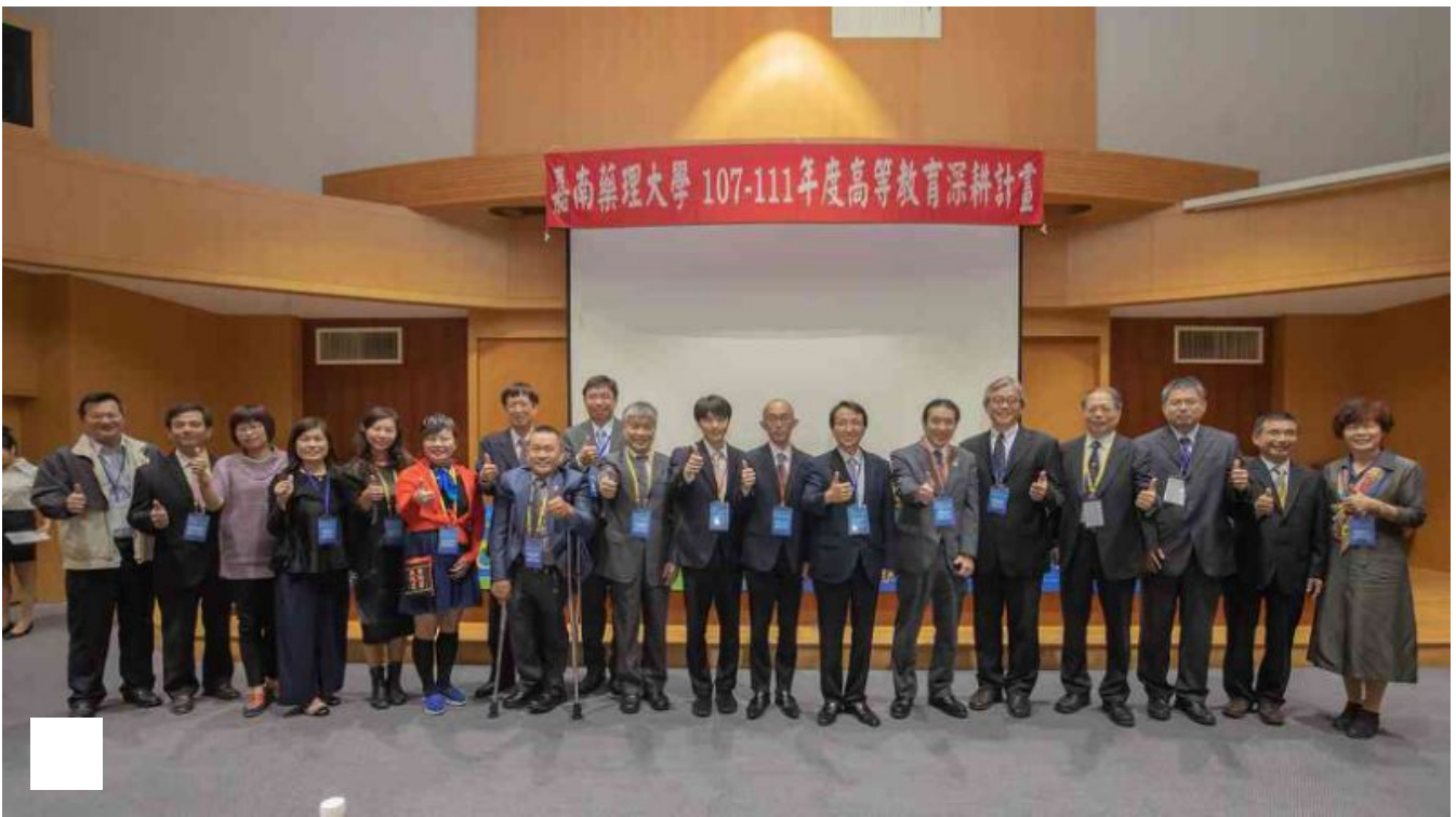
圖／全國各地藥師公會理事長特地參與共襄盛舉。

東京藥科大學常務理事松本有右，講述日本藥學教育與藥局調劑業務的變遷，對於處在超高齡社會的日本，剖析地區藥局和藥師在照護體系中應扮演的角色與功能；他特別舉日本八王子醫藥中心為例，說明藥局調劑系統及日本未來的藥局形象，對於台日學術界聯合產業界，如何攜手推動高齡社會藥事服務，頗具啟發性。