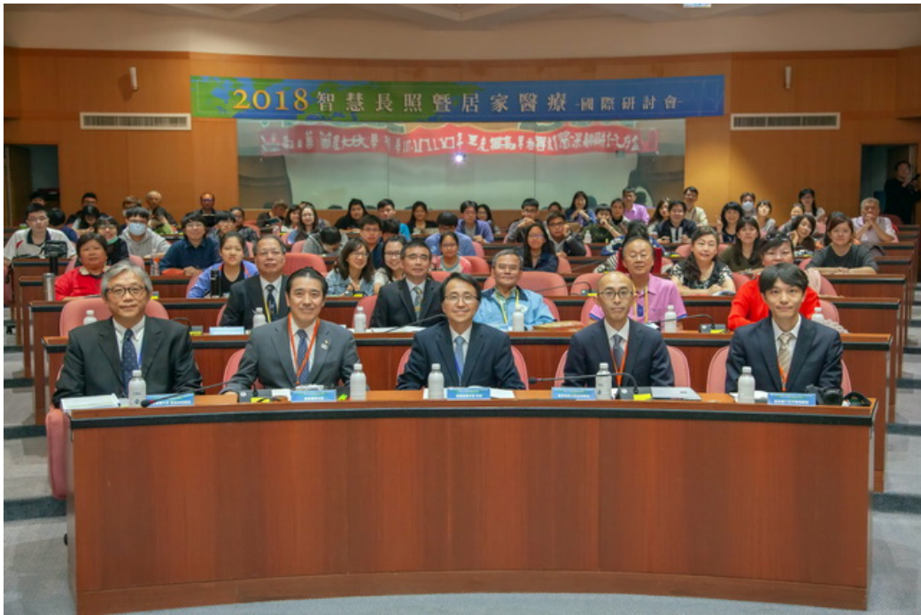
嘉藥舉辦智慧長照居家醫療研討會，吸引眾多台日學者參加

http://www.cntimes.info 2018-11-29 16:28:51