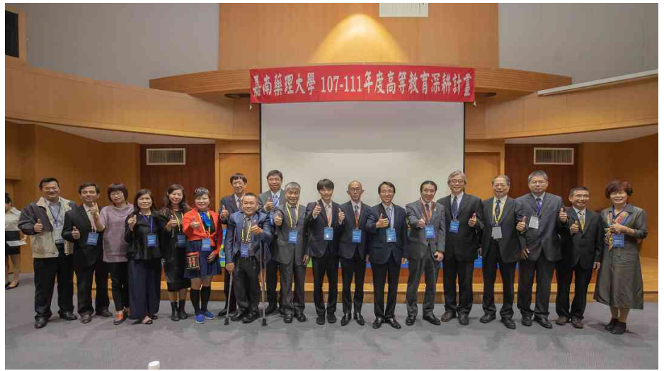
圖／全國各地藥師公會理事長特地參與共襄盛舉。

東京藥科大學常務理事松本有右，講述日本藥學教育與藥局調劑業務的變遷，對於處在超高齡社會的日本，剖析地區藥局和藥師在照護體系中應扮演的角色與功能；他特別舉日本八王子醫藥中心為例，說明藥局調劑系統及日本未來的藥局形象，對於台日學術界聯合產業界，如何攜手推動高齡社會藥事服務，頗具啟發性。