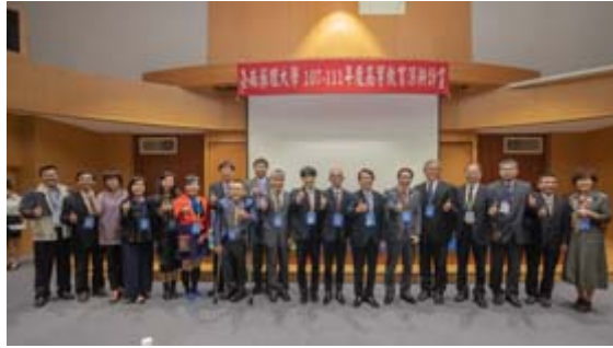
全國各地藥師公會理事長特地參與共襄盛舉。

【記者孫宜秋／南市報導】面對全球高齡化社會來臨，各國無不積極規劃相關政策，以防範及解決人口老化所衍生的社會問題；尤其因應年長者的照護需求，建立長照服務體系，並整合居家照護網絡，皆是刻不容緩的課題。為此，在台灣素以「藥學」聞