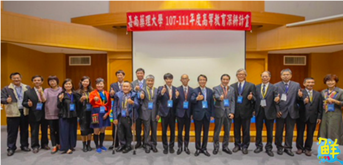
▲全國各地藥師公會理事長特地參與共襄盛舉。

能；他特別舉日本八王子醫藥中心為例，說明藥局調劑系統及日本未來的藥局形象，對於台日學術界聯合產業界，如何攜手推動高齡社會藥事服務，頗具啟發性。