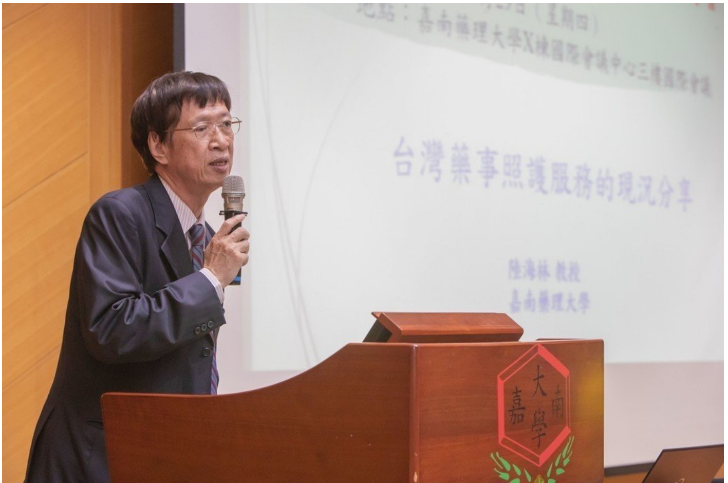
嘉藥陸海林教授會中分享台灣藥事照護服務現況。