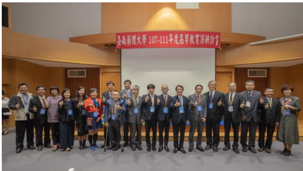
全國各地藥師公會理事長特地參與共襄盛舉