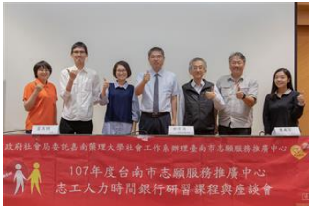
嘉藥社工系舉辦志工時間人力銀行經驗分享座談會，與會貴賓合影