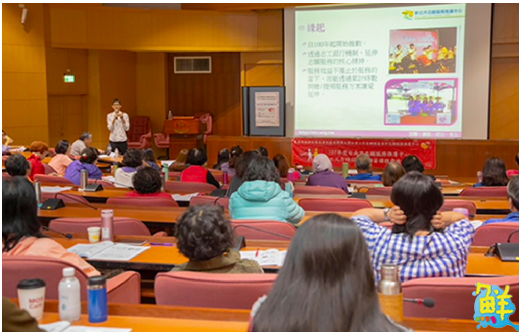
▲嘉藥社工系舉辦志工時間人力銀行經驗分享座談會，吸引眾多專家學者參加。

盧老師進一步指出，中央衛福部近期正在評估建立台版時間銀行的可行性，但究竟是由政府帶頭做、還是補助民間集團發起，以及有關記錄方法、服務認定、兌換方式等諸多實務問題，尚待各方討論，因此辦理此次研習座談會，期望藉由實際工作者分享推動經驗，大家集思廣益，凝聚共識。