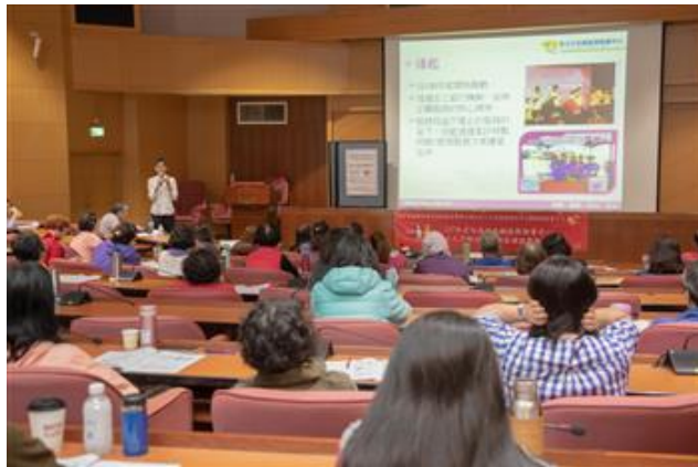
嘉藥社工系舉辦志工時間人力銀行經驗分享座談會，吸引眾多專家學者參加