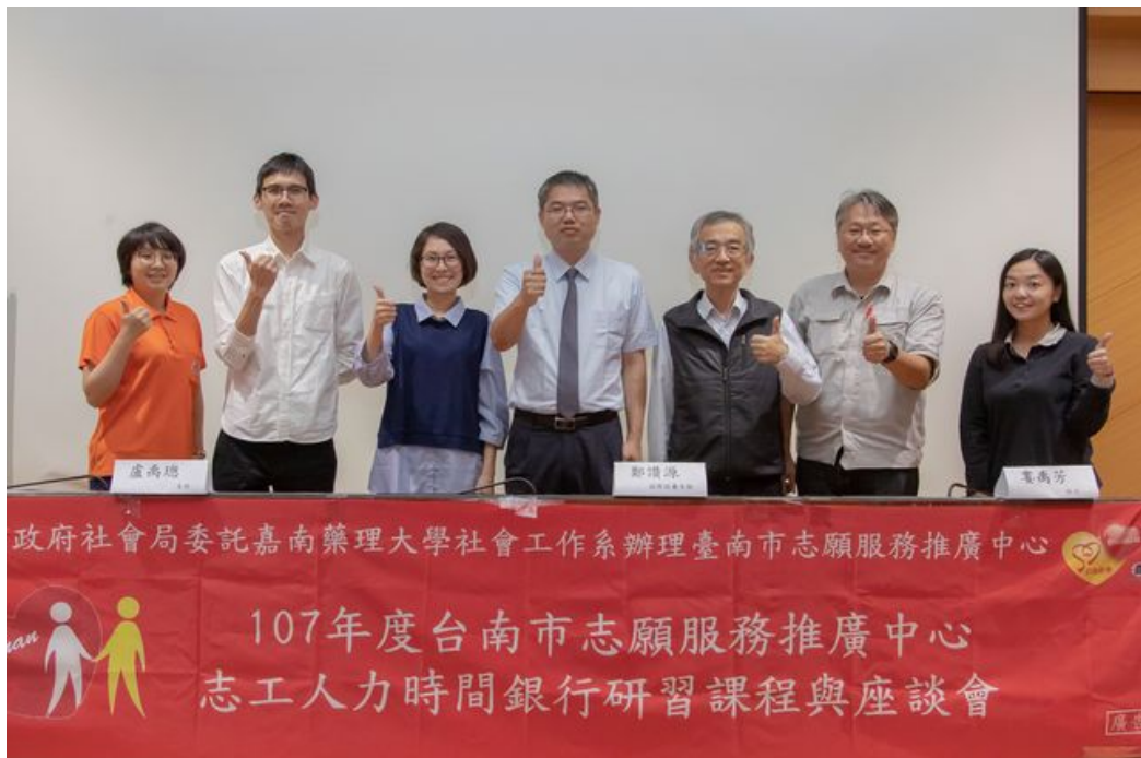
嘉藥社工系舉辦志工時間人力銀行經驗分享座談會，與會貴賓合影。

http://www.cntimes.info 2018-12-04 21:55:39