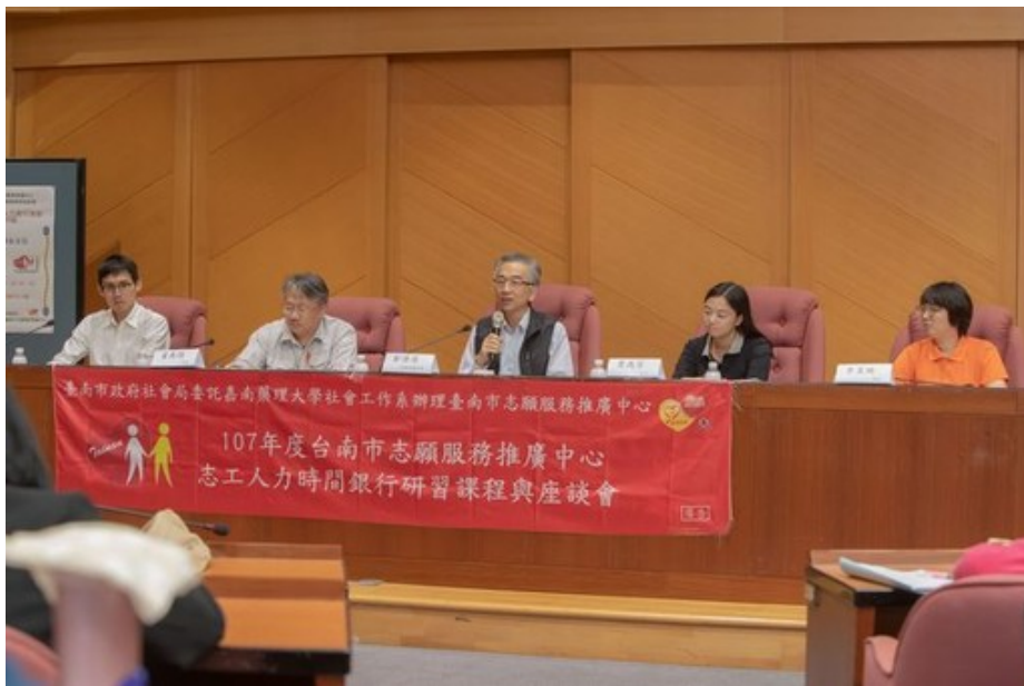
下午座談會邀請專家針對時間人力銀行及高齡者照顧議題相互討論。