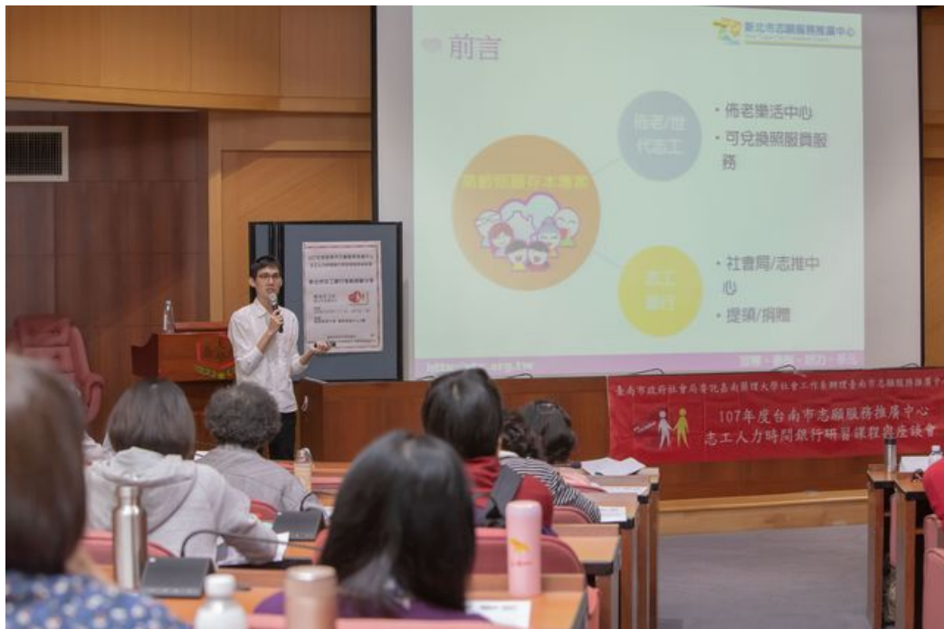
下午座談會邀請專家針對時間人力銀行及高齡者照顧議題相互討論。

以發揮互惠精神的「時間銀行」概念，近年也推展至志工服務領域，因而倡設「志工時間人力銀行」在國際間蔚為風潮。由台南市政府社會局主辦、台南市志願服務推廣中心和嘉南藥理大學社會工作系合辦的「志工時間人力銀行研習課程與座談會」，於12月3日在該校舉行，吸引眾多全國志工幹部參與研討，分享實務推廣經驗，收穫豐盛。