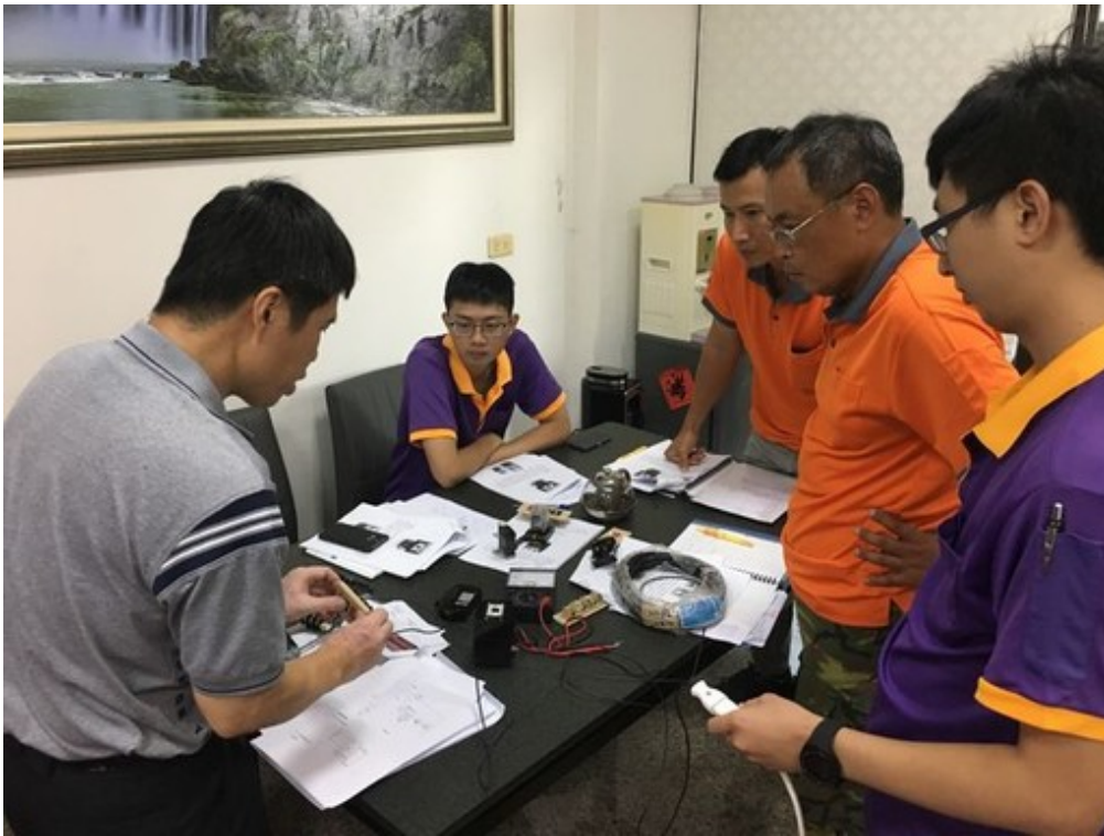
嘉藥輔導朝日能源公司進行工業配線實務。