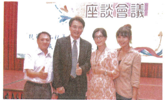
嘉藥參與計畫人員和勞動部雲嘉南分署長柯呈枋（左二）合影。

嘉藥校長陳鴻助說，學校積極配合政府，重視產業人才培育，一直都是雲嘉南區域合作辦訓的優良夥伴，擁