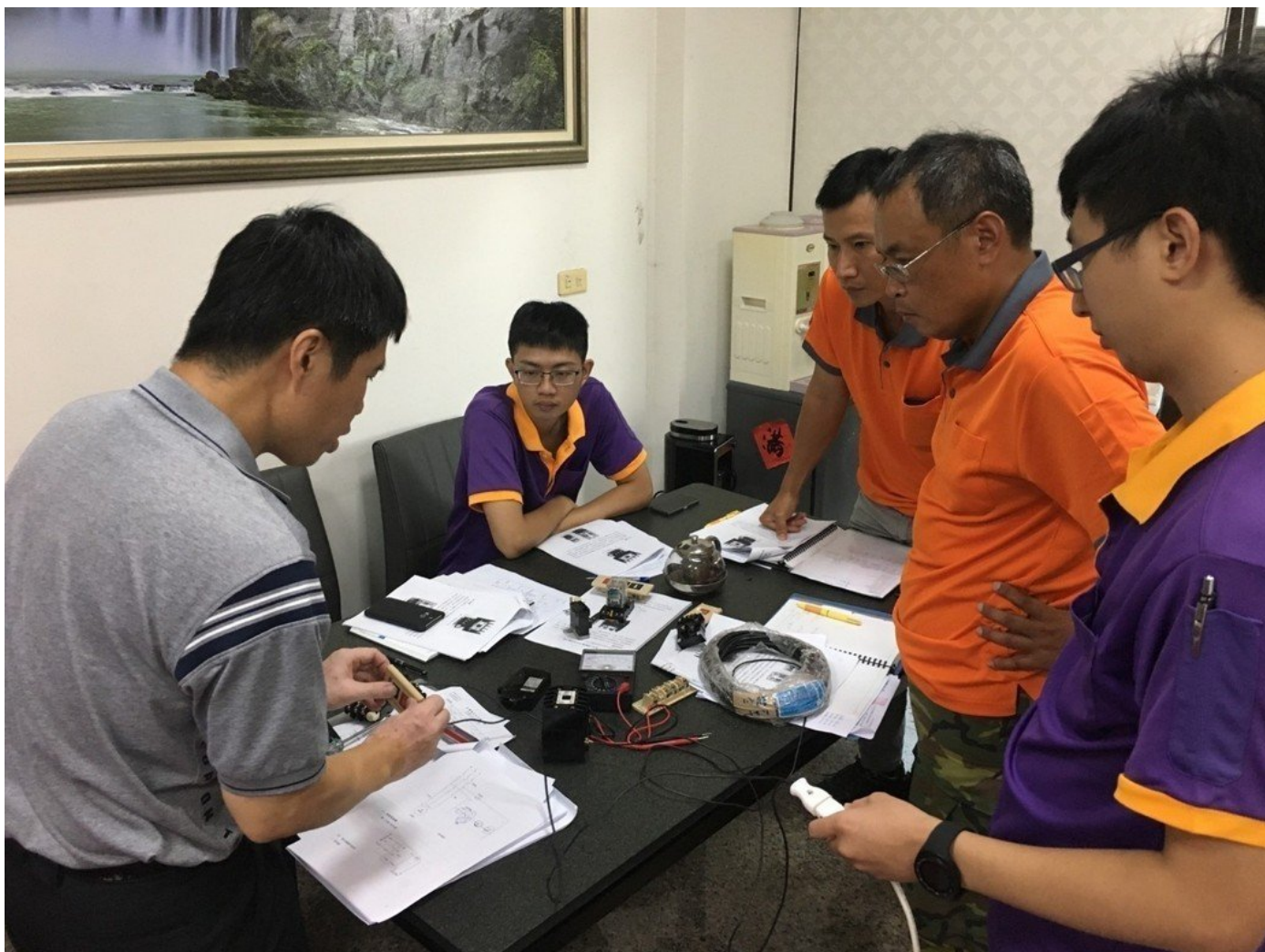
嘉藥輔導朝日能源公司進行工業配線實務。