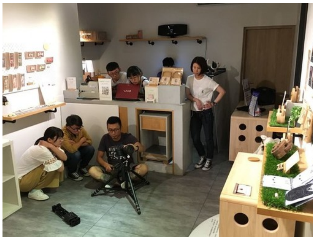
嘉藥協助拍拍文創公司訓練影片拍攝與剪輯技術。