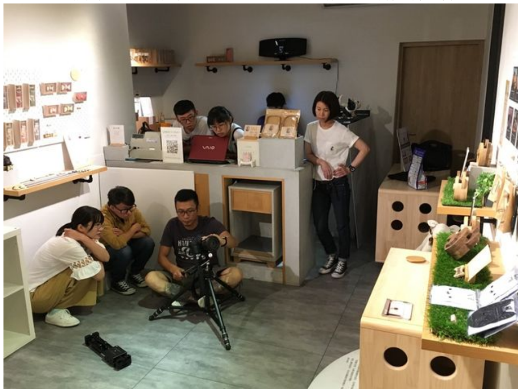
嘉藥協助拍拍文創公司訓練影片拍攝與剪輯技術。