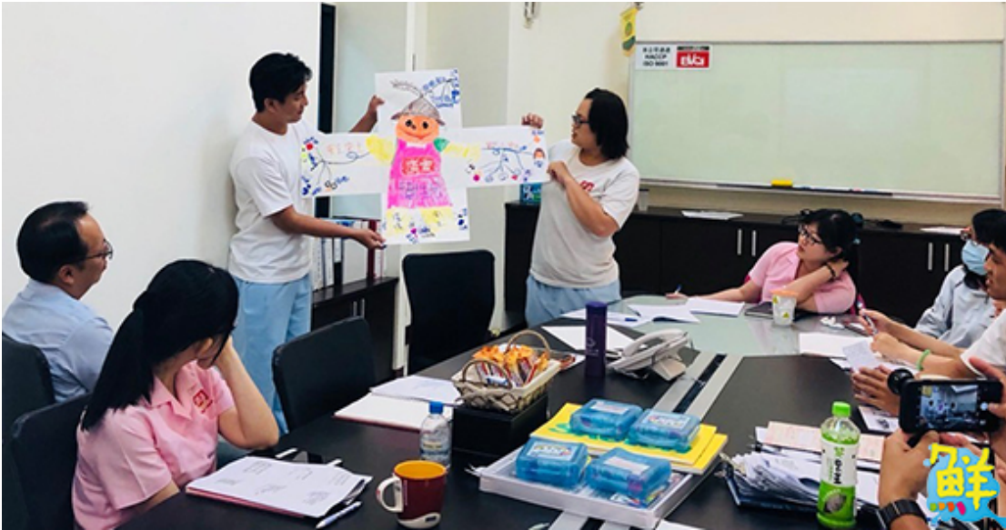
▲辦理廣吉食品及川鉞生物科技公司聯合培訓。

品；甚至也協助烏山頭水庫開設員工潛能課程，以及替園藝公司進行室內設計與戶外規劃，重整門面；還有為美容美甲公司強化員工專業技能並增闢新服務項目，以因應多樣化的國際美容事業等。客製化的多元課程充分滿足廠商需求，同時也協助企業轉型，進軍國際市場。