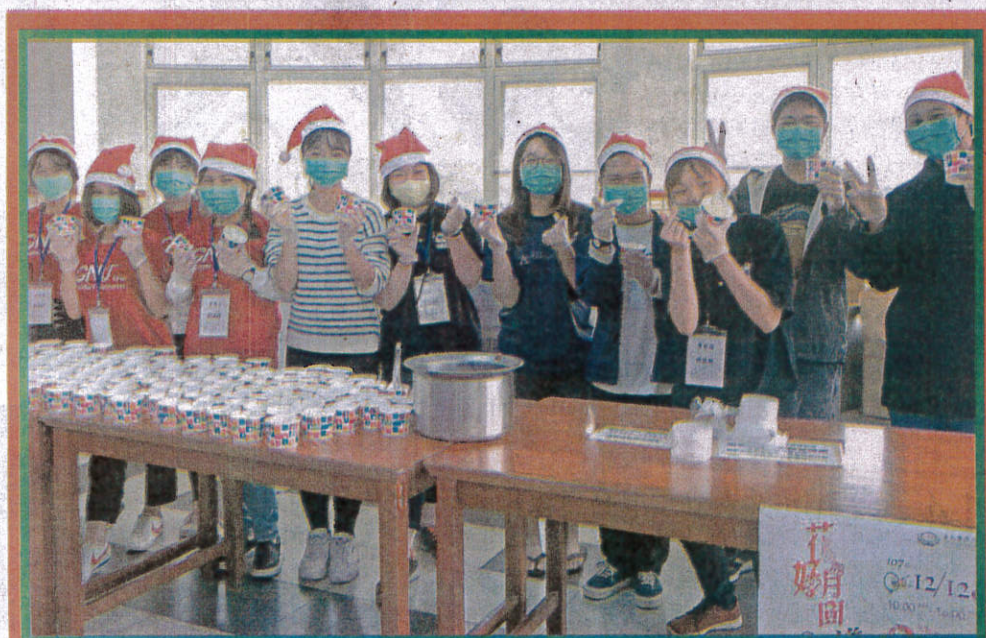
嘉藥愛心湯圓，境外生齊送暖。