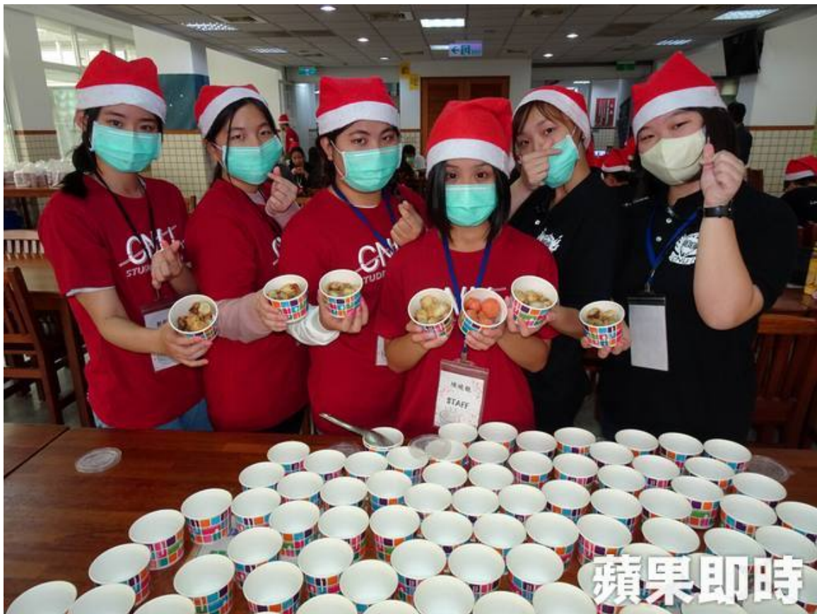
愛心湯圓義賣活動獲得嘉藥師生熱烈響應。