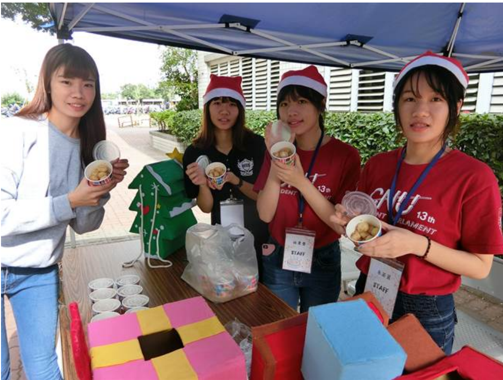
冬至愛心湯圓義賣是嘉南藥理大學延續12年的傳統。

連續12年，嘉南藥理大學在冬至前夕舉辦愛心湯圓義賣，有別以往委請廠商煮湯圓再由學生分送，今年從搓湯圓、包餡到分送均由學生一手包辦，不變的是，延續往年愛心，一碗20元湯圓，不少老師大氣掏出1000、2000元買1碗響應，活動募集5萬元全數捐助偏鄉兒童。