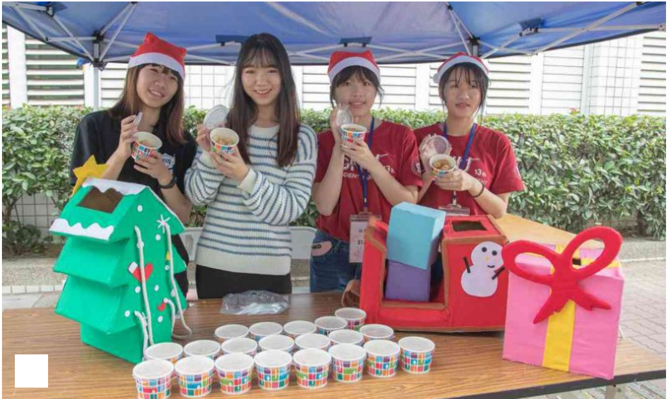
嘉藥愛心湯圓，境外生齊送暖