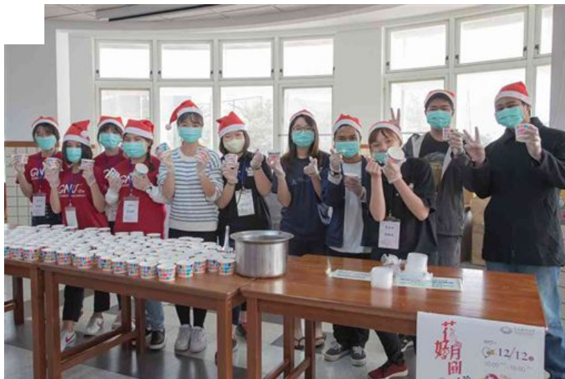
▲ 嘉藥學生與境外生合力分裝湯圓。

嘉藥今年湯圓義賣活動所募得款項，將全數捐贈台東「孩子的書屋」基金會，幫助偏鄉孩童；而舊衣回收活動則響應伊甸社會福利基金會專案，發票募集將捐助喜憨兒社會福利基金會。另外，天佑遊覽車客運公司也義不容辭贊助活動，提供無線藍芽耳機、餐券和禮券等多樣抽獎品，回饋參加義賣的同學，炒熱活動高潮。