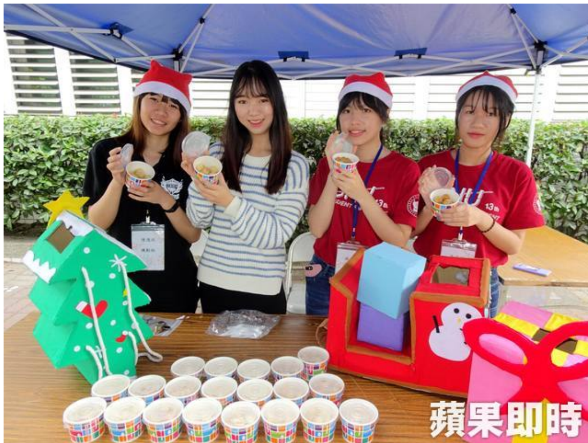
嘉南藥理大學在每年冬至前夕舉辦湯圓義賣活動，今年已邁入第12年。

是首次在台灣體驗冬至的習俗氣氛，不僅新奇有趣，也感受到台灣滿滿人情味。 ( 李恩慈 / 台南報導 )