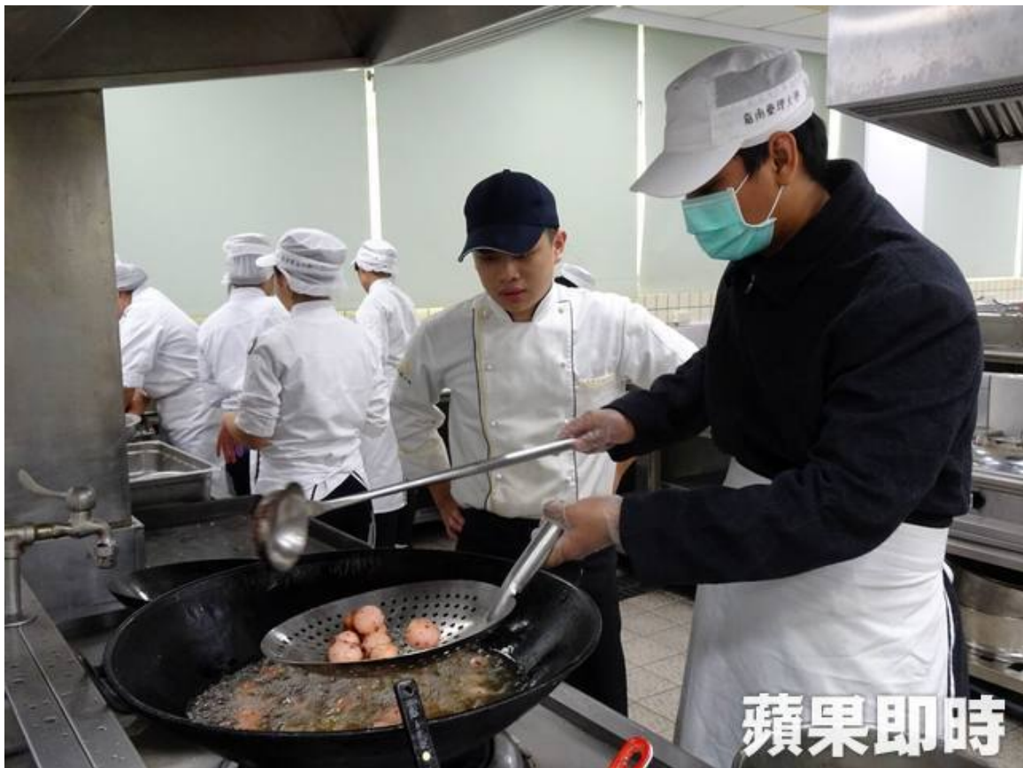
嘉藥外籍學生下廚體驗炸湯圓。