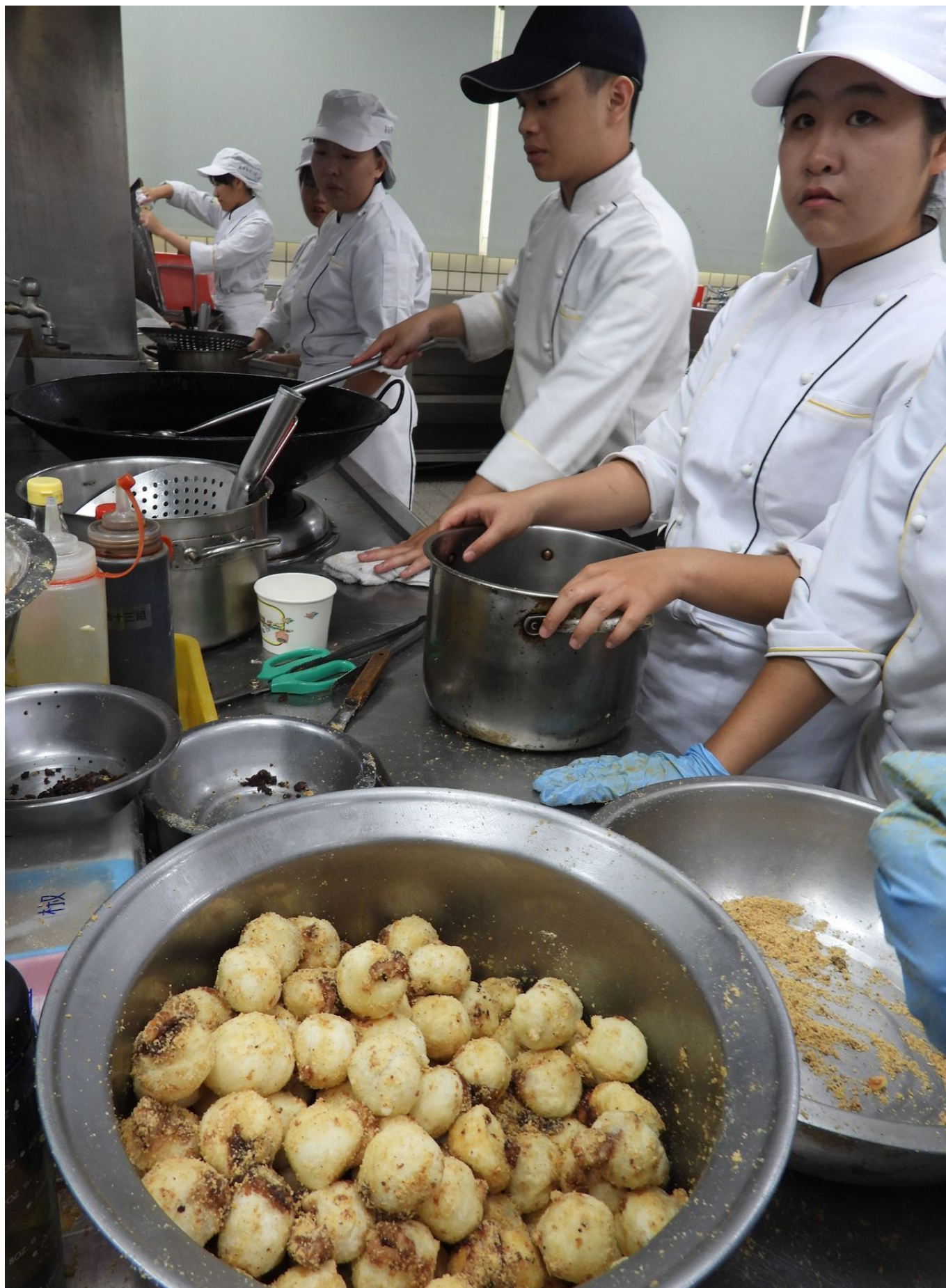
嘉南科大舉辦「冬至湯圓義賣」，學生推出「炸湯圓」每碗義賣價20元起跳最高無上限，準備1500碗以上，募集至少5萬元，所得捐助偏鄉兒童。