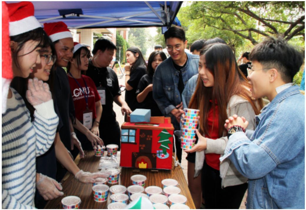
嘉藥的湯圓義賣很受歡迎，不少學生一次就買好幾碗。

冬至將屆，嘉南藥理大學校園十二日推出「愛心湯圓義賣」活動，學生議會除準備炸湯圓義賣，也邀外籍生一起搓湯圓、料理製作及分裝配送，讓他們體驗台灣特有的民俗氣氛，義賣所得全數捐贈台東「孩子的書屋」基金會，幫助偏鄉孩童。