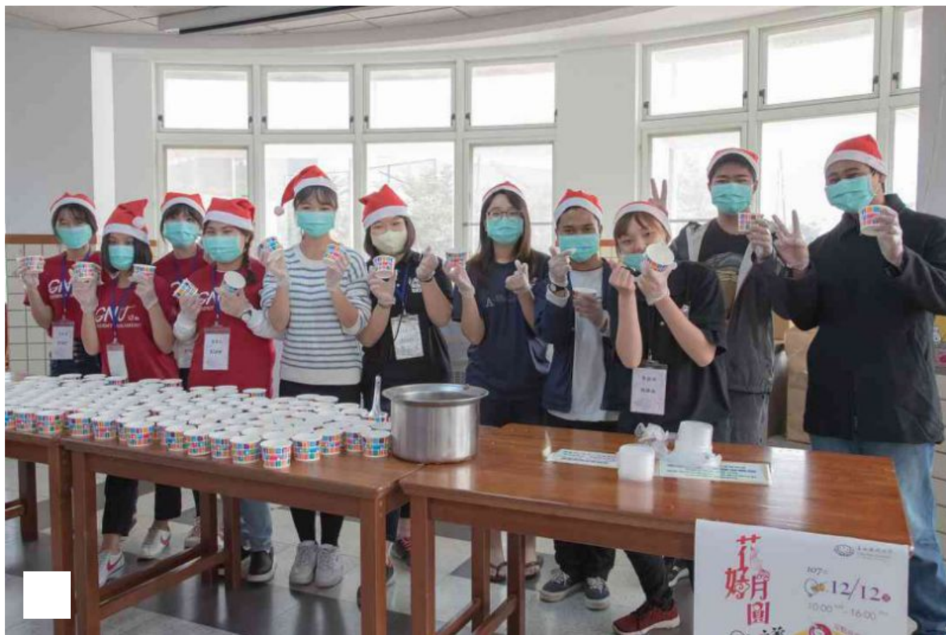
圖／嘉藥學生與境外生合力分裝湯圓。

嘉藥今年湯圓義賣活動所募得款項，將全數捐贈台東「孩子的書屋」基金會，幫助偏鄉孩童；而舊衣回收活動則響應伊甸社會福利基金會專案，發票募集將捐助喜憨兒社會福利基金會。另外，天佑遊覽車客運公司也義不容辭贊助活動，提供無線藍芽耳機、餐券和禮券等多樣抽獎品，回饋參加義賣的同學，炒熱活動高潮。