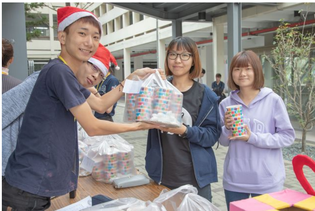
嘉藥湯圓義賣活動吸引眾多學生排隊搶購。

http://www.cntimes.info 2018-12-12 16:42:03