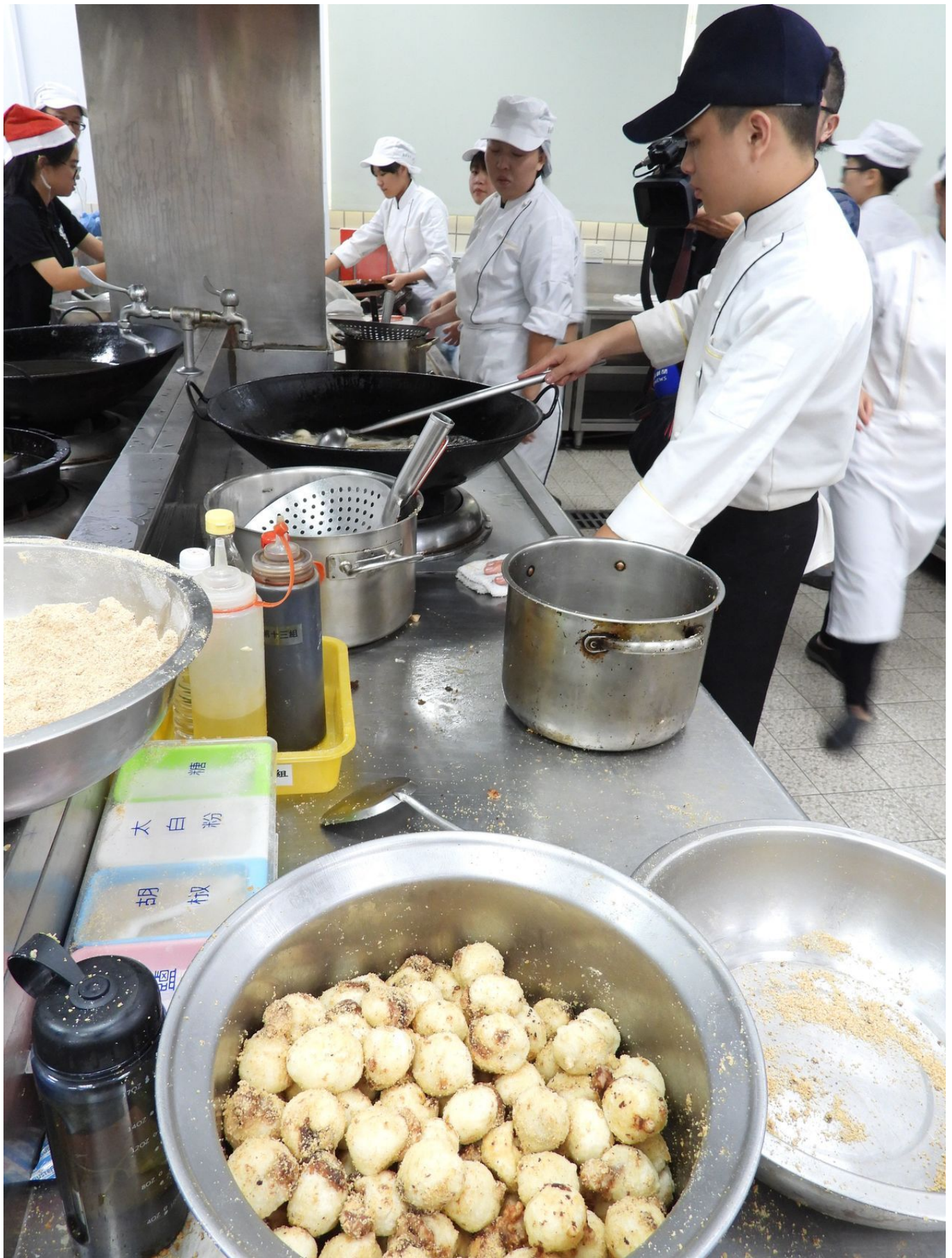
嘉南科大舉辦「冬至湯圓義賣」，學生推出「炸湯圓」每碗義賣價20元起跳最高無上限，準備1500碗以上，募集至少5萬元，所得捐助偏鄉兒童。