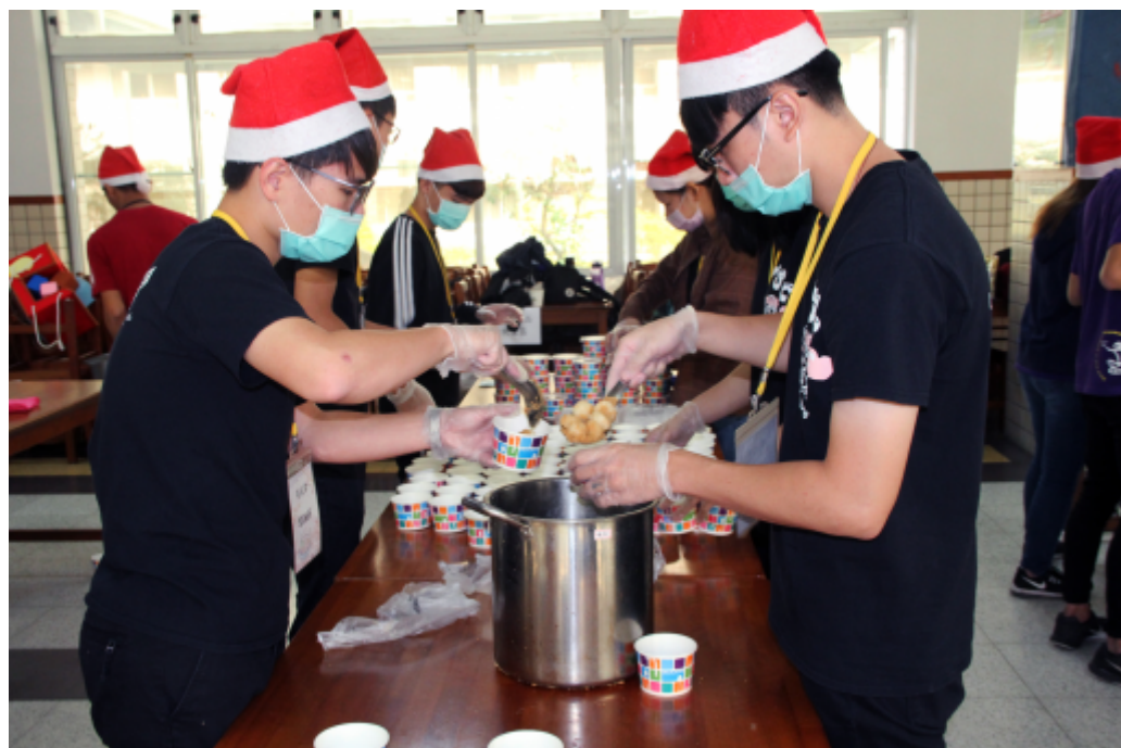
學生忙著將炸好的湯圓分裝準備送出義賣。