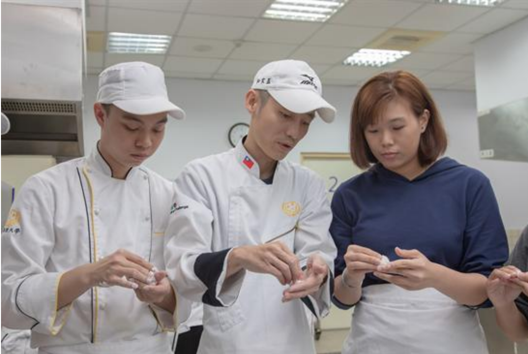
嘉藥愛心湯圓 境外生齊送暖

(中央社訊息服務20181213 09:20:04)冬至將屆，嘉南藥理大學校園依然熱情洋溢，該校年度盛事「愛心湯圓義賣」活動，12日熱鬧登場。主辦的嘉藥學生議會，今年加碼推出不同口味的炸湯圓，也安排摸彩、舊衣回收與發票募集等愛心節目；更特別的是，邀請境外生一起參與，從搓湯圓、料理製作到分裝配送，大家相揪共襄盛舉，讓他們在台求學體驗台灣特有的民俗氣氛，留下難得的美好回憶。