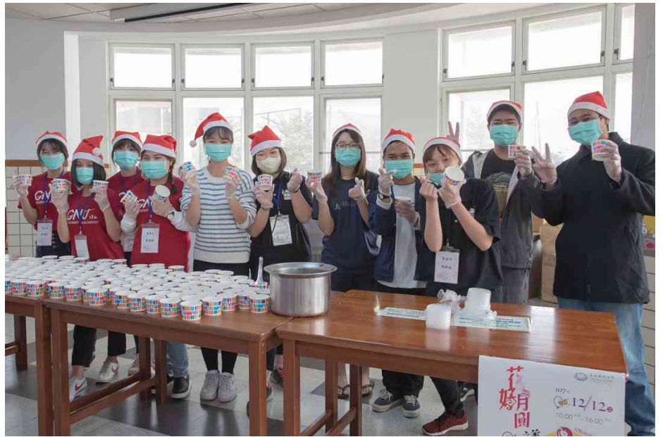
圖／嘉藥學生與境外生合力分裝湯圓。

嘉藥今年湯圓義賣活動所募得款項，將全數捐贈台東「孩子的書屋」基金會，幫助偏鄉孩童；而舊衣回收活動則響應伊甸社會福利基金會專案，發票募集將捐助喜憨兒社會福利基金會。另外，天佑遊覽車客運公司也義不容辭贊助活動，提供無線藍芽耳機、餐券和禮券等多樣抽獎品，回饋參加義賣的同學，炒熱活動高潮。