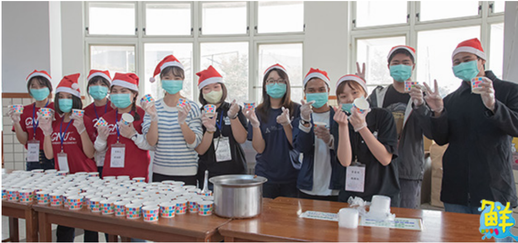
▲嘉藥學生與境外生合力分裝湯圓。

次湯圓義賣活動，讓她想起在家鄉與爸媽、奶奶一同搓湯圓的情景，也深深感受到台灣濃濃的人情味。