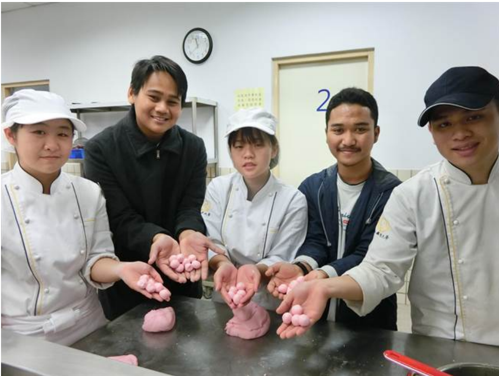
冬至愛心湯圓義賣是嘉南藥理大學延續12年的美好傳統，今年也首度邀請外籍生一起加入製作湯圓義賣的活動。