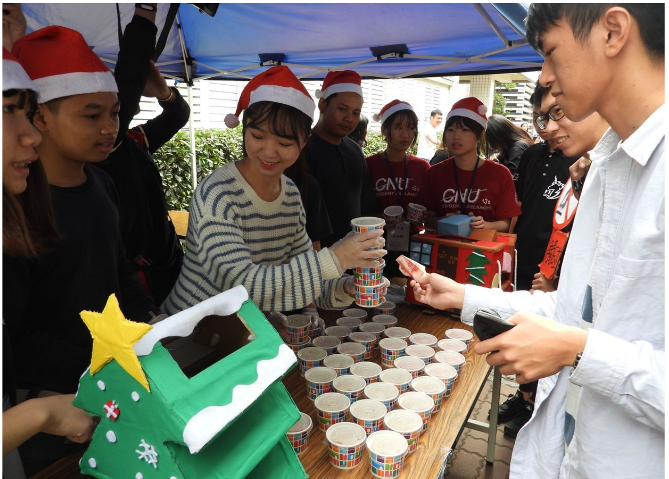
嘉南科大舉辦「冬至湯圓義賣」，學生推出「炸湯圓」每碗義賣價20元起跳最高無上限，準備1500碗以上，募集至少5萬元，所得捐助偏鄉兒童。