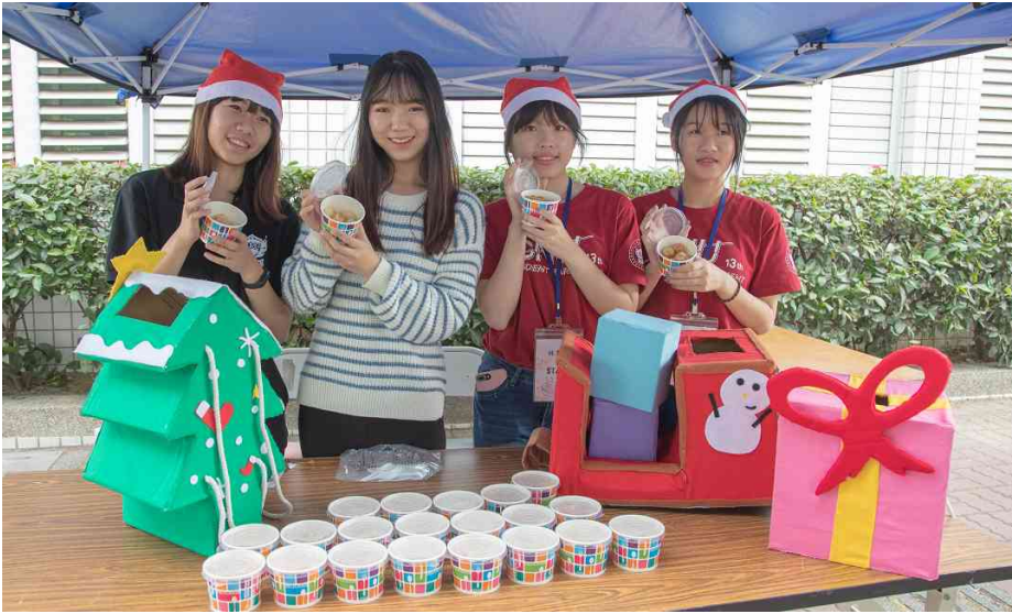
嘉藥愛心湯圓，境外生齊送暖