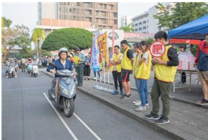
慢騎趣味競賽考驗同學操控技術