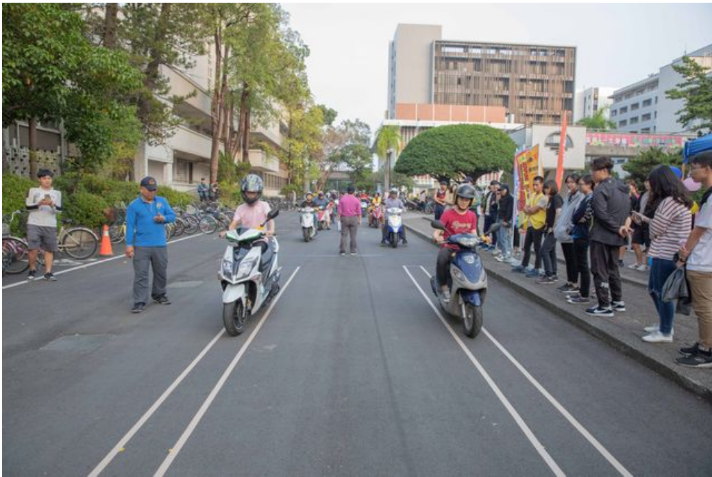
慢騎趣味競賽，同學互拼誰騎最穩最慢。

近日，機車加裝ABS話題引發熱議，無論政策如何執行，安全駕駛才是王道。鑑於大專學生交通事故頻傳，為維護同學行的安全，並建立騎乘機車應有的正確知識，嘉南藥理大學日前舉辦「行駛不超速，平安回嘉最幸福」系列活動。除邀請警官、保險業者和安駕中心技師蒞校講習與實地操演外，也舉行機車慢騎趣味競賽，大家比慢前行，樣態百出，笑翻全場，在寓教於樂中，充分達到交通安全宣導效果。