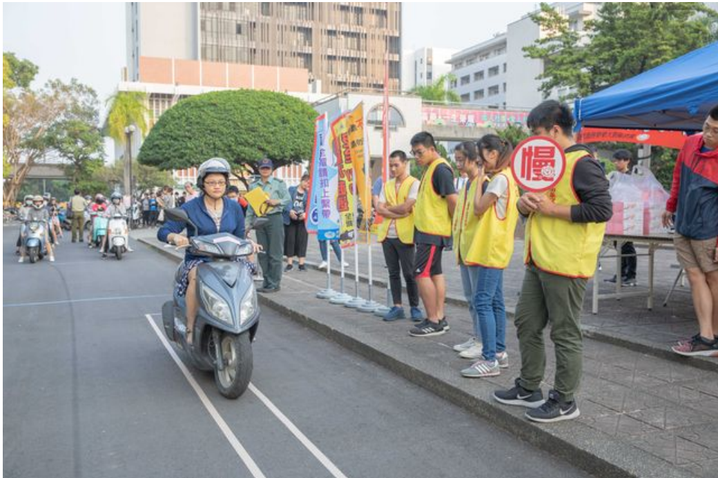
嘉南藥理大學舉辦「行駛不超速，平安回嘉最幸福」系列活動。

http://www.cntimes.info 2018-12-14 20:39:09