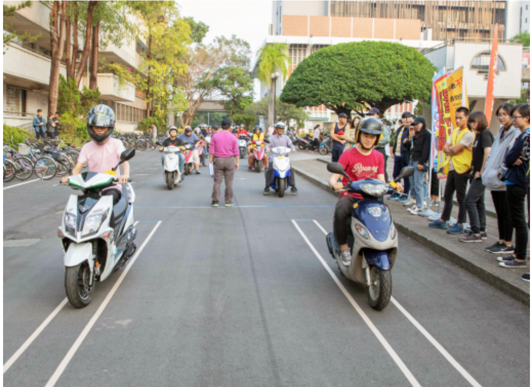
機車騎慢趣味競賽，學生在狹窄空間看誰騎得最穩、最慢。

機車加裝 A B S 近日成為話題，擁有五千名騎機車學生的嘉南藥理大學認為，不管政策如何，安全駕駛才是王道，特別舉辦「行駛不超速，平安回『嘉』最幸福」活動，藉由活動向學生進行交通安全宣導。