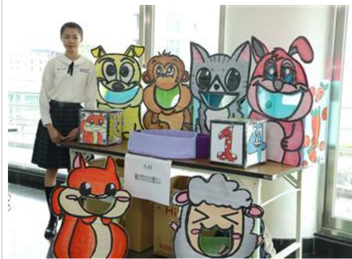
有趣多樣的教玩具比賽吸引全國各高中職學生組隊參加