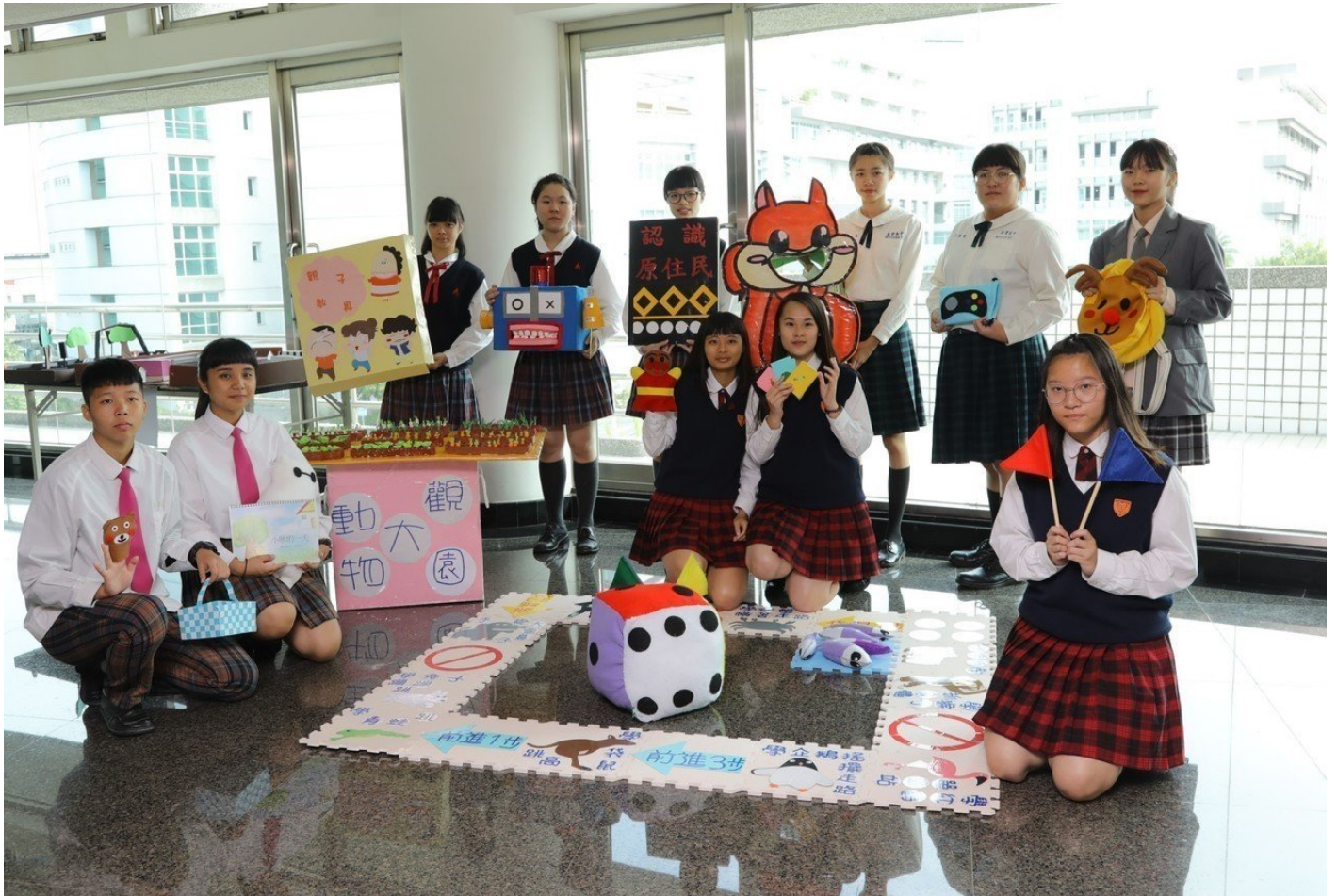
參賽學生無不絞盡腦汁展現作品。

校長陳鴻助表示，嘉藥辦理兒童教玩具競賽研習活動，除提供各校相互切磋學習機會外，同時邀請幼兒園所機構教保服務人員、兒童教玩具開發公司，以及相關科系高中職、大專校院師生共襄盛舉，讓關心兒童教育的各界人士可以觀摩交流，提升我國幼保服務人力品質，也促進幼兒健康發展的學習環境，意義非凡。