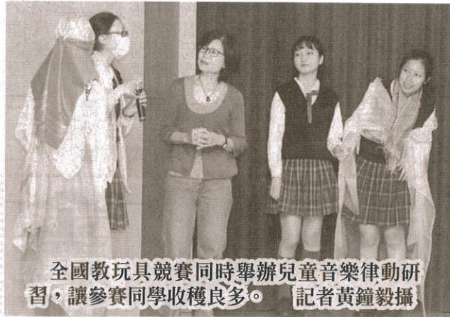
全國教玩具競賽同時舉辦兒童音樂律動研習，讓參賽同學收穫良多。

【記者黃鐘毅／台南報導】富有競賽性與教育意義的「全國兒童教玩具競賽」活動，昨天在嘉南藥理大學舉行，今年共有來自各地十二所高中職校八十五件作品、二百餘人同台競技，參賽者眾，為歷年之最，競爭相當激烈，主辦單位期透過競賽交流與研習，提升學生實務