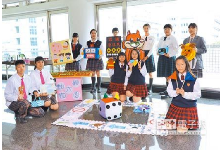
全國兒童教玩具競賽28日於嘉南藥理大學登場，高中職學生端出作品好玩也極富教育意義，受到好評。