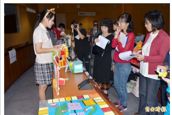
競賽過程中，選手們向評審委員說明設計理念。

這場競賽在嘉南藥理大學國際會議中心舉行，選手們展示自己的創作，進行設計概念的說明，並回答評審委員的提問，以爭取佳績，氣氛熱烈。