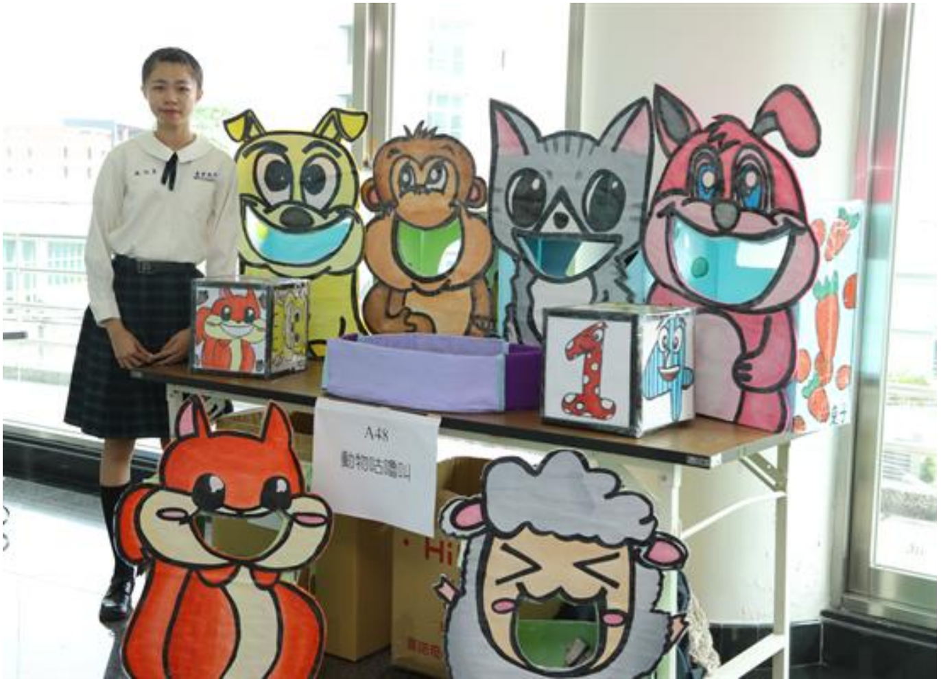
趣味×創意，兒童教玩具高手會師嘉藥大比拚

(中央社訊息服務20190102 10:55:28)富有競賽性與教育意義的「全國兒童教玩具競賽暨應用研習」活動，12月28日於嘉南藥理大學國際會議中心隆重登場。該活動每年由嘉藥嬰幼兒保育系主辦，已邁入第10屆，今年共有高中職校多達85件作品、300餘人同台競技，參賽者眾，為歷年之最，競爭相當激烈。