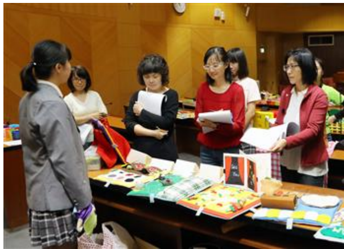
參賽學生向評審介紹教案與教玩具設計概念