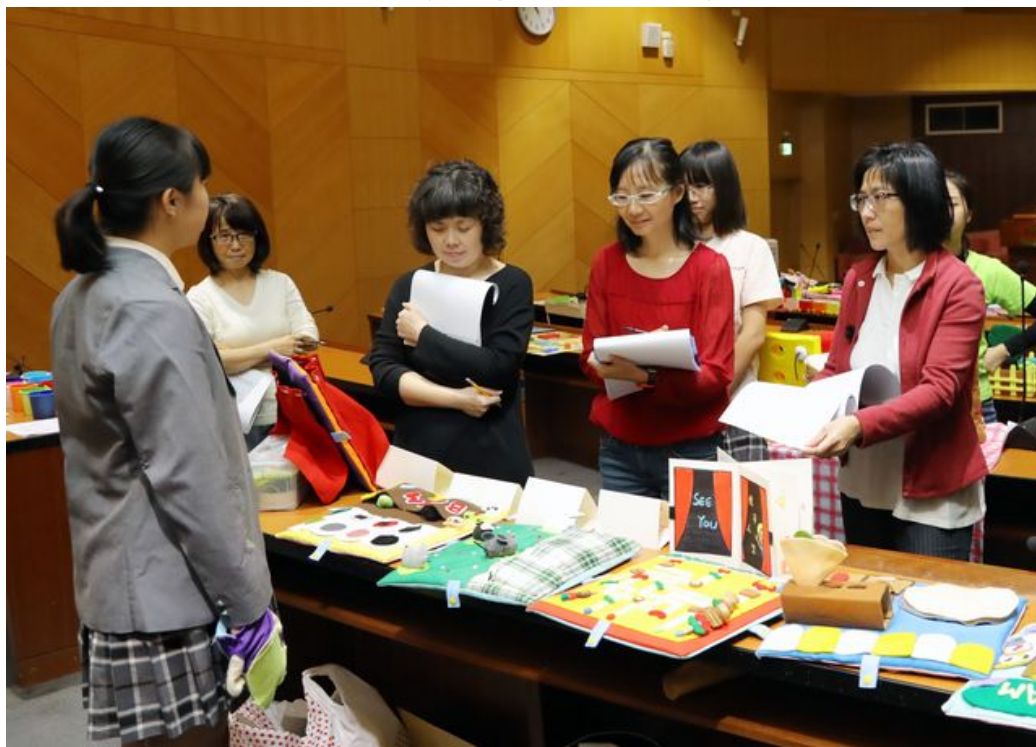
參賽學生向評審介紹教案與教玩具設計概念。