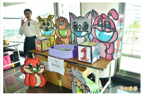
高中職學子們發揮巧思，設計系列的教玩具。