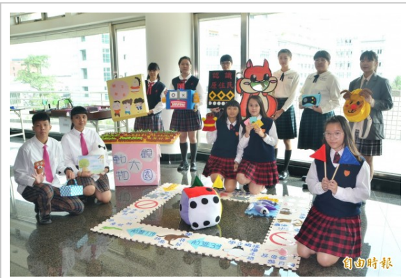
全國兒童教玩具競賽登場，各高中職選手展示創意作品。

〔記者吳俊鋒 / 仁德報導〕第10屆全國兒童教玩具競賽今天在台南登場，85件高中職幼兒保育科系的作品齊聚，規模為歷來之最，展現創意，有的比照「大富翁」遊戲，介紹原住民特色，甚至打造結合情境闖關卡的特殊兒童座椅，降低小朋友用用餐時，過度依賴3C產品的使用，趣味、教育性兼顧。