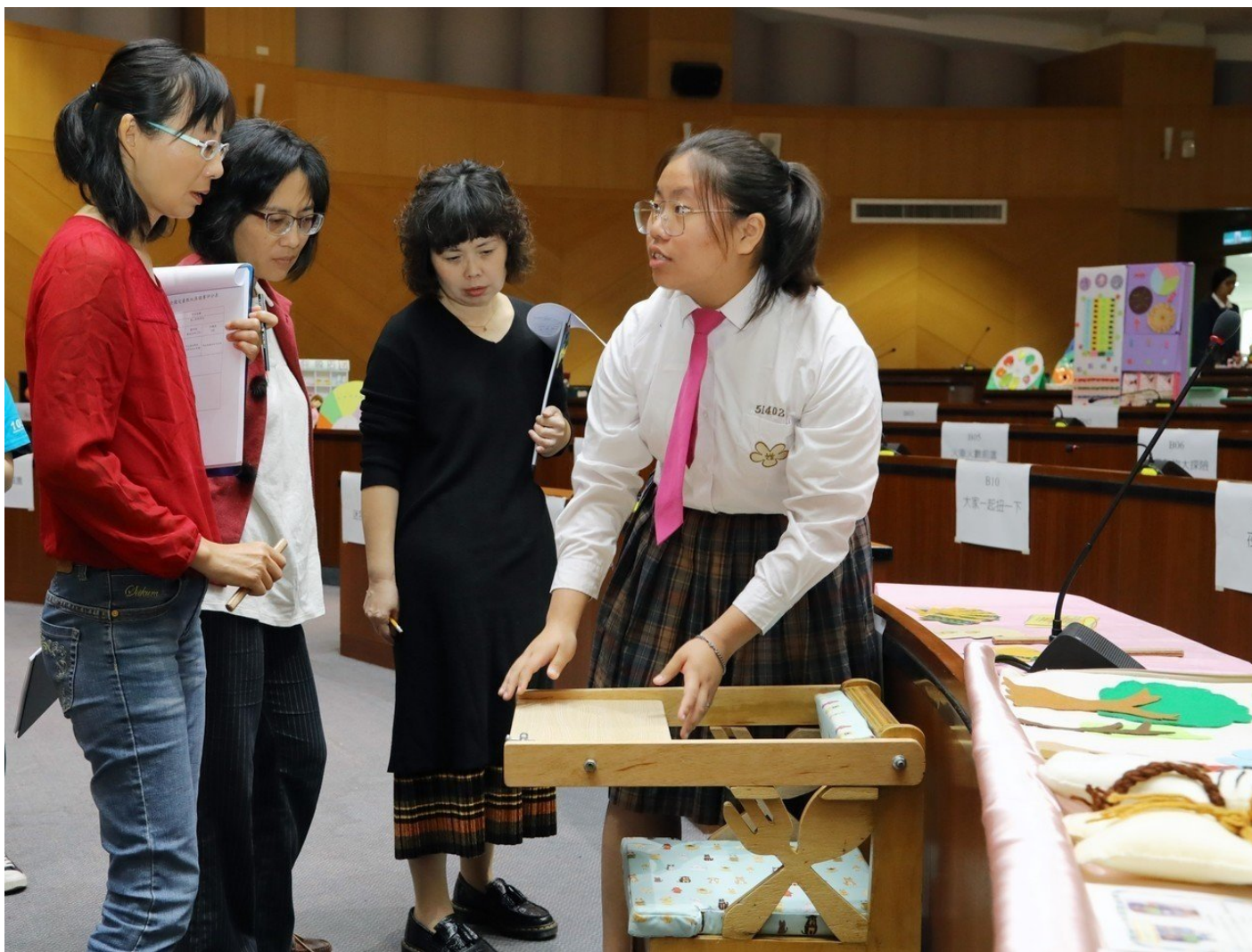
學生必須現場說明創作發想與過程。