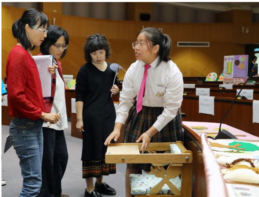
豐富多樣又有創意的教玩具設計吸引評審目光。