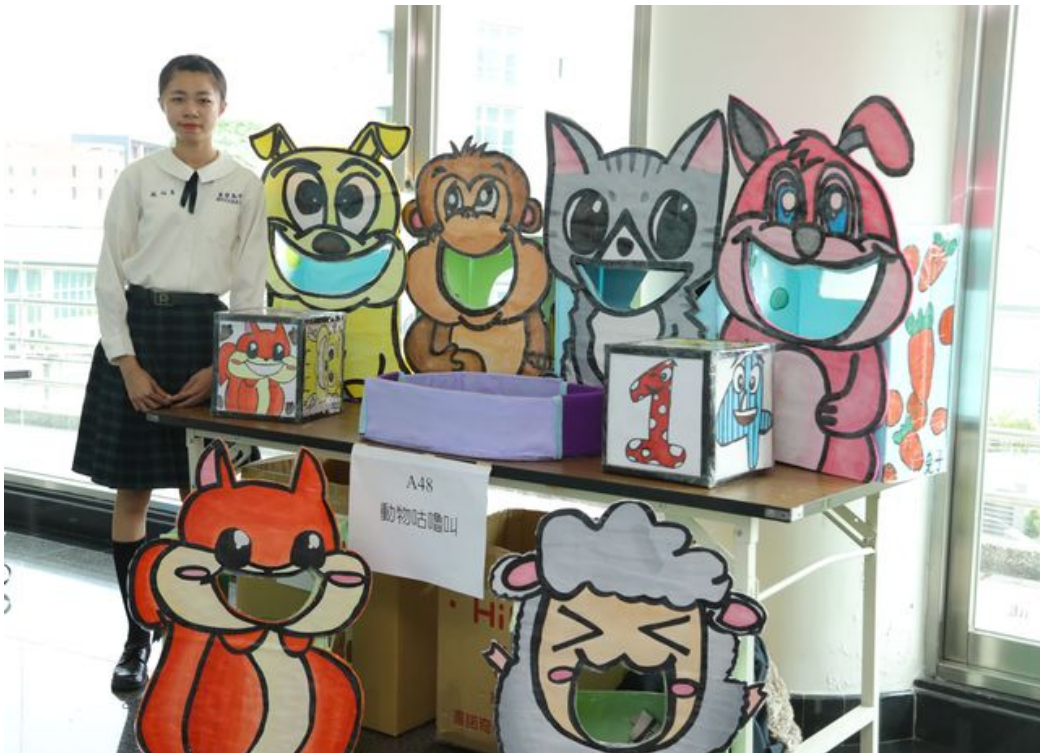
有趣多樣的教玩具比賽吸引全國各高中職學生組隊參加。