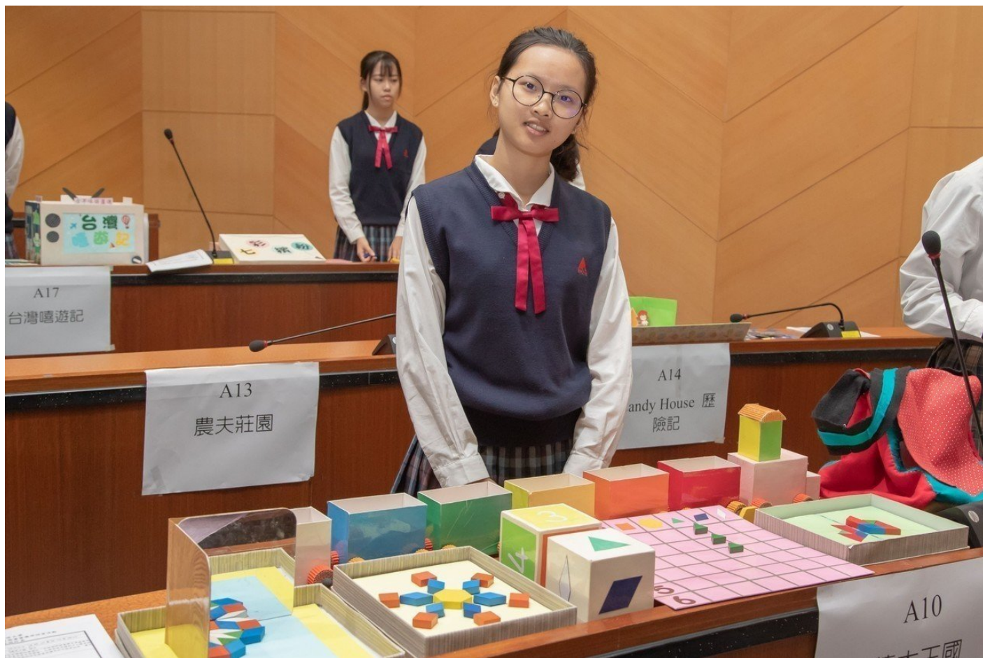
樹德家商「積木王國」作品贏得冠軍。