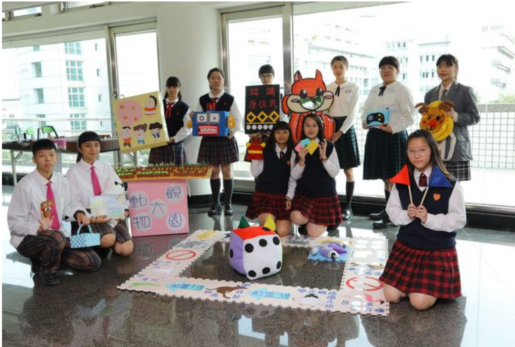
嘉藥舉辦全國兒童教玩具競賽，超過10多所學校參賽，規模盛大。

http://www.cntimes.info 2018-12-28 19:47:22