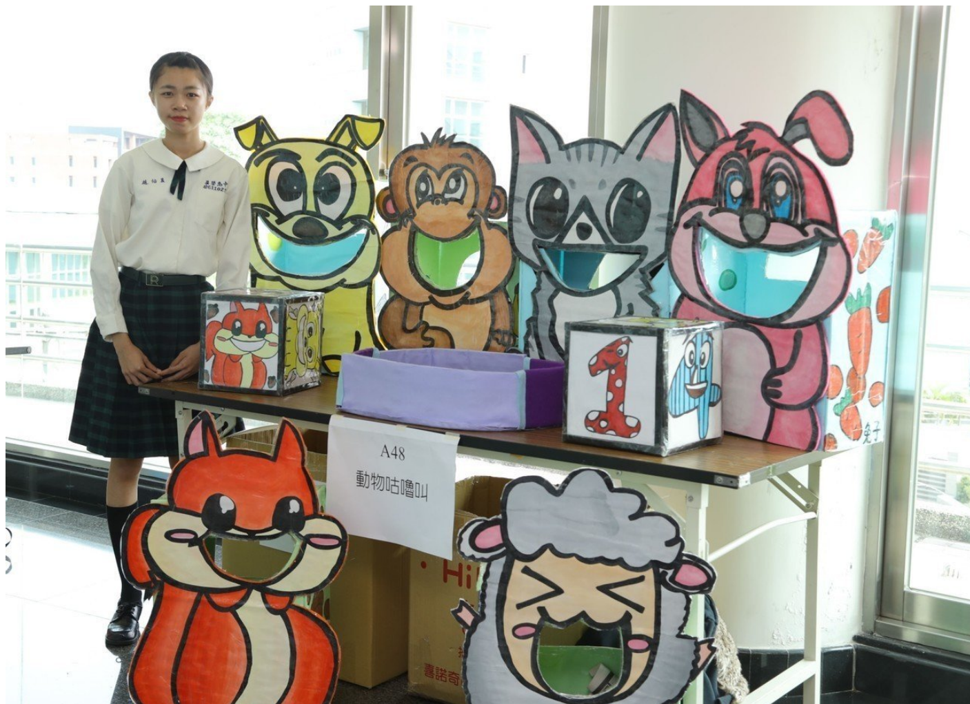
不少參賽作品非常吸睛。