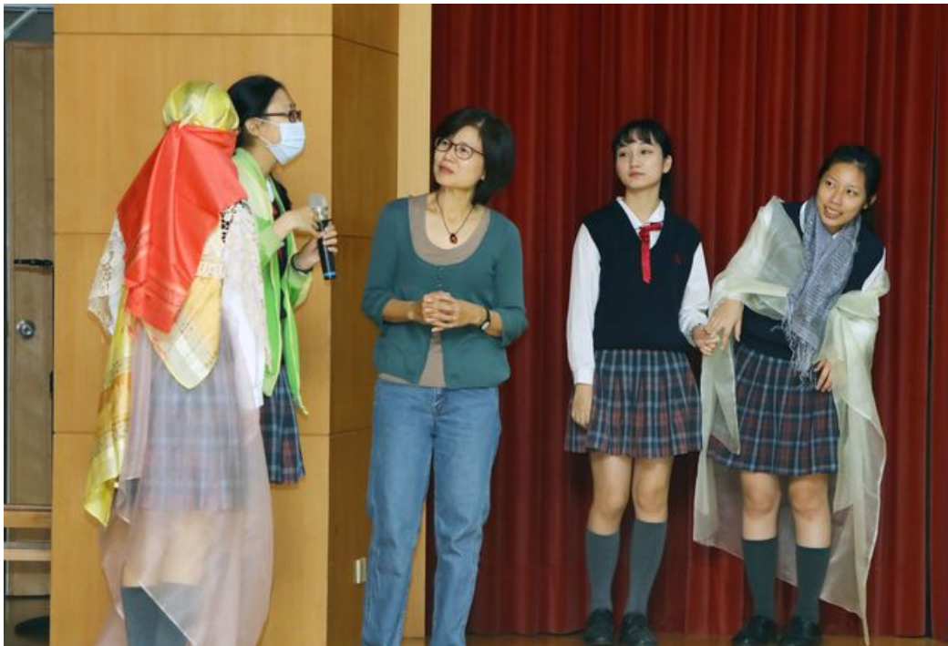
教玩具競賽同時舉辦兒童音樂律動研習，讓參賽同學收穫良多。

富有競賽性與教育意義的「全國兒童教玩具競賽暨應用研習」活動，12月28日於嘉南藥理大學國際會議中心隆重登場。該活動每年由嘉藥嬰幼兒保育系主辦，已邁入第10屆，今年共有高中職校多達85件作品、300餘人同台競技，參賽者眾，為歷年之最，競爭相當激烈。下午成績揭曉，由樹德家商的「積木王國」、光華高中的「衣起陪伴偶」及「『食』在很好玩」分別奪下一、二、三名；另有員林家商「小黃點玩顏色」和嘉義家職「水果的旅途」等作品，榮獲佳作與創意獎殊榮，表現不俗。