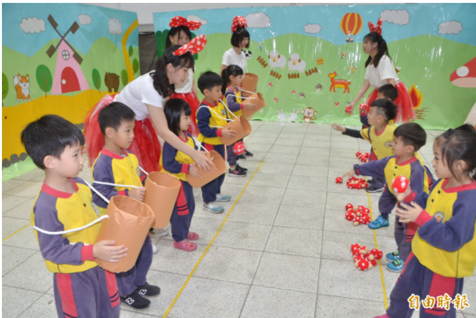
小朋友相互拋接香菇沙包，訓練手眼協調。