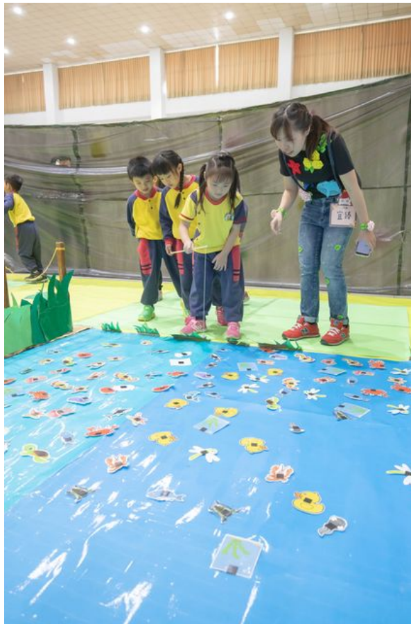
「搶救魚兒大作戰」透過釣魚遊戲來訓練小朋友的肌肉協調。

一場守護大自然的地球保衛戰正要展開，小朋友化身為環保小尖兵，勇闖奇幻國度，拯救即將瀕臨崩壞的家園。嘉南藥理大學嬰幼兒保育系畢業成果展，1月9、10日兩天於該校大禮堂熱鬧登場，以「奇幻國度的冒險旅程」為主題，帶領幼兒園孩童一起闖關玩遊戲，在歡笑中同時傳達環保理念，寓教於樂，頗具意義。