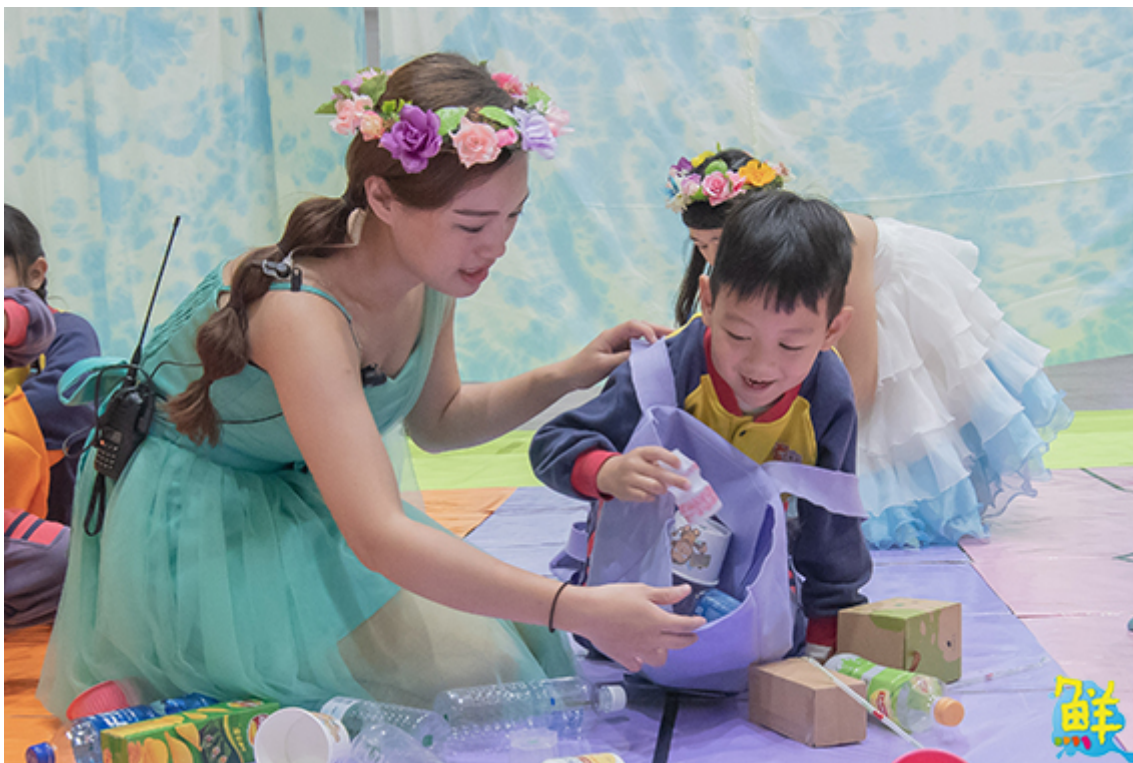
▲小朋友在幼保系姐姐帶領下進行資源回收闖關遊戲。

一場守護大自然的地球保衛戰正要展開，小朋友化身為環保小尖兵，勇闖奇幻國度，拯救即將瀕臨崩壞的家園。嘉南藥理大學嬰幼兒保育系畢業成果展，1/9(三)、1/10(四)兩天於該校大禮堂熱鬧登場，以「奇幻國度的冒險旅程」為主題，帶領幼兒園孩童一起闖關玩遊戲，在歡笑中同時傳達環保理念，寓教於樂，頗具意義。嘉藥校長陳鴻助表示，幼保系畢展是年度重要盛會，展現學生近四年亮麗的學習成果，也是踏入職場前的總驗收。