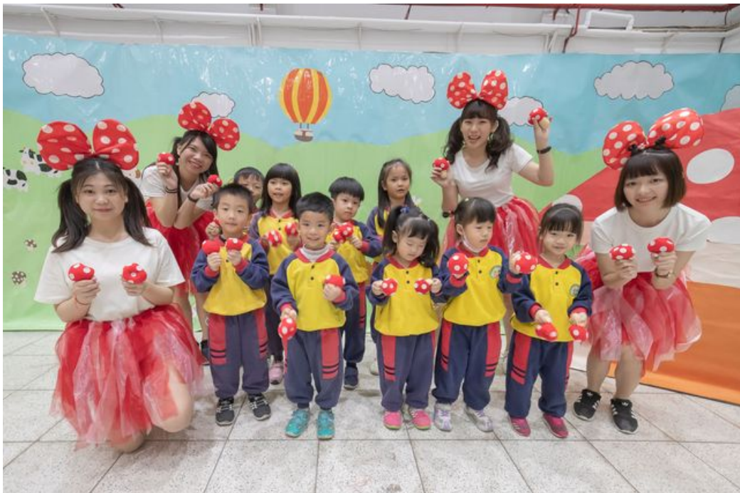
完成闖關的小朋友開心與蘑菇姐姐合影。