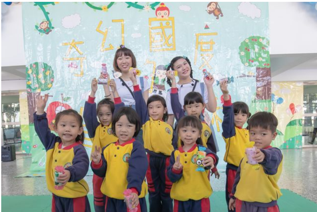
完成闖關遊戲的小朋友還可以獲得嘉藥幼保系同學精心準備的小禮物喔。

http://www.cntimes.info 2019-01-09 19:39:23