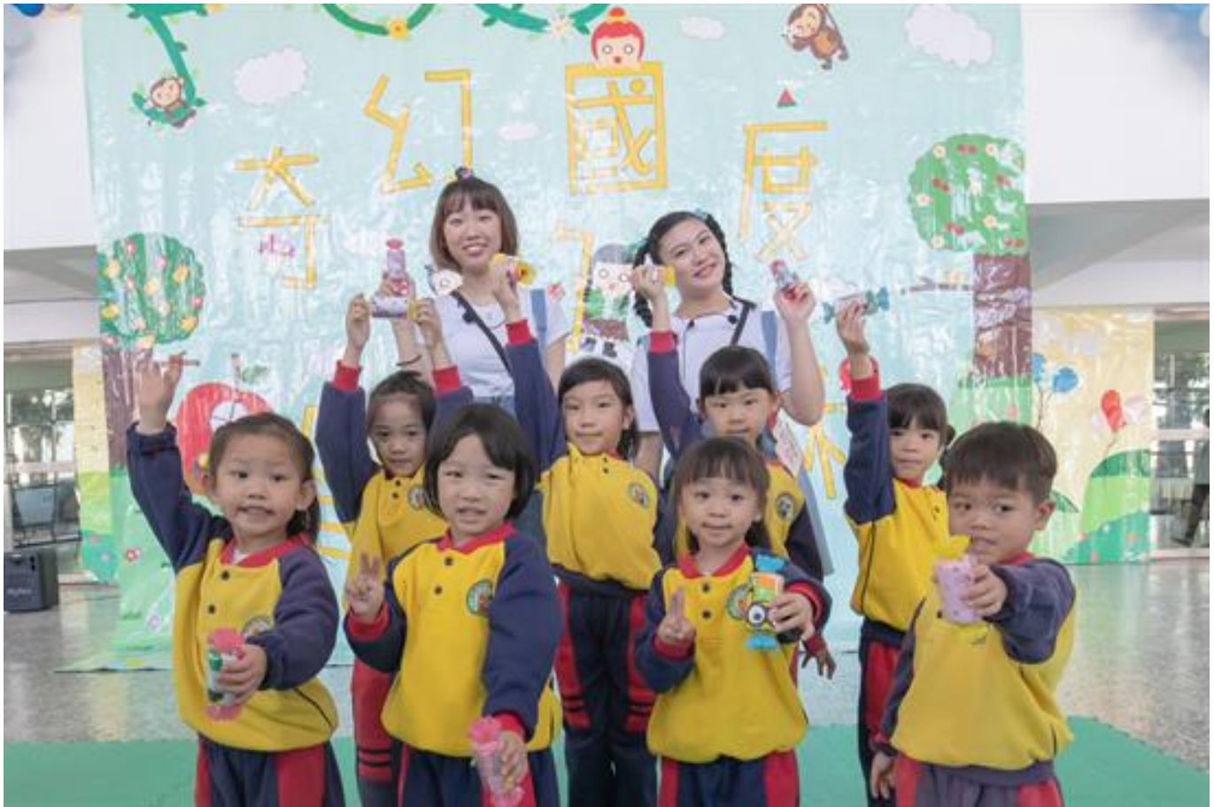
環保小英雄的奇幻冒險 嘉藥幼保系創意畢展真瘋趣

(中央社訊息服務20190110 09:27:24)一場守護大自然的地球保衛戰正要展開，小朋友化身為環保小尖兵，勇闖奇幻國度，拯救即將瀕臨崩壞的家園。嘉南藥理大學嬰幼兒保育系畢業成果展，1月9、10日兩天於該校大禮堂熱鬧登場，以「奇幻國度的冒險旅程」為主題，帶領幼兒園孩童一起闖關玩遊戲，在歡笑中同時傳達環保理念，寓教於樂，頗具意義。