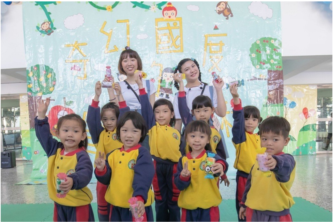
完成闖關遊戲的小朋友，還可以獲得嘉藥幼保系同學精心準備的小禮物。