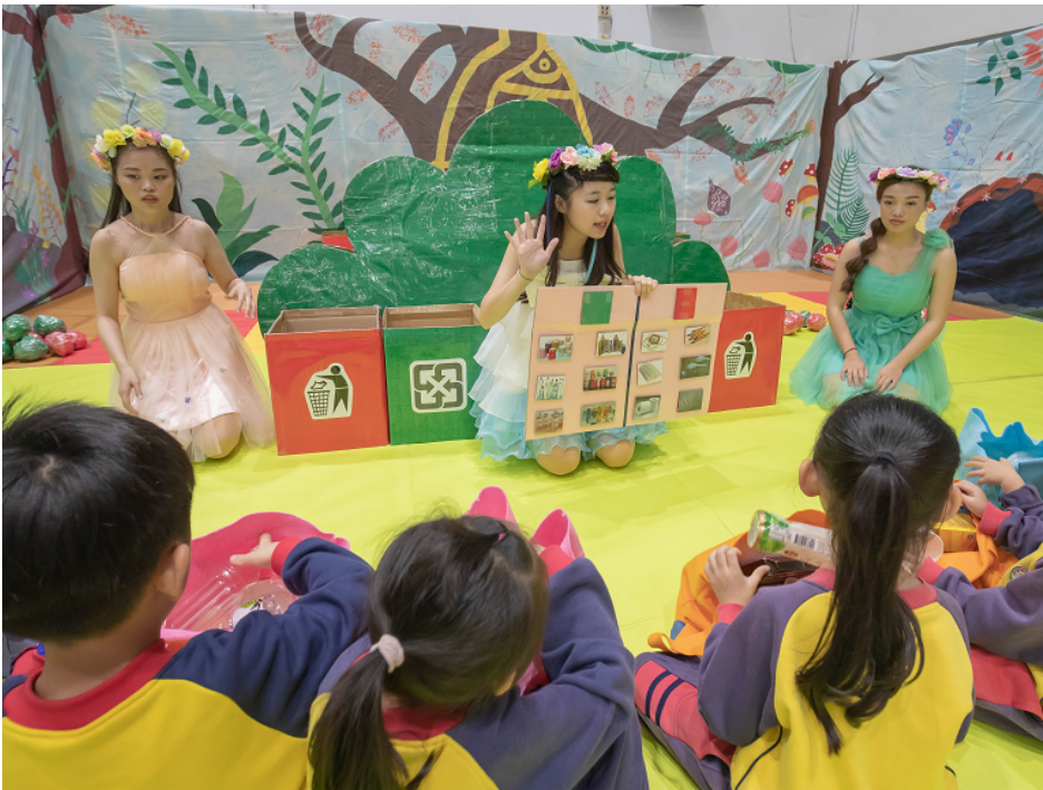
▲小朋友聆聽風仙子姐姐解說後展開闖關遊戲。

嘉藥校長陳鴻助表示，幼保系畢展是年度重要盛會，展現學生近四年亮麗的學習成果，也是踏入職場前的總驗收；今年畢業生推出兩項大型活動，一為日前演出的兒童劇「馬馬覓呀，戲金諗，快點揪團去」，全場座無虛席，高「朋」滿座，大小朋友看得如癡如醉；而另一項活動，就是充滿刺激又負教育意涵的冒險闖關遊戲。