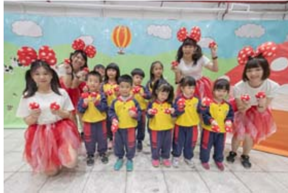
完成闖關的小朋友開心與蘑菇姐姐合影。

【記者孫宜秋／南市報導】一場守護大自然的地球保衛戰正要展開，小朋友化身為環保小尖兵，勇闖奇幻國度，拯救即將瀕臨崩壞的家園。嘉南藥理大學嬰幼兒保育系畢業成果展，1月9、10日兩天於該校大禮堂熱鬧登場，以「奇幻國度的冒險旅程」為主題，帶領幼兒園孩童一起闖關玩遊戲，在歡笑中同時傳達環保理念，寓教於樂，頗具意義。