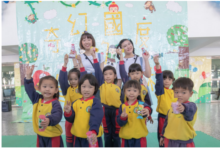
完成闖關遊戲的小朋友還可以獲得嘉藥幼保系同學精心準備的小禮物喔