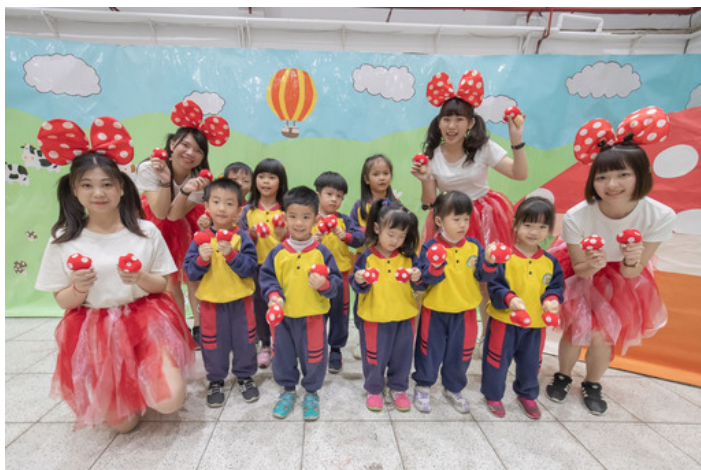
完成闖關的小朋友開心與蘑菇姐姐合影