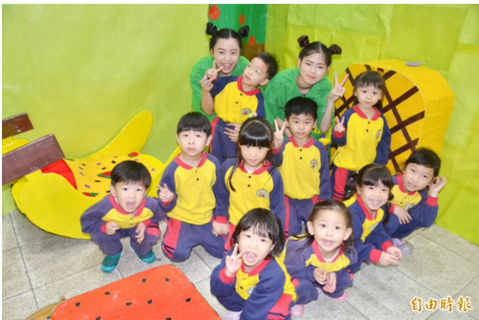
孩子們小組闖關，玩得很開心。