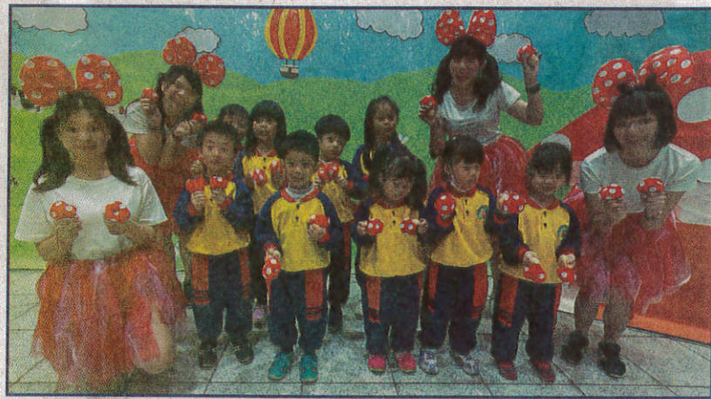
環保小英雄的奇幻冒險，嘉藥幼保系創意畢展真有趣！