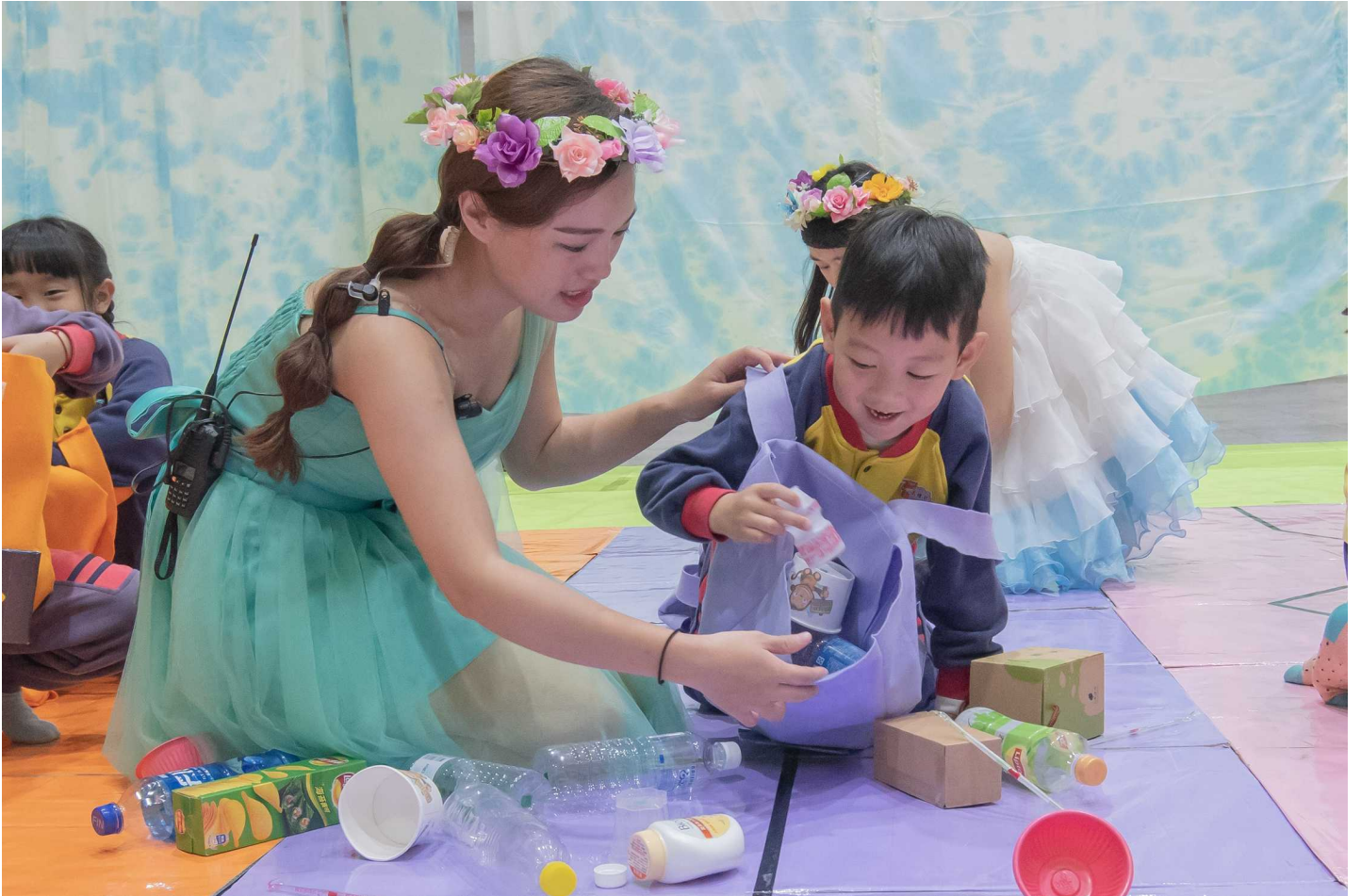
圖：小朋友在幼保系姐姐帶領下進行資源回收闖關遊戲。

嘉南藥理大學嬰幼兒保育系九日起一連兩天在學校大禮堂舉辦畢業成果展，以「奇幻國度的冒險旅程」為主題，帶領幼兒園孩童一起闖關玩遊戲，小朋友化身為環保小尖兵，勇闖奇幻國度，拯救即將瀕臨崩壞的家園，在歡笑中同時傳達環保理念，寓教於樂，頗具意義。