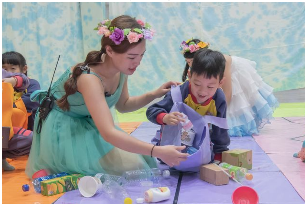
小朋友在幼保系姐姐帶領下進行資源回收闖關遊戲。