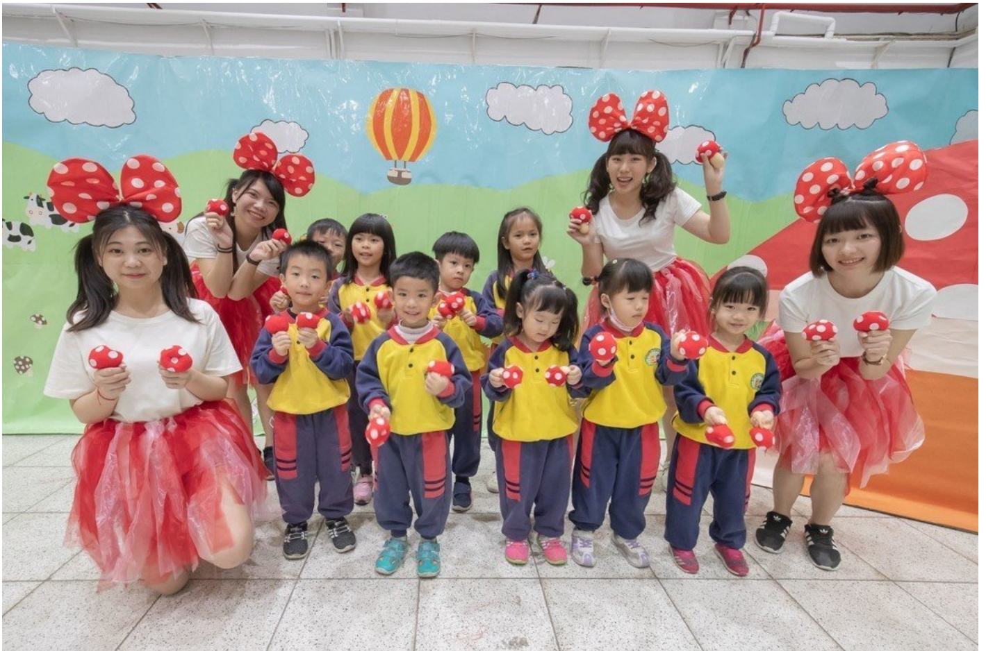
完成闖關的小朋友開心與蘑菇姐姐合影。

闖關遊戲設想以4個村落的奇幻國度為舞台，原本幸福快樂的家園卻因天然災害與人為破壞，導致面臨嚴重生存危機，參與遊戲的小朋友必須協助國度的兩位守護者，由幼保系學生扮演的「飛飛」和「蒂蒂」，逐一度過4個難關。