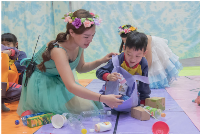
小朋友在幼保系姐姐帶領下進行資源回收闖關遊戲