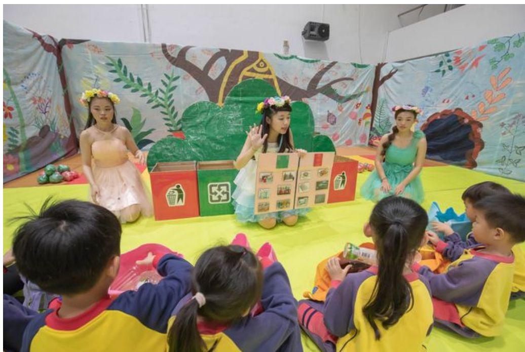
小朋友聆聽風仙子姐姐解說後展開闖關遊戲。