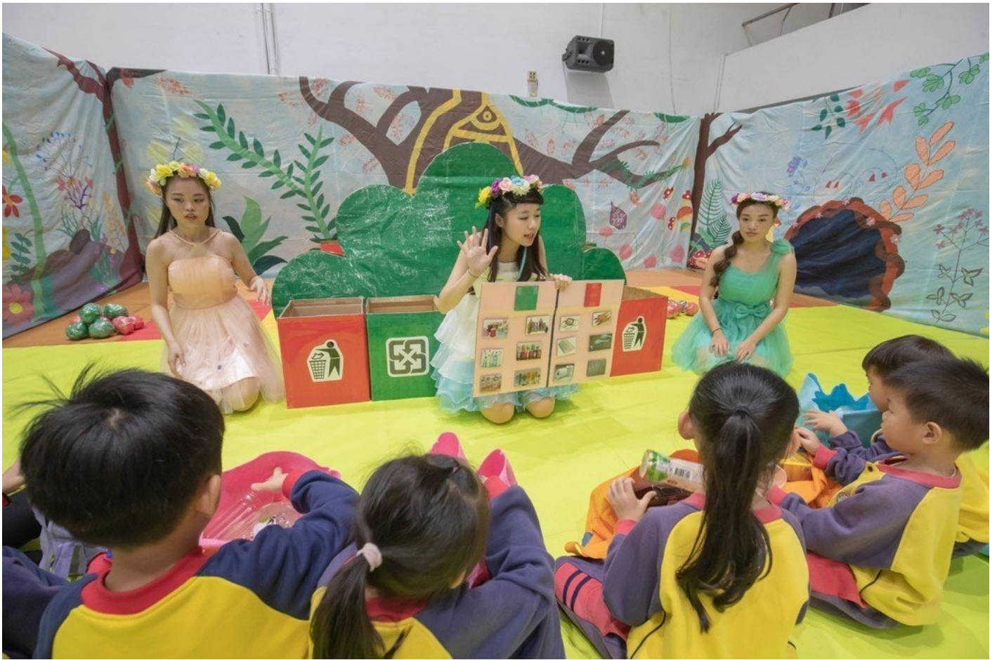
小朋友聆聽風仙子姐姐解說後展開闖關遊戲。

冒險闖關遊戲吸引眾多幼兒園小朋友參加，2天共160位的體驗名額迅速秒殺爆滿，大家興致勃勃，玩得不亦樂乎，闖關後意猶未盡，直呼還想再玩一次。另外，下午場也開放校內師生和社區民眾來挑戰，遊戲難度更高，報名相當踴躍，令大人同樣為之瘋狂，驚叫聲此起彼落。