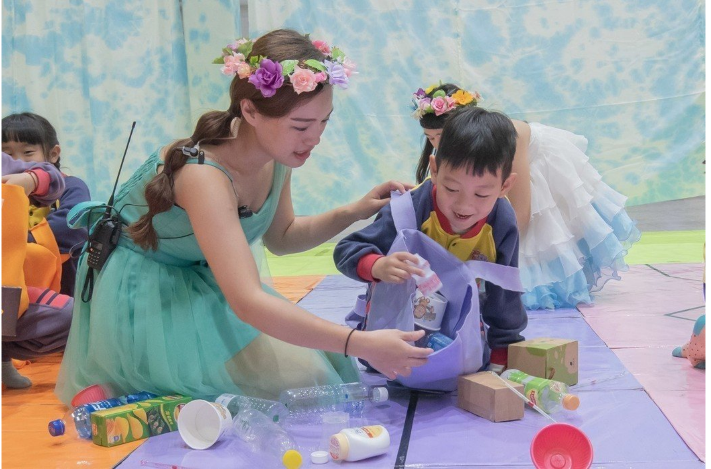
小朋友在幼保系姐姐帶領下進行資源回收闖關遊戲。

第三關「搶救魚兒大作戰」強調團隊合作精神，透過分組釣魚競賽，讓小朋友快速辨識釣到的魚是屬海洋或河流生物，知性與趣味感十足；而最後第四關「魔法森林」，則利用沙包做成可愛的香菇形狀，小朋友以互相拋接方式，投進大瓶口飲料包裝製作成的竹簍，玩樂過程既緊張又刺激。