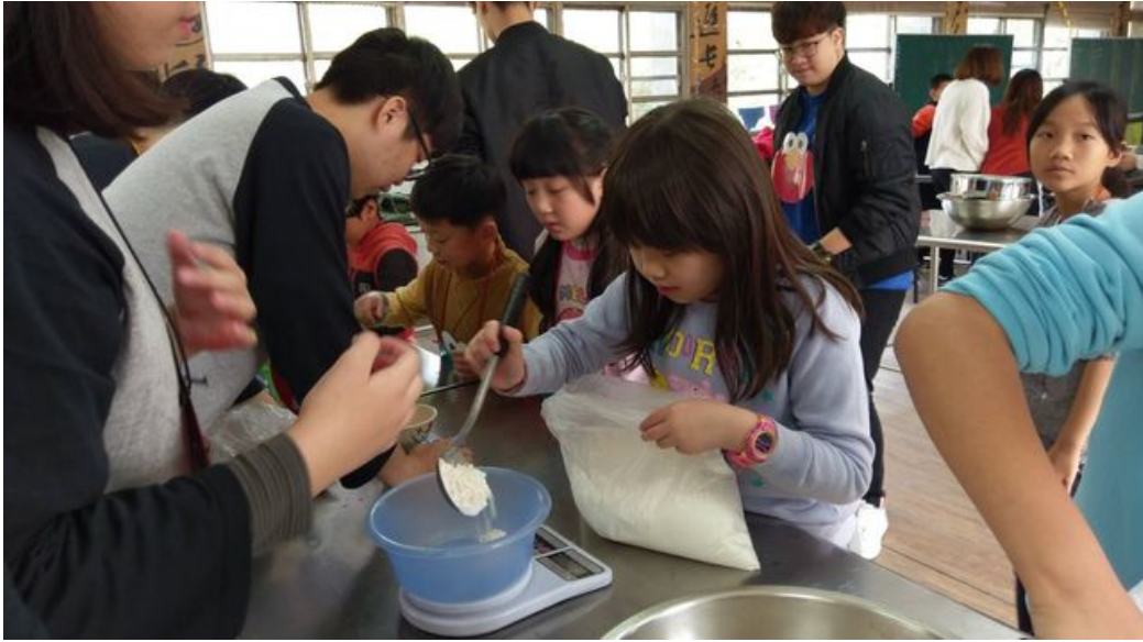
小朋友認真專注食材秤重。