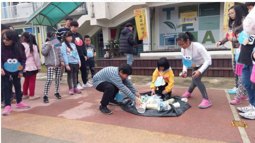
小朋友化身環保小尖兵，透過遊戲學習資源回收。