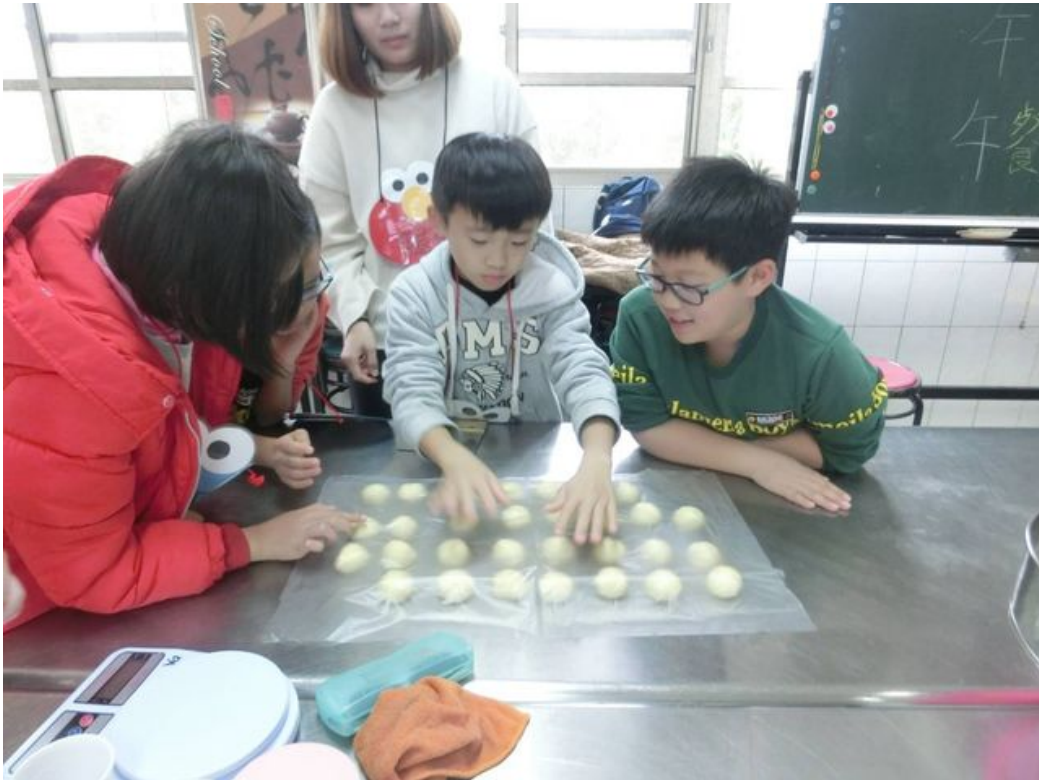
奶酥麵包教學和製作。

嘉南藥理大學食品科技系學生，發揮愛心當仁不讓，日前利用寒假前往阿里山的嘉義縣番路鄉隙頂國小，舉辦「品格暨烘焙教育研習營」，教導小朋友烘焙技術，並從「學中做、做中學」體驗過程裡，培養「職人」精神品格，不僅讓偏鄉學童習得一技之長，也在歲末迎春之際，留下美好的難忘回憶。