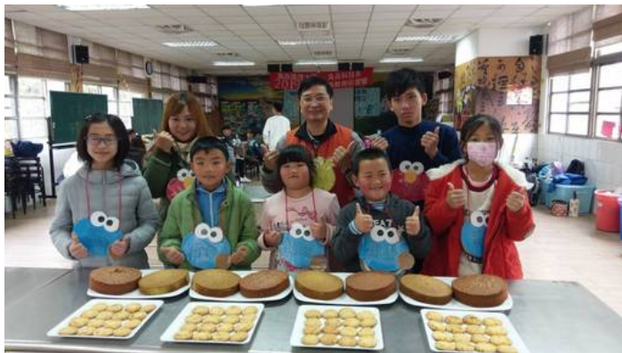
學童對自己烘焙的海綿蛋糕與桃酥成果相當得意