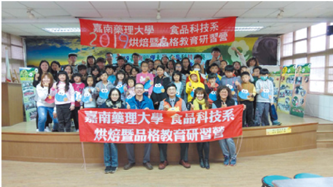
● 嘉藥舉辦「品格暨烘焙教育研習營」。

嘉南藥理大學食品科技系，日前利用寒假前往阿里山的隙頂國小，舉辦「品格暨烘焙教育研習營」，教導小朋友烘焙技術，並從「學中做、做中學」體驗過程裡，培養「職人」精神品格，不僅讓偏鄉學童習得一技之長，也在歲末迎春之際，留下美好的難忘回憶。