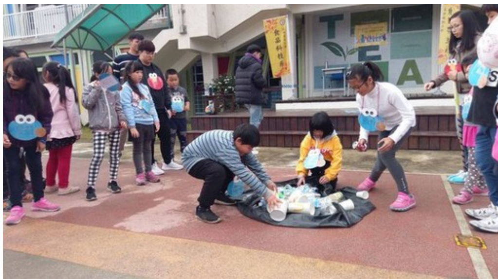
小朋友化身環保小尖兵，透過遊戲學習資源回收。