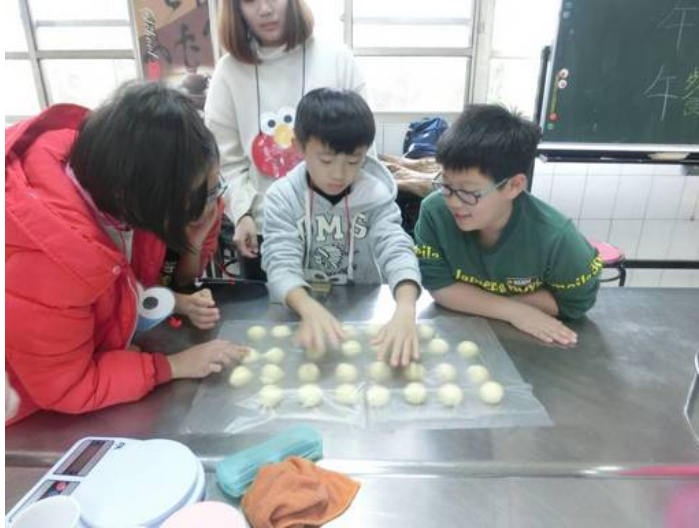
奶酥麵包教學和製作