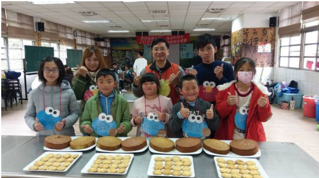
學童對自己烘焙的海綿蛋糕與桃酥成果相當得意。