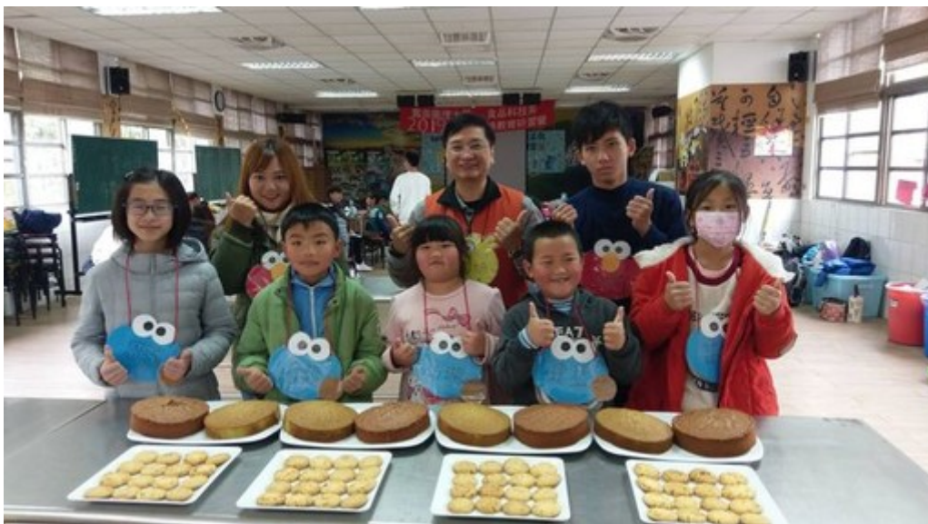
學童對自己烘焙的海綿蛋糕與桃酥成果相當得意。