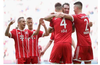
岁末收官战 拜仁力争为