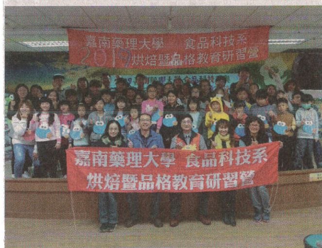
● 嘉藥舉辦「品格暨烘焙教育研習營」。

該校表示，品格暨烘焙教育研習營是嘉藥食品系每年的傳統活動，至今已連辦九屆，對象都是阿里山區的國小學童，不僅增進學童課外知識技能，更讓大學生發揮專業所學，從中體會犧牲奉獻的精神與成就，大小朋友共同學習成長，嘉藥也善盡大學社會責任，教學相長，其樂無窮。