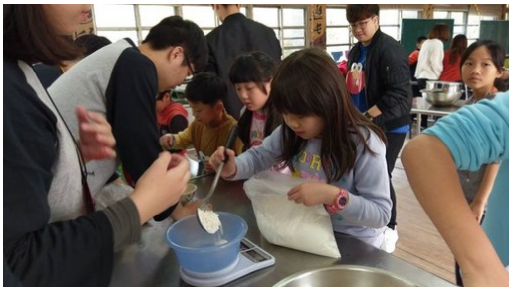
小朋友認真專注食材秤重。