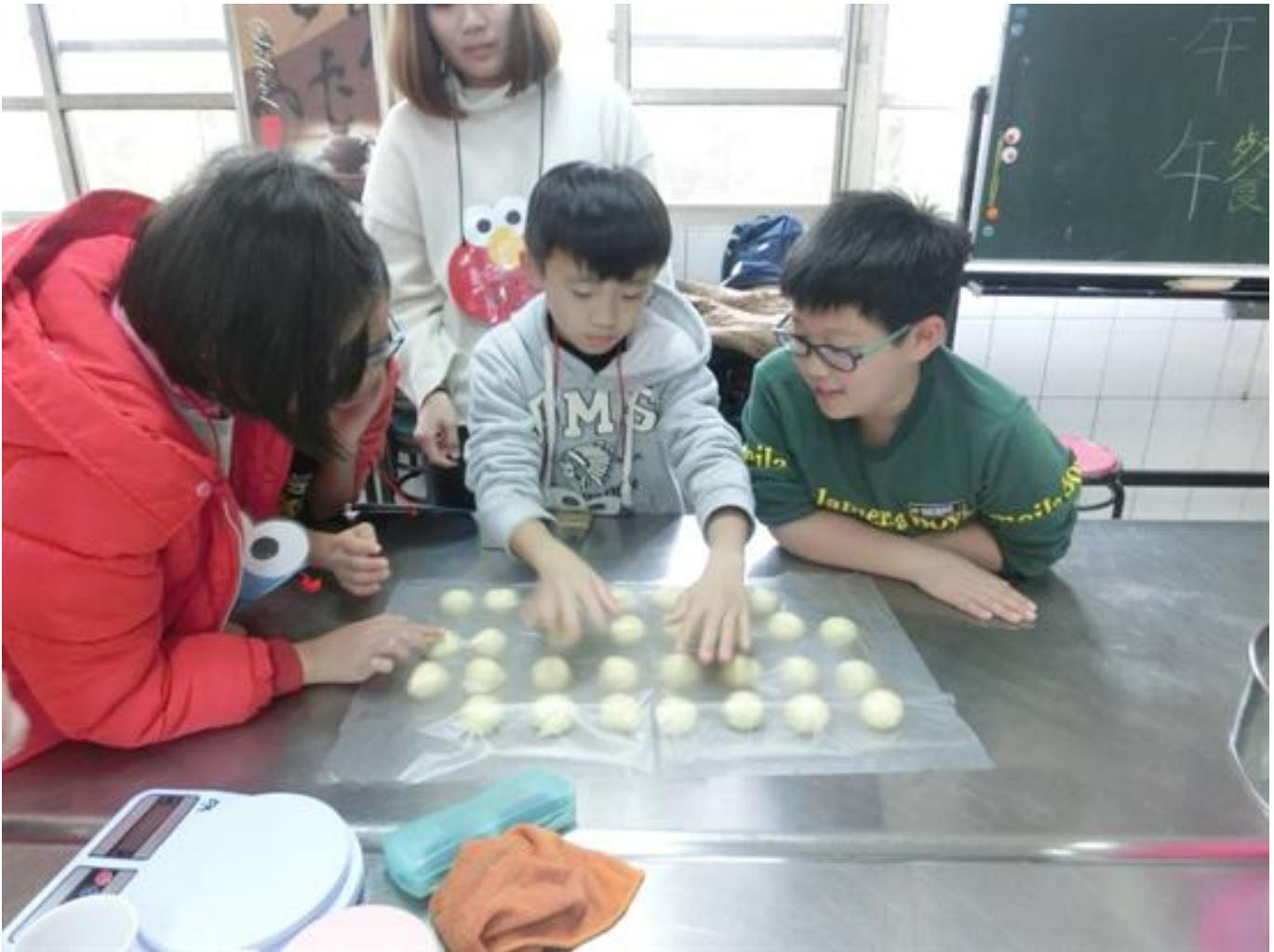
給學童愛與希望 嘉藥食品系烘焙飄香阿里山

(中央社訊息服務20190128 09:14:09)嘉南藥理大學食品科技系學生，發揮愛心當仁不讓，日前利用寒假前往阿里山的嘉義縣番路鄉隙頂國小，舉辦「品格暨烘焙教育研習營」，教導小朋友烘焙技術，並從「學中做、做中學」體驗過程裡，培養「職人」精神品格，不僅讓偏鄉學童習得一技之長，也在歲末迎春之際，留下美好的難忘回憶。