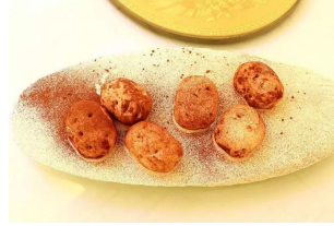
岁末将至，超值年夜饭！