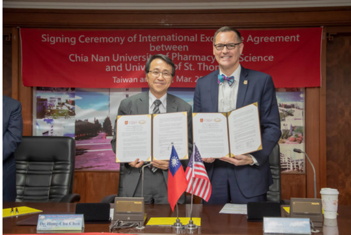
嘉藥校長陳鴻助與美國聖湯瑪士大學校長路維克代表簽署交換生協議書