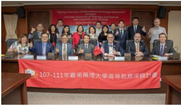
(圖說) 嘉藥與美國聖湯瑪士大學參與交換生簽約儀式貴賓合影。

〔記者鄭德政南市報導〕美國聖湯瑪士大學一行8人，3月28日拜會在台南的嘉南藥理大學。兩校本為姊妹校，這次久別相見，格外親切溫馨，也為雙方進一步推動學術交流，簽署合作協議書，此後將正式開啟交換生制度，未來兩校學生於在學期間，可到對方學校研修課程並相互承認學分，不僅嘉惠兩校學子，也擴大彼此實質互惠的交流平台。