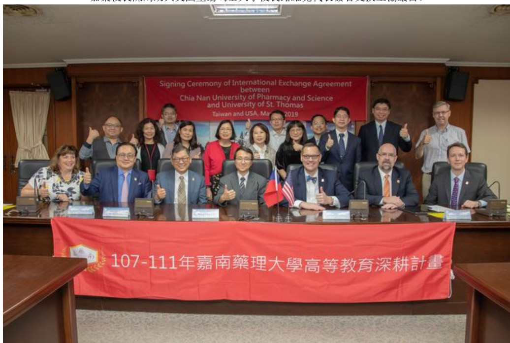
參與簽約儀式貴賓合影。