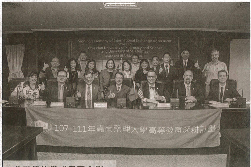
參與簽約儀式貴賓合影。