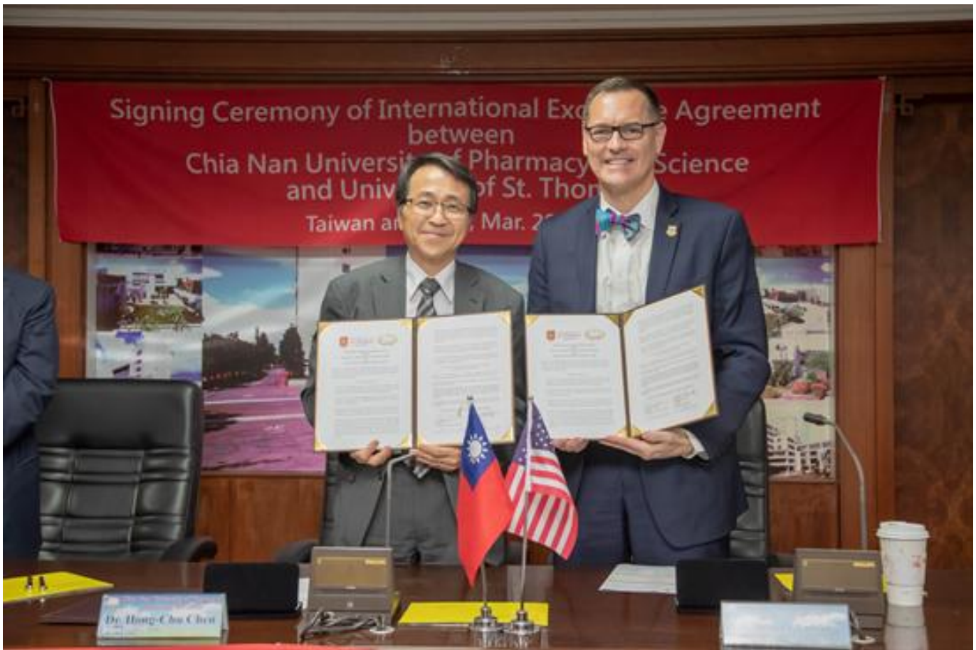
嘉藥與美國聖湯瑪士大學 締結交換生協議嘉惠學子

(中央社訊息服務20190401 09:23:02)美國聖湯瑪士大學一行8人，3月28日拜會在台南的嘉南藥理大學。兩校本為姊妹校，這次久別相見，格外親切溫馨，也為雙方進一步推動學術交流，簽署合作協議書，此後將正式開啟交換生制度，未來兩校學生於在學期間，可到對方學校研修課程並相互承認學分，不僅嘉惠兩校學子，也擴大彼此實質互惠的交流平台。