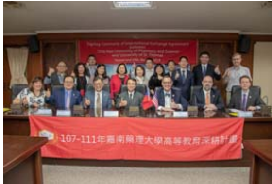
參與簽約儀式貴賓合影。

【記者孫宜秋／南市報導】美國聖湯瑪士大學一行8人，3月28日拜會在台南的嘉南藥理大學。兩校本為姊妹校，這次久別相見，格外親切溫馨，也為雙方進一步推動學術交流，簽署合作協議書，此後將正式開啟交換生制度，未來兩校學生於在學期間，可到對方學校研修課程並相互承認學