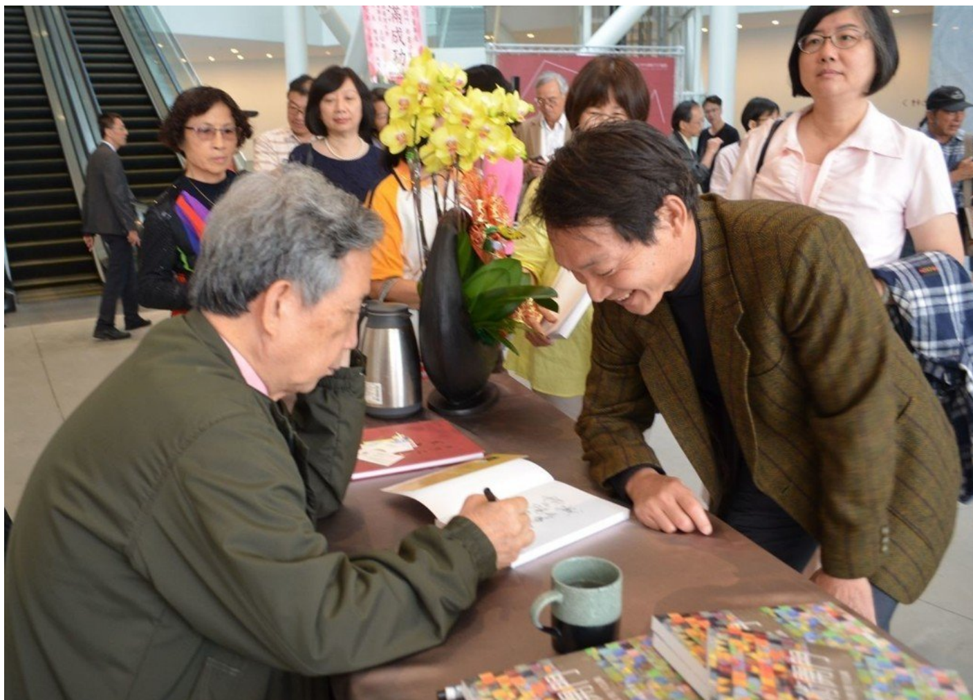
簽書會湧現人潮。