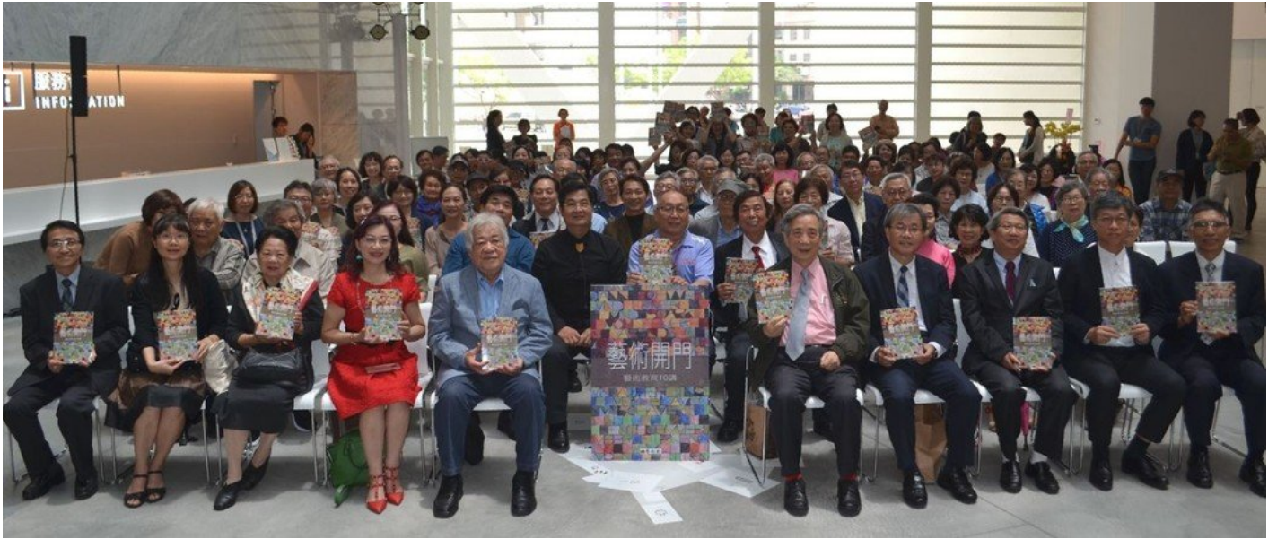
貴賓出席簽書會現場。

南美館潘禧館長指出，黃董事長著作甚豐，包含各種美學論著及畫冊已出版80餘本，坐車就作筆記，平均每年出書1至2本，並不斷舉辦畫展，從發現藝術到創作藝術，《藝術開門》一書涵蓋兒童的藝術啟蒙、家庭的藝術教育、學校的藝術教育、社會的藝術教育、博物館的藝術教育、時空之藝術教育，乃至於文化資產中的藝術與教育，方方面面，將幾十年的經驗與大家分享，可開啟藝術之大門。