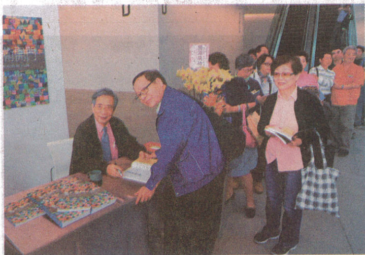
↑台南市美術館董事長黃光男《藝術開門》新書發表會反應熱烈，為讀者簽名留念。

記者林雪娟／台南報導 深知藝術教育重要性，南美館董事長黃光男八日於南美館發表《藝術開門》新書，希望透過藝術，啟動民衆心靈，進而提升全民美學，讓台南成爲美感城市。南美館開館以來，已有八十萬人次入場參觀，免費參觀的優惠將延至六月二十日。