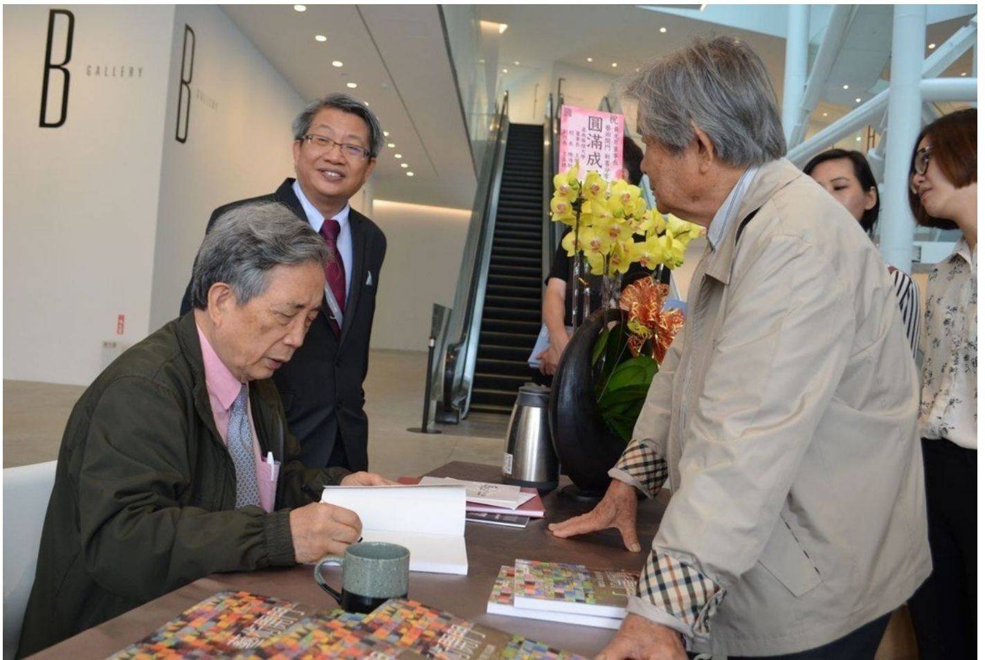
潘福館長陪同黃光男董事長出席簽書會。

黃光男則表示，能夠在臺南聚集藝文界這麼多重要的人非常不容易，非常謝謝大家來。臺南市美術館是全臺最有綜合性功能的一座美術館，希望大家都能一起愛護這座美術館，一同為它也為藝術教育努力。