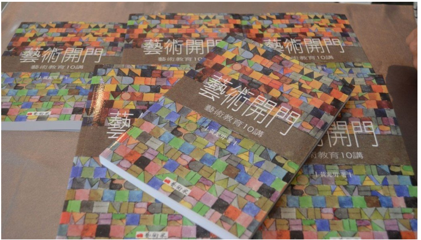
黃光男新書 - 《藝術開門》。