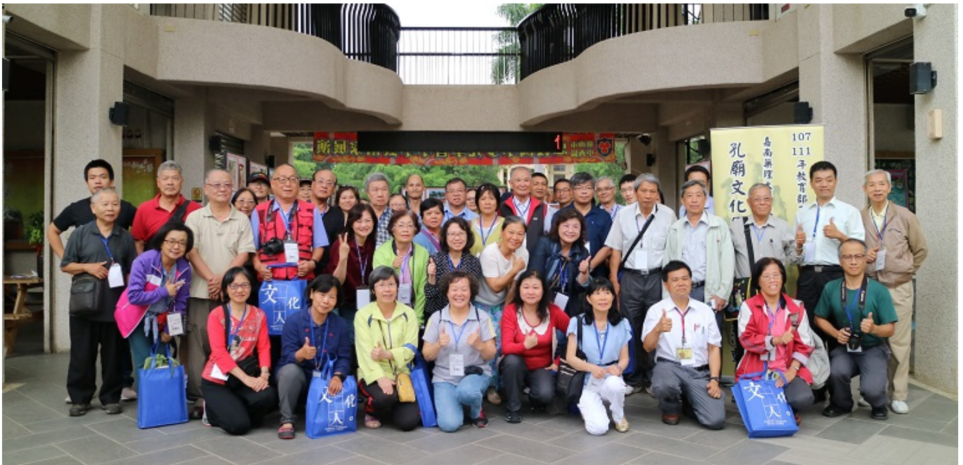
▲嘉藥舉辦孔廟踏查導覽，參與民眾開心合照。