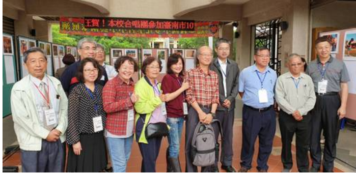
嘉藥舉辦孔廟文化園區踏查導覽活動講師與民眾合影