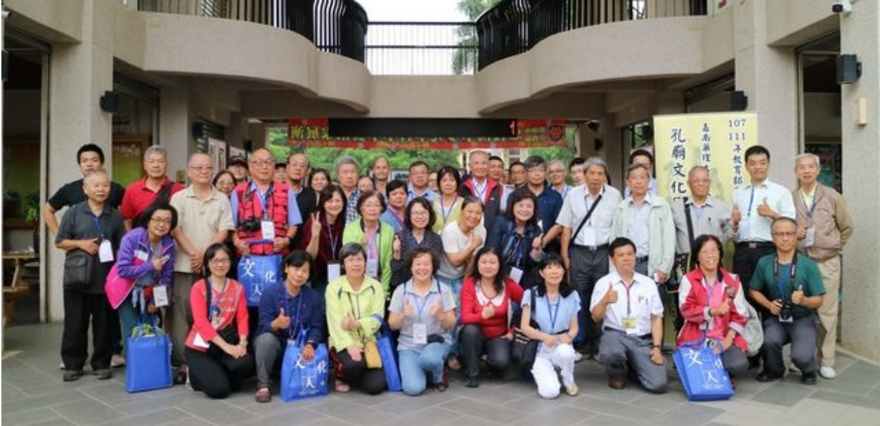
嘉南藥理大學舉辦「孔廟文化園區踏查與導覽」活動。

【101新聞網記者王宇榛 / 台南報導】舒爽初夏何處去？報馬仔大推台南頂級文化園區孔廟，絕對是最佳選擇。嘉南藥理大學日前舉辦「孔廟文化園區踏查與導覽」活動，吸引近百位民眾參加，在學者專家解說及帶領下，結伴共遊孔廟和鄰近景點，體驗動靜兼具的多元文化洗禮，感受府城魅力無窮的風情萬種。