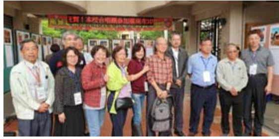
嘉藥舉辦孔廟文化園區踏查導覽活動講師與民眾合影。

【記者孫宜秋／南市報導】舒爽初夏何處去？報馬仔大推台南頂級文化園區孔廟，絕對是最佳選擇。嘉南藥理大學日前就舉辦「孔廟文化園區踏查與導覽」活動，吸引近百位民眾參加，在學者專家解說及帶領下，結伴共遊孔廟和鄰近景點，體驗動靜兼具的多元文化洗禮，感受府城魅力無窮的風情萬種。