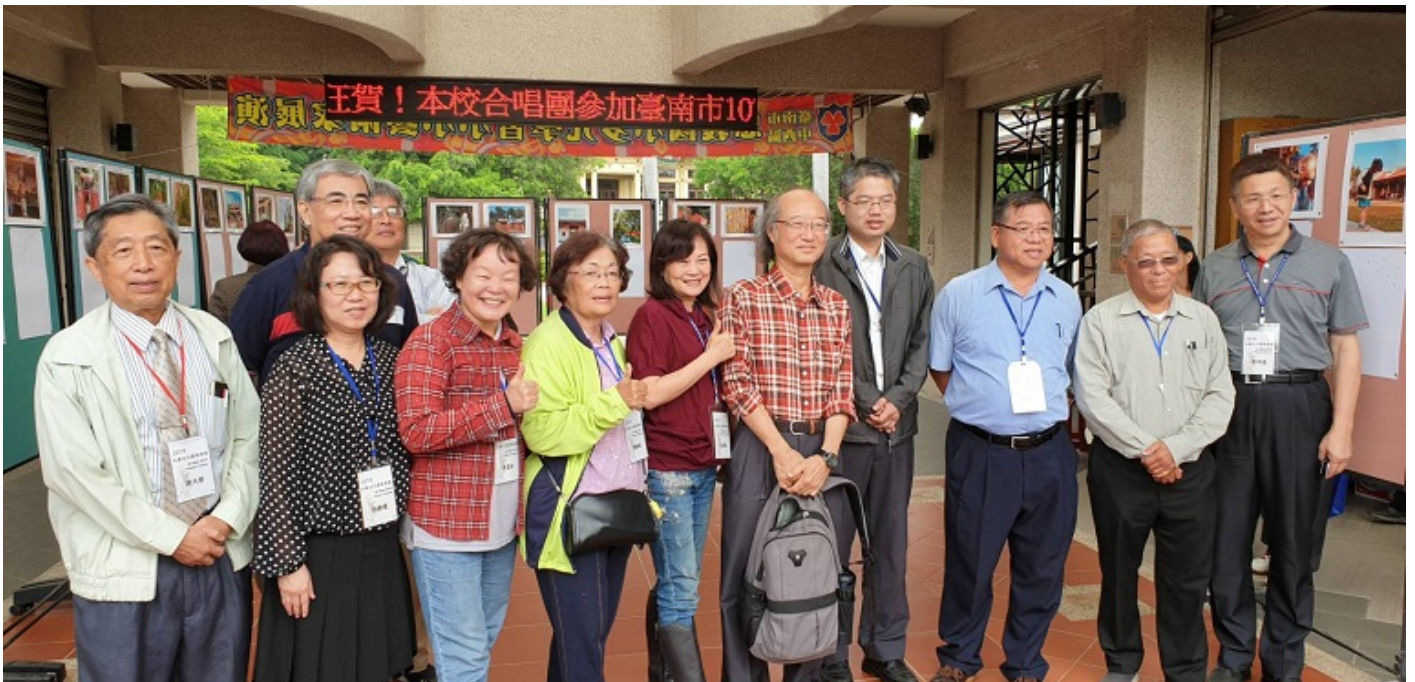
▲嘉藥舉辦孔廟文化園區踏查導覽活動講師與民眾合影。

舒爽初夏台南頂級文化園區孔廟，是最佳選擇。嘉南藥理大學舉辦「孔廟文化園區踏查與導覽」活動，吸引近百位民眾參加，在學者專家解說及帶領下，結伴共遊孔廟和鄰近景點，體驗動靜兼具的多元文化洗禮，感受府城魅力無窮的風情萬種。