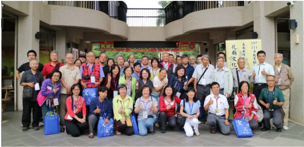
嘉南藥理大學舉辦「孔廟文化園區踏查與導覽」活動。

http://www.cntimes.info 2019-05-06 16:38:40