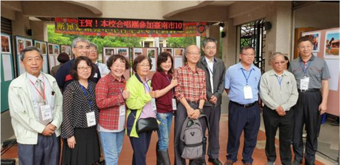
作伙來逛文化大觀園 嘉藥舉辦孔廟踏查導覽

(中央社訊息服務20190507 13:32:36)舒爽初夏何處去？報馬仔大推台南頂級文化園區孔廟，絕對是最佳選擇。嘉南藥理大學日前就舉辦「孔廟文化園區踏查與導覽」活動，吸引近百位民眾參加，在學者專家解說及帶領下，結伴共遊孔廟和鄰近景點，體驗動靜兼具的多元文化洗禮，感受府城魅力無窮的風情萬種。