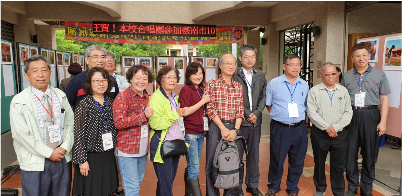
嘉藥舉辦孔廟文化園區踏查導覽活動講師與民眾合影 [圖/記者 黃雅娟 翻攝]

第二場演講，邀請著名建築權威成大教授傅朝卿主講「從文化視角看台南孔廟」，他提出「除具備全台首學的歷史意義外，台南孔廟是否也可以像歐美和日本等地一樣，將文化遺產與商業行為共容，為古蹟帶來無限商機？」引人思索的議題，而結論中傅教授則強調，只要透過整體文創行銷，台南孔廟的經濟行情絕不輸給山東曲阜等古蹟。