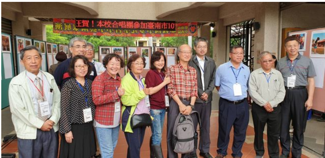
嘉藥舉辦孔廟文化園區踏查導覽活動講師與民眾合影。