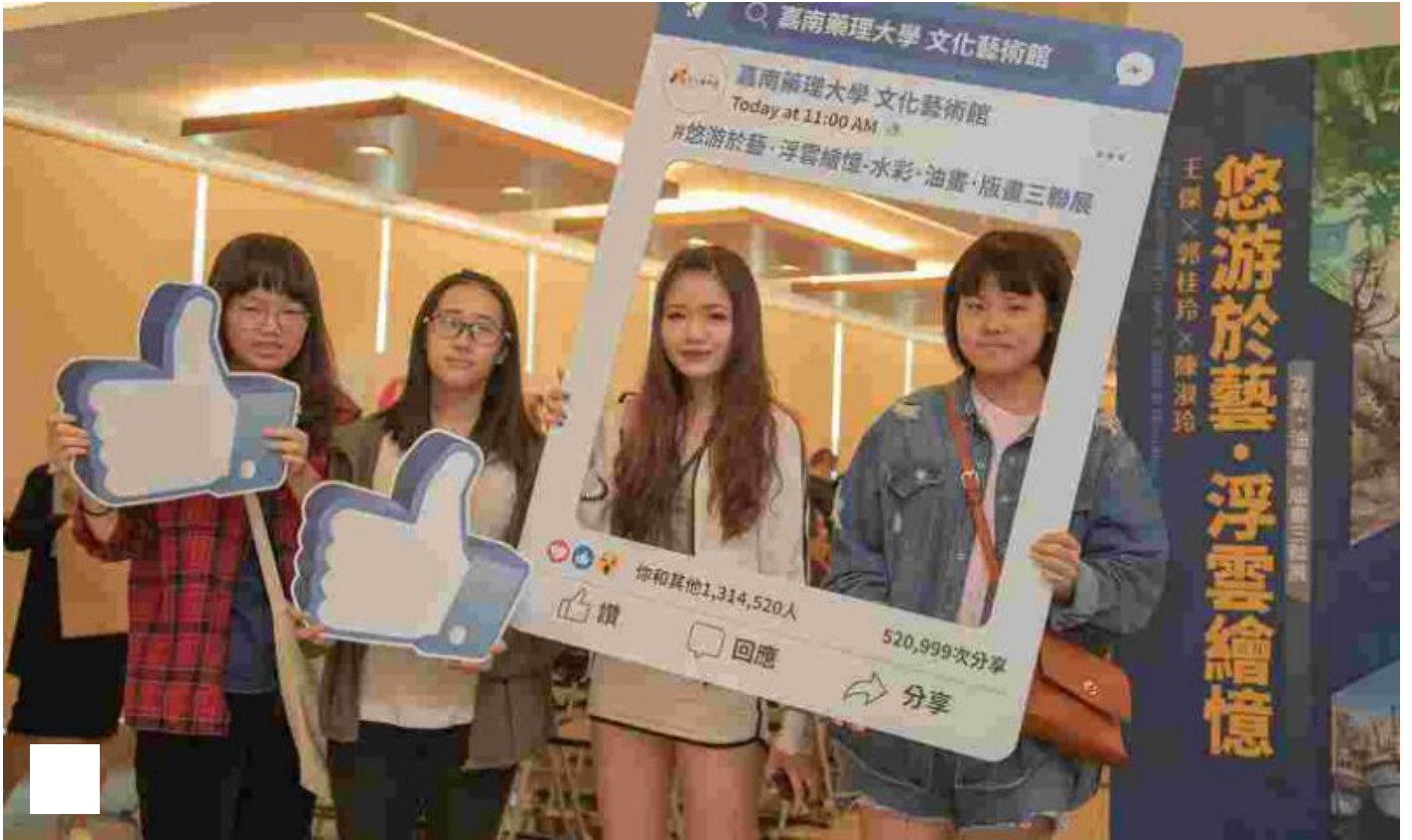
悠游於藝×浮雲繪憶，藝壇三傑嘉藥聯展