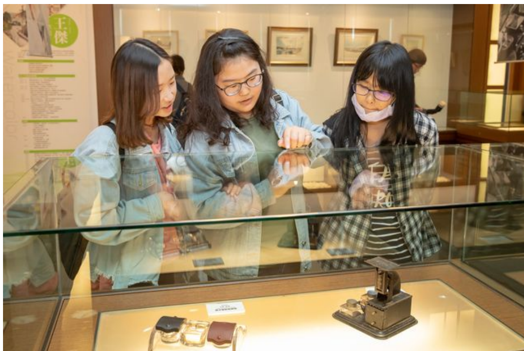
同學們目不轉睛看著西式骨董墨水檯。