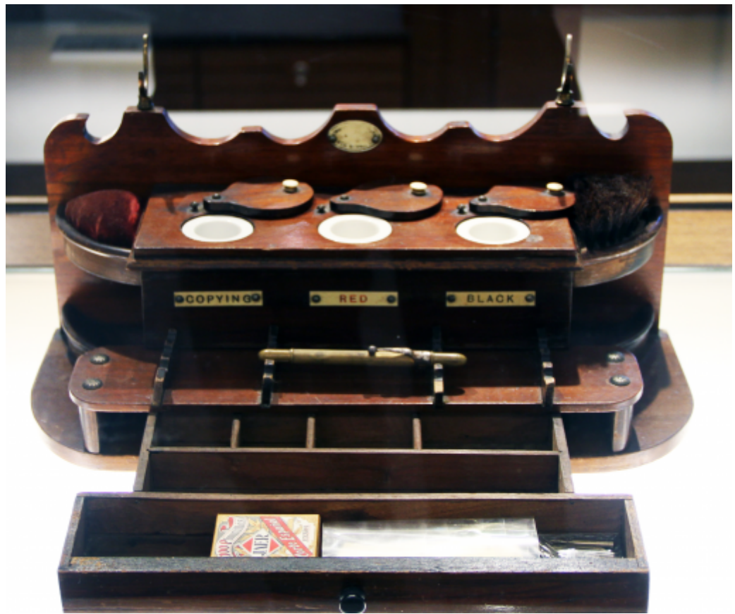
王傑收藏的美式木製三色墨水檯，造型古樸精緻。