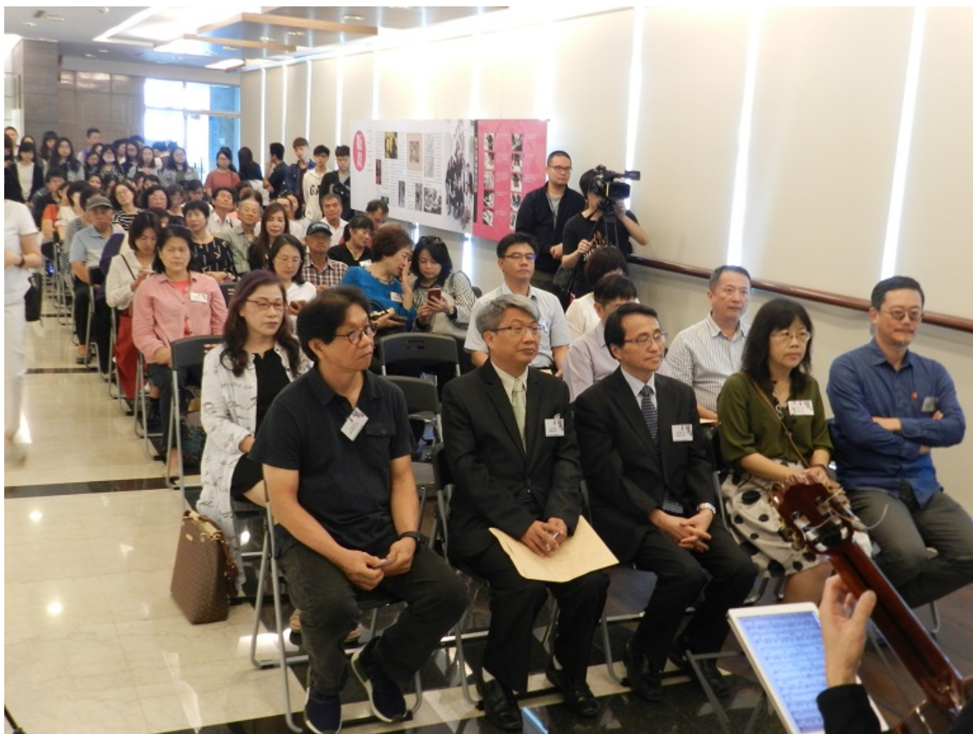
▲藝壇三傑嘉藥聯展，開幕茶會現場擠爆人潮。