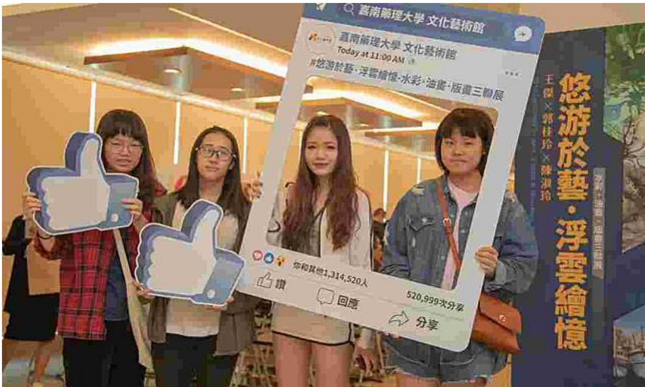
圖／嘉藥舉辦悠游於藝×浮雲繪憶展覽吸引眾多學生前往參觀

同時飽覽三位大師不同類型的藝術創作，機會可謂難尋。嘉南藥理大學文化藝術館舉辦「悠游於藝·浮雲繪憶—水彩、油畫、版畫三聯展」，4月11日起邀請三位台灣藝術家：王傑、郭桂玲及陳淑玲，共同展示自己專業領域的藝術佳作，展期至6月28日止，歡迎民眾前往觀賞，品味難得的藝術饗宴。