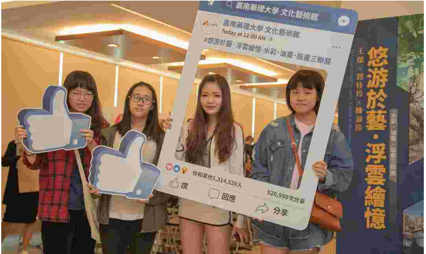
悠游於藝×浮雲繪憶，藝壇三傑嘉藥聯展