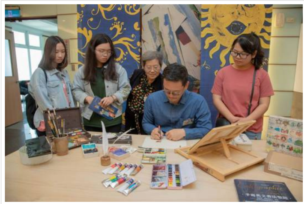
圖6：嘉藥舉辦悠游於藝×浮雲繪憶展覽吸引眾多學生前往參觀。