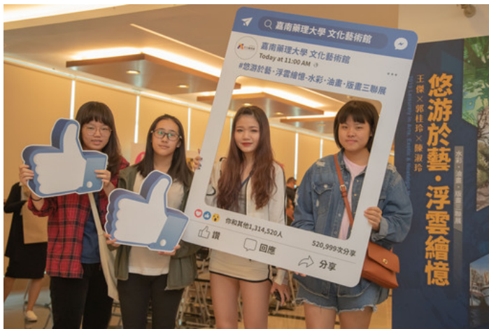
嘉藥舉辦悠游於藝×浮雲繪憶展覽吸引眾多學生前往參觀