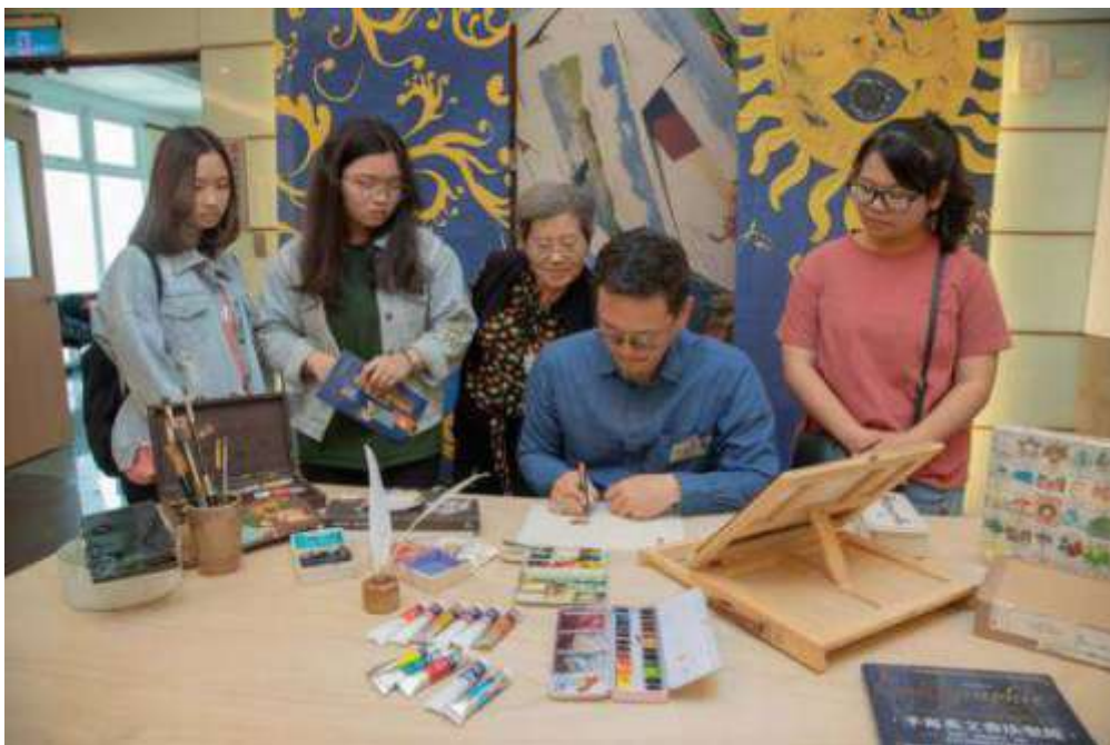
圖6：嘉藥舉辦悠游於藝×浮雲繪憶展覽吸引眾多學生前往參觀。