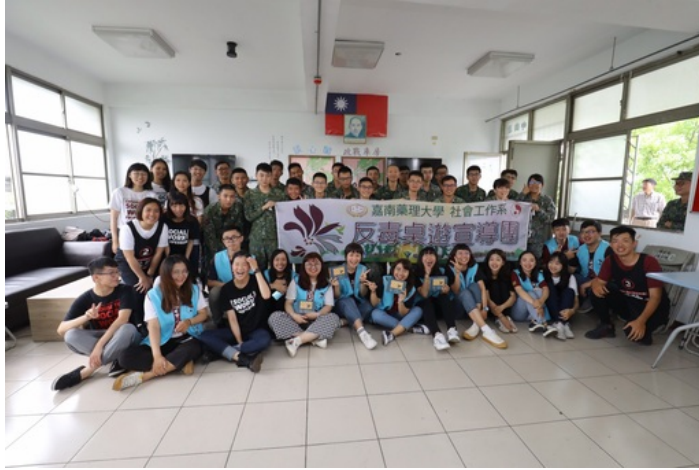
嘉藥社工系學生以創意的桌遊為國軍宣導反毒