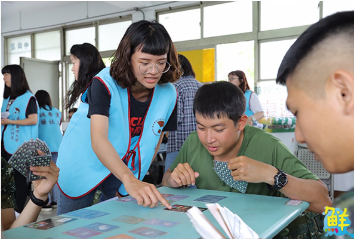
▲陸軍三九化學兵群弟兄在嘉藥社工系學生帶領下開心玩桌遊。

獲悉嘉藥社工系將教條式的反毒宣教轉化為互動式遊戲，顛覆以往枯燥無味的傳統模式，相當新奇又有成效，因此借重他們的專長，希望透過反毒桌遊活動，讓弟兄在遊戲的潛移默化中，深入瞭解毒品及其危害，有效落實「識毒、不嗜毒」目標，盼人人都成為反毒先鋒。