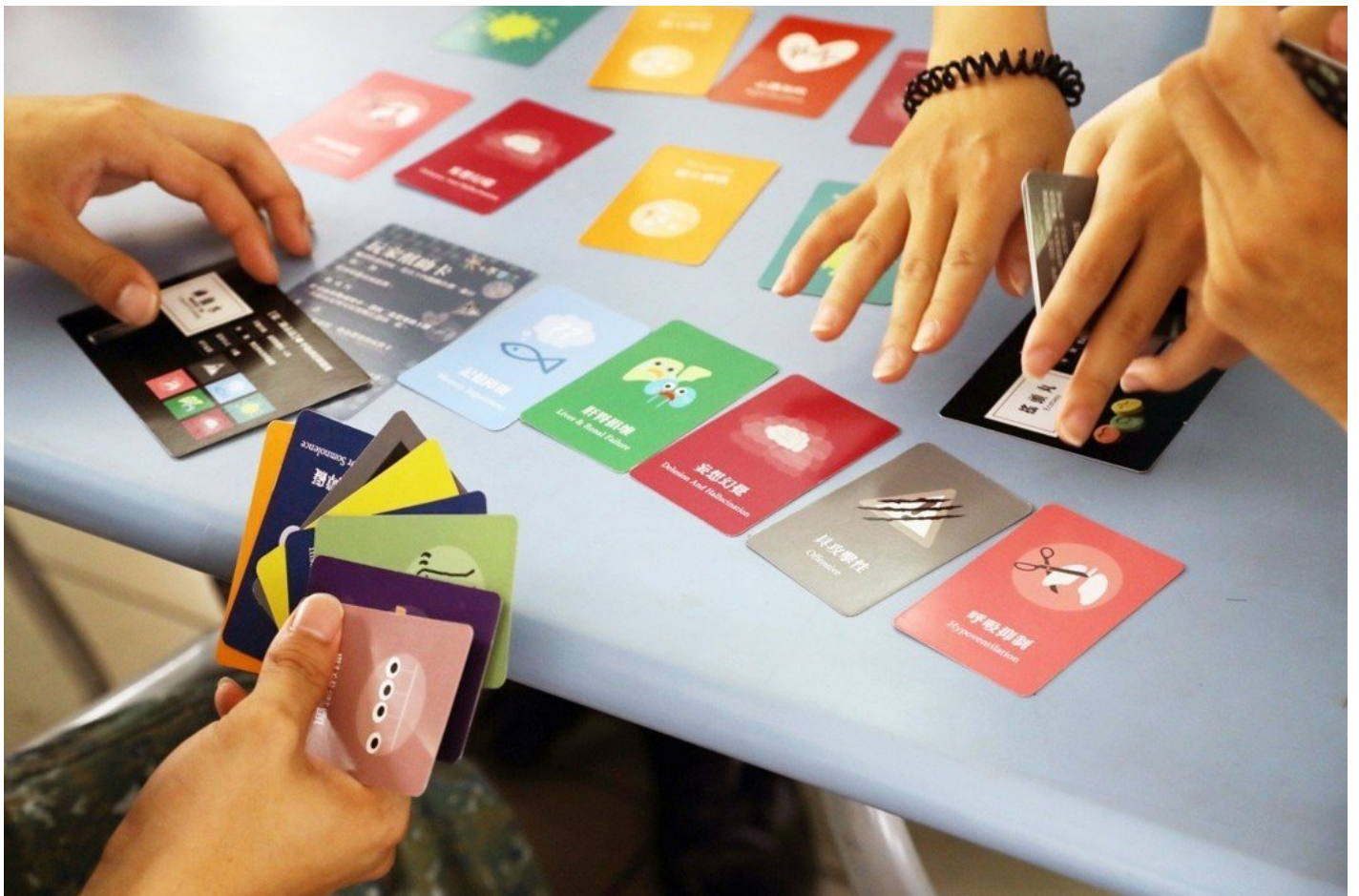
衛福部開發的桌遊色彩豐富又具教育性，反毒宣導成效佳。