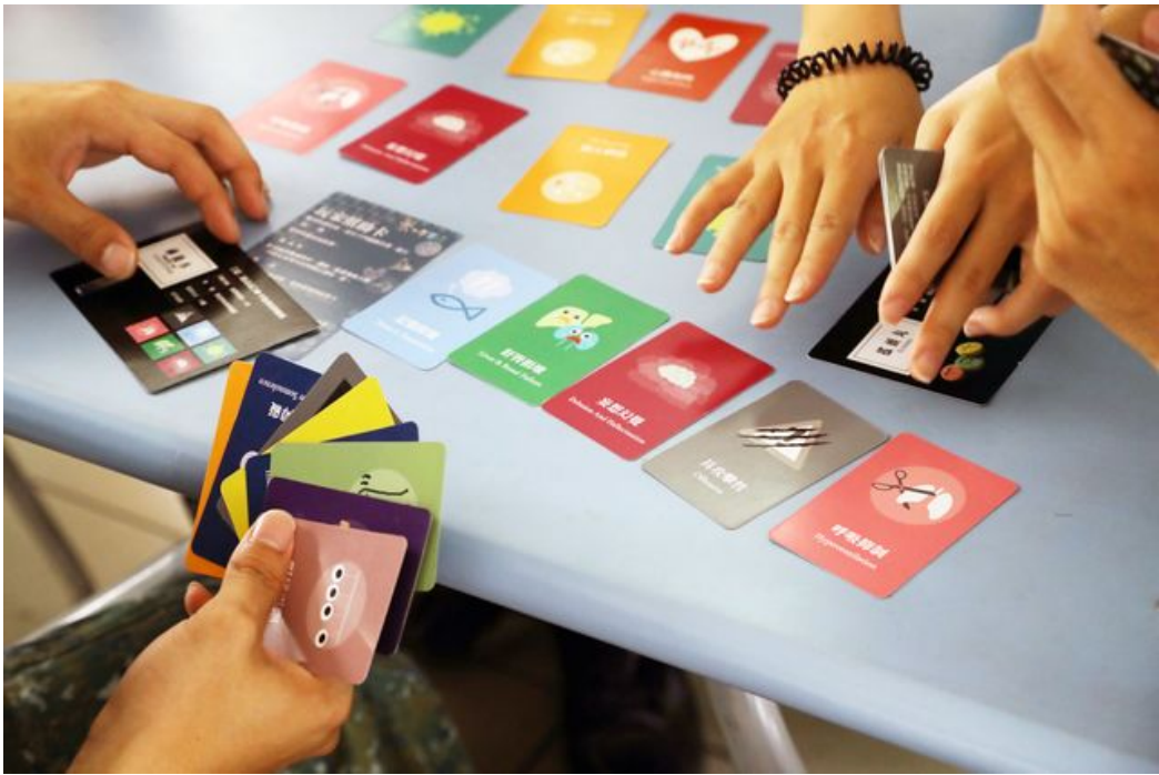
衛福部開發的桌遊色彩豐富又具教育性，反毒宣導成效佳。

政府積極推動反毒，國軍也不落人後。5月14日，陸軍三九化學兵群邀請嘉南藥理大學社會工作系，赴營區倡導反毒，結合社工專業以及時下流行的桌遊，以寓教於樂方式宣傳，官兵和大學生莫不興致高昂，大家在充滿趣味的遊戲中同樂兼推廣反毒，活動迴響熱絡，宣導成效顯著。