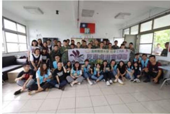
嘉藥社工系學生以創意的桌遊為國軍宣導反毒。

【記者孫宜秋／南市報導】政府積極推動反毒，國軍也不落人後。5月14日，陸軍三九化學兵群邀請嘉南藥理大學社會工作系，赴營區倡導反毒，結合社工專業以及時下流行的桌遊，以寓教於樂方式宣傳，官兵和大學生莫不興致高昂，大家在充滿趣味的遊戲中同樂兼推廣反毒，活動迴響熱烈，宣導成效顯著。