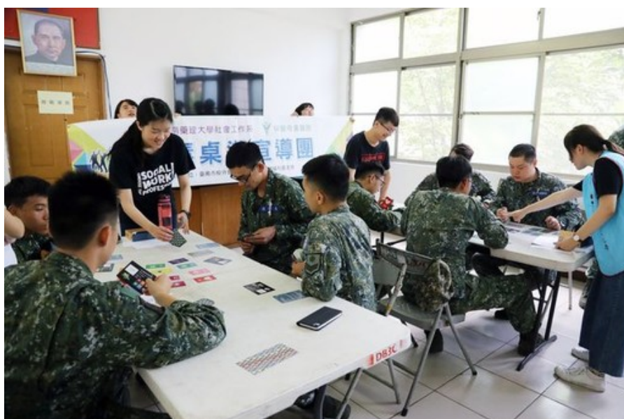
陸軍三九化學兵群官兵熱烈參與反毒桌遊活動。