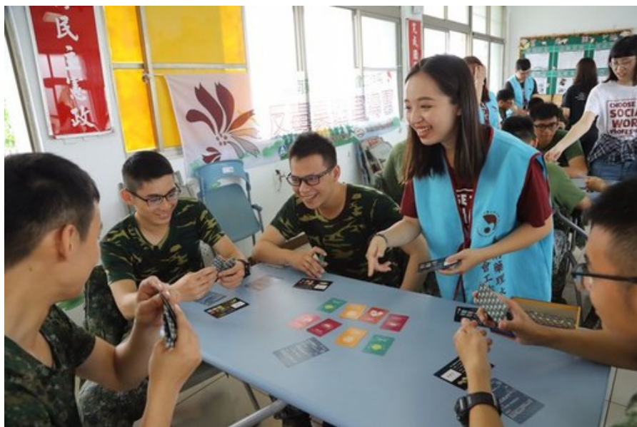
嘉藥社工系運用「藥·不要玩」桌遊，向官兵推廣反毒理念。