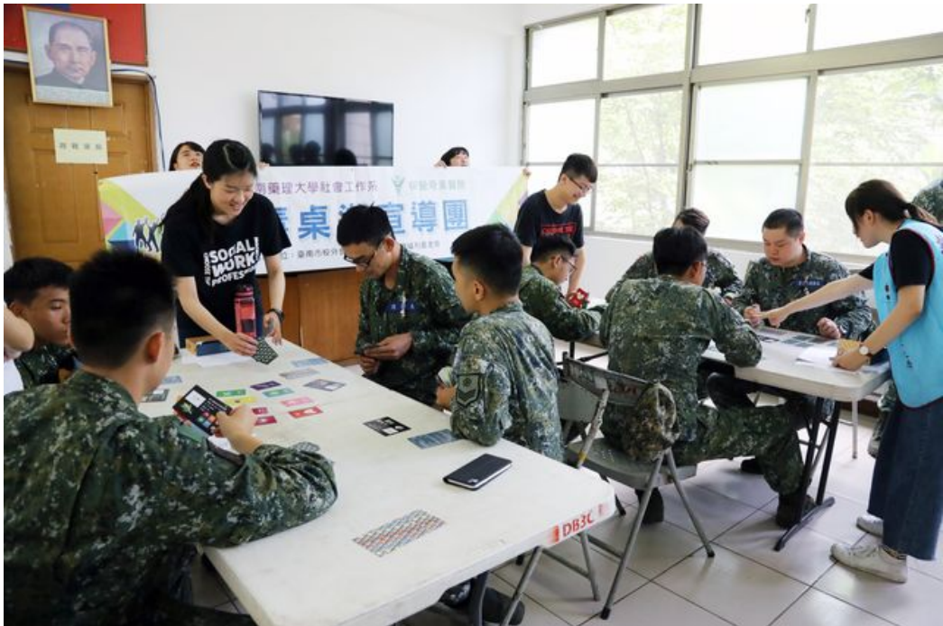
陸軍三九化學兵群官兵熱烈參與反毒桌遊活動。