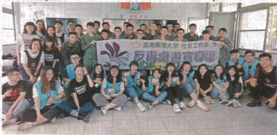
嘉藥社工系生入營反毒宣導，用桌遊鼓舞軍心！