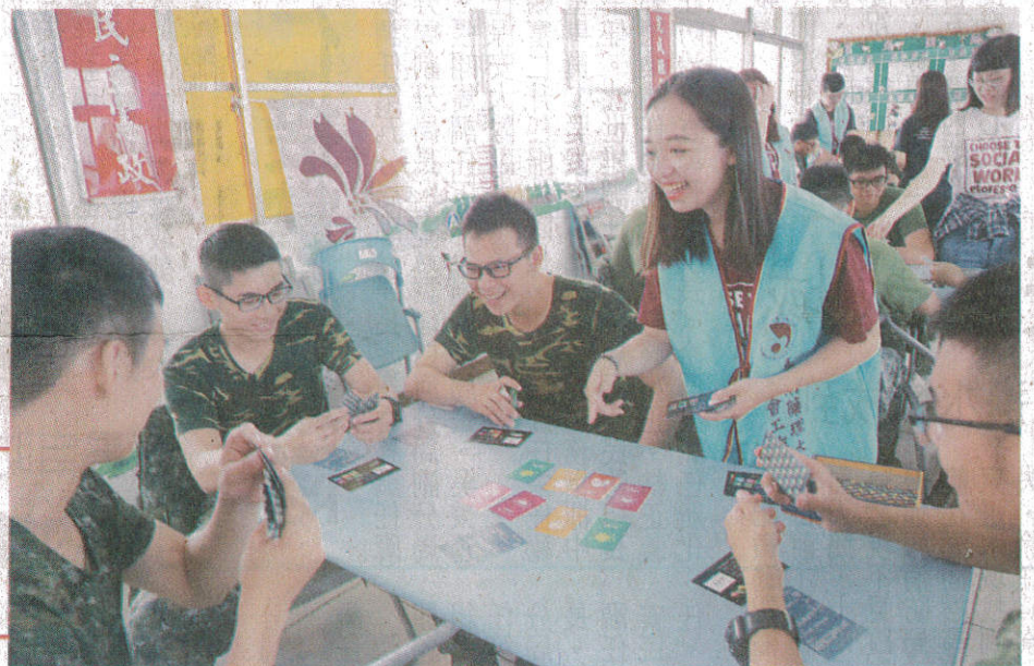
→嘉藥社工系學生運用「藥，不要玩」桌遊，向官兵推廣反毒理念。

嘉藥社工系主任謝聖哲表示，社工系反毒桌遊宣導團在柳營奇美醫院反毒教育資源中心協助下，自去年十月開始至今已到過十四所高中職校進行反毒宣導，這次是首次進入軍中，希望有機會能到社會各階層為推廣反毒理念奉獻心力。