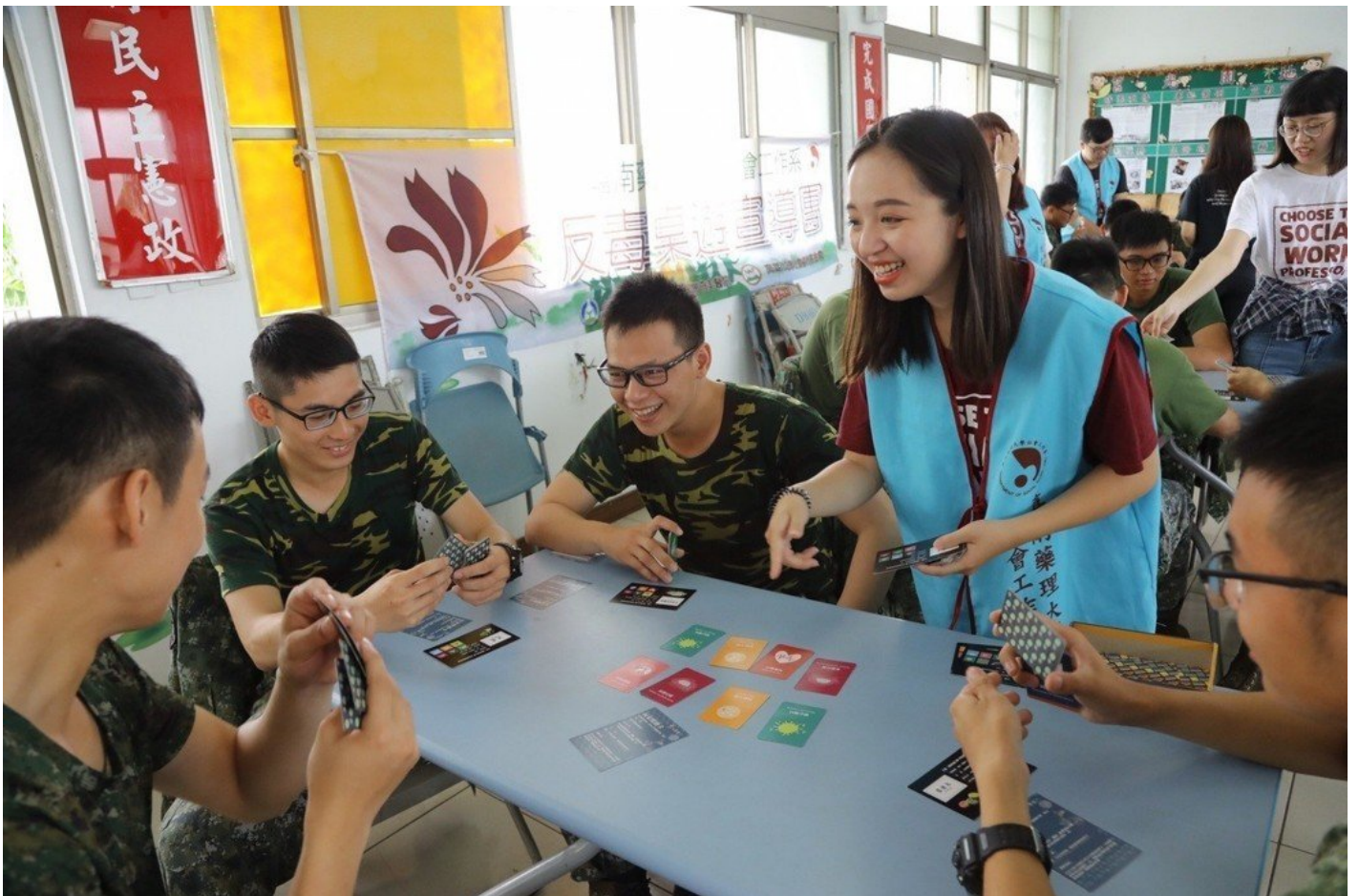
嘉藥社工系運用「藥·不要玩」桌遊，向官兵推廣反毒理念。