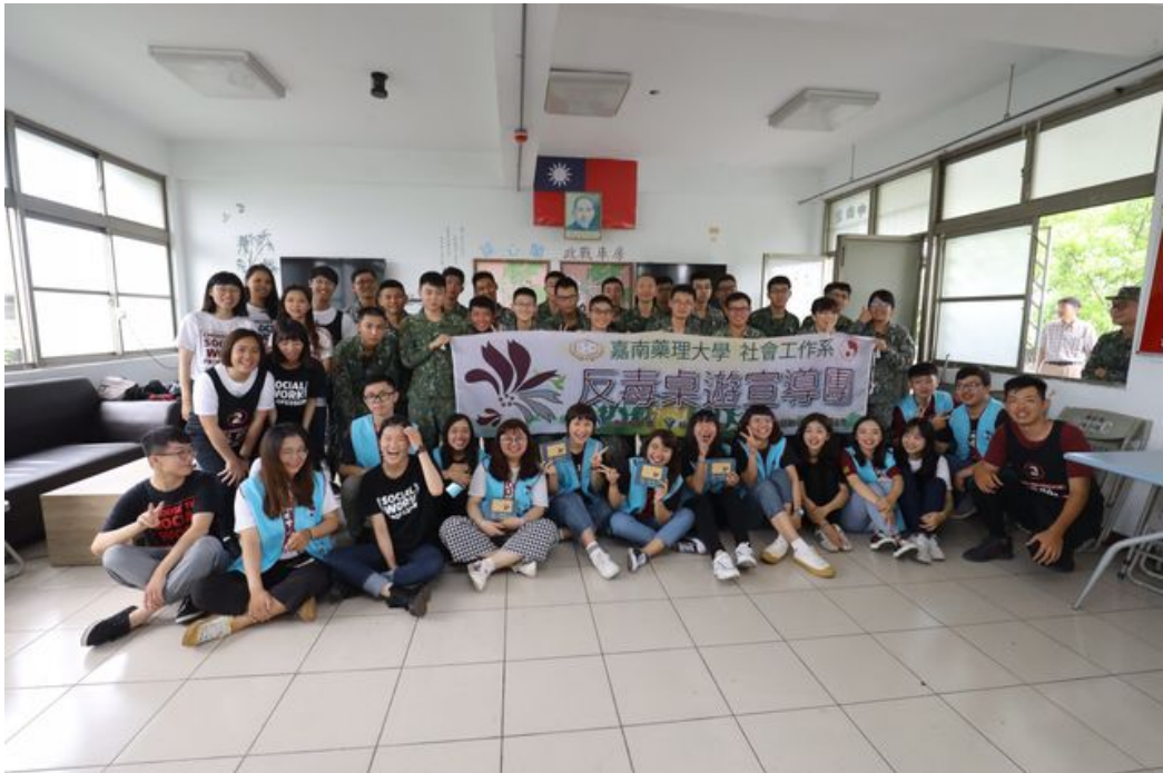
嘉藥社工系學生以創意的桌遊為國軍宣導反毒。

http://www.cntimes.info 2019-05-14 20:05:59