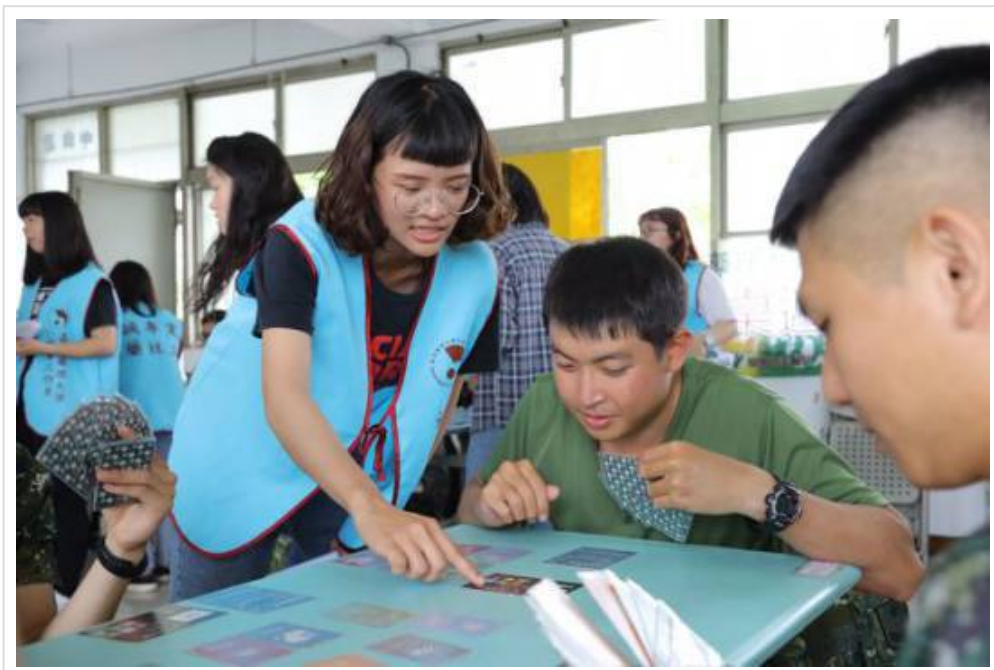
圖5：衛福部開發的桌遊色彩豐富又具教育性，反毒宣導成效佳。