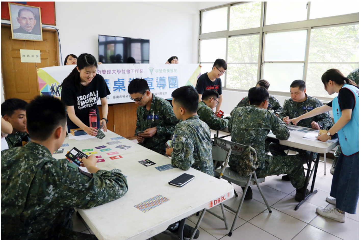
▲陸軍三九化學兵群官兵熱烈參與反毒桌遊活動。

嘉藥社工系反毒桌遊宣導團，由系上老師帶領14名學生，前往位在台南永康區的三九化學兵群營區，受到指揮官莊銘忠上校及部隊弟兄盛情歡迎。軍方為求全營官兵均能受益，特別安排4梯次，每梯次40人進行1小時的反毒桌遊，活動從早上持續到下午，共約160名官兵熱烈參與。