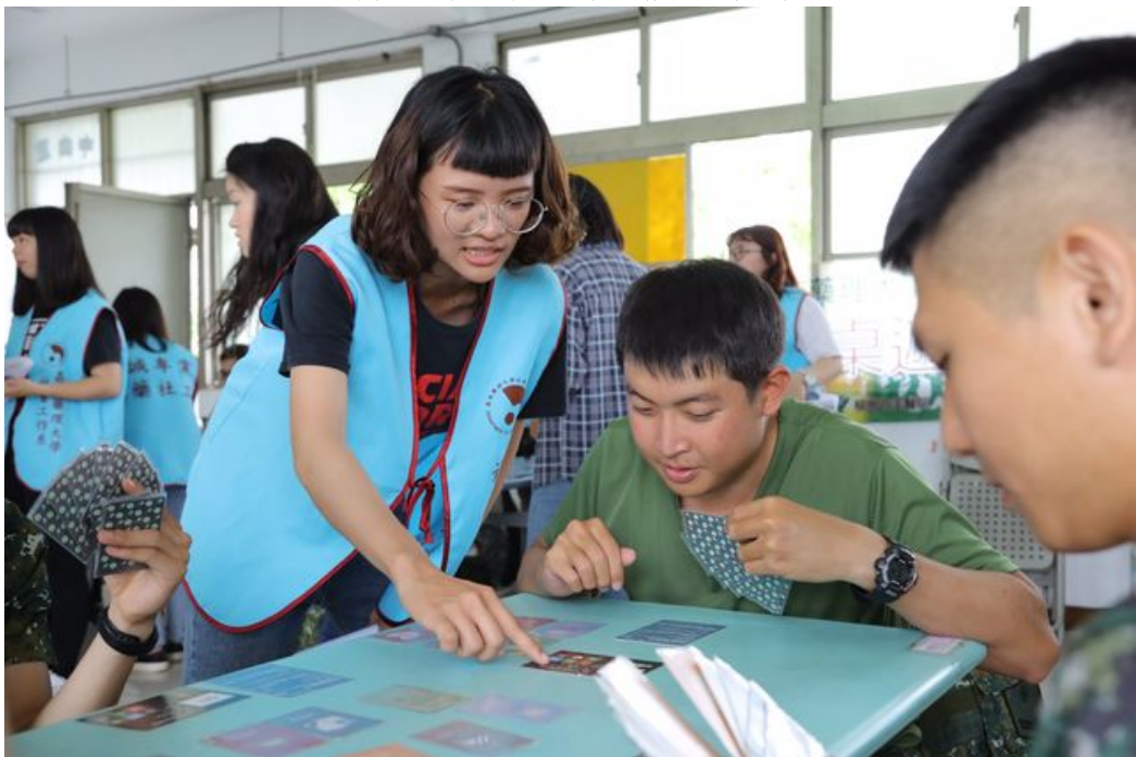
陸軍三九化學兵群弟兄在嘉藥社工系學生帶領下開心玩桌遊。