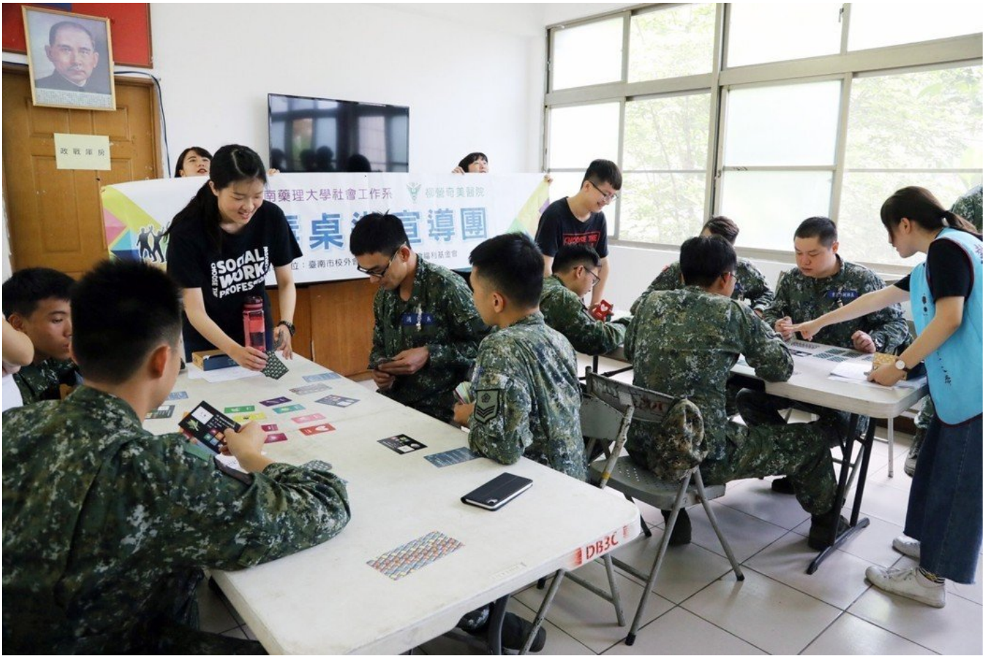
陸軍三九化學兵群官兵熱烈參與反毒桌遊活動。