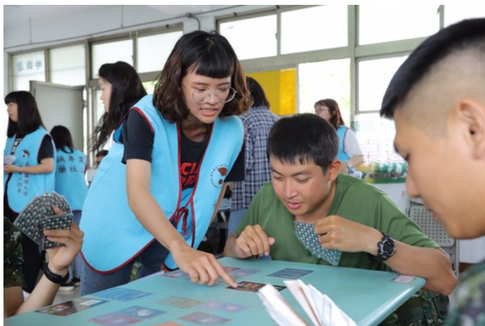
陸軍三九化學兵群弟兄在嘉藥社工系學生帶領下開心玩桌遊