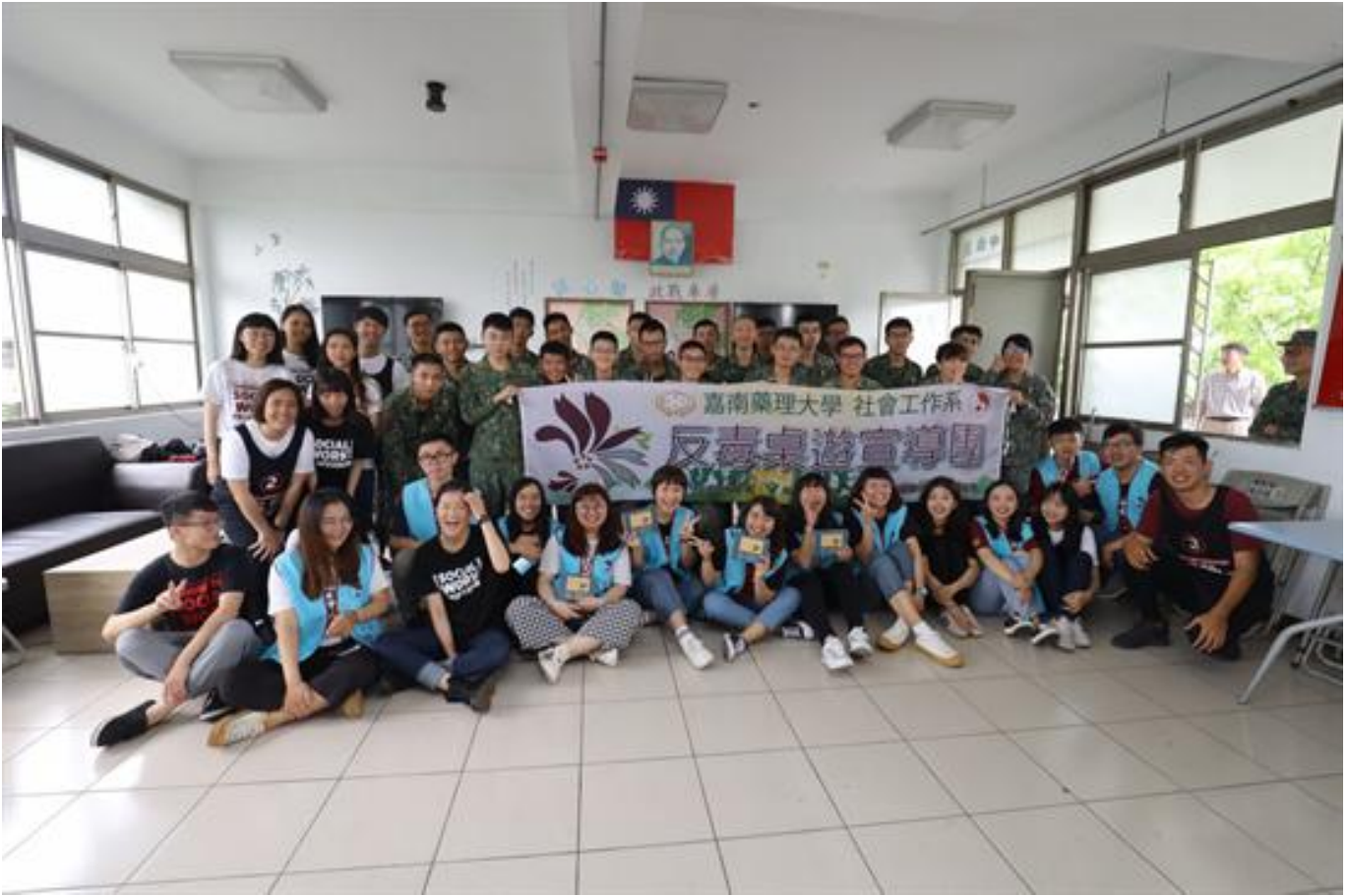
嘉藥社工系生入營反毒宣導 用桌遊鼓舞軍心

(中央社訊息服務20190515 09:18:26)政府積極推動反毒，國軍也不落人後。5月14日，陸軍三九化學兵群邀請嘉南藥理大學社會工作系，赴營區倡導反毒，結合社工專業以及時下流行的桌遊，以寓教於樂方式宣傳，官兵和大學生莫不興致高昂，大家在充滿趣味的遊戲中同樂兼推廣反毒，活動迴響熱絡，宣導成效顯著。