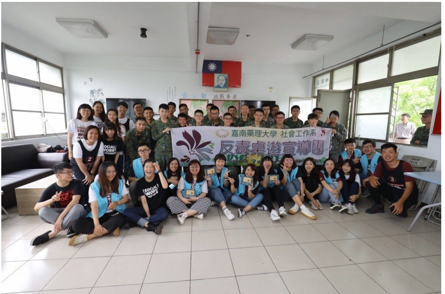
嘉藥社工系學生以創意的桌遊為國軍宣導反毒。