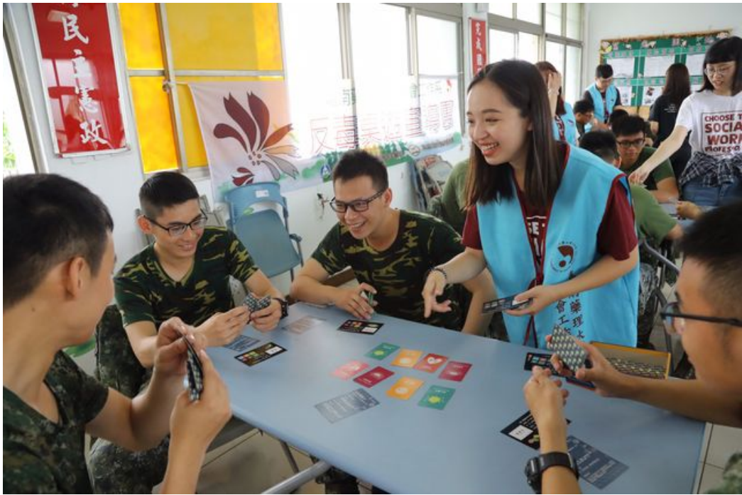
嘉藥社工系運用「藥，不要玩」桌遊，向官兵推廣反毒理念。