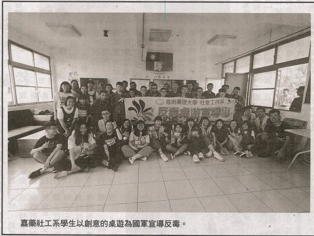
嘉藥社工系學生以創意的桌遊為國軍宣導反毒。

相當新奇又有成效，因此借重他們的專長，希望透過反毒桌遊活動，讓弟兄在遊戲的潛移默化中，深入瞭解毒品及其危害，有效落實「識毒、不嗜毒」目標，盼人人都成為反毒先鋒。