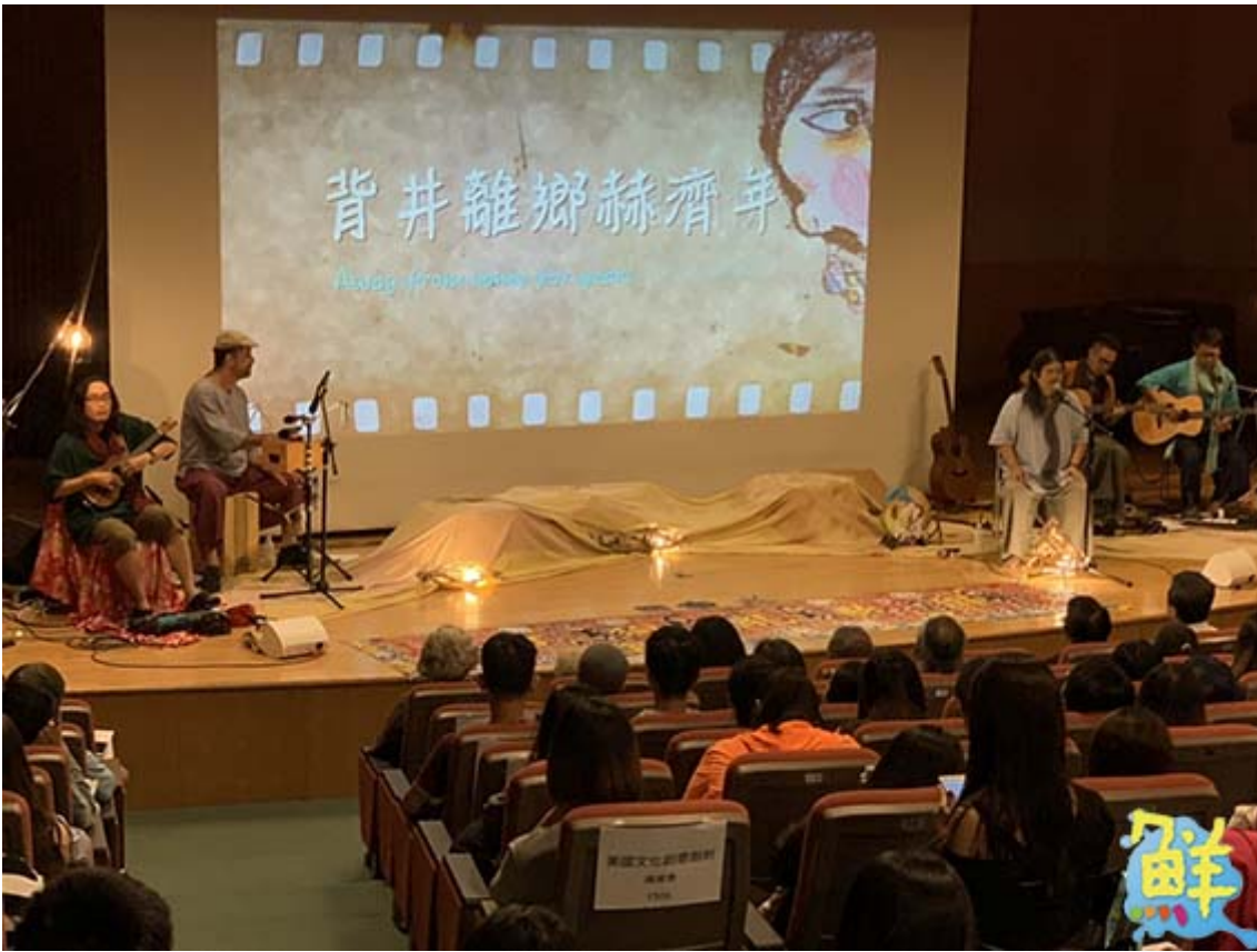
▲金曲歌手嚴詠能率領打狗亂歌團「走唱」嘉藥精彩演出。

嘉藥校長陳鴻助表示，打狗亂歌團從土地出發，以台灣進鄉走唱概念，參與了國內外大小無數的文化節慶展演，也引領民謠進鄉團阿嬤們去年躍上美國芝加哥舞台，今年8月則受邀赴日本巡演，逐步走唱國際，向世人傳達台灣歌謠之美。陳校長說，打狗亂歌團的演出，有溫暖、有熱鬧，也有互動，藉由台灣鄉土記憶的美妙歌聲與影像紀錄，牽起大家的雙手，連結彼此對土地熾熱的心，讓觀眾重溫昔日全家大小一起看戲的快樂年代。