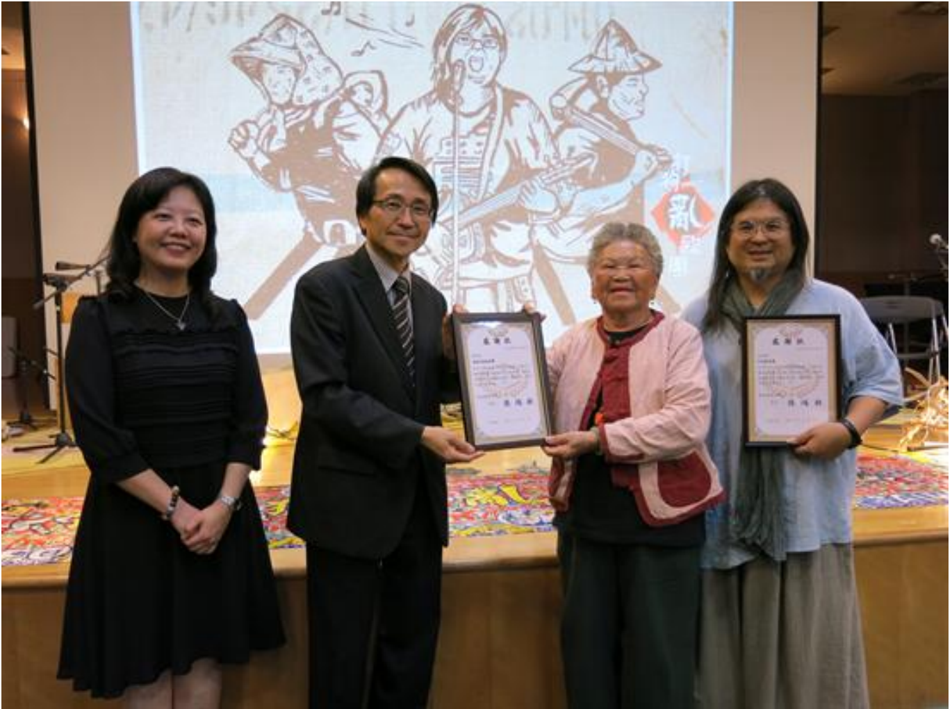
嚴詠能打狗亂歌團×恆春嬭民謠進鄉團 走唱嘉藥，撩動世代鄉土心弦

(中央社訊息服務20190522 09:21:02)南台灣暖暖的海風，迴盪著來自土地悅耳的歌聲，5月21日飄進嘉南藥理大學校園。由該校通識教育中心文化藝術館主辦的「阿嬤叫你轉來厝聽歌」，是日下午邀請金曲歌手嚴詠能率領打狗亂歌團，以及三位恆春阿嬤組成的民謠進鄉團聯袂到校開唱，以結合「說、唱、繪」形式，演繹台灣各地家鄉努力翻轉的原創音樂故事，令全場觀眾如癡如醉，讚不絕口。