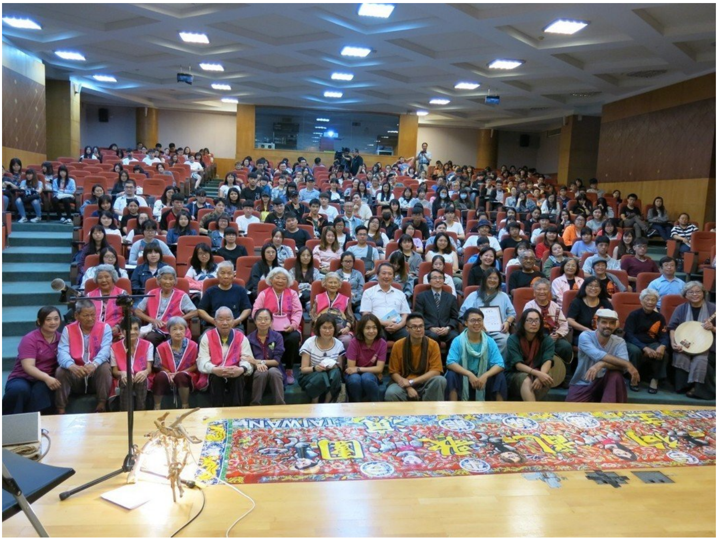
參與音樂會來賓合影。