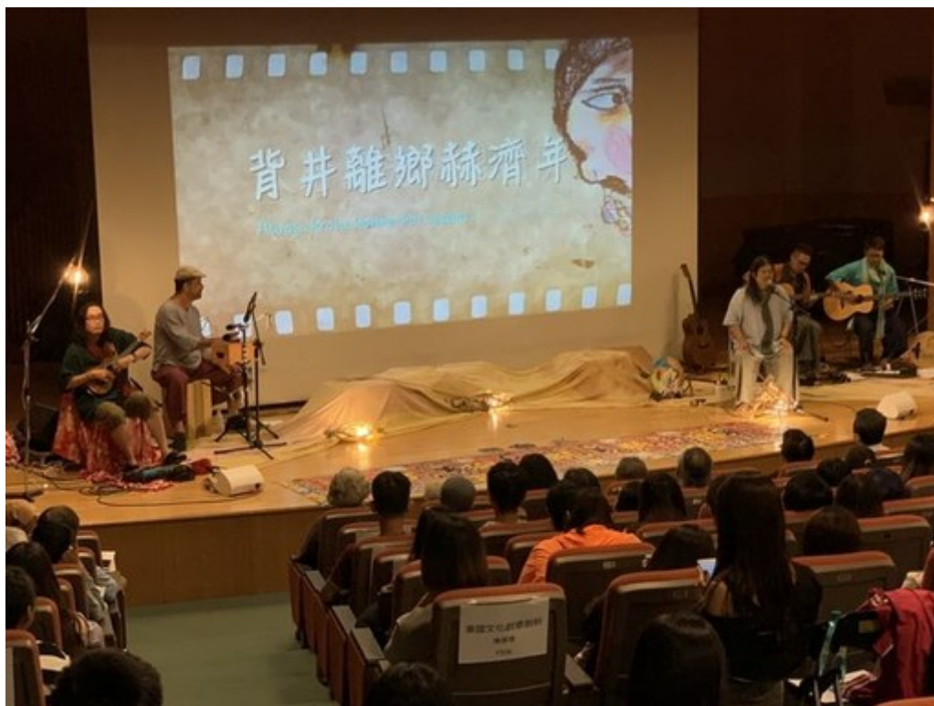
金曲歌手嚴詠能率領打狗亂歌團「走唱」嘉藥精彩演出。