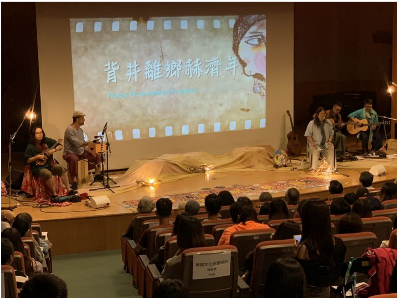
金曲歌王嚴詠能率團至嘉南藥理大學校園演唱。(記者陳懷恩攝)