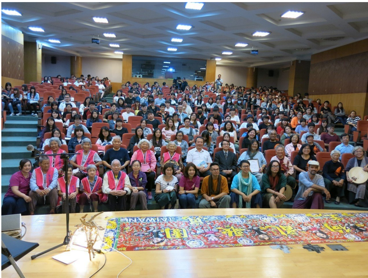
嚴詠能打狗亂歌團×恆春嬭民謠進鄉團嘉南藥大開唱。