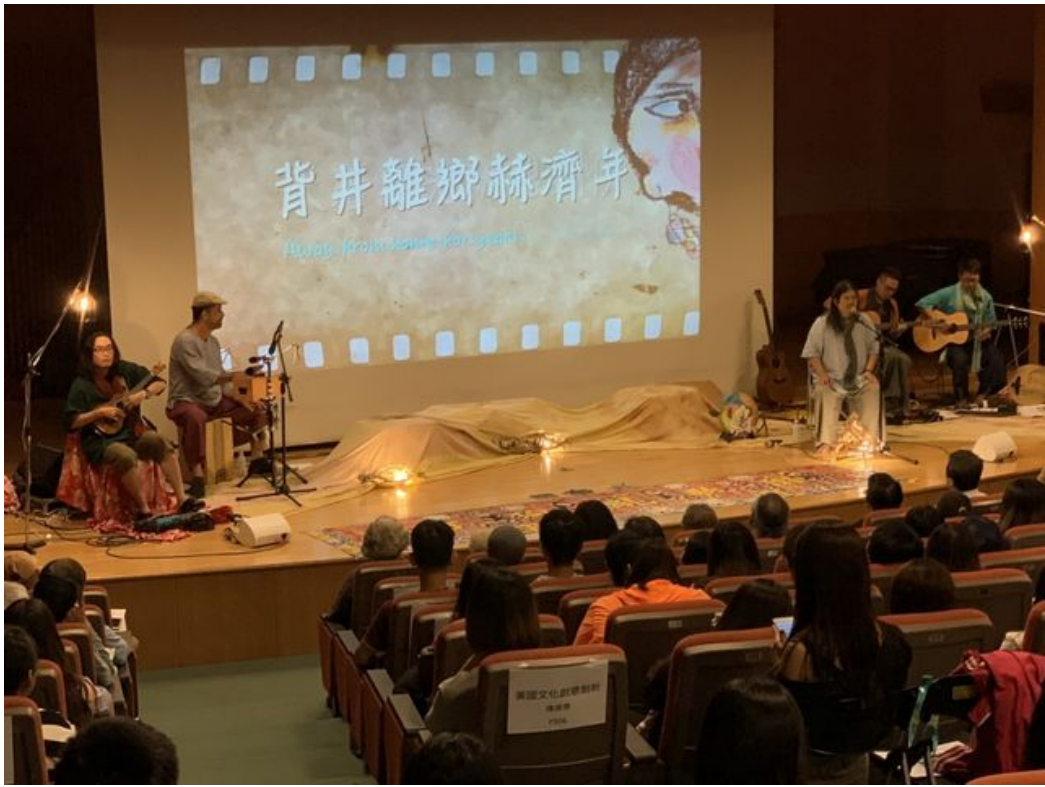
金曲歌手嚴詠能率領打狗亂歌團「走唱」嘉樂精彩演出。