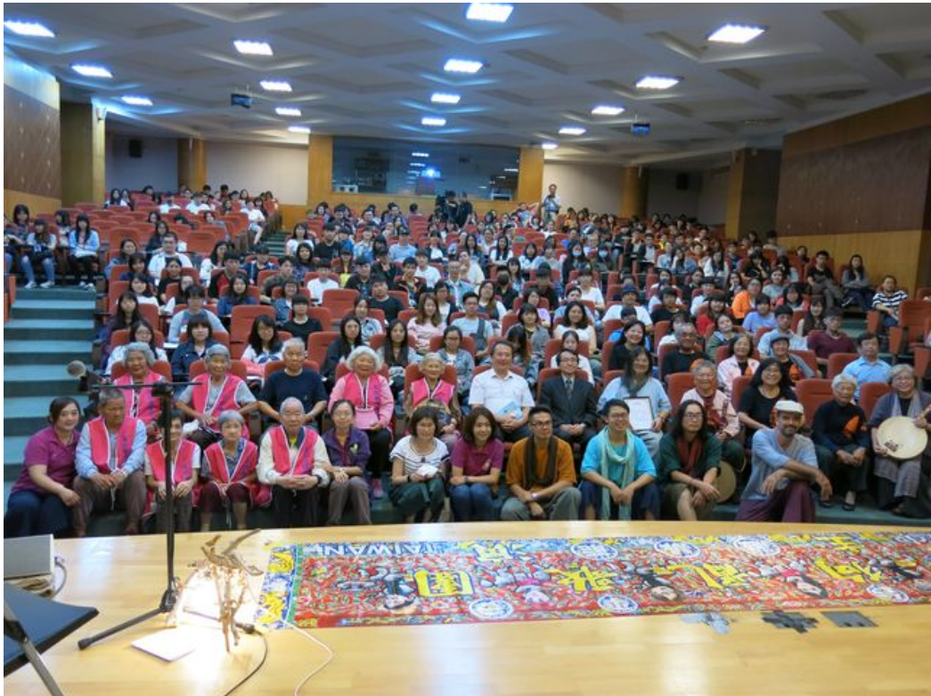
參與音樂會來賓合影。

http://www.entimes.info 2019-05-21 17:14:25