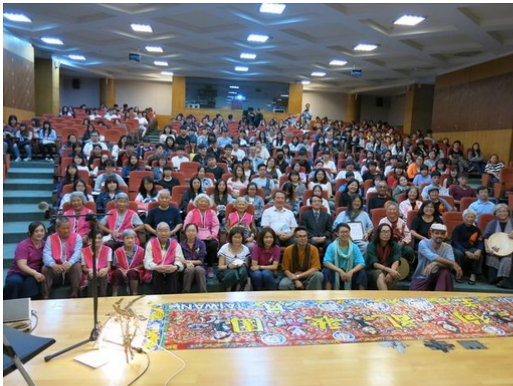
參與音樂會來賓合影。