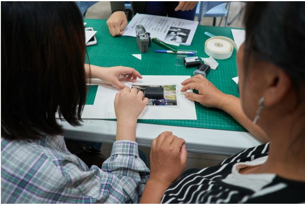
嘉藥攝影社同學現場教導鄉民如何保存製作相片。

一張張泛黃的照片，承載著許多難忘的風華歲月，也包容了無盡的生活點滴；拜現今高科技所賜，瞬間捕捉的影像將不再黯淡褪色，反而得以原味留存，永續恆久。