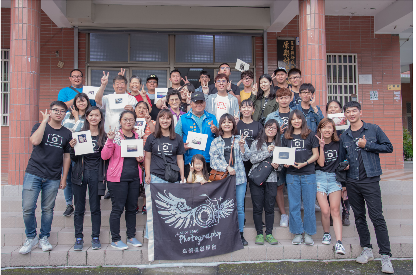
嘉藥攝影社同學與民眾手持自己完成的夾裱照片開心合影留念

一張張泛黃的照片，承載著許多難忘的風華歲月，也包容了無盡的生活點滴；拜現今高科技所賜，瞬間捕捉的影像將不再黯淡褪色，反而得以原味留存，永續恆久。