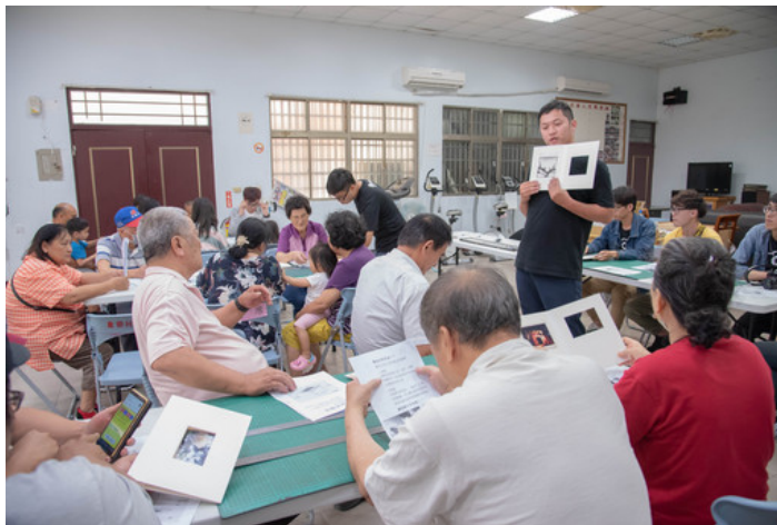
新城鄉民在攝影社同學協助下，聚精會神製作夾裱照片