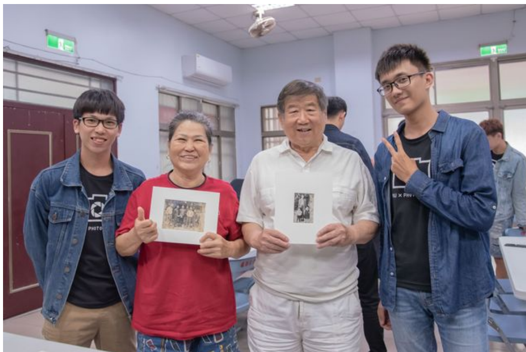
參與活動的民眾與攝影社同學分享照片中的歷史回憶。