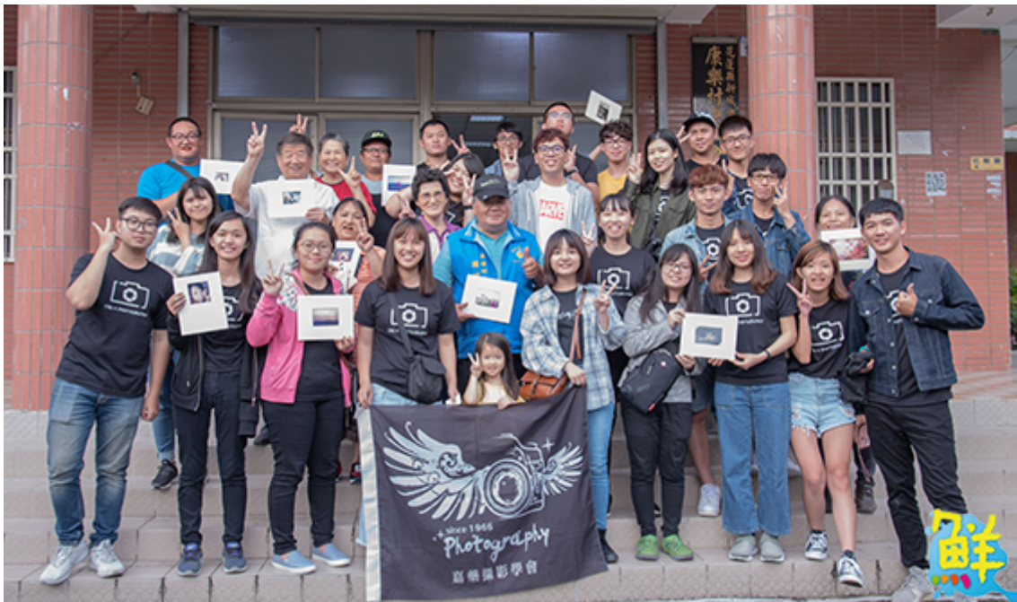
▲嘉藥攝影社同學與民眾手持自己完成的夾裱照片開心合影留念。

嘉南藥理大學攝影社，日前利用課餘遠赴花蓮進行社區服務，與新城鄉布農發展協會共同舉辦「留下珍貴回憶—老照片珍藏保存」活動，協助並教導當地居民替老照片數位化，不僅為地方保留了珍貴的歷史紀錄，也讓社團的學習活動不單只是拍照，更增添了幾分人情互動的溫暖。