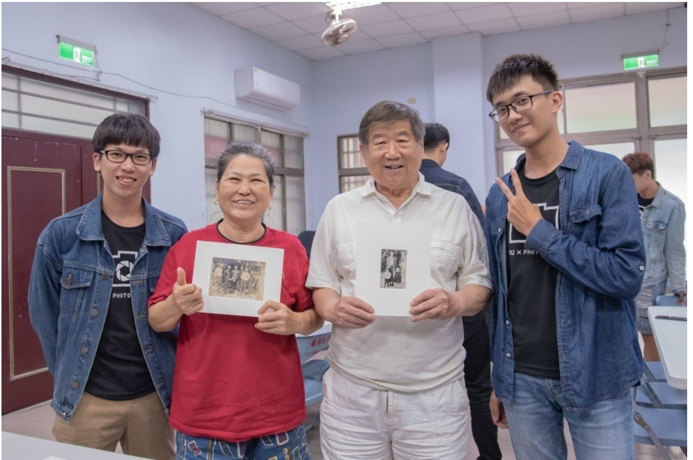
參與活動的民眾與攝影社同學分享照片中的歷史回憶。