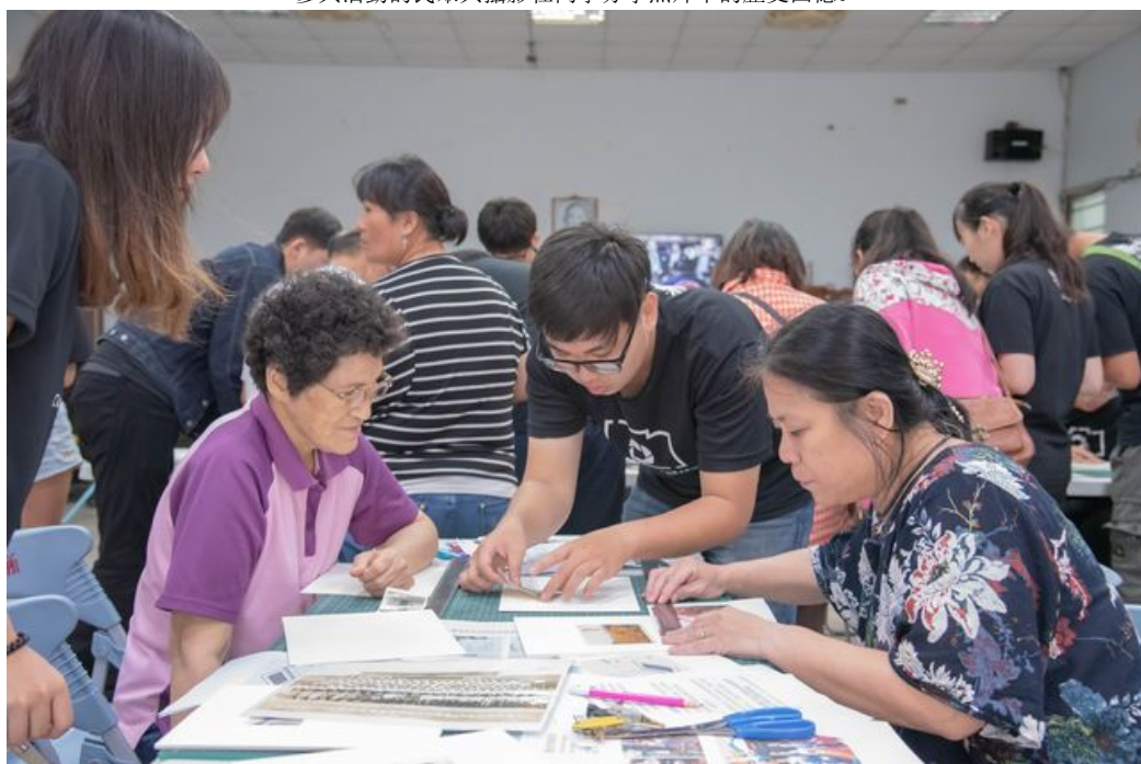
嘉藥攝影社同學向民眾宣導不再使用老舊的護背方式保存照片。