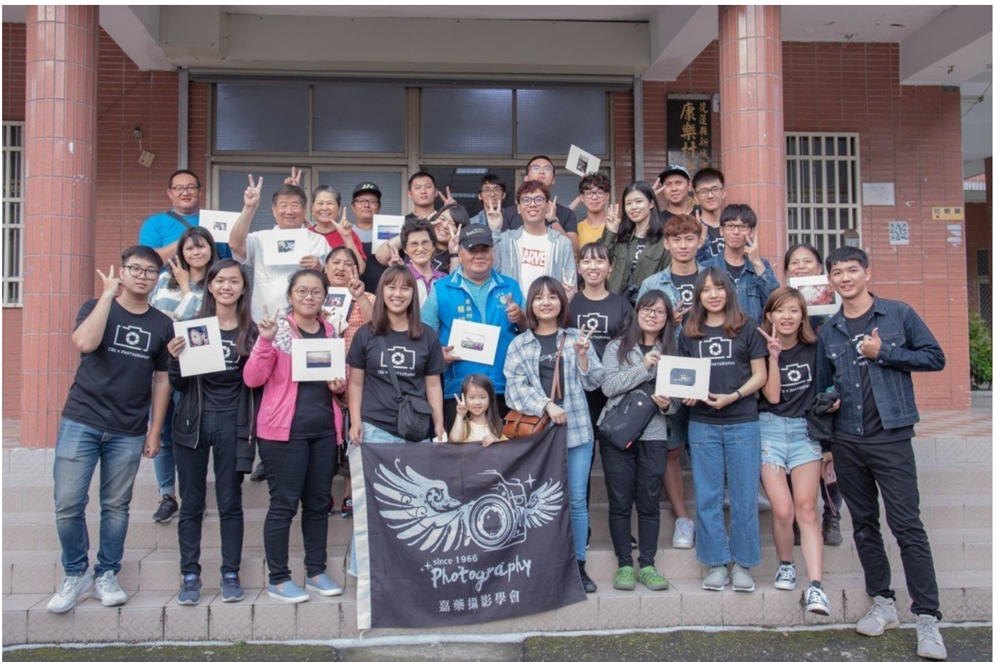
嘉藥攝影社同學與民眾手持自己完成的夾裱照片開心合影留念。