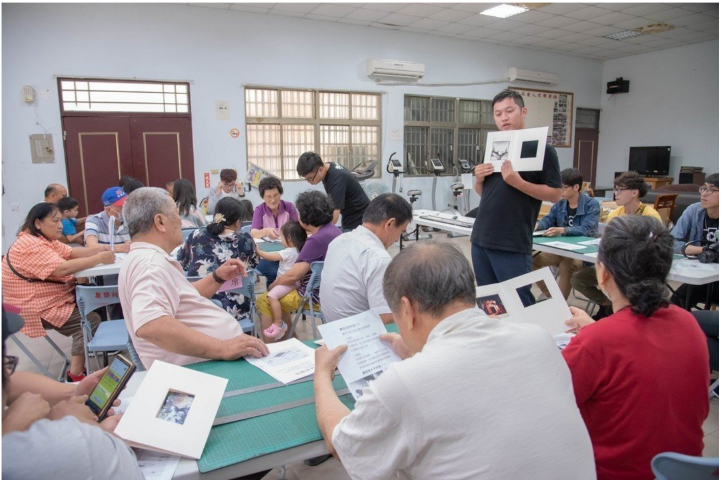
新城鄉民在攝影社同學協助下，聚精會神製作夾裱照片。