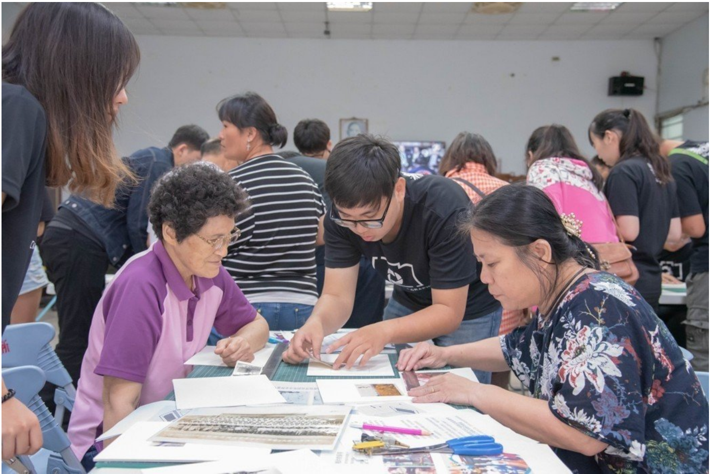
嘉藥攝影社同學向民眾宣導不再使用老舊的護貝方式保存照片。