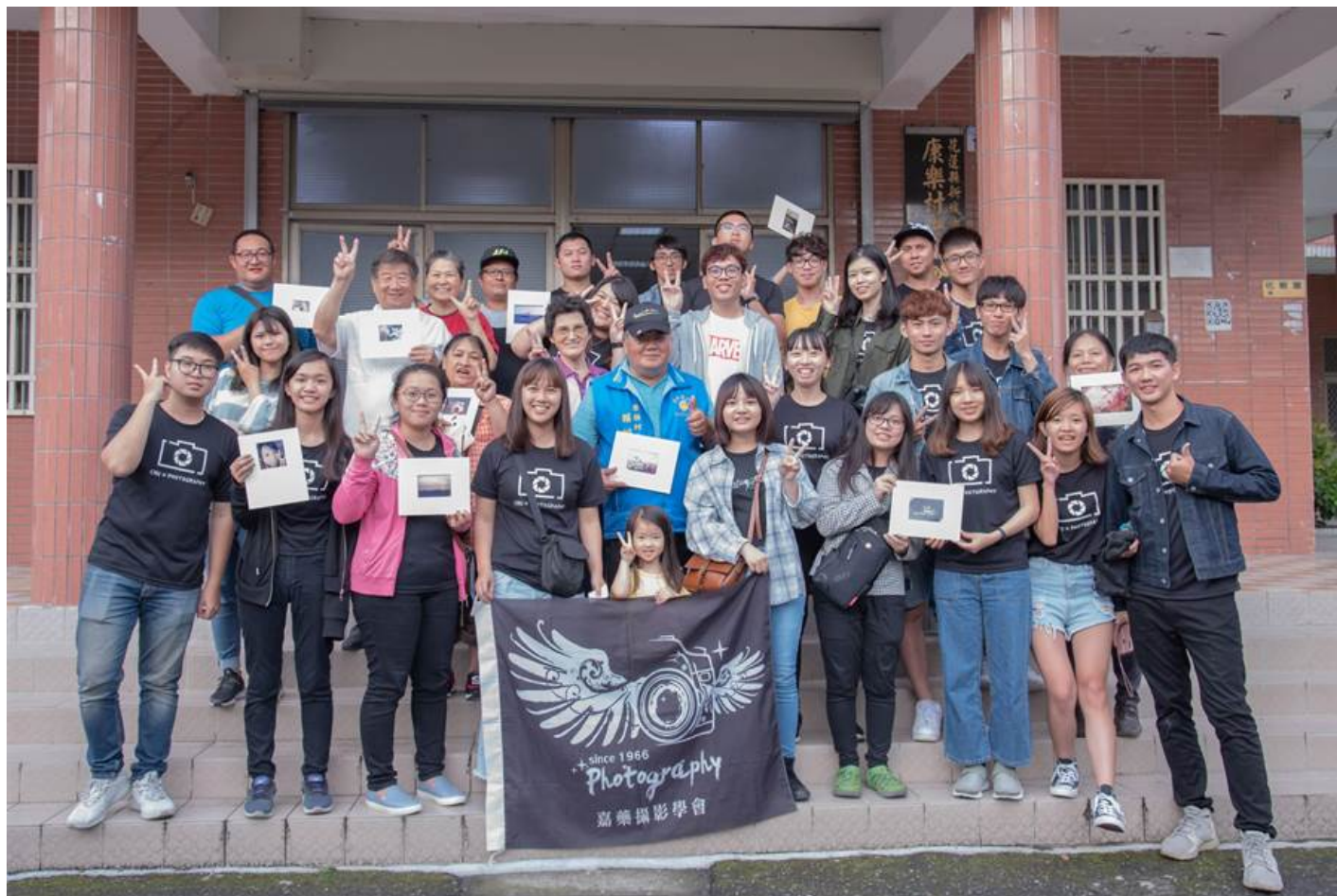
嘉南藥理大學攝影社日前利用課餘遠赴花蓮進行社區服務，與新城鄉布農發展協會共同舉辦「留下珍貴回憶 - 老照片珍藏保存」活動。