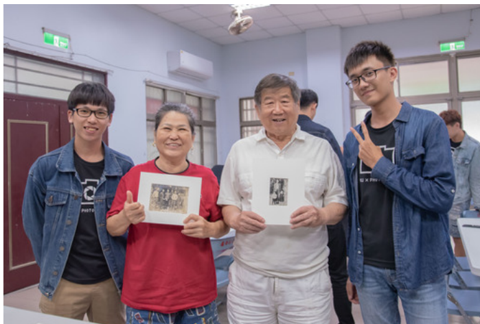
參與活動的民眾與攝影社同學分享照片中的歷史回憶