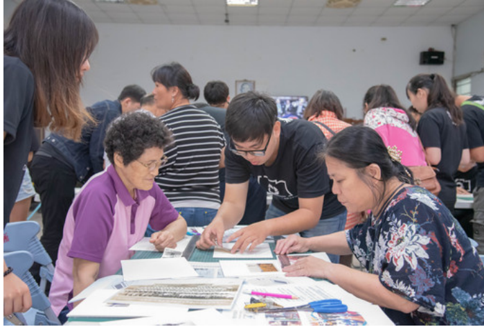
嘉藥攝影社同學向民眾宣導不再使用老舊的護背方式保存照片