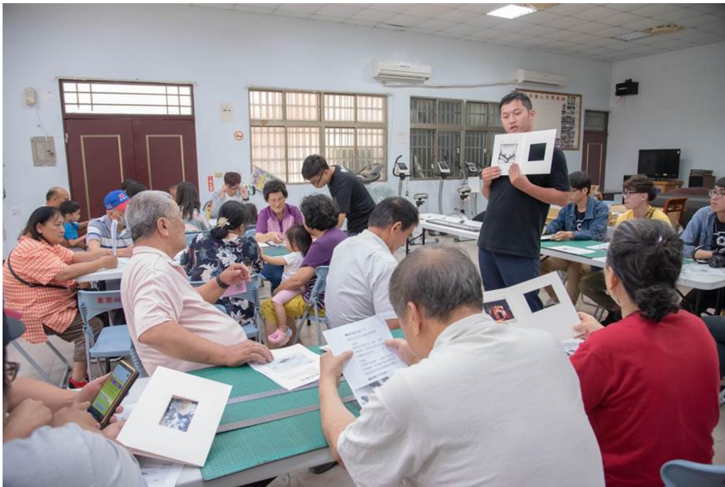
嘉南藥理大學攝影社遠赴花蓮與新城鄉布農發展協會共同舉辦「留下珍貴回憶 - 老照片珍藏保存」活動。