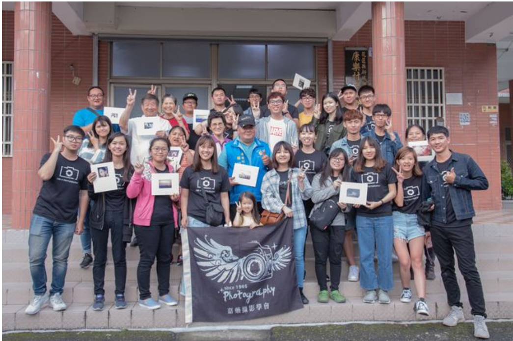
嘉藥攝影社同學與民眾手持自己完成的夾裱照片開心合影留念。

http://www.cntimes.info 2019-05-22 17:27:25