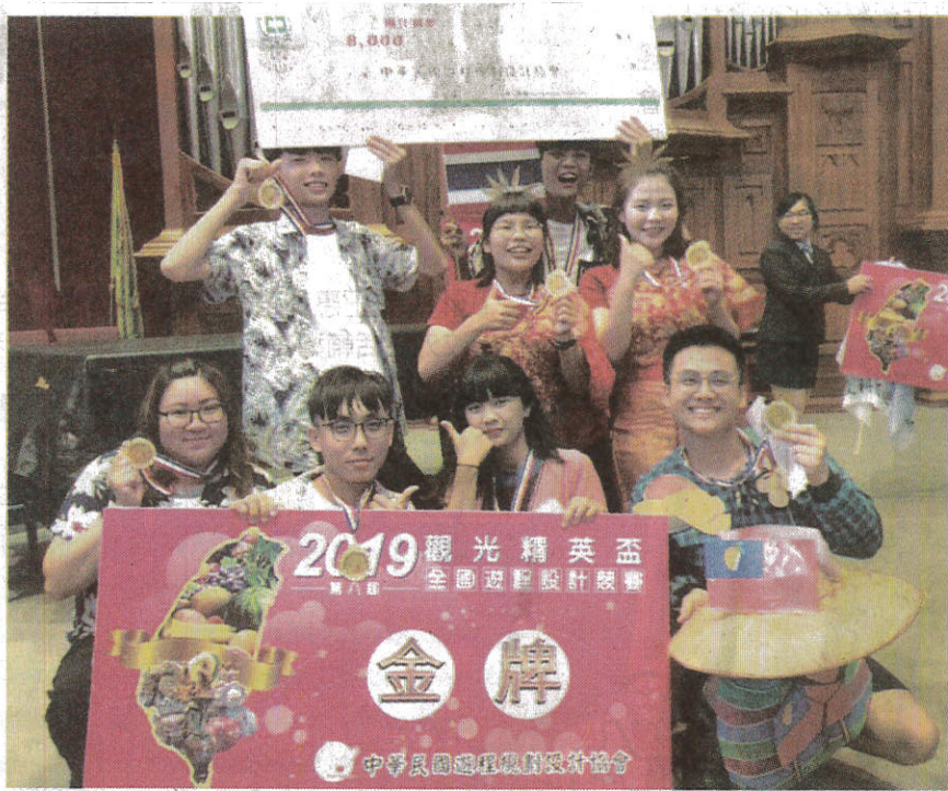
↑ 嘉南藥理大學觀光系學生團隊獲觀光精英盃遊程設計競賽雙料冠軍。