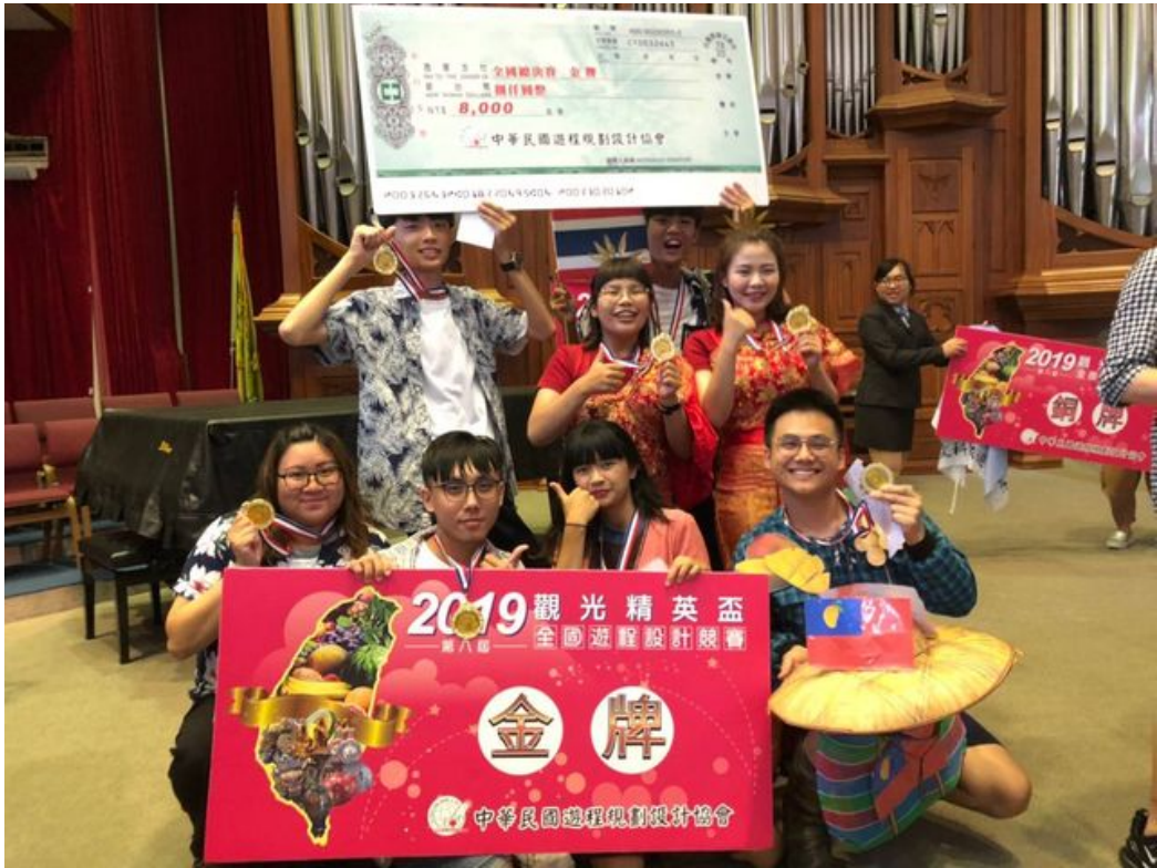
嘉藥觀光系團隊於精英盃遊程設計競賽勇奪雙金。

http://www.cntimes.info 2019-06-03 19:44:06