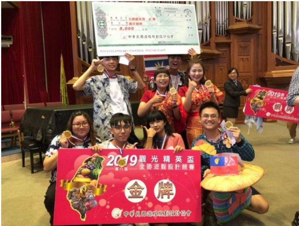
嘉藥觀光系團隊於精英盃遊程設計競賽勇奪雙金。