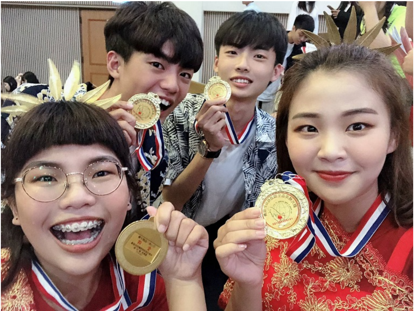
▲來台旅客組冠軍的嘉藥同學高興亮出金牌。

由中華民國旅程規劃設計協會主辦的該項競賽，今年已邁入第8屆，歷年吸引全國大專和高中職觀光相關科系學生參加，已然成為國內各校專業好手心中最具指標性的競賽。今年以台灣寶島原鄉產地水果與在地手工藝為主題，結合景點、住宿、特色餐食及人文歷史，由參賽選手設計優質且具體而經費合理的旅遊行程，每隊除上台簡報外，尚須接受評審提問，賽事過程緊湊，評比標準嚴謹，十足考驗學生實作技能與展演表達能力。