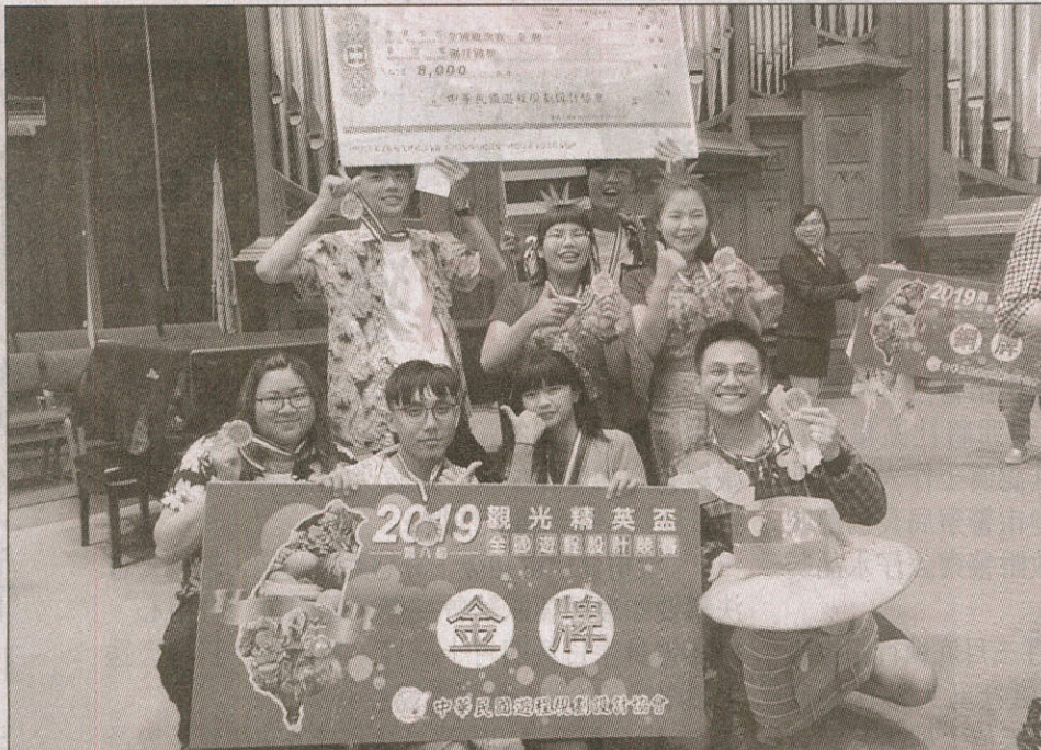
「觀光精英盃遊程設計競賽」，嘉南藥理大學觀光系團隊分別在大專國內旅遊組與來台旅客組勇奪全國雙料冠軍。

【記者陳懷恩台南報導】「觀光精英盃遊程設計競賽」今年以台灣寶島原鄉產地水果與在地手工藝為主題，已獲得南區優勝的嘉南藥理大學觀光系團隊，總決賽又分別在大專國內旅遊組與來台旅客組勇奪全國雙料冠軍。