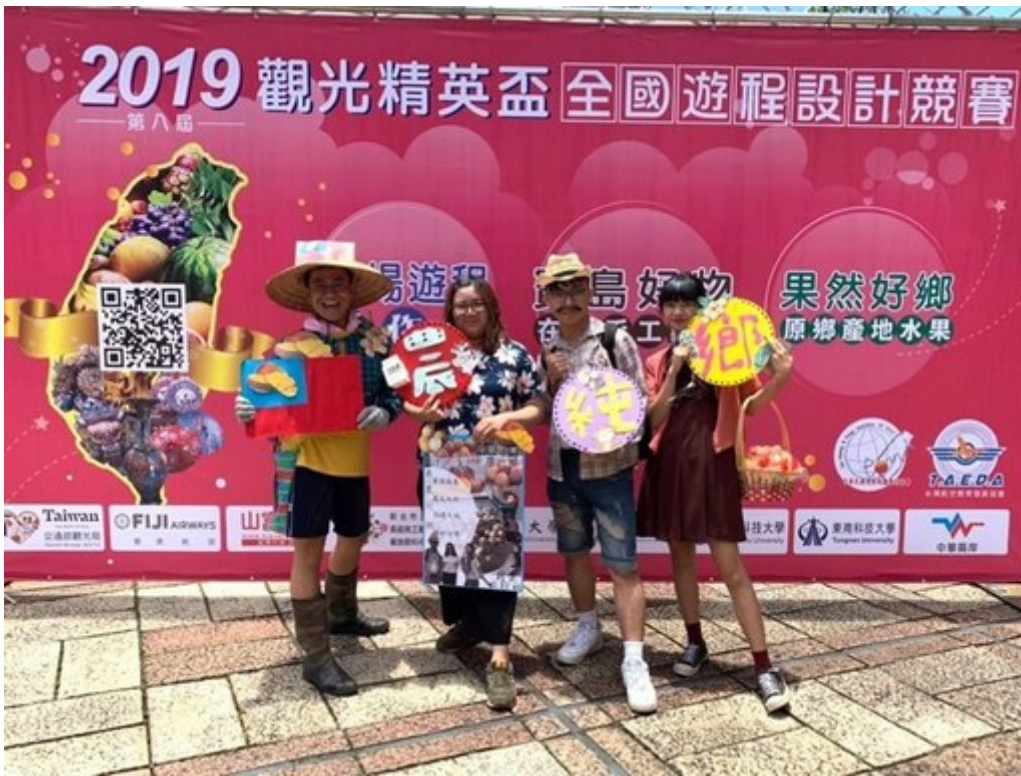
獲得國內旅遊組金牌的嘉藥觀光系同學開心合影。