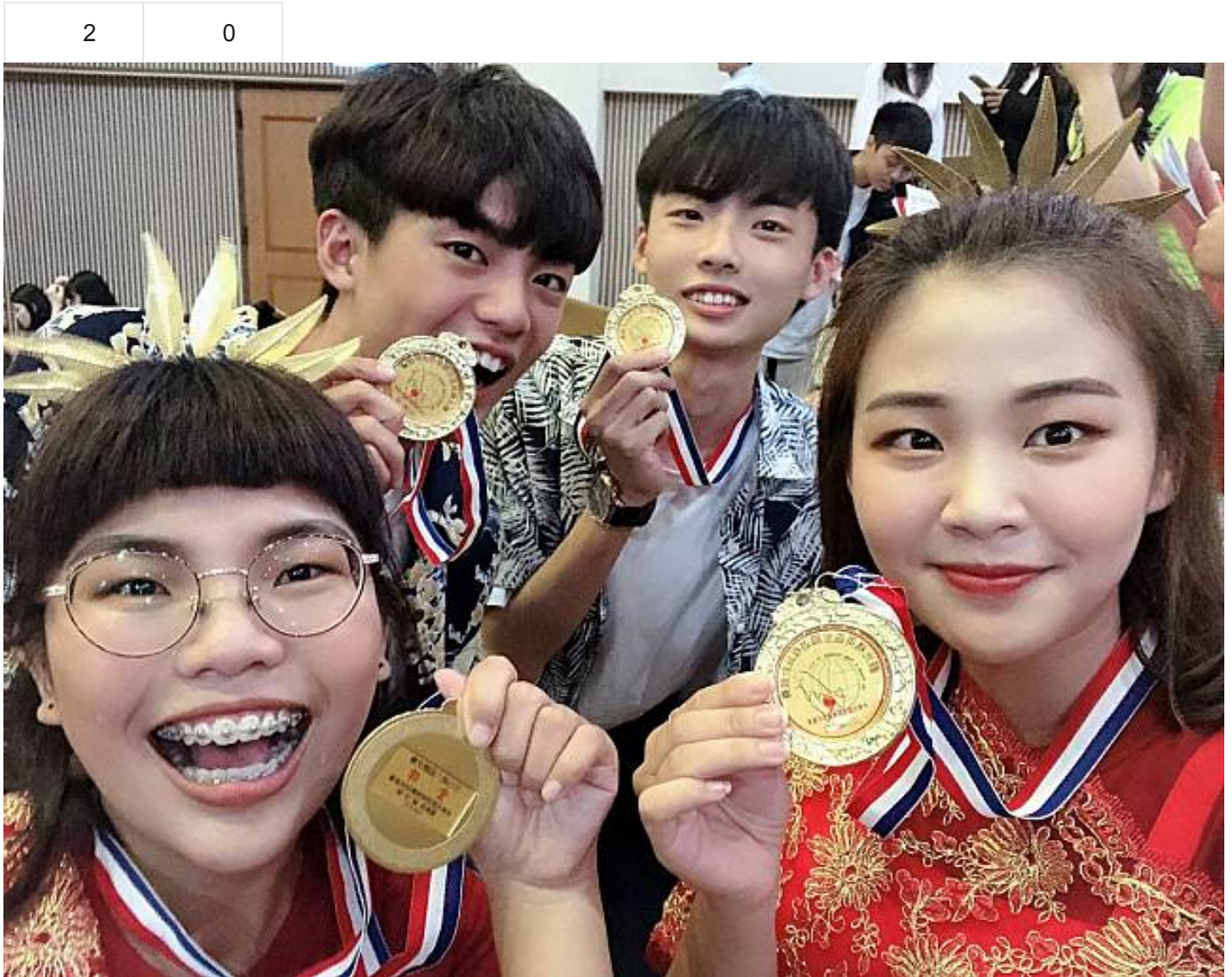
全國精英盃遊程設計競賽 嘉藥摘雙金

國人旅遊風氣興盛，但要如何安排既便宜又好玩的旅遊行程，常叫人傷透腦筋。嘉南藥理大學觀光事業管理系學生準是這方面的達人。一年一度「觀光精英盃遊程設計競賽」成績揭曉，嘉藥學生分別在「大專國內旅遊組」與來「」台旅客組」拿下雙料冠軍，展現優異遊程規劃的實作能力。