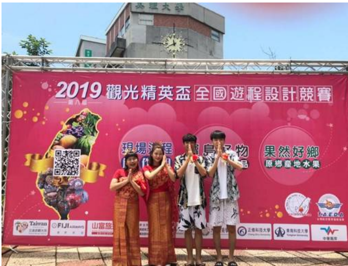
贏得來台旅客組冠軍的嘉藥觀光系團員合影留念