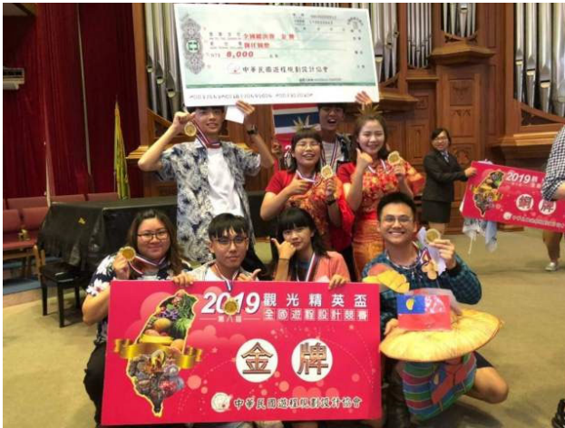
（圖說）嘉藥觀光系團隊於精英盃遊程設計競賽勇奪雙金。

由中華民國旅程規劃設計協會主辦的該項競賽，今年已邁入第8屆，歷年吸引全國大專和高中職觀光相關科系學生參加，已然成為國內各校專業好手心中最具指標性的競賽。今年以台灣寶島原鄉產地水果與在地手工藝為主題，結合景點、住宿、特色餐食及人文歷史，由參賽選手設計優質且具體而經費合理的旅遊行程，每隊除上台簡報外，尚須接受評審提問，賽事過程緊湊，評比標準嚴謹，十足考驗學生實作技能與展演表達能力。