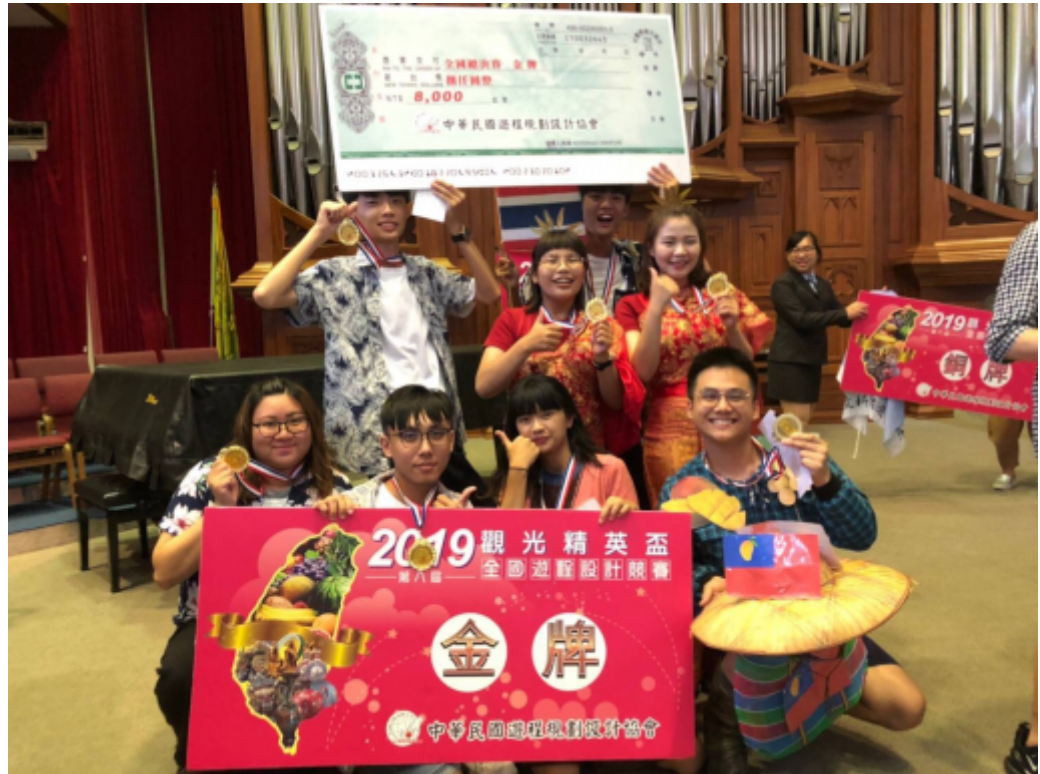
嘉藥觀光系團隊於菁英盃遊程設計競賽勇奪雙金。

嘉南藥理大學觀光事業管理系八名學生，參加全國「觀光菁英盃遊程設計競賽」，以專業和創意安排既便宜又好玩的旅遊行程，在高手雲集下脫穎而出，在大專國內旅遊組、來台旅客組勇奪雙料冠軍。