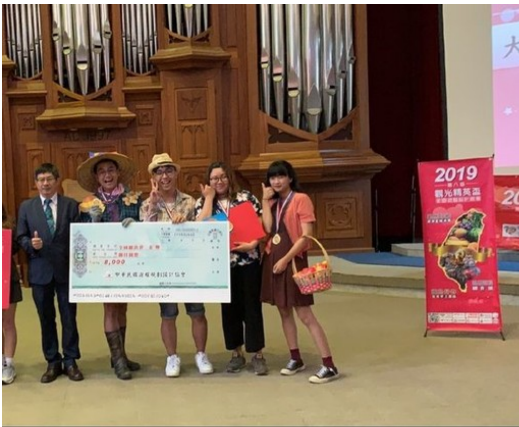
國內旅遊組冠軍的嘉藥團隊上台受獎。