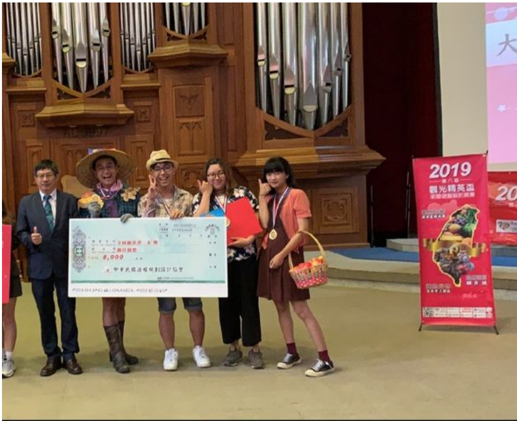
國內旅遊組冠軍的嘉藥團隊上台受獎。