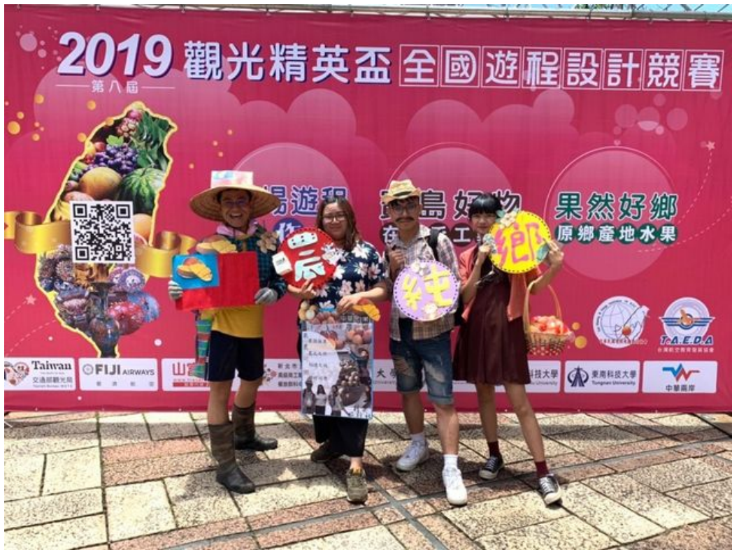
獲得國內旅遊組金牌的嘉藥觀光系同學開心合影。