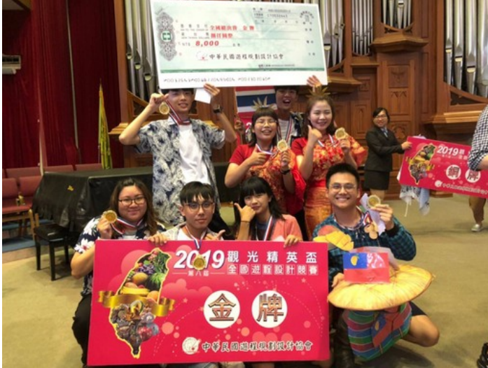
嘉藥觀光系團隊於精英盃遊程設計競賽勇奪雙金