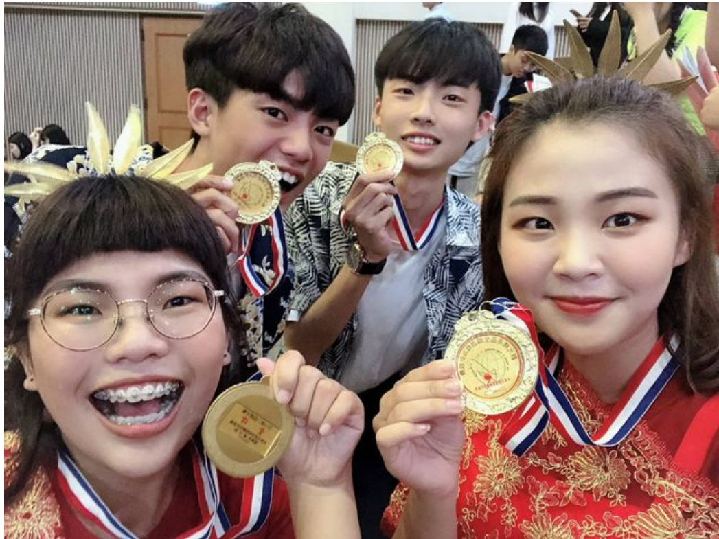
贏得來台旅客組冠軍的嘉藥觀光系團員合影留念。