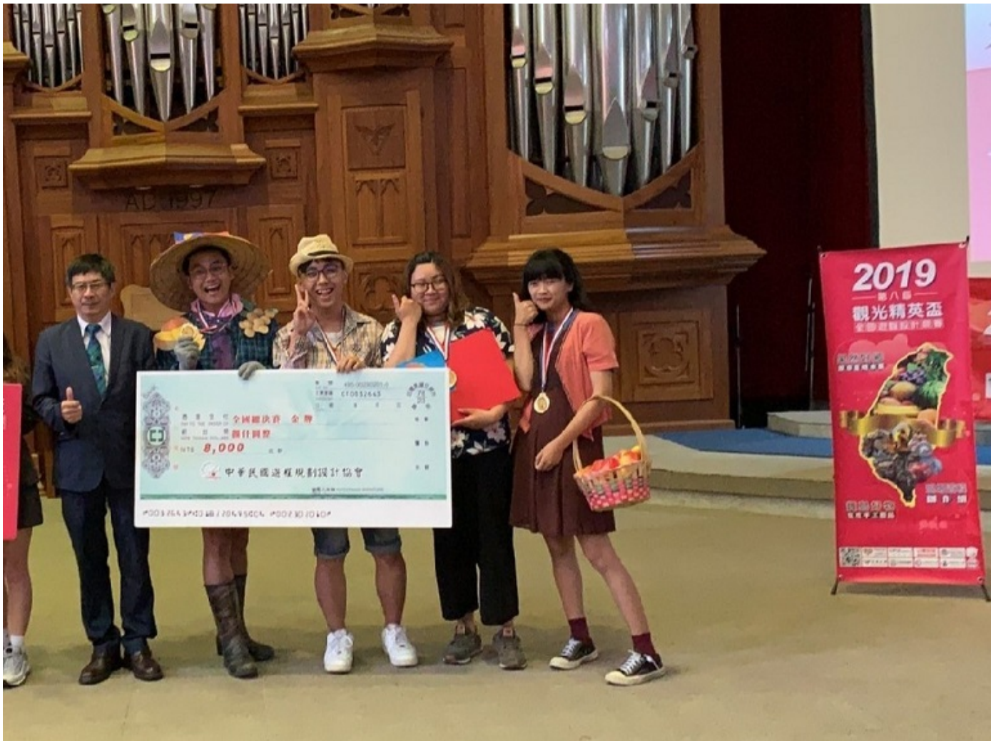
▲國內旅遊組冠軍的嘉藥團隊上台受獎。