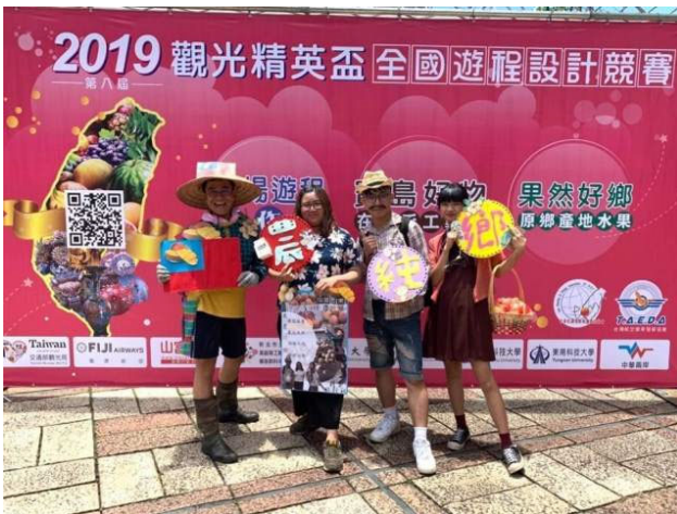
（圖說）獲得國內旅遊組金牌的嘉藥觀光系同學開心合影。

由中華民國旅程規劃設計協會主辦的該項競賽，今年已邁入第8屆，歷年吸引全國大專和高中職觀光相關科系學生參加，已然成為國內各校專業好手心中最具指標性的競賽。今年以台灣寶島原鄉產地水果與在地手工藝為主題，結合景點、住宿、特色餐食及人文歷史，由參賽選手設計優質且具體而經費合理的旅遊行程，每隊除上台簡報外，尚須接受評審提問，賽事過程緊湊，評比標準嚴謹，十足考驗學生實作技能與展演表達能力。