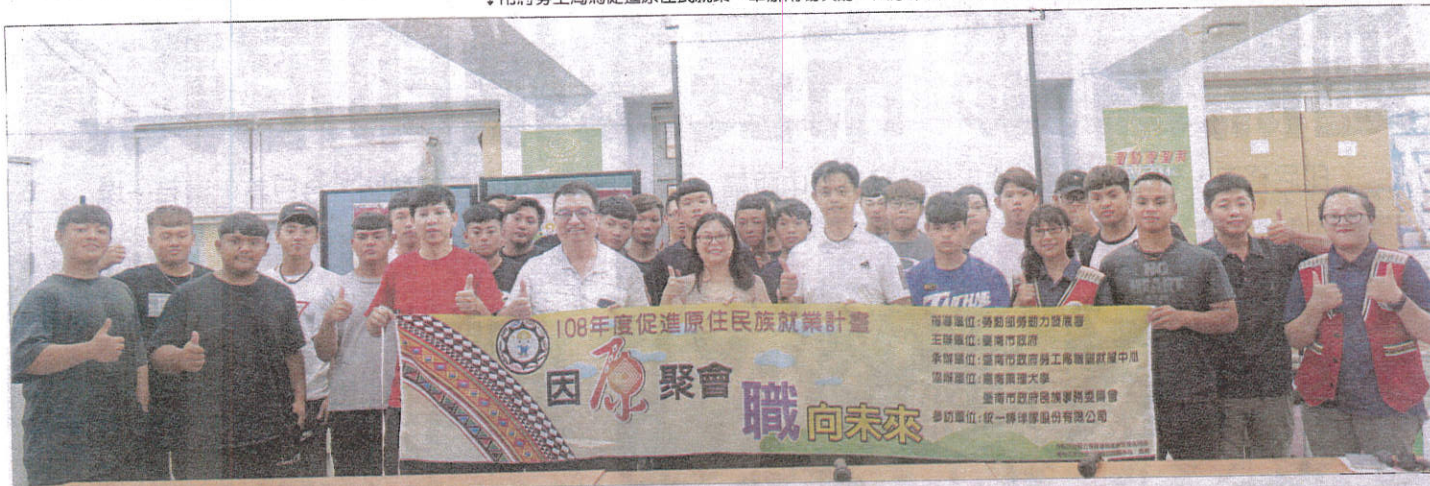
↓市府勞工局為促進原住民族就業，舉辦兩場次的「因原聚會、職向未來」就業促進講座。