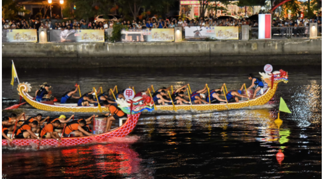
台南海事在大型龍舟公開男子組奪冠，喬美餐廳亞軍。

二〇一九年台南市國際龍舟錦標賽七日決賽，台南海事在大型龍舟公開男子組掄元，贏得三十萬元獎金；小型龍舟公開男子組由比奕有限公司奪標獲勝，以二點二三秒差距擊敗南工 S 隊，另，金城國中在大型龍舟國女組拿下六連勝、教師組五連霸，表現搶眼。