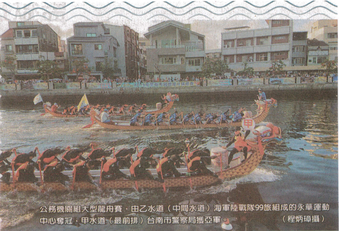
公務機關組大型龍舟賽，由乙水道（中間水道）海軍陸戰隊99旅組成的永華運動中心奪冠，甲水道（最前排）台南市警察局獲亞軍。（程炳璋攝）