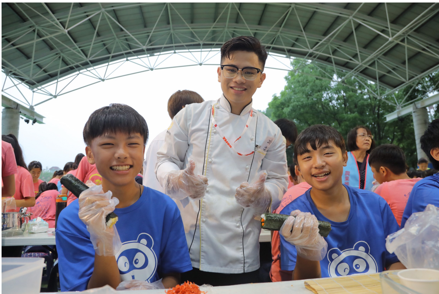
嘉藥餐旅系學生與紅瓦厝國小學童一同開心做料理