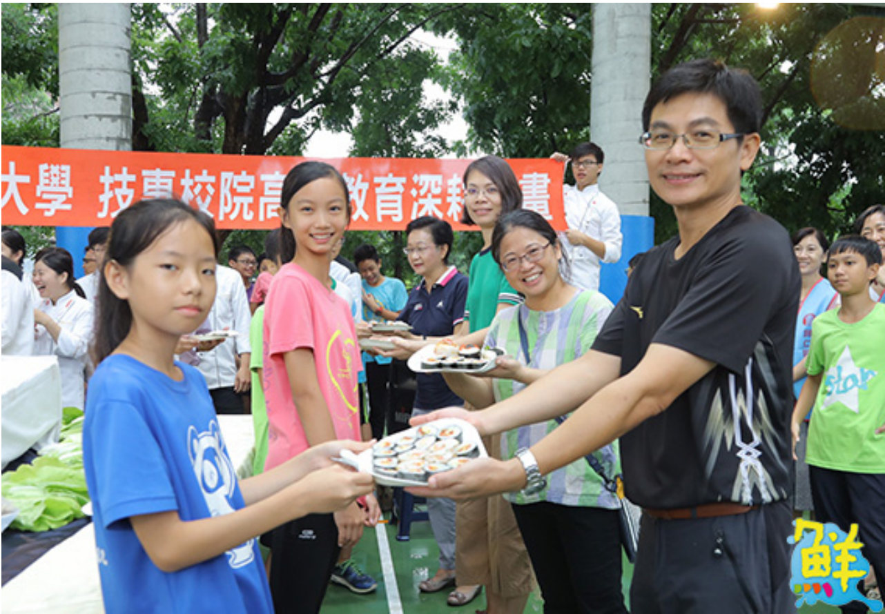
▲嘉南藥理大學餐旅管理系師生，與歸仁區農會家政班成員及當地農業志工合作，6/11(二)於紅瓦厝國小，舉辦「米食創意饗宴-米樂飯糰DIY」自主共廚料理活動。

這項米樂飯糰謝師活動，由歸仁農會家政班員運用當地剛收成的秈稻，烹煮出香噴Q甜的米飯，再透過嘉藥餐旅系師生現場調配米醋，並搭配歸仁在地青農提供的新鮮蔬果，帶領150位紅瓦厝小學應屆畢業學童，捏製創意秈米飯糰，最後將捏製完成的飯糰，以象徵擁有豐富好食材的寶島意象，拼圖擺設成台灣形狀，邀請紅瓦厝國小教師一同享用謝師宴，濃密的師生情誼表露無遺。