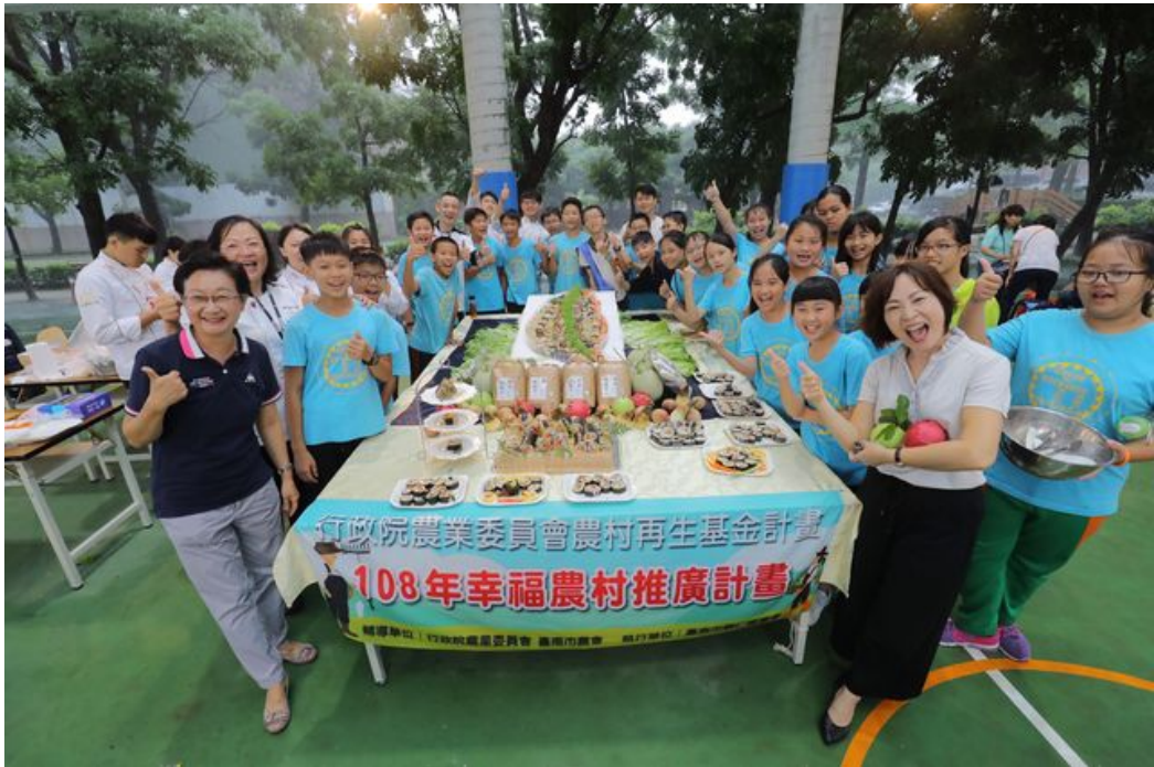
嘉藥餐旅系結合歸仁農會與紅瓦厝國小舉辦「米食創意饗宴」。

http://www.cntimes.info 2019-06-11 16:30:50