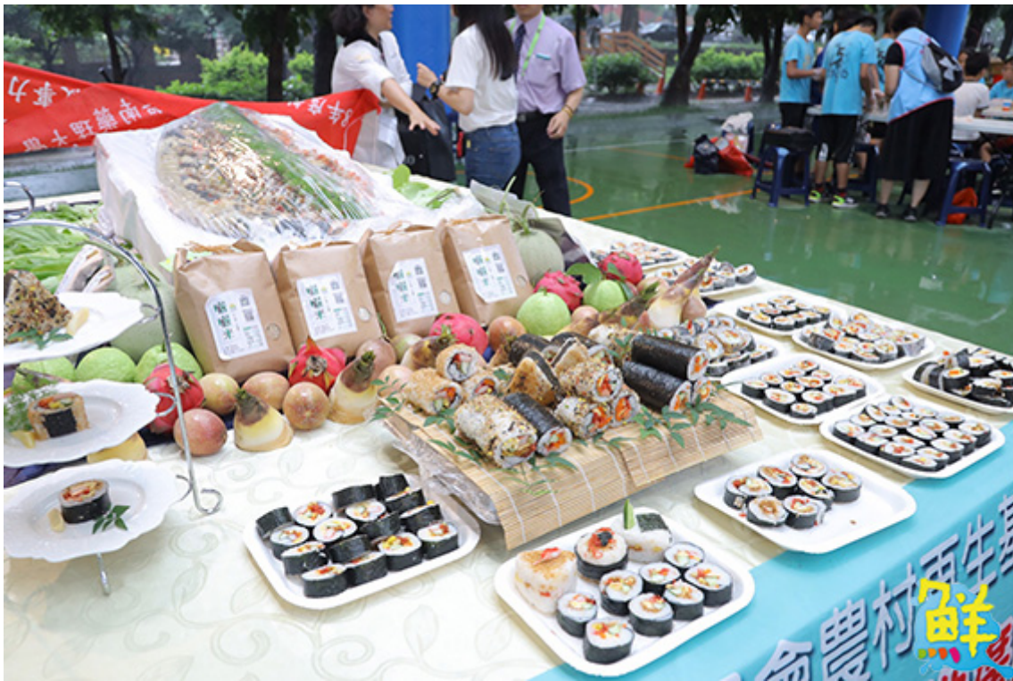
▲嘉藥餐旅系師生運用剛採收的秈米做成色香味俱全的飯糰佳餚。

種米飯的滋味，具體感念農夫精神，珍惜大地賜予的恩澤，從「食」中瞭解「農」的珍貴，並從「農」中建立正確的飲食知識。