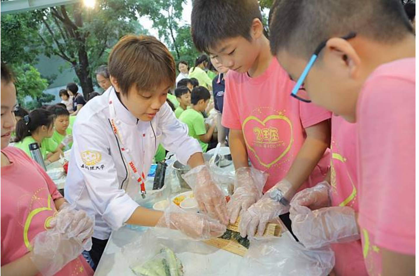
嘉藥辦「米食創意饗宴」大手牽小手共廚謝師恩

嘉南藥理大學餐旅系師生帶領150位紅瓦厝小學應屆畢業生，舉辦「米食創意饗宴-米樂飯糰DIY」自主共廚料理活動，教導學生捏製飯糰犒賞老師，一圓答謝師恩夢想。