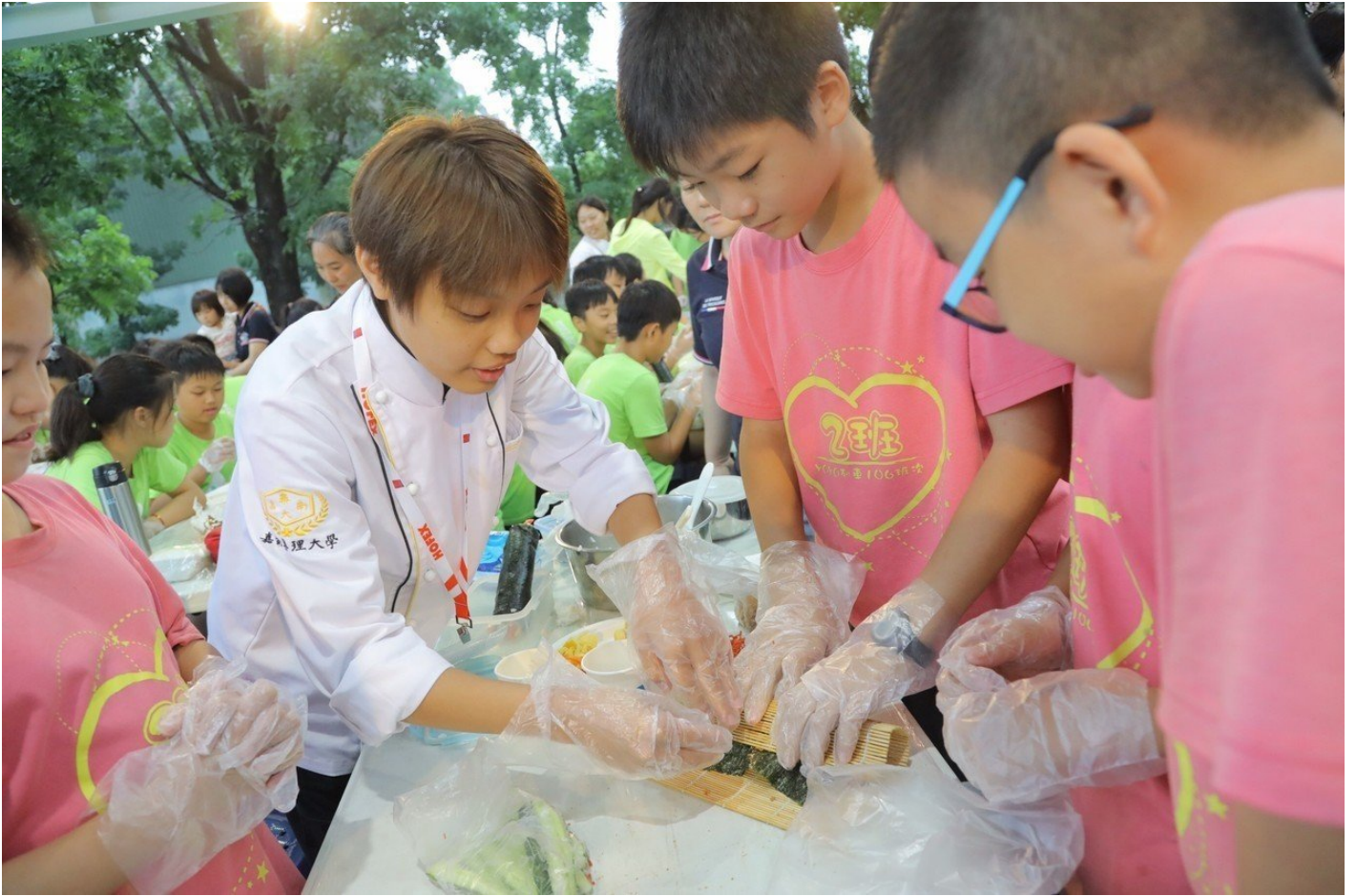
嘉藥餐旅系學生教導紅瓦厝國小學童包壽司技巧。