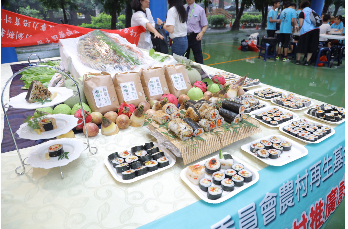
嘉藥餐旅系師生運用剛採收的秈米做成色香味俱全的飯糰佳餚