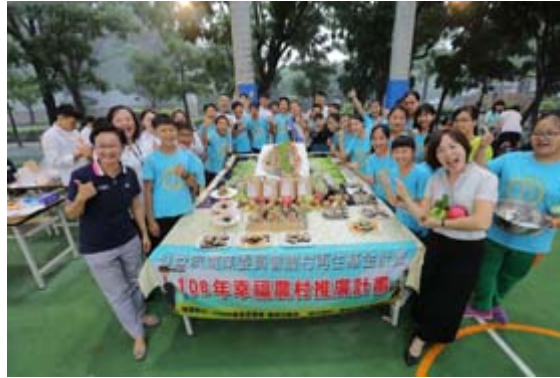
嘉藥餐旅系結合歸仁農會與紅瓦厝國小舉辦「米食創意饗宴」。

【記者孫宜秋／南市報導】嘉南藥理大學餐旅管理系師生，與歸仁區農會家政班成員及當地農業志工合作，6月11日於紅瓦厝國小，舉辦「米食創意饗宴-米樂飯糰DIY」自主共廚料理活動。嘉藥大學生發揮專長和服務精神，協助並教導該國小畢業班學童使用在地食材，親手捏製飯糰犒賞老師