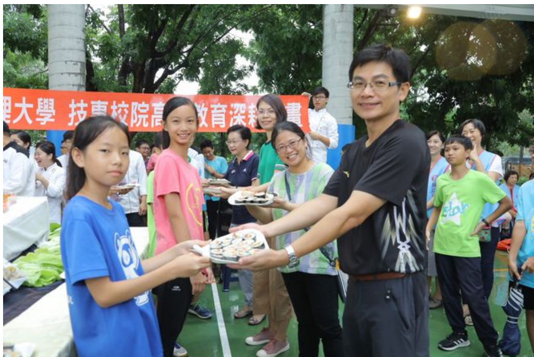
紅瓦厝國小學童親手捏製創意飯糰謝師恩。