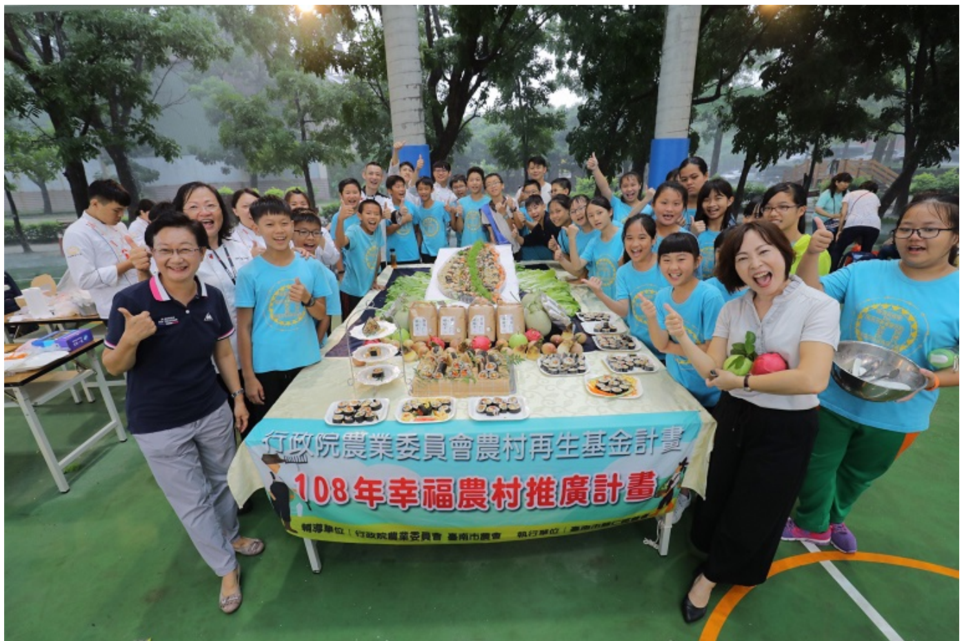
▲嘉藥餐旅系結合歸仁農會與紅瓦厝國小舉辦「米食創意饗宴」。