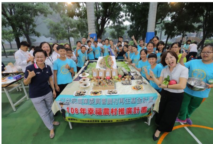
嘉藥餐旅系結合歸仁農會與紅瓦厝國小舉辦「米食創意饗宴」