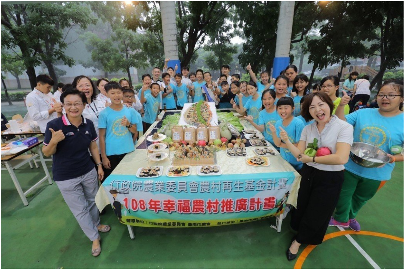
嘉藥餐旅系結合歸仁農會與紅瓦厝國小舉辦「米食創意饗宴」。嘉藥 / 提供