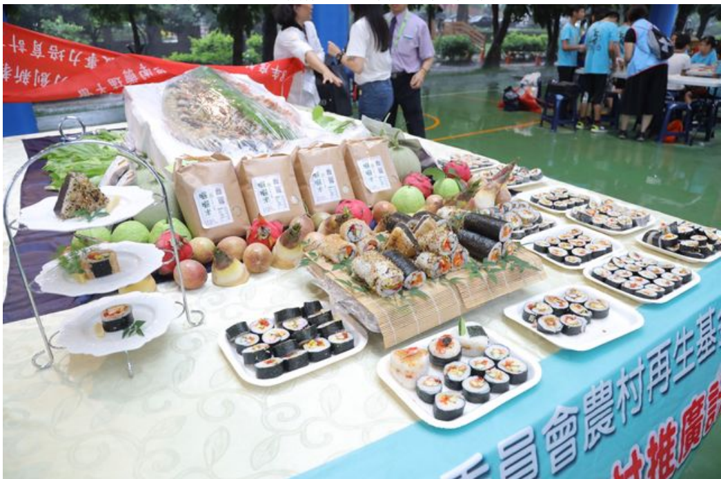
嘉藥餐旅系師生運用剛採收的秈米做成色香味俱全的飯糰佳餚。