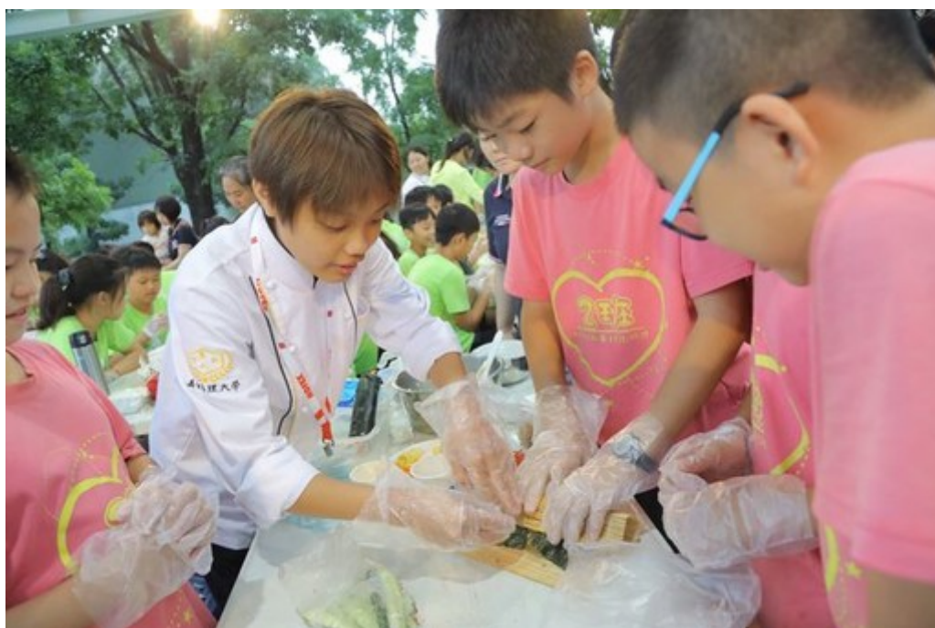
嘉藥餐旅系學生教導紅瓦厝國小學童包壽司技巧。