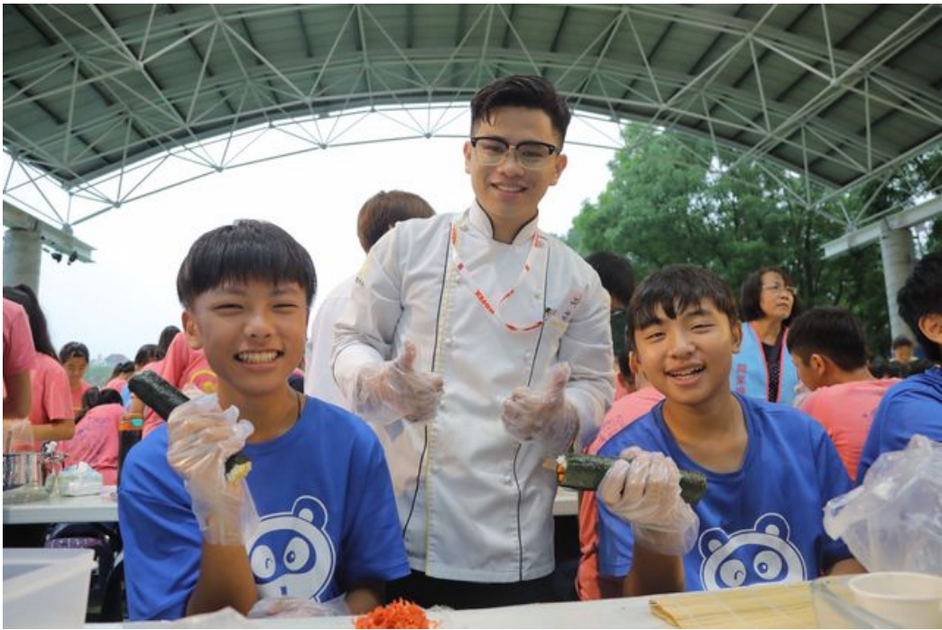
嘉藥餐旅系學生與紅瓦厝國小學童一同開心做料理。

嘉南藥理大學餐旅管理系師生，與歸仁區農會家政班成員及當地農業志工合作，6月11日於紅瓦厝國小，舉辦「米食創意饗宴-米樂飯糰DIY」自主共廚料理活動。嘉藥大學生發揮專長和服務精神，協助並教導該國小畢業班學童使用在地食材，親手捏製飯糰犒賞老師辛勞，讓小朋友在畢業前夕，一圓答謝師恩的夢想。