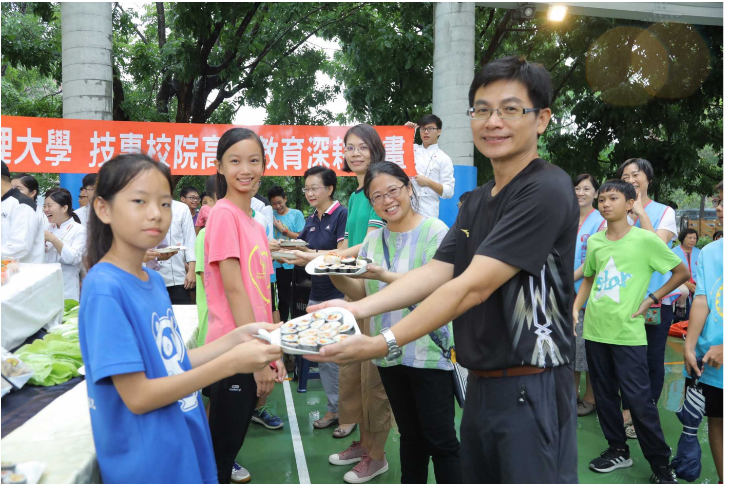
圖說：紅瓦厝國小學童親手捏製創意飯糰謝師恩。

這場米樂飯糰謝師活動，由歸仁農會家政班員運用當地剛收成的秈稻，烹煮出香噴Q甜的米飯，再透過嘉藥餐旅系師生現場調配米醋，並搭配歸仁在地青農提供的新鮮蔬果，帶領一五〇位紅瓦厝小學應屆畢業學童，捏製創意秈米飯糰，最後將捏製完成的飯糰，以象徵擁有豐富好食材的寶島意象，拼圖擺設成台灣形狀，邀請紅瓦厝國小教師一同享用謝師宴，濃密的師生情誼表露無遺。