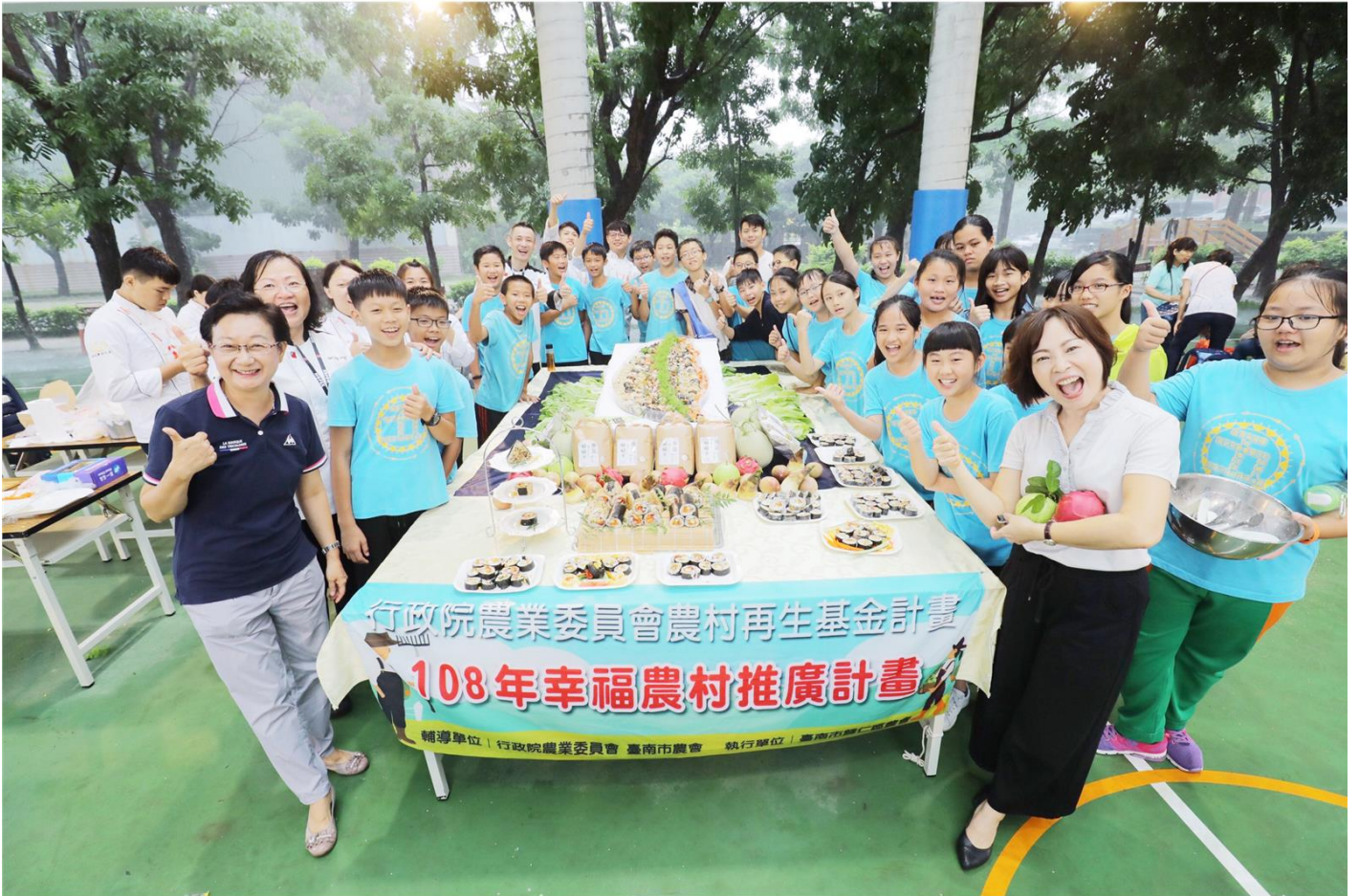
嘉藥結合臺南歸仁農會與紅瓦厝國小舉辦「米食創意饗宴」。