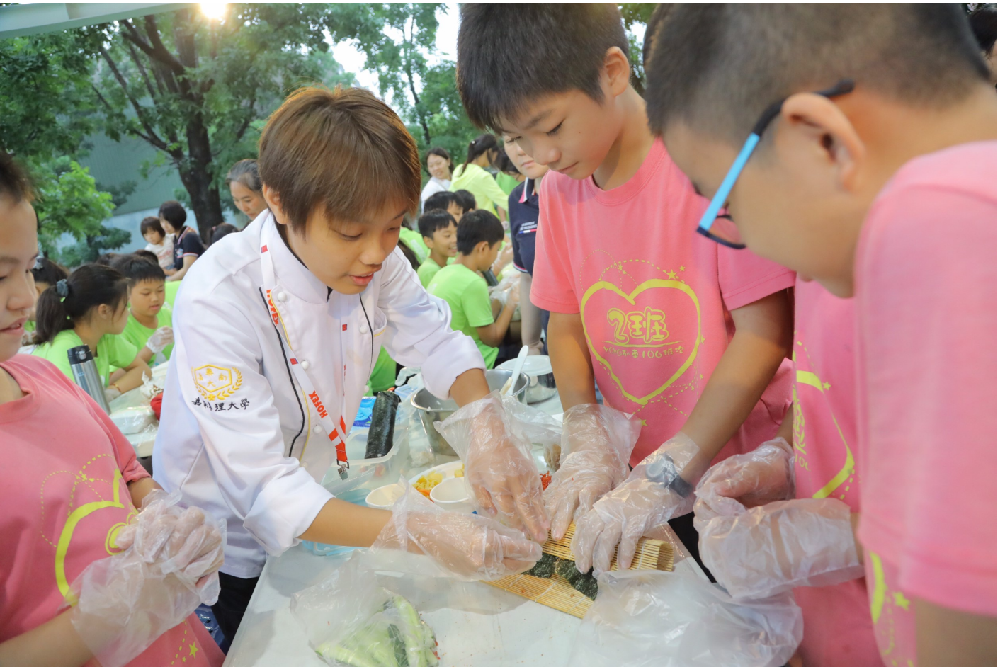
嘉藥餐旅系學生教導紅瓦厝國小學童包壽司技巧