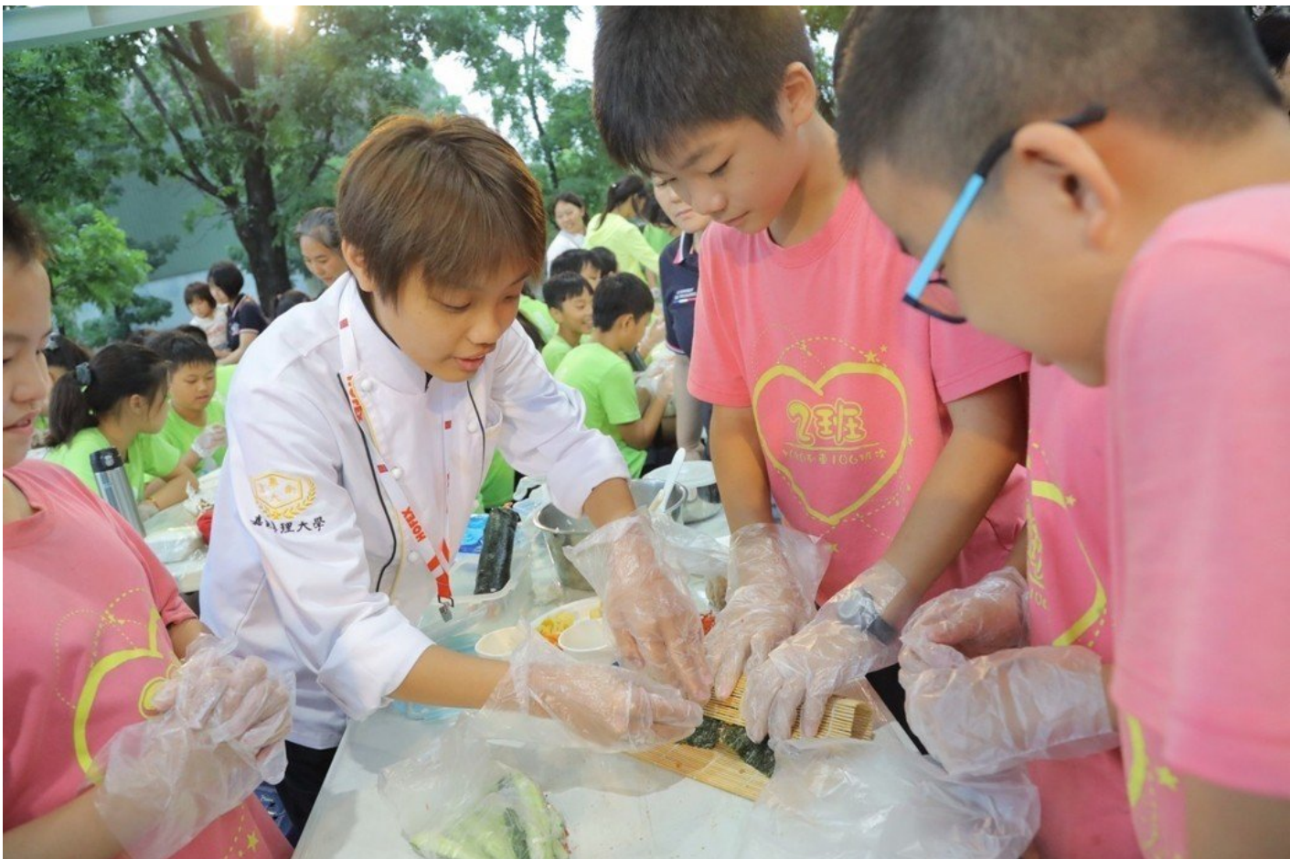
嘉藥餐旅系學生教導紅瓦厝國小學童包壽司技巧。