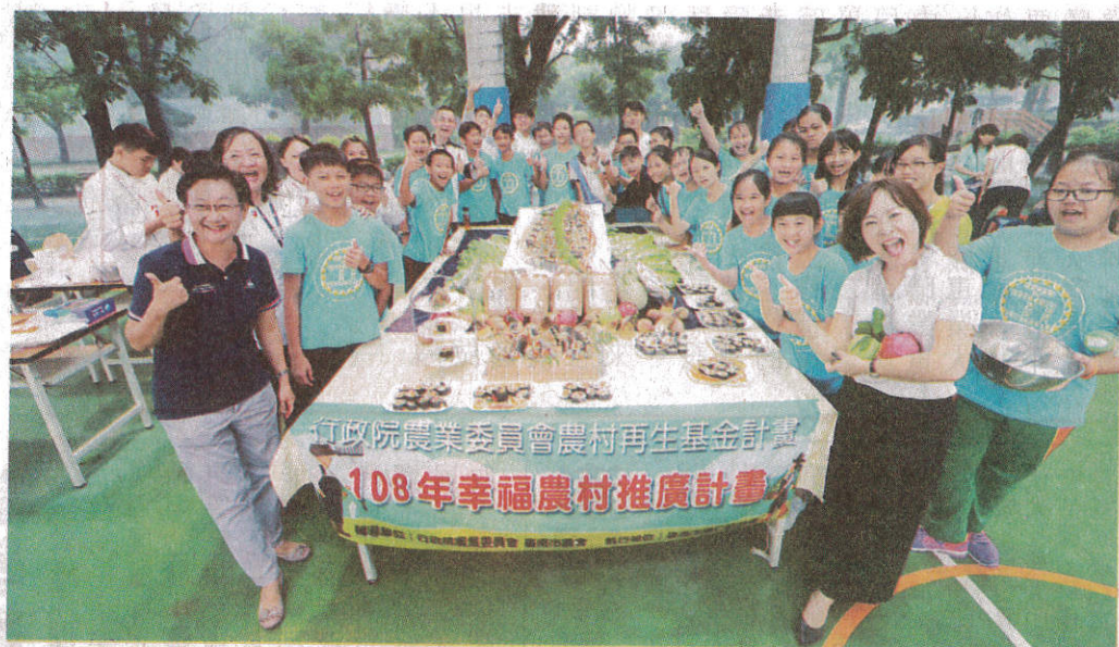
←嘉南藥理大學餐旅管理系與歸仁區農會家政班及當地農業志工合作，昨上午在紅瓦厝國小舉辦米食創意料理，協助畢業生製作飯團謝師。