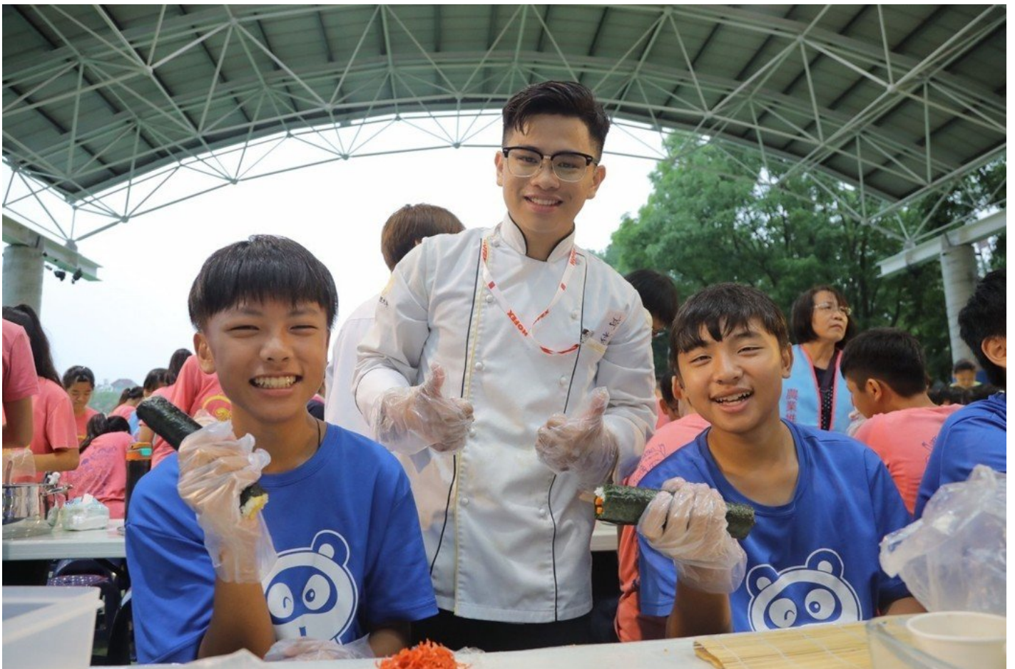
嘉藥餐旅系學生與紅瓦厝國小學童一同開心做料理。