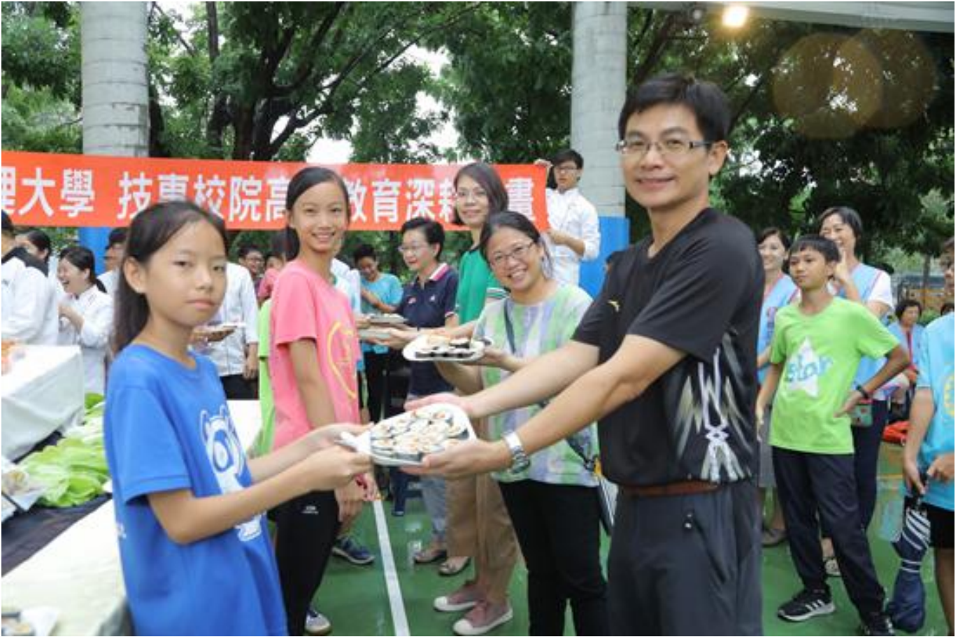
嘉藥×歸仁農會×紅瓦厝國小 共廚米樂飯糰謝師恩

(中央社訊息服務20190612 09:26:59)嘉南藥理大學餐旅管理系師生，與歸仁區農會家政班成員及當地農業志工合作，6月11日於紅瓦厝國小，舉辦「米食創意饗宴-米樂飯糰DIY」自主共廚料理活動。嘉藥大學生發揮專長和服務精神，協助並教導該國小畢業班學童使用在地食材，親手捏製飯糰犒賞老師辛勞，讓小朋友在畢業前夕，一圓答謝師恩的夢想。