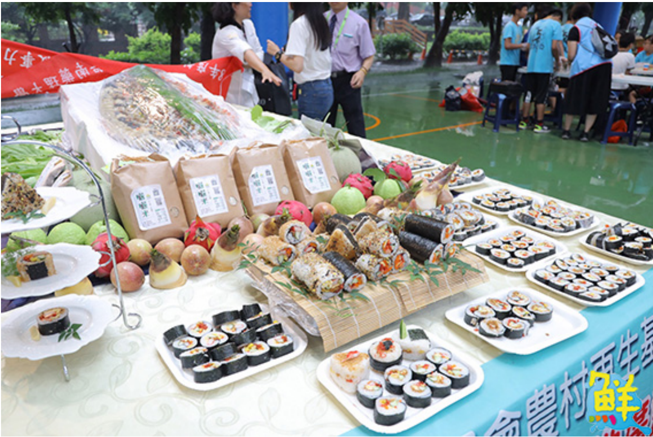
▲嘉藥餐旅系師生運用剛採收的秈米做成色香味俱全的飯糰佳餚。

紅瓦厝國小校長連久慧表示，畢業班自主共廚料理謝師恩活動，今年已邁入第三屆，每年應屆畢業學童都非常期待這場活動；感謝嘉藥及農會社區鼎力相助，不僅讓小朋友體認歸仁在地農業特色，同時也藉此向老師們表達6年來的教誨與恩情，活動意義非凡，場面溫馨感人。