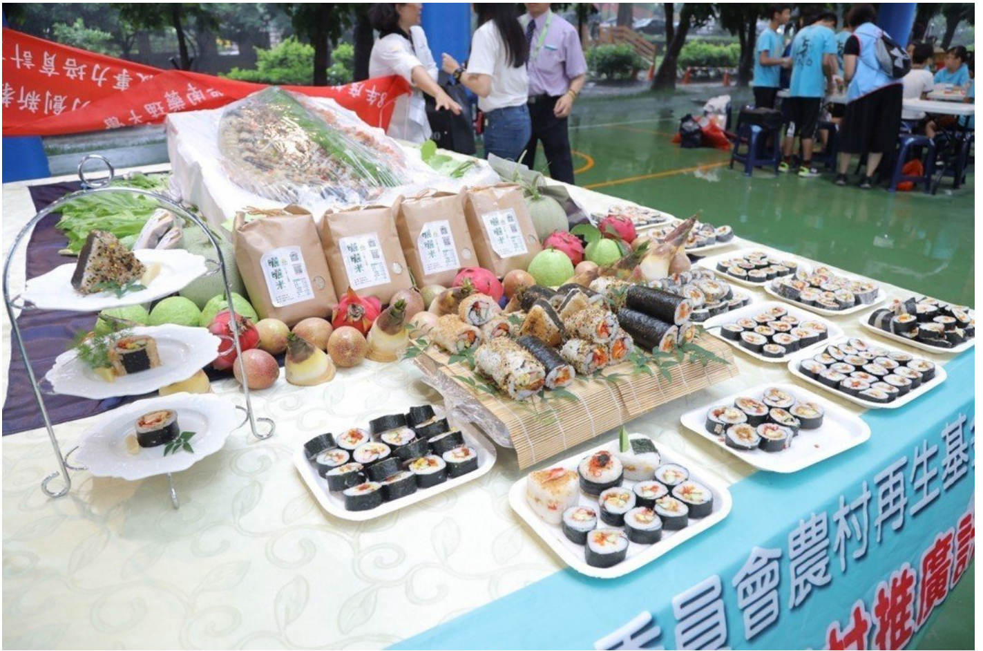
嘉藥餐旅系師生運用剛採收的秈米做成色香味俱全的飯糰佳餚。