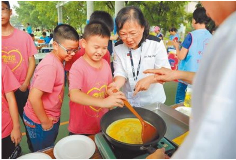
紅瓦厝國小應屆畢業生烹調謝師宴，在嘉南藥理大學餐旅管理系、歸仁區農會家政班協助下完成。