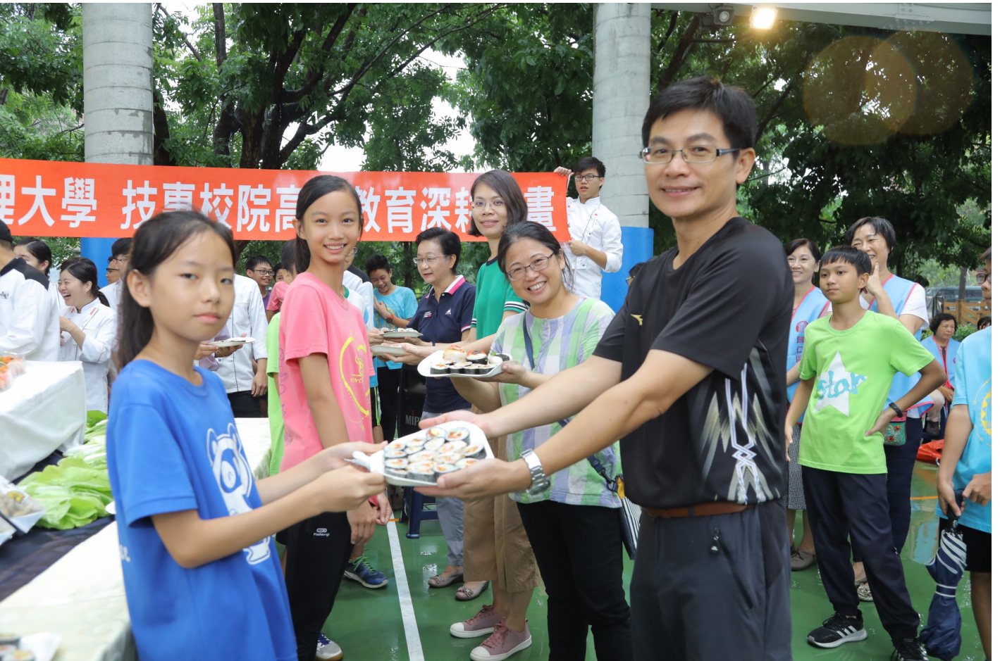
紅瓦厝國小學童親手捏製創意飯糰謝師恩

嘉藥民生學院院長王瑞顯說，活動結合歸仁區農會，希望大手牽小手，推廣食農教育，讓小學生認識在地食材，也能深入瞭解農耕與飲食文化，細細品嚐農民辛苦耕種米飯的滋味，具體感念農夫精神，珍惜大地賜予的恩澤，從「食」中瞭解「農」的珍貴，並從「農」中建立正確的飲食知識。