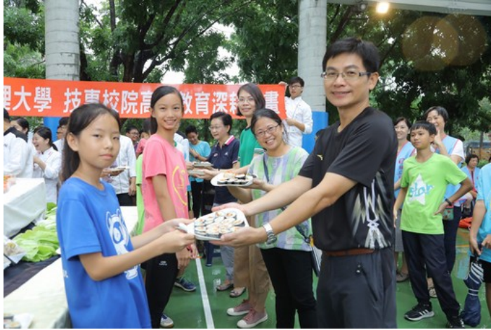
紅瓦厝國小學童親手捏製創意飯糰謝師恩