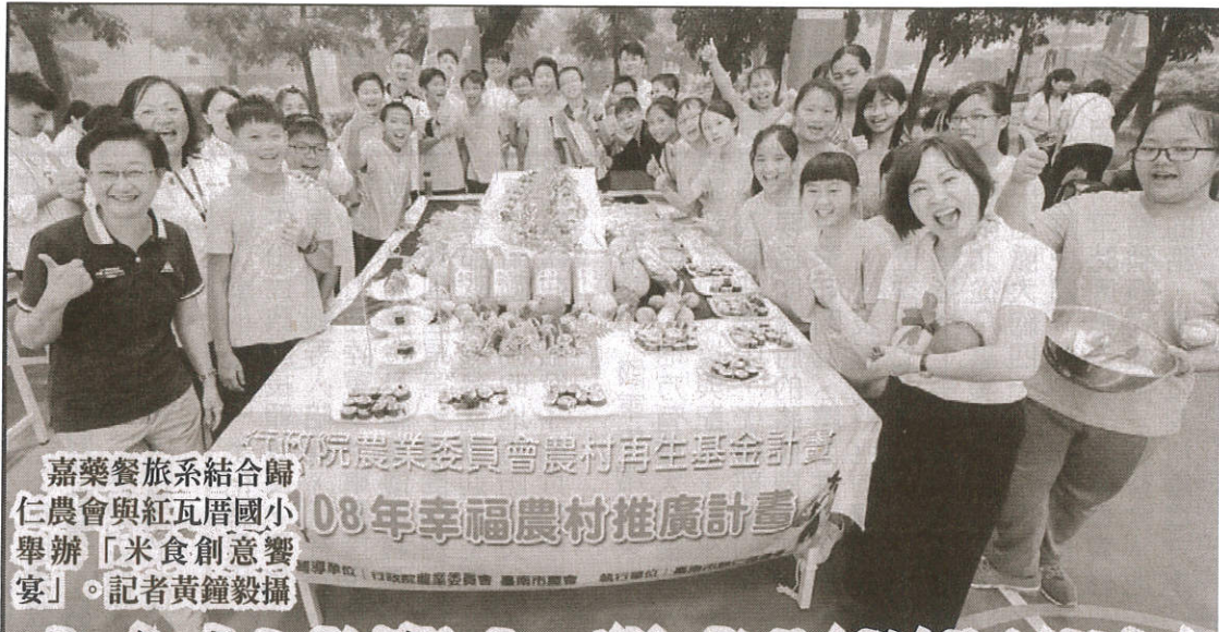
嘉藥餐旅系結合歸仁農會與紅瓦厝國小舉辦「米食創意饗宴」。