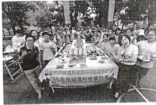
嘉藥餐旅系結合歸仁農會與紅瓦厝國小舉辦「米食創意饗宴」。

【記者孫宜秋／南市報導】嘉南藥理大學餐旅系師生，與歸仁區農會家政班成員及當地農業志工合作，於108年6月12日於紅瓦厝國小，舉辦「米食創意饗宴 米樂飯糰DIY」自主共廚料理活動。嘉藥大學學生發揮專長和服務精神，協助並教導該國小畢業班學童使用在地食材，親手捏製飯糰犒賞老師辛勞，讓小朋友在畢業前夕，一圓答謝師恩的夢想。