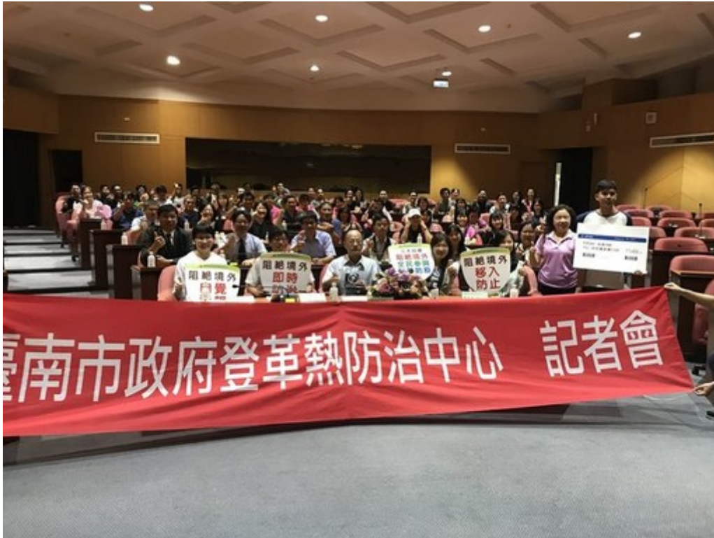
臺南市政府登革熱防治中心今於嘉南藥理大學辦理「返鄉探親 袋袋相隨」。