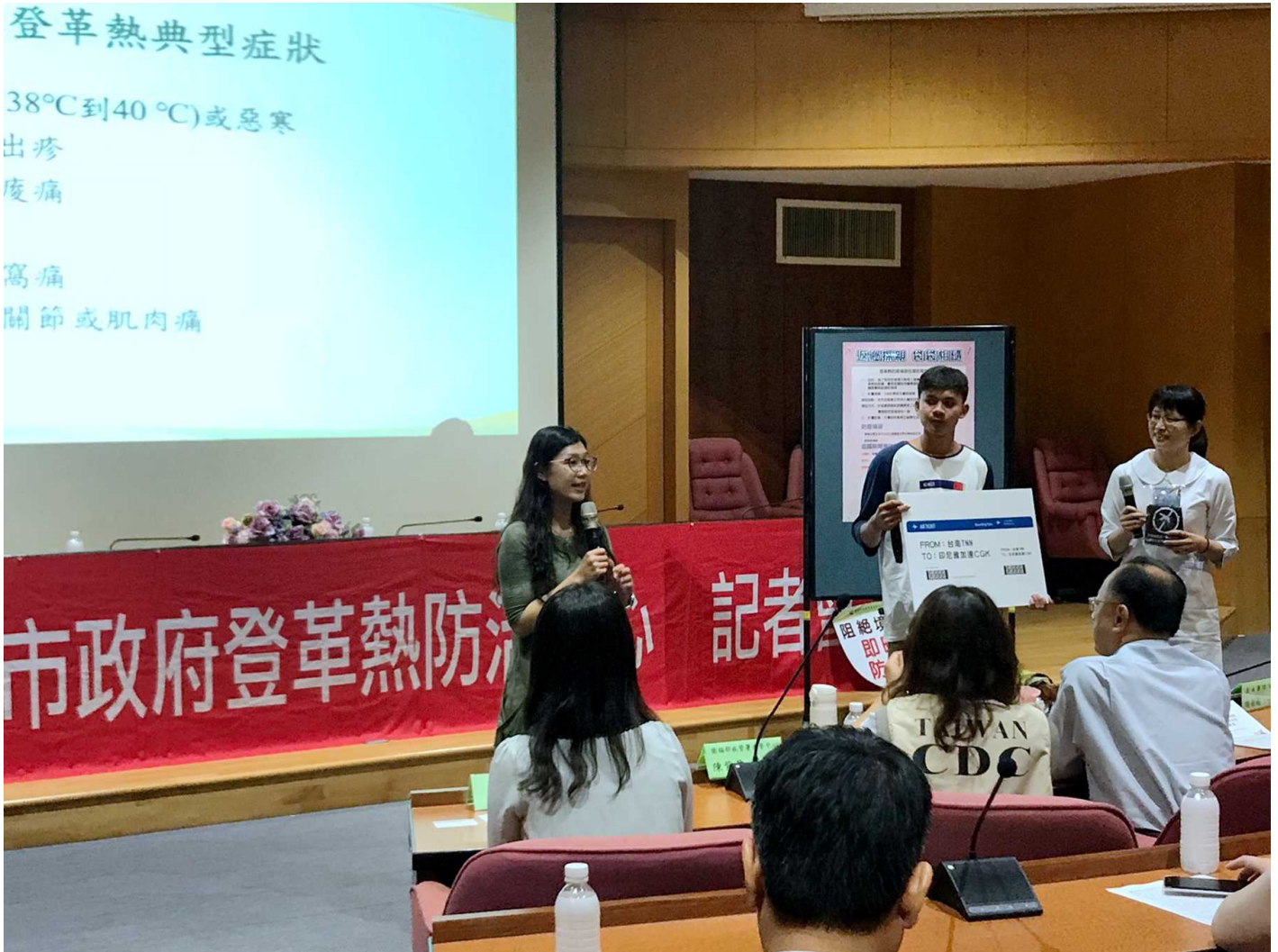
圖：嘉藥印尼籍學生演出防疫福袋包領取方式行動劇。