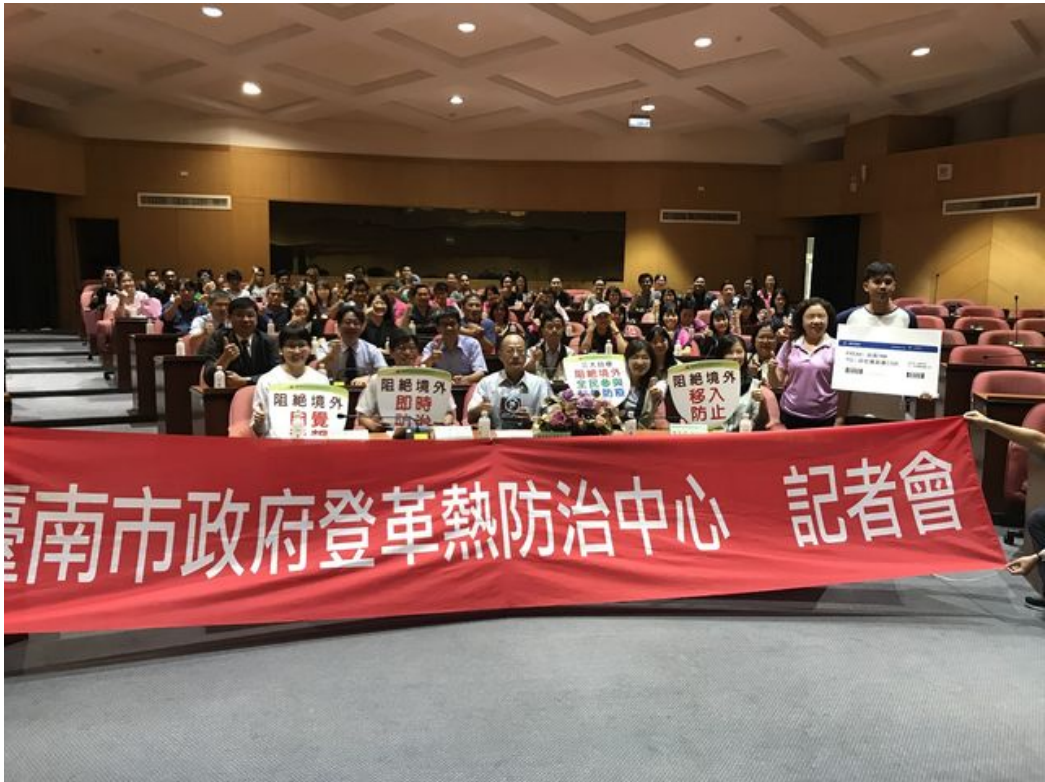
南市登革熱防治中心今於嘉南藥理大學辦理「返鄉探親 袋袋相隨」。

http://www.cntimes.info 2019-06-11 16:36:50