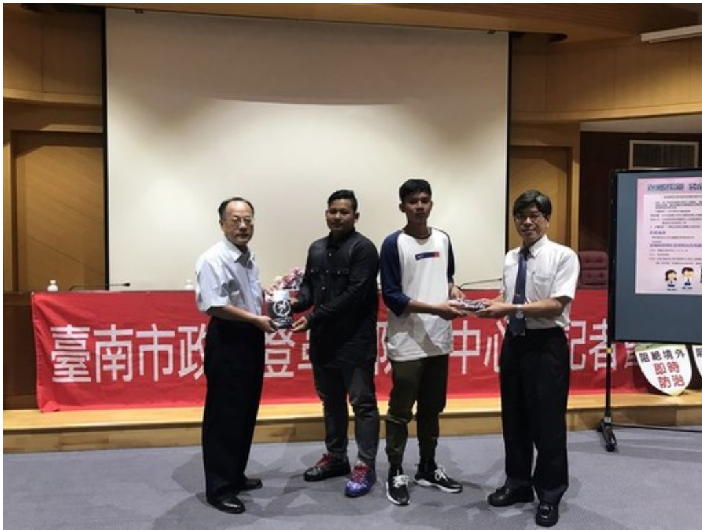
衛生局副局長黃文正及嘉南藥理大學杜副校長頒贈防疫福袋包給印尼籍學生。為加強東南亞、南亞國家外籍學生及新住民返鄉探親時，加強防蚊措施，臺南市政府登革熱防治中心於108年6月11