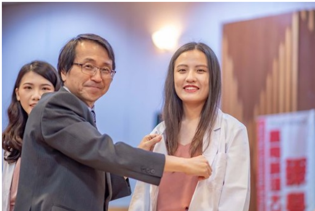
嘉藥校長陳鴻助為藥學系學生著藥師袍。