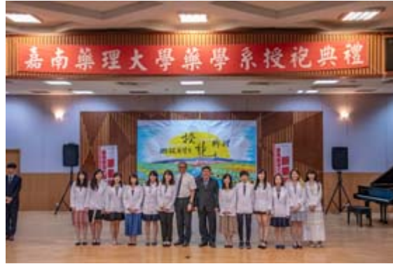
嘉藥藥學系舉行隆重的授袍典禮。

【記者孫宜秋／南市報導】台南的嘉南藥理大學素以藥師搖籃著稱，5月27日下午，校方為即將前往業界實習的藥學系生，舉行隆重的授袍典禮，226位大三學生在眾多家長和貴賓觀禮下，逐一上台接受師長穿上藥師袍並齊聲宣誓，自勉將以最高道德標準，恪遵藥事法規，善盡藥師社會責任。