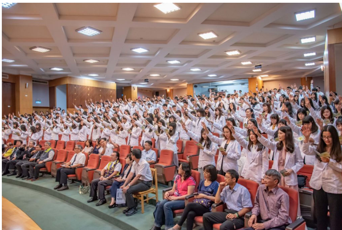
226位藥學系學生參加授袍典禮