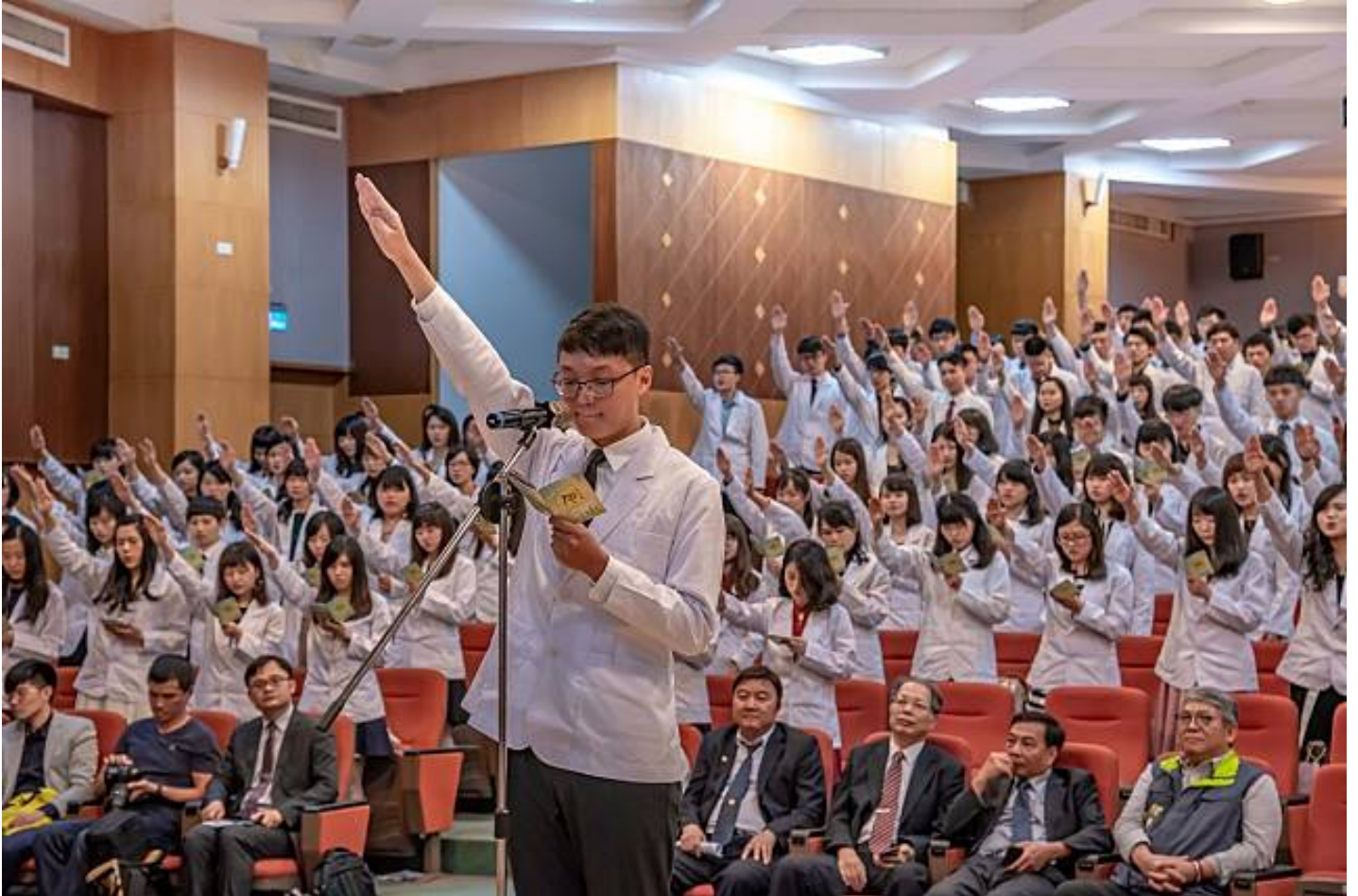
白袍加身 責任宣誓 嘉藥為226位藥學系生舉行授袍

嘉南藥理大學今夏為即將前往業界實習的226位大三藥學系生，舉行隆重的授袍典禮，現場除近百位家長觀禮外，各醫院藥劑部主任、藥師公會理事長，以及該校藥學系友會代表也蒞臨共襄盛舉，一起見證同學們人生最璀璨的美麗時刻。