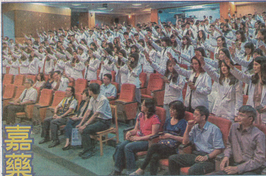
白袍宣言，責任加身，嘉藥藥學系生授袍典禮溫馨隆重。