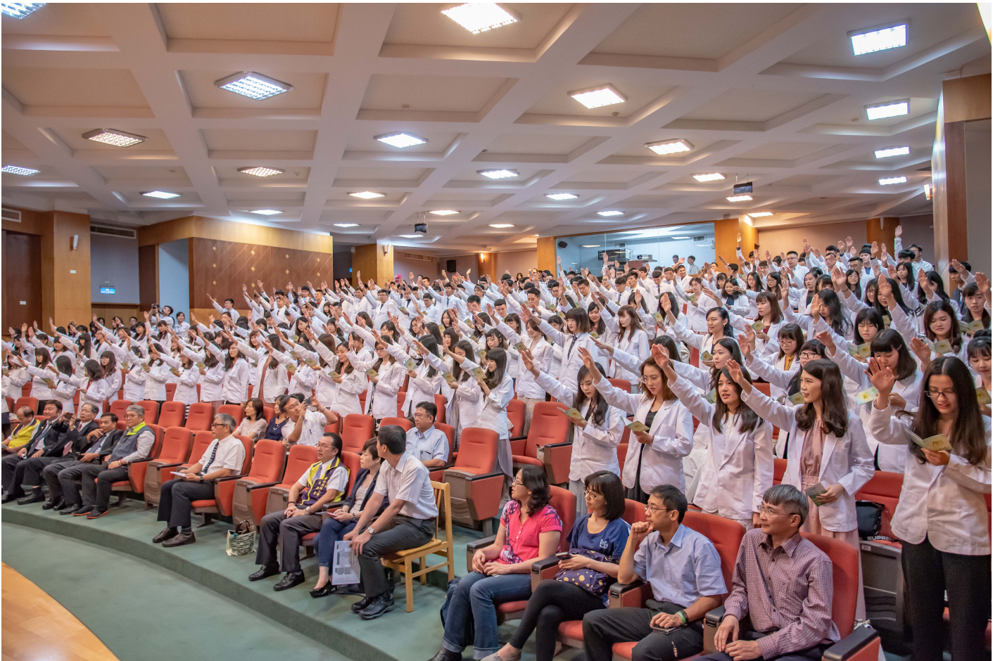
226位藥學系學生參加授袍典禮