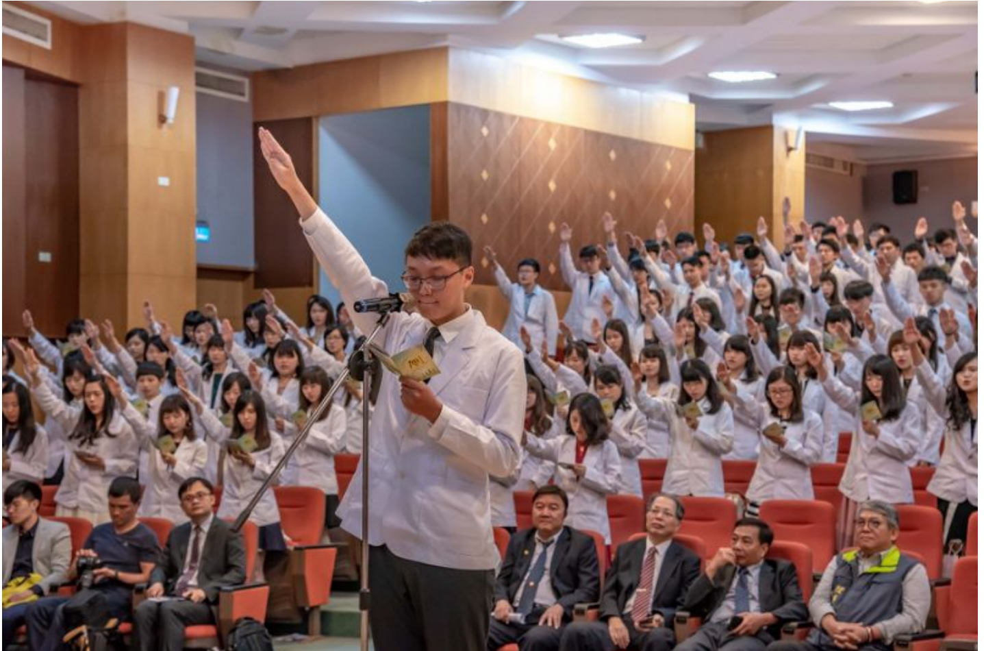
白袍加身 責任宣誓 嘉藥為226位藥學系生舉行授袍

嘉南藥理大學今夏為即將前往業界實習的226位大三藥學系生，舉行隆重的授袍典禮，現場除近百位家長觀禮外，各醫院藥劑部主任、藥師公會理事長，以及該校藥學系友會代表也蒞臨共襄盛舉，一起見證同學們人生最璀璨的美麗時刻。