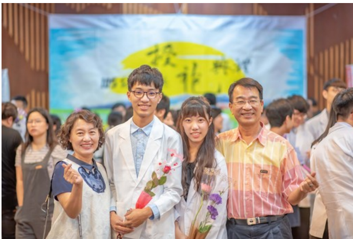
家長開心參加學生授袍典禮