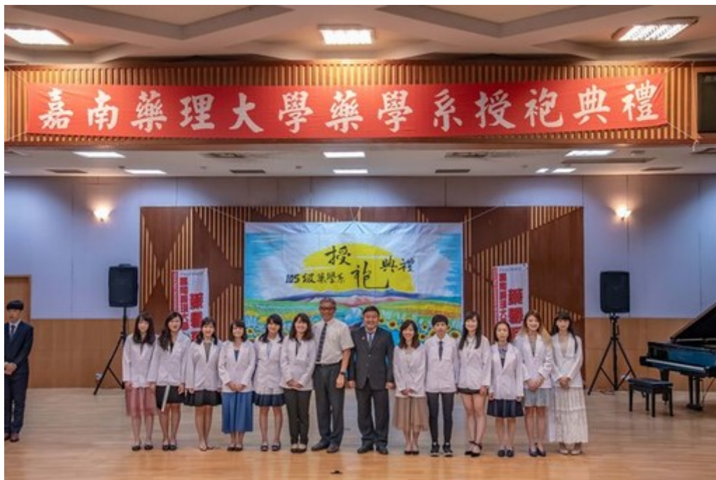
嘉藥藥學系舉行隆重的授袍典禮。