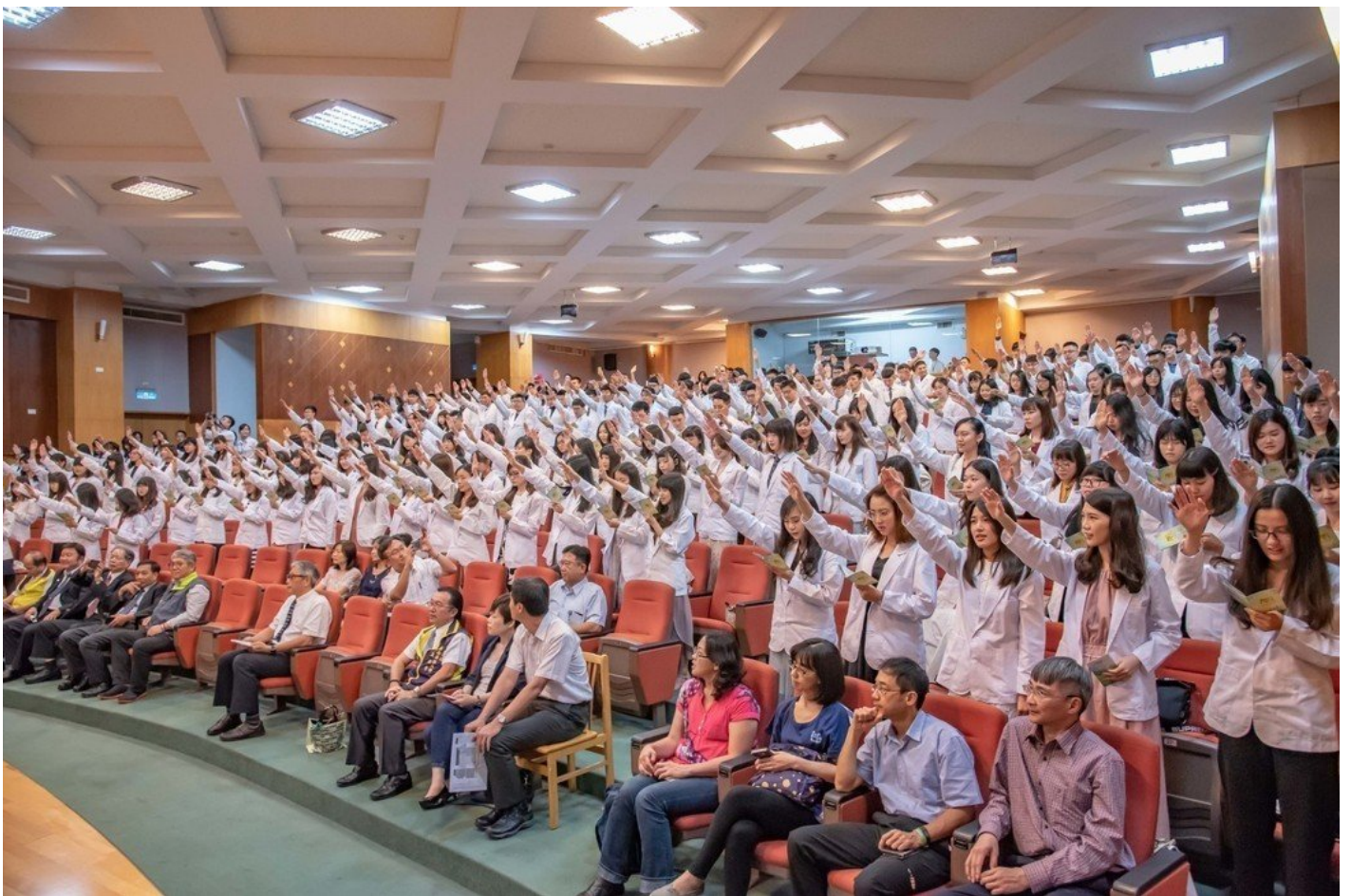
226位藥學系學生參加授袍典禮。