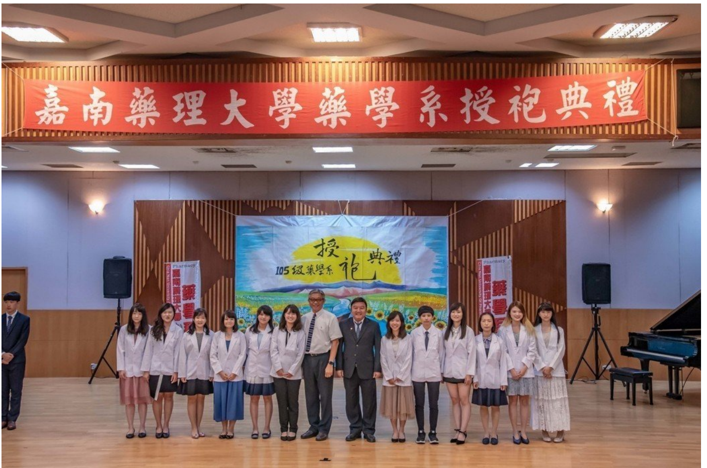
嘉藥藥學系舉行隆重的授袍典禮。