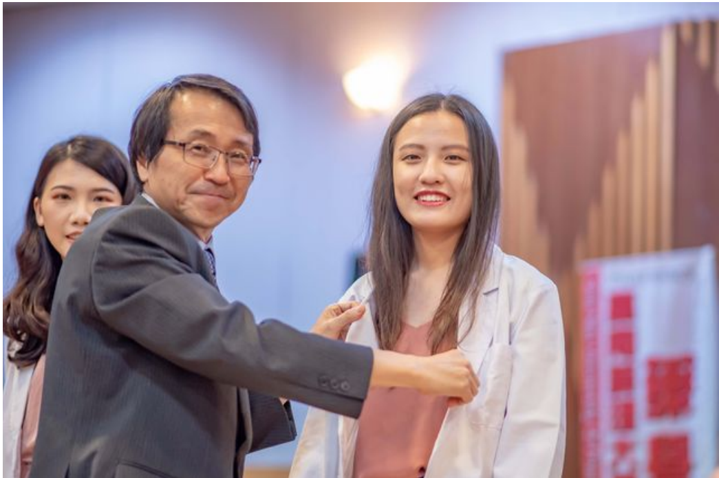
嘉藥校長陳鴻助為藥學系學生著藥師袍。

http://www.cntimes.info 2019-05-28 20:27:57