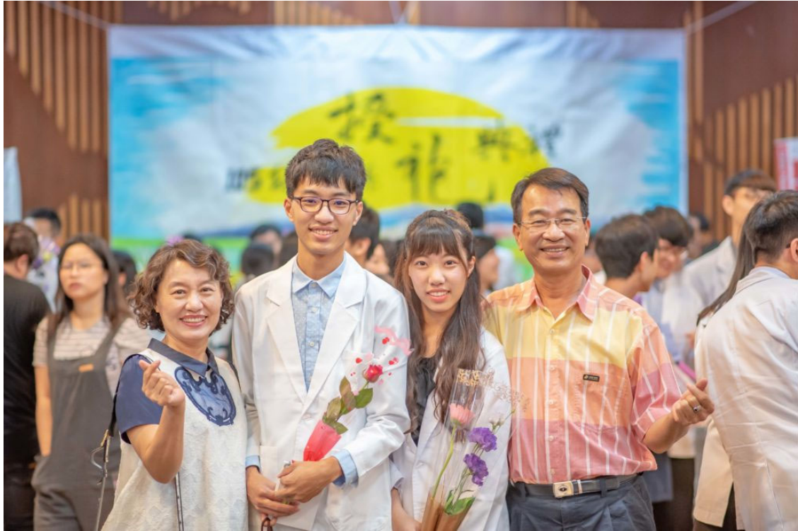
家長開心參加學生授袍典禮

校方表示，參加授袍都是大三準備升大四的學生，今年暑假將前往各醫院藥局接受總計640小時的校外實習；分兩階段實施的藥師專技高考自去年正式上路，這批實習生將於實習期間參加第一階段考試，緊接著在畢業後報考第二階段，通過後方能正式成為藥師，因此，授袍典禮意味著師長對未來成為藥師同學的殷切期盼，對藥學生而言，更是堅強挑戰與神聖使命的開端。