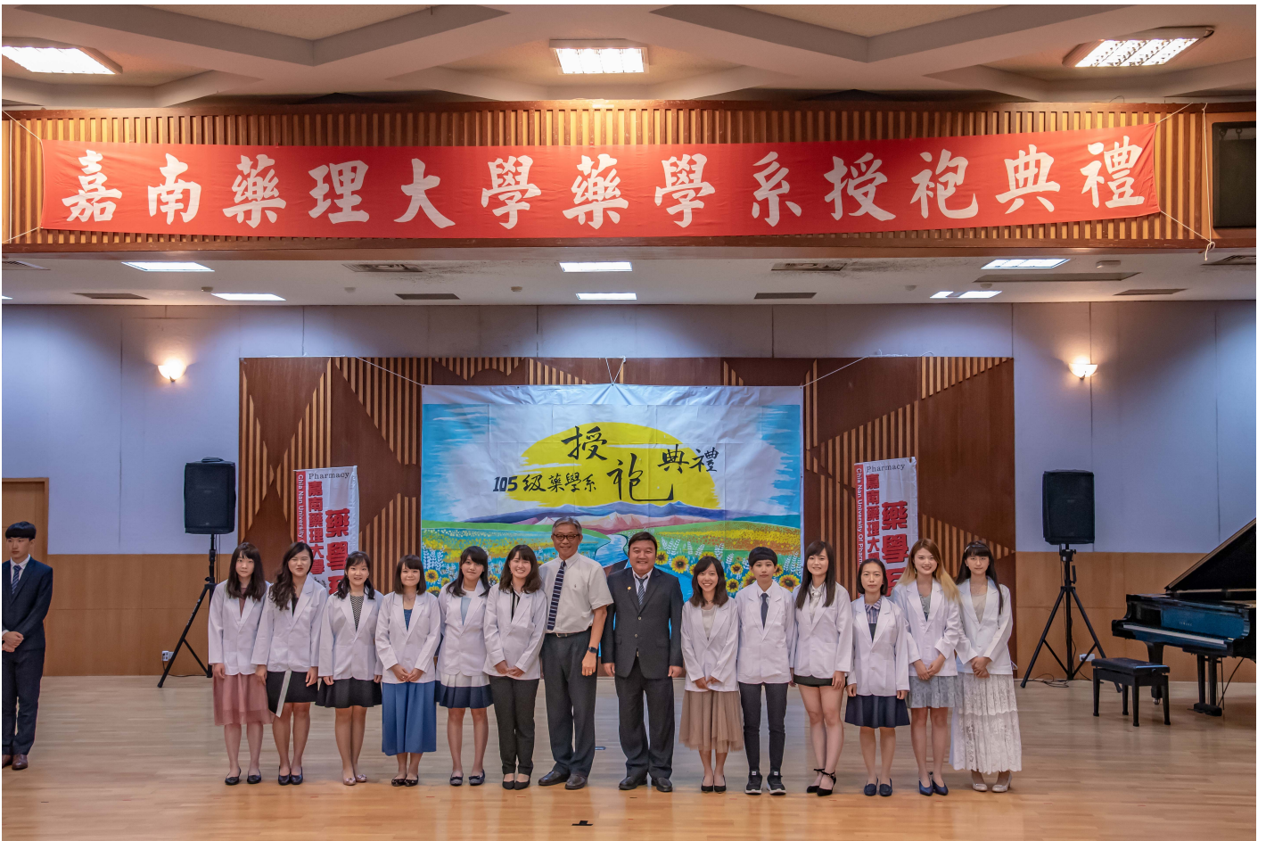
嘉藥藥學系舉行隆重的授袍典禮

台南的嘉南藥理大學素以藥師搖籃著稱，5月27日下午，校方為即將前往業界實習的藥學系生，舉行隆重的授袍典禮，226位大三學生在眾多家長和貴賓觀禮下，逐一上台接受師長穿上藥師袍並齊聲宣誓，自勉將以最高道德標準，恪遵藥事法規，善盡藥師社會責任。