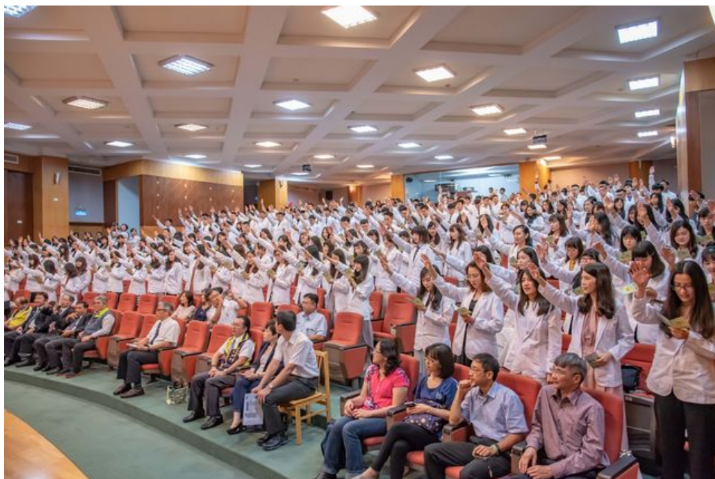
226位藥學系學生參加授袍典禮。