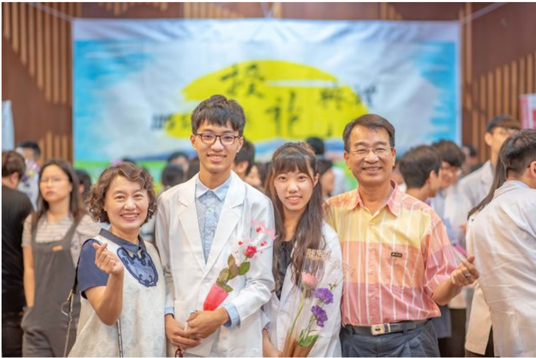
家長開心參加學生授袍典禮。

台南的嘉南藥理大學素以藥師搖籃著稱，5月27日下午，校方為即將前往業界實習的藥學系生，舉行隆重的授袍典禮，226位大三學生在眾多家長和貴賓觀禮下，逐一上台接受師長穿上藥師袍並齊聲宣誓，自勉將以最高道德標準，恪遵藥事法規，善盡藥師社會責任。